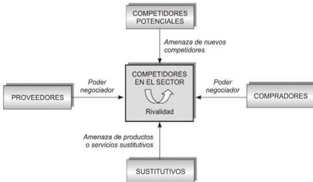
Figura 3. Las 5 fuerzas de Porter