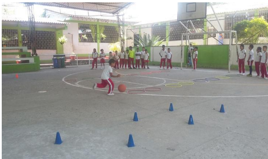
Figura 3. Movimientos en acción, con ritmo y coordinación Fuente: elaboración propia

Adicional a esto la disciplina, la constancia y el esfuerzo que juegan un papel importante en el desarrollo de un deporte, juego, competencia que se evidencia cuando los niños realizan con coordinación y ritmo coreografías de bailes y aeróbicos. (ver figura3)