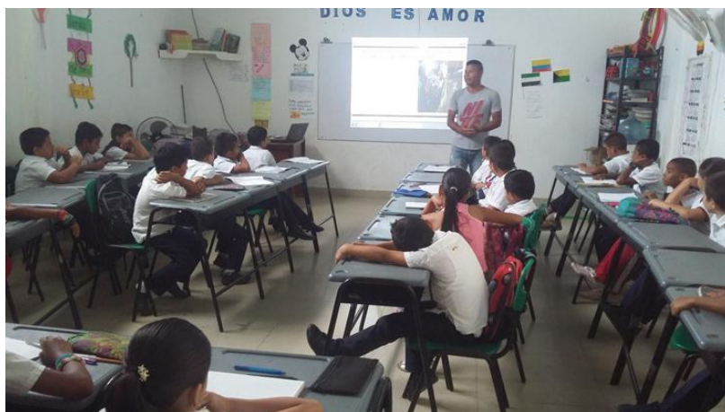
Figura 6. Charla pedagógica de un padre de familia con los estudiantes de grado cuarto

2011, parr. 2.), en esta actividad se le da mucha importancia al trabajo artesanal haciendo uso del material reciclable o artesanal como hoja de iraca, pepas, hojas, vasos, botellas y pitillos entre otros (ver figura6) como estrategia para compartir ideas y aprender y reforzar sus conocimientos. Con esto se logró que los niños elaboraran paso a paso las manillas y demás manualidades (ver figura 6), con el desarrollo de esta actividad, los niños y niñas desarrollaron el sentido del tacto, al palpar diferentes texturas de los materiales utilizados, la creatividad para diseñar y aptitud para realizar las manualidades.