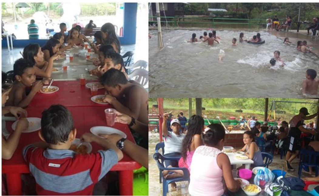
Figura 4. Salida pedagógica

Según Vygotsky "...el ser humano como ser social desde su nacimiento se apropia de los conocimientos, habilidades, costumbres y cualidades presentes en el medio social y familiar con el cual interactúa..." (Vygotsky, 1988, p. 234) citado por (Arias, 2012, parr. 6). Según lo anterior en la figura 4 se evidencia la integración de lo social y familiar realizando actividades que fortalecen la motricidad como lo es la natación, teniendo en cuenta que estas habilidades motrices también se desarrollan por la actividad práctica de los niños y niñas dentro del entorno donde interactúan y la natación "como una actividad que produce beneficios físicos y fortalecen los procesos de maduración motriz e intelectual". (Moreno & Gutiérrez, 1998 citado por: (Marín, 2016).