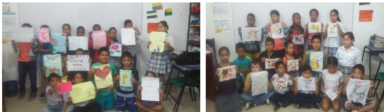
Figura 9. Exposición de tarjetas elaboradas por los niños - Exposición de bordados

Esta fase fue importante aquí se pudo integrar a los padres de familia, estudiantes y comunidad educativa para que puedan evaluar el resultado del proceso y para ello se programa una exposición de trabajos tanto de manualidades como de bordado (ver figura 8).