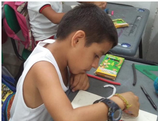
Figura 5. Describo mi experiencia

Además para evaluar el conocimiento adquirido los estudiantes realizaron un texto escrito donde se plasma el conocimiento y experiencia adquirida durante la actividad (ver figura 5), esta actividad es importante porque se integra la familia en torno a la educación, contribuyendo así al proceso de aprendizaje.