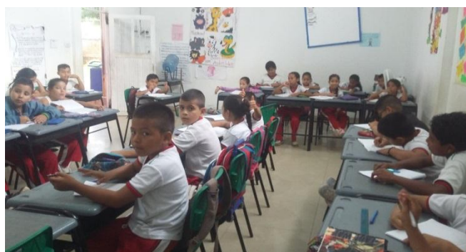
Figura 11. Dictado, Observación caligrafía y disgrafía.

En esta fase se hace un diagnóstico para observar las habilidades motoras de los niños (ver figura 10) a través de un dictado y otra sesión de actividades artísticas