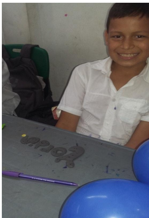
Figura 8. Trabajo con mis manos: Modelado en plastilina y arena

realizando tal acción (persistencia de la conducta) y en el esfuerzo dedicado a la misma” (De Caso Fuertes & García-Sánchez, 2006, p. 2).