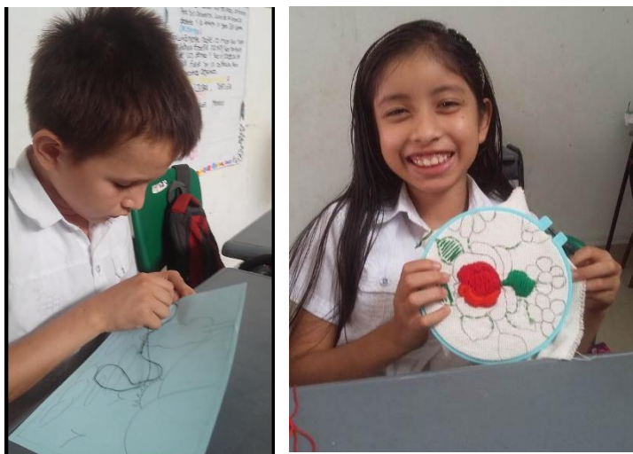
Figura 7. Experiencias de escritura sobre tela y bordado

Para esta fase se desarrollaron dos actividades: la primera se denomina con puntadas formo mi nombre . Esta actividad se realiza porque, con el bordado “se aprende, generar los espacios de diálogo de saberes y los lleva adquirir destrezas en sus manos, con los materiales implicados en el bordar, asumen el rol de aprendices y adquieren experiencia” (Pérez-Bustos & Márquez Gutiérrez, 2012), con esta actividad (ver figura 7) los estudiantes tuvieron la oportunidad de desarrollar experiencias de escritura sobre tela y bordado como una estrategia para el fortalecimiento de la motricidad fina. Además se motivaron a realizar la actividad porque usaron su creatividad para escribir y decorar su nombre en la tela.