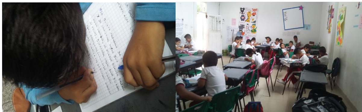
Figura 1. Estudiantes escribiendo las anécdotas y experiencias de la salida pedagógica

Además, se realizó un diagnóstico a través de jornadas pedagógicas en cada una de las áreas académicas, aplicando dictados, transcripción de textos, creación de cuentos, construcción de párrafos, narraciones escritas, descripciones de lugares, personajes, plantas, animales, ríos y de los lugares turísticos del municipio de Orito (figura 1.);