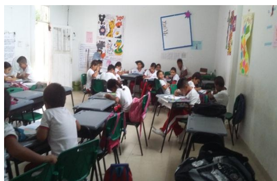
Trabajos artísticos, plastilina y dibujo

En la figura 10 corresponde al diagnóstico, donde a través de la realización de un dictado y actividades como trabajo en plastilina y dibujo se trata de observar como los niños escriben: rapidez en la escritura, modo de agarrar los lápices y lapiceros, dirección de escritura; actividad que dio como resultado que los estudiantes de cuarto grado presentan dificultad en: no poder sostener un lápiz, utilizar la ruta directa, visual o lexical que es lo que no les permite organizar las letras en una línea o en línea recta, su escritura es desordenada, se cansaban al escribir esto lo manifestaron dos niños cuando afirmaron “profe ya vamos a terminar porque ya me duele la mano”; también presentan disgrafía motriz, otros mostraron lentitud al momento de escribir ya que al finalizar el dictado tres de los estudiantes no habían copiado todo el dictado manifestando