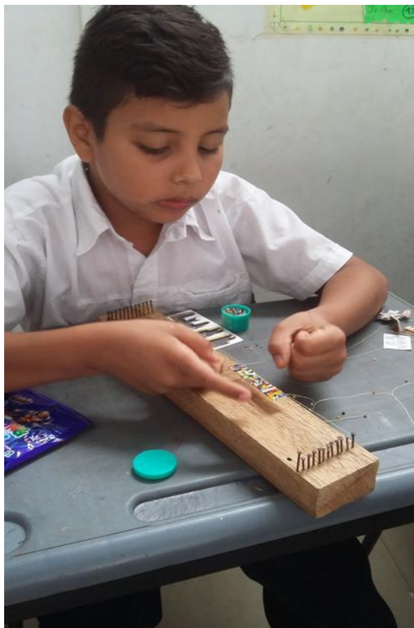
Figura 2. Manualidades – tejido de manillas

emotivas fue el tejer manillas en chaquiras, que despertaron intereses individuales y colectivos. (figura2).