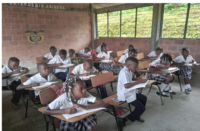
Figura 2. Estudiantes del grado 5° de primaria

El grado 5to de primaria, es el contexto específico de aplicación investigativa, conformado por una totalidad de 16 estudiantes quienes, comúnmente se encuentra en extra-edad; es decir, son niños y niñas entre los 12 y 15 de edad, sin embargo, cotudamente acuden a su proceso académico con la finalidad de continuar sus estudios regúlales.