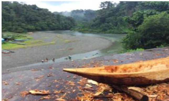
Figura 5. Formas productivas

Otra de las formas expresas en la creación y mantenimiento de la cultura poblacional, han sido las actividades productivas, favorecedoras de la subsistencia del territorio. Desde ese punto de vista, es preciso recalcar que, de acuerdo con las observaciones realizadas, pero también con conversaciones establecidas con líderes del territorio, la comunidad de Junta ancestralmente se ha mantenido bajo la modalidad del pan coger; es decir, aprovechando los recursos alimenticios de la agricultura, pesca y caza, necesarios para su sostenimiento familiar. “Nosotros como comunidad, no vemos la naturaleza como recurso explotable, heee, sino, heee, como medios para poder permanecer” (Entrevista a líder comunitario No. 1. 2021). Lo que dice el actor comunitario entrevistado, corresponde a la dinámica relacional entre el sujeto y el territorio. Para estas poblaciones, según indica el líder social, la naturaleza es proporcionadora de los elementos esenciales para la vida como también, para el mantenimiento territorial.