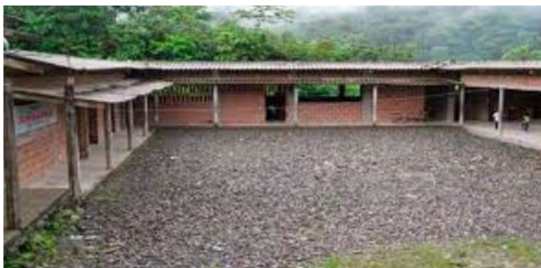
Figura 1. I. E. Ester Etelvina Aramburo