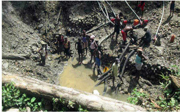
Figura 6. Minería Aurífera artesanal