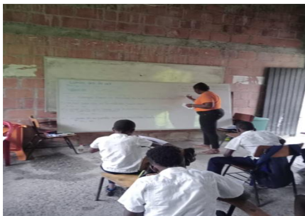
Figura 11. Contexto escolar

El plan pedagógico se llevará a cabo con estudiantes del grado 5° de primaria, de la Institución Educativa Ester Etelvina Aramburo, sede Mercedes Abregon, situada en la vereda Juntas, perteneciente a la cuenca del río Yurumanguí. Se trata de una población afrodescendiente, conformada por familias que ancestralmente, han compartido el territorio, forjando y manteniendo significativos lazos comunitarios.