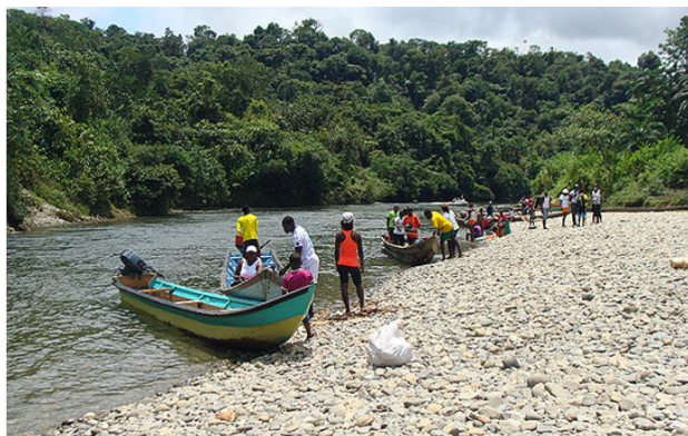
Figura 4. Relaciones mediadas por el río