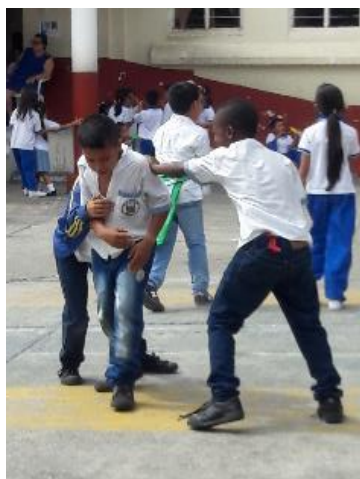
Situaciones de maltrato en los descansos