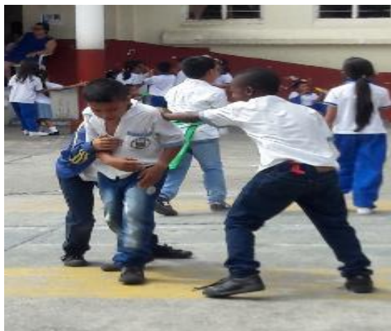
Fotografía 2 Agresiones físicas