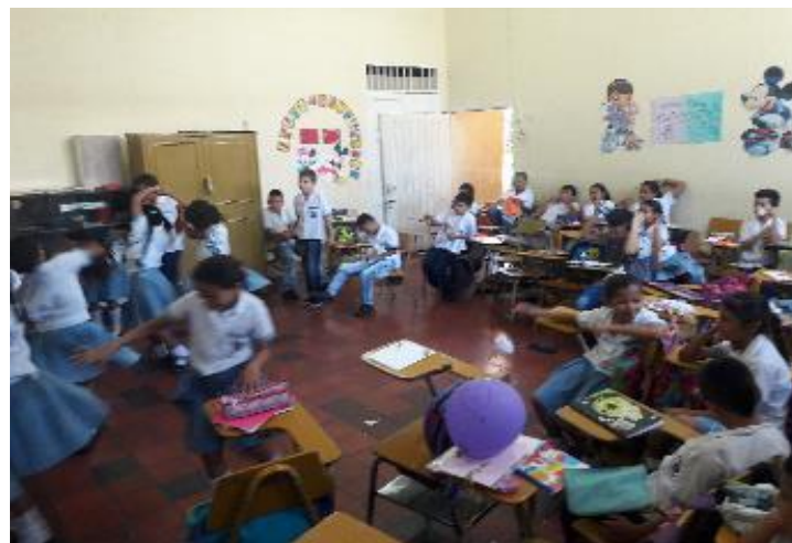
Fotografía 1 Convivencia disfuncional