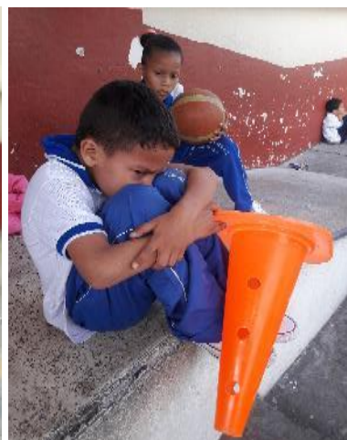
tristeza por Agresiones Verbales