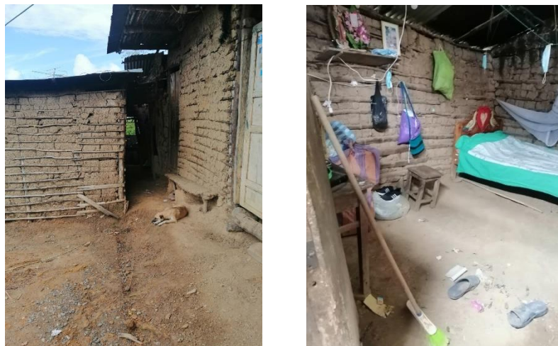
Imagen 1. Hogar de habitación de uno de los niños

En estas actividades, se pudo observar que la motricidad de algunos de ellos era muy reducida, debido al espacio donde viven, tal como lo muestra la Imagen 1, donde el suelo desigual no es apto para ellos, obligándolos a quedarse más tiempo quietos; en otros se observó que debido a sus propias condiciones, tenían movimientos lentos, bruscos, imperfectos.