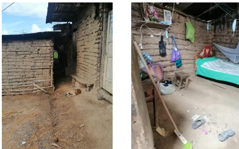
Image 1. Home of one of the children's bedrooms

In these activities, it was observed that the motor skills of some of them were very reduced, due to the space where they live, as shown in Image 1, where the uneven floor is not suitable for them, forcing them to stay still longer; in others it was observed that due to their own conditions, they had slow, abrupt, imperfect movements.