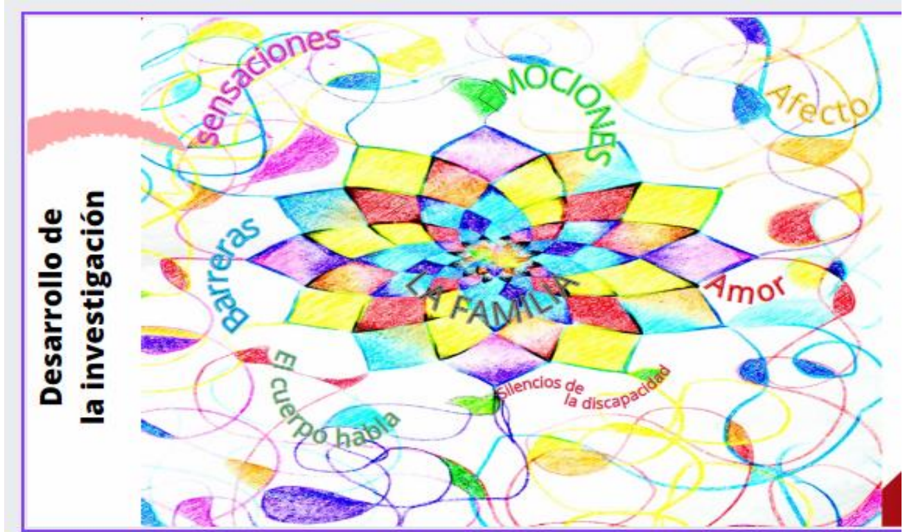
Imagen de pre - Estructura