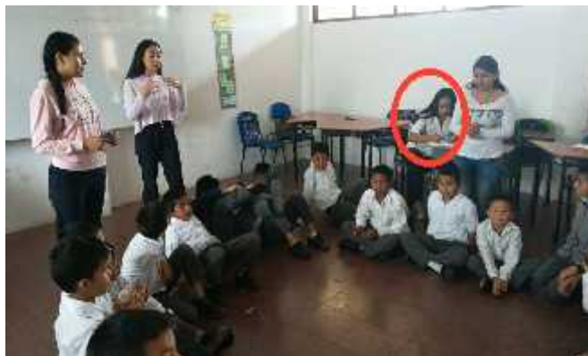
Imagen 4. Observadora pasiva tomando registro de lo observado en práctica presencial. Autoría propia (2019)