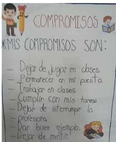
Imagen 9. Fotografía sobre la cartelera de Ronald sobre los pactos que refleja la disculpa por no cumplir los acuerdos: Autoría estudiante (2019)

individuo, contribuye con una intención social en donde la identificación de su individualidad y de lo colectivo, genere el fortalecimiento de la diversidad cultural, la innovación, la creatividad y la curiosidad, así como también aportar autoconfianza, respeto y tolerancia, aspectos tan urgentes hoy en nuestras aulas y en la sociedad.