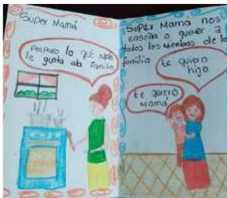
Imagen 11. Fotografía fanzine de estudiante.

También, en nuestra búsqueda por proseguir nuestro trabajo en la virtualidad, destacamos como los procesos expresivos en relación al otro, se evidenciaron en los fanzines que los niños y las niñas nos entregaron, porque en la realización, los estudiantes introducen su cotidianidad y sus relaciones con el entorno, lo que admiran de sus hogares y lo que más le gusta, esto nos propone al juego teatral como una herramienta de fortalecimiento de los procesos expresivos tanto individuales como colectivos.