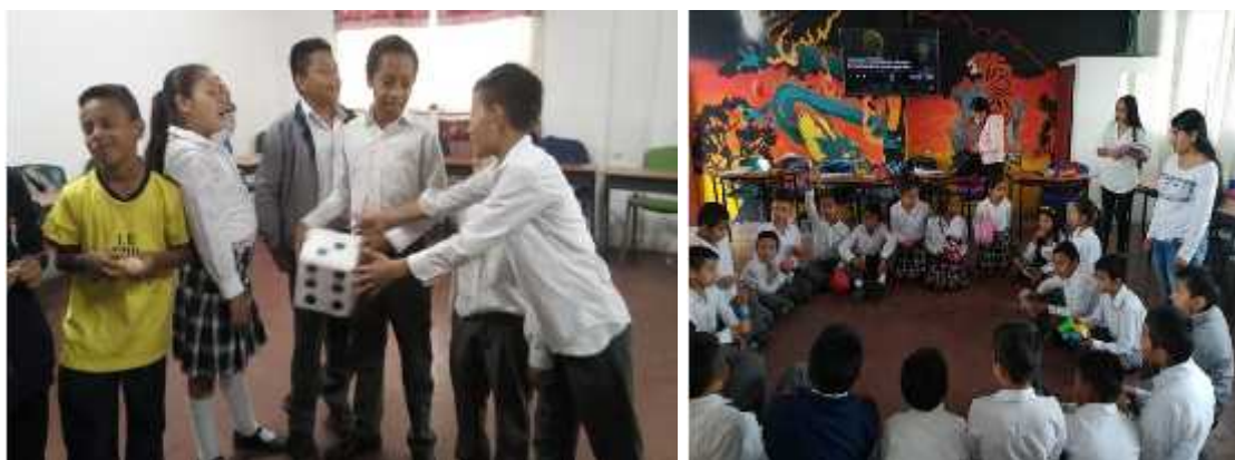
Imagen 17. Evidencias fotográficas de la actividad tres.

Conectando lo anterior con la práctica que se vivenció, queremos expresar la conciencia de movimiento no solo de su propio cuerpo sino del de su compañero, además una conciencia del espacio, uno de los aspectos más importantes para tener en cuenta en el desarrollo de la teatralidad en el aula. Consideramos que el juego proyectado es una manera en que el estudiante puede desempeñar los juegos de rol además de eso la acción dramática, ya que este cumple con aspectos fundamentales como la expresión corporal, oral, la conciencia del otro y de sí mismo.