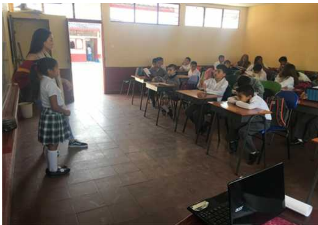
Imagen 2. Imagen de los estudiantes y la docente en formación durante la práctica presencial en la Institución educativa Los Comuneros (2019)

En la práctica es fundamental descubrir cómo las relaciones interpersonales se fortalecen por los procesos expresivos que conlleva aprender estos conceptos fundamentales del teatro y a su vez como hemos acomodado El Manual de Pedagogía Teatral, a las necesidades de nuestra PPI de cómo por medio de la toma de conciencia de estos mecanismos reforzamos el respeto grupal, la convivencia y la integración social con nuevos espacios de diálogo mediante el arte dramático.