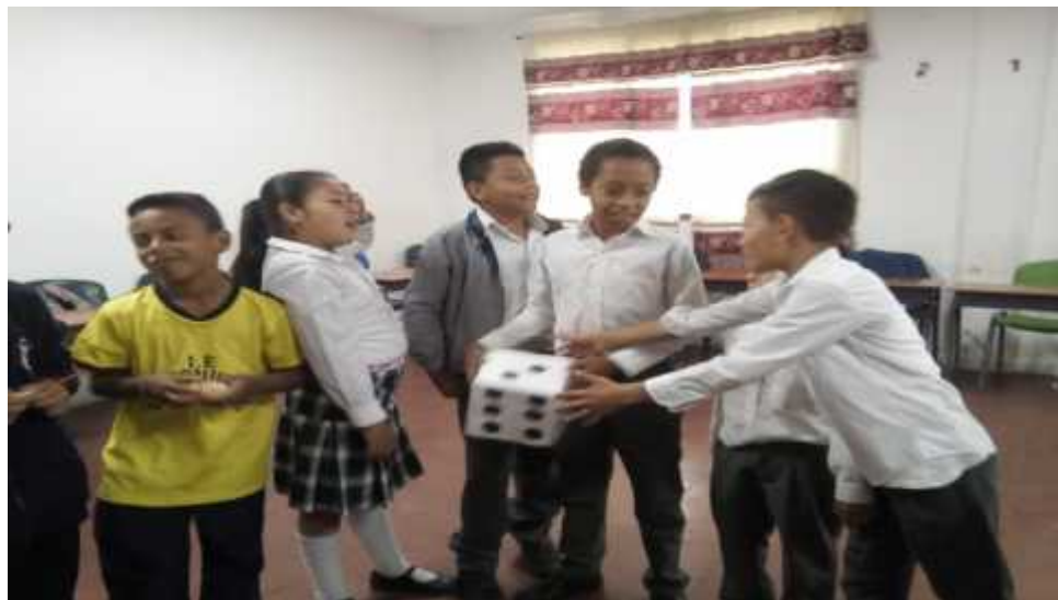
Imagen 3. Práctica presencial.