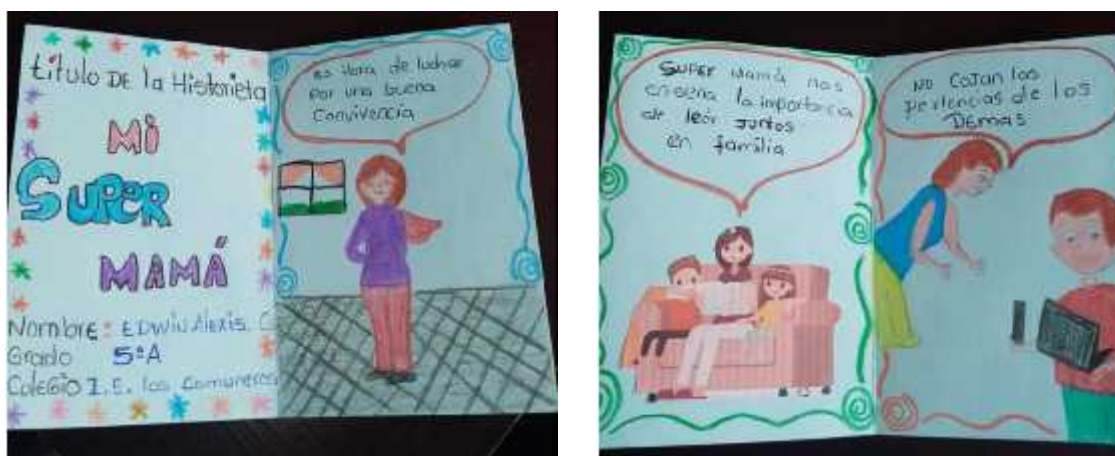
Imagen 14. Evidencia fotográfica que conlleva al estudiante a ver a su madre dentro de su cotidianidad como un personaje que da un buen ejemplo en su hogar. Autoría estudiante (2020)

García (1996), nos dice que uno de los aspectos más importantes que abarca la teatralidad es poder expresar nuestras emociones. Según los hallazgos encontrados la teatralidad emerge en los procesos expresivos ya que este ayuda al alumno a tener una mejor relación con el otro, así mismo le da una transformación a lo cotidiano, rescatamos lo que la autora nos dice ya que en un principio encontramos dificultad en los niños y las niñas la hora de expresarse, mediante actividades teatrales lograron tener una mejora y gracias a esto era mucho más fácil desenvolverse y mostrar sus sentimientos frente a los demás compañeros. A continuación presentaremos una evidencia fotográfica que refleja ese proceso reflexivo y esa realización experiencial de la mimesis teatral.