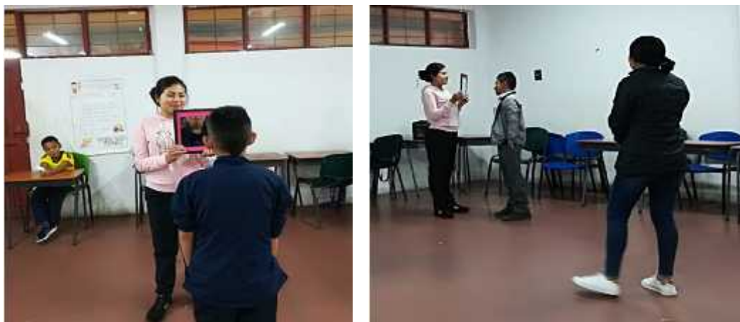
Imagen 16. Fotografía donde se evidencia la participación de los estudiantes en el ejercicio.

en el uso y la práctica de las relaciones sociales, y desarrollen estrategias de comunicación con los demás.