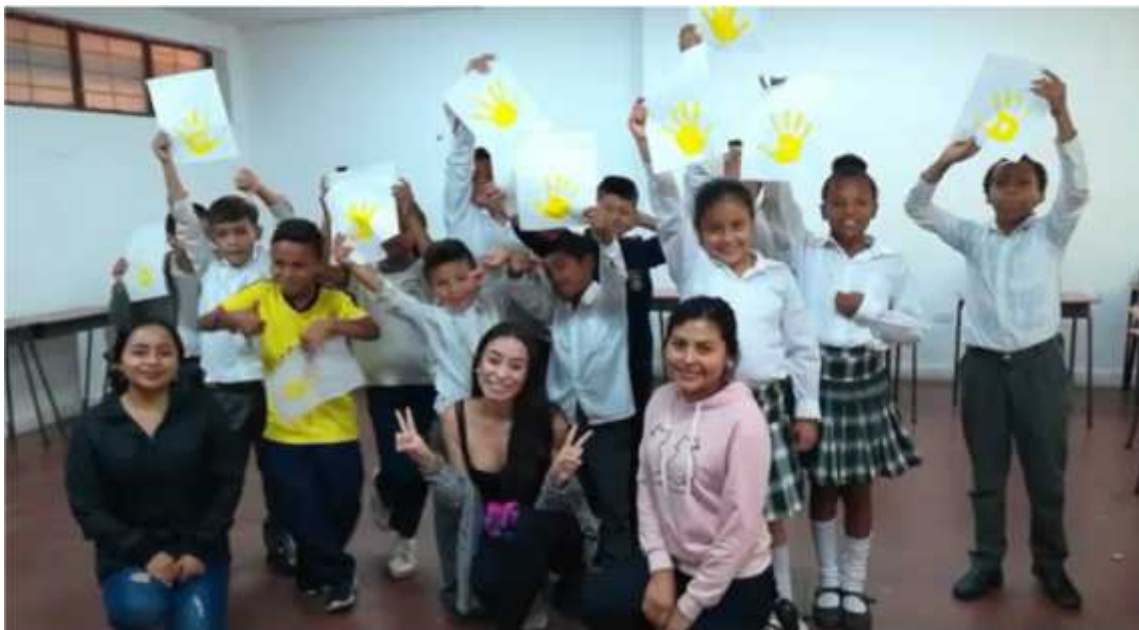
Imagen 10. Fotografía de la actividad pintando mis emociones.

También, en nuestra búsqueda por proseguir nuestro trabajo en la virtualidad, destacamos como los procesos expresivos en relación al otro, se evidenciaron en los fanzines que los niños y las niñas nos entregaron, porque en la realización, los estudiantes introducen su cotidianidad y sus relaciones con el entorno, lo que admiran de sus hogares y lo que más le gusta, esto nos propone al juego teatral como una herramienta de fortalecimiento de los procesos expresivos tanto individuales como colectivos.