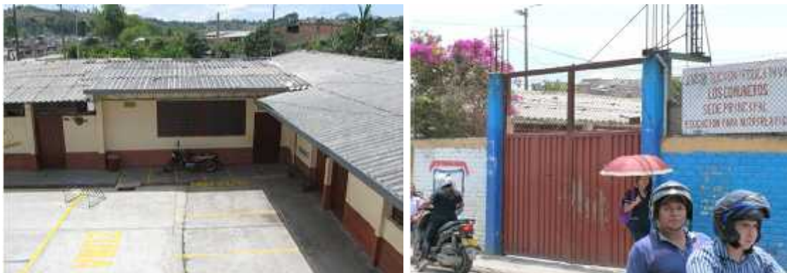
Imagen 1. Imágenes de la Institución educativa Los Comuneros, del barrio Comuneros de la ciudad de Popayán, Copyright, Google imágenes.

https://masalladelaciudadblanca.wordpress.com/category/comuneros/ (2010)