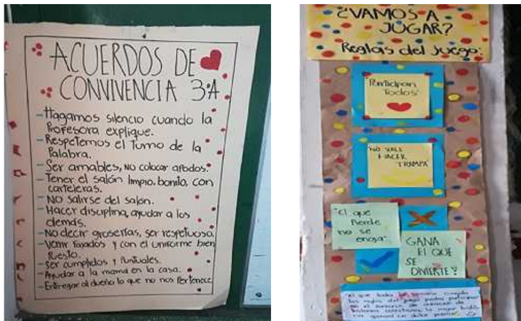
Imagen 7. Fotografía sobre los acuerdos de convivencia pactados en el aula que surgieron de las reglas de los juegos.

y docentes vieron la necesidad de tener unas reglas que nos permitieran relacionarnos desde la expresión teatral 2 .(p.7)