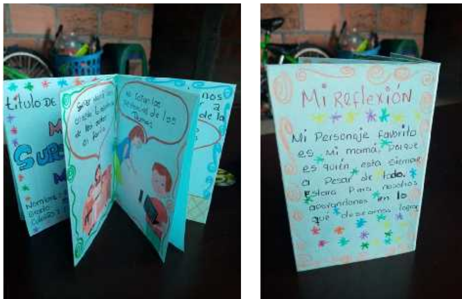
Imagen 13. Fotografía del fanzine que evidencia la realización del fanzine por parte de los niños por medios de las experiencias en sus hogares: Autoría estudiante (2020)

Con respecto a lo mencionado anteriormente, queremos hacer énfasis en que el espacio donde participa un sujeto no siempre es el mismo, es por eso que la manera como nos relacionamos, permite crear nuevas formas de integración social, desde el campo educativo hasta la cercanía con el hogar, es decir la familia, llevándonos a la necesidad de cambiar los patrones expresivos a los que estamos acostumbrados, para realizar cambios de roles en la diferenciación de situaciones que nos permiten fortalecer nuestra confianza, sensibilidad y la apropiación de la acción a imitar y jugar con nuevas formas de acercamiento donde podamos representar en diversos contextos y con diferentes personas. Continuamos con el aporte acerca del fanzine por parte de la profesora encargada del grado tercero, quien menciona que