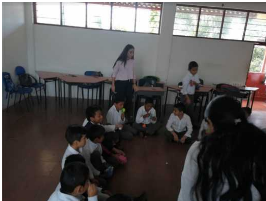
Imagen 5. Registro fotográfico de práctica presencial.

social, puesto que la imagen hace parte de un dato que refleja aspectos habituales y poco visibles que se pueden dar en la observación.