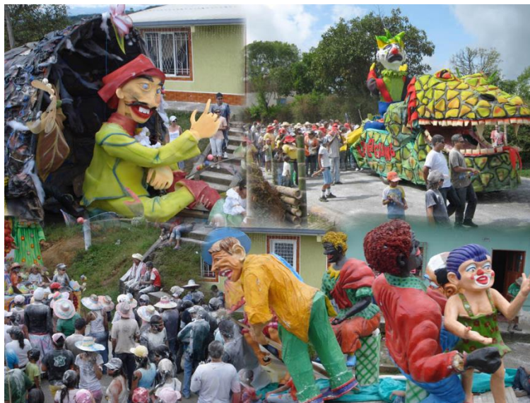
Imagen 20. Jugando en el carnaval