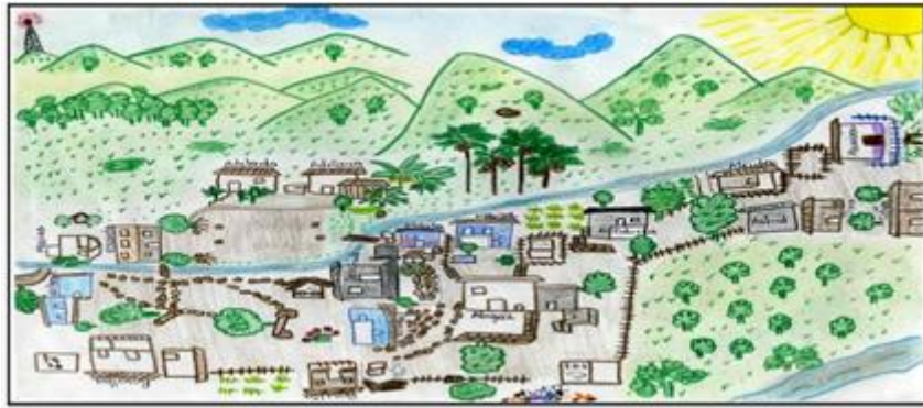
Imagen 13. Cartografía.