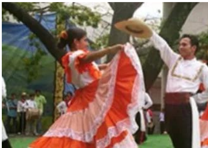
Imagen 10.

En el municipio se baila el bambuco patiano, con su ritmo, pero con adaptaciones propias del municipio. A continuación, información del bambuco patiano según el SINIC (s.f):