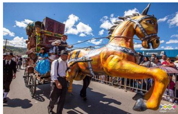
Imagen 18. Carroza representando la familia Castañeda