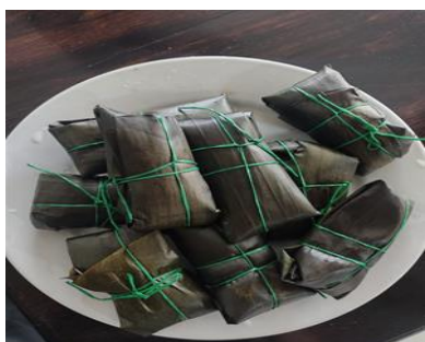
Imagen 6.

Gallina, plátano, yuca, choclo, papa, cebolla, arracacha, zapallo, cilantro, sal al gusto.