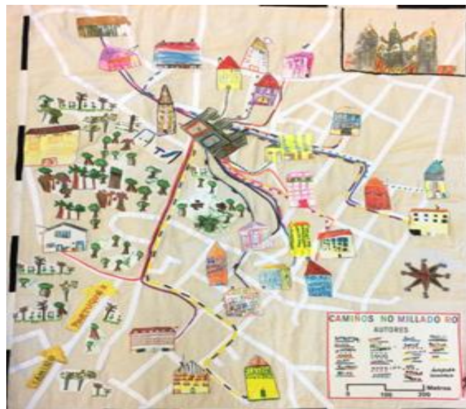
Imagen 14. Cartografía.