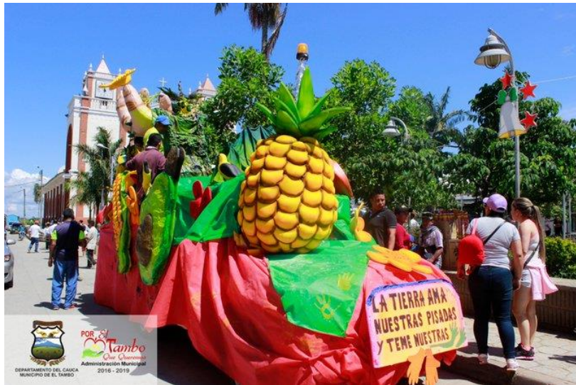
Imagen 19. Carroza

el dibujo, la escultura y el teatro. Esto conlleva a que los niños sientan la necesidad de ser partícipes activamente de estas manifestaciones artísticas y culturales con las que se conserva el patrimonio cultural, la identidad de cada vereda y por supuesto de cada persona.