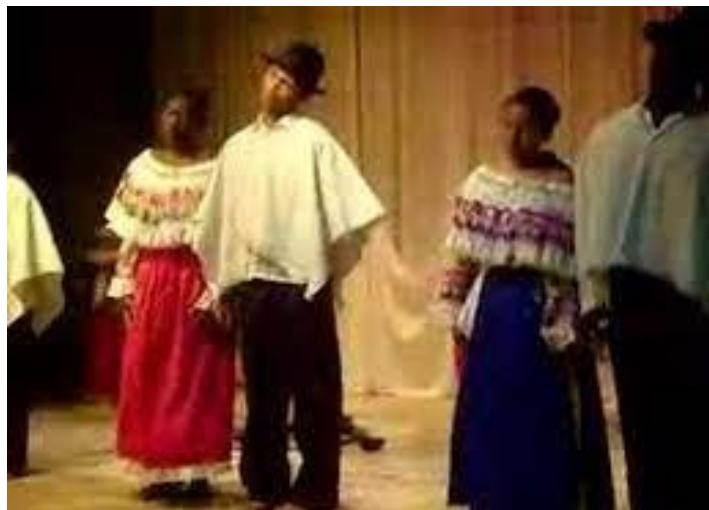
Imagen 11.