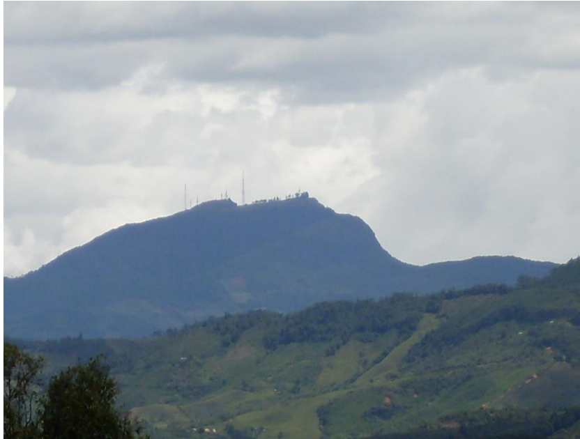
Imagen 3. Parque Natural Munchique.

El parque Natural Munchique es uno de los lugares turísticos más hermosos de El Tambo, es un cerro que cuenta con una amplia vista para disfrutar. Este lugar, por ser fuente hídrica (yacimientos de agua) abastece a la mayor parte de la población tambeña de agua potable. Es importante mencionar un poco más de historia acerca del Parque Natural Munchique, según el plan de manejo (2009):