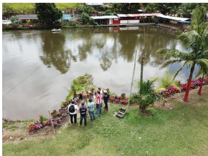
Imagen 5. Lago turístico El Zarzal