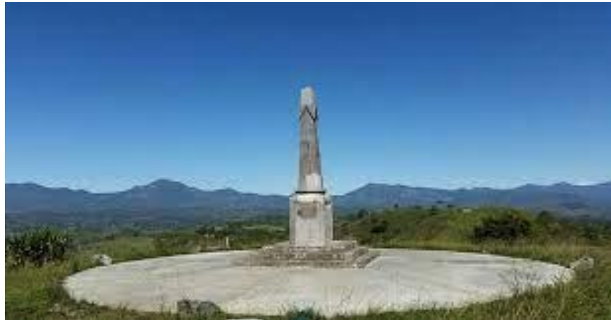
Imagen 4. El Obelisco.

Es el principal referente espacial y cultural, pues la memoria de la Batalla del Tambo, librada por Liborio Mejía Gutiérrez en 1816 significó la salida de los españoles de la región en la época de la independencia y en cuyo honor a los héroes se les construyó dicho monumento, el 29 de junio de 1968, la academia colombiana de historia rindió homenaje al ejército patriota colocando una placa conmemorativa con una inscripción que expresa “La temeridad y el heroísmo, inspirados por amor indeclinable a la patria agonizante, impulsaron por las fortificadas breñas de la cuchilla de el tambo, a un puñado de valientes comandados por la gallarda juventud de Liborio