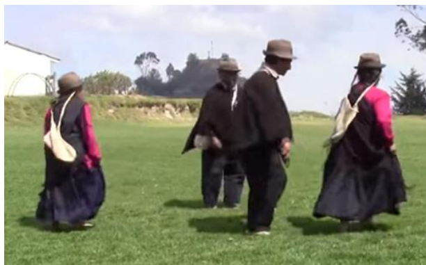
Imagen 12.

Es un ritual de enamoramiento de los indígenas yanaconas, una danza donde se muestra el cultivo de la tierra, el uso de la lana, la minga. Se baila por parejas, en grupos de mínimo 4 parejas, siguiendo una estructura a base de líneas y círculos.