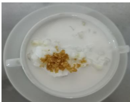
Imagen 8.

Masa de maíz, papa, cebolla, tomate, maní, carne, sal, color, pimienta.