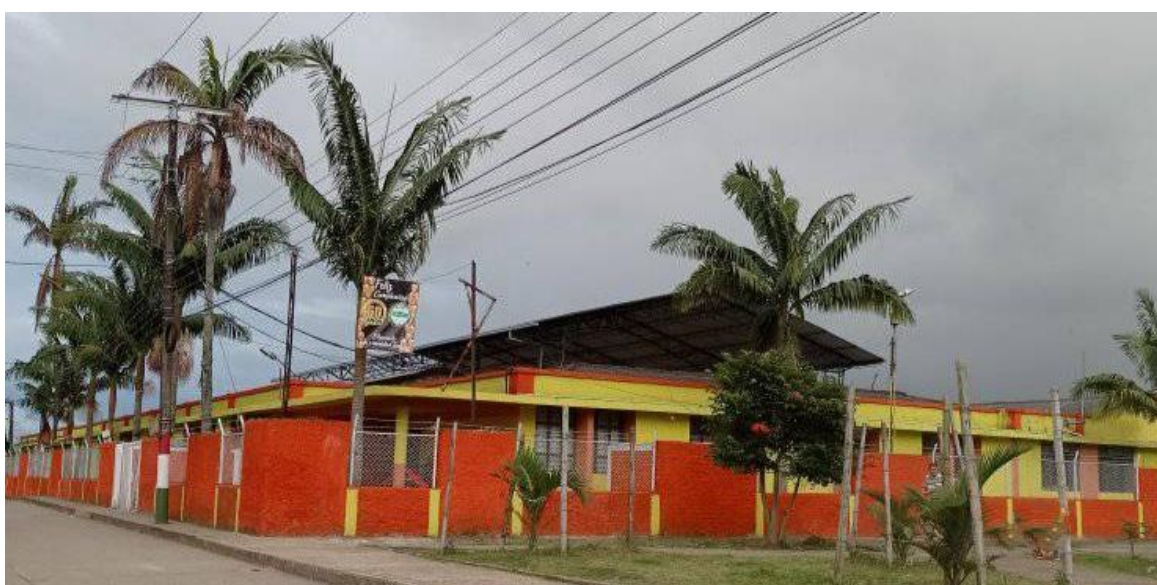
Imagen 2. Institución Liborio Mejía