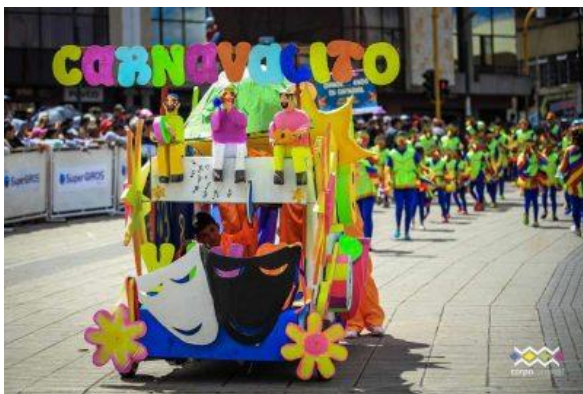
Imagen 17. Carroza carnavalito, Fuente: https://carnavaldepasto.org/2-de-enero/

Ahora bien, es importante mencionar una breve síntesis acerca del carnaval de negros y blancos más representativo celebrado en San Juan de Pasto, este inicia el 2 de enero con el carnavalito donde los niños participan con sus desfiles de carrozas elaboradas por ellos mismos; el 3 de enero celebran el canto a la tierra en donde varios músicos y danzantes con coloridos vestidos participan en el concurso en un desfile de carácter eliminatorio para tener la oportunidad de presentarse el 6 de enero; el 4 de enero se realiza una cabalgata en honor a la familia Castañeda conmemorando la llegada de esta familia en este día; el 5 de enero es el día de los negros conmemorando el día libre que tenían los esclavos para compartir y pintar la cara de las personas con pintura negra; el 6 de enero, el día de blancos, día del desfile magno en esta fecha los “pastusos” se pintan de blanco, también se realiza el desfile de carrozas, donde participan la gran mayoría de los ciudadanos, más turistas visitantes que se vuelcan a las calles para presenciar el desfile magno.