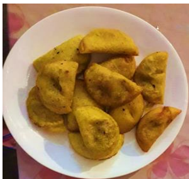
Imagen 7.

Masa de maíz, papa, cebolla, tomate, maní, pollo, sal, color, pimienta, hojas de plátano.