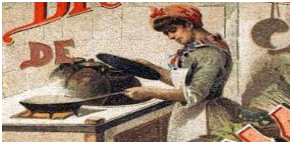
Ilustración 7

la oportunidad de un trabajo o se las relegaba a trabajos fabriles menos prestigiosos, con ese argumento para pagarles menos les requerían de una especial preparación, las mujeres no lograron igualdad con los salarios que recibían los hombres e incluso perdieron acceso a puestos especializados, ellas debían aceptar cualquier oficio de ayudante.