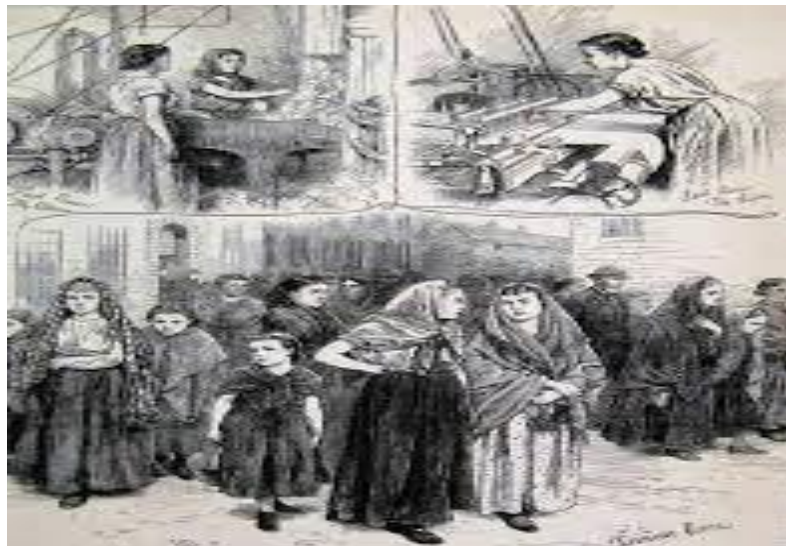
Ilustración 2

De Beauvoir a razón, de conocer que la mujer se encuentra relegada a un segundo plano, decide ir a la historia de la mujer porque de esa manera logrará comprender porque la dominación hacia la mujer sigue permaneciendo sin ninguna oposición. Por lo que se adentra en la historia, para abordar la subordinación 2 de la mujer; que desde la edad de bronce el hombre se puede evidenciar como es quien se hace dueño de la tierra, es dueño de los utensilios de labranza y por lo tanto la mujer o compañera se convierte en su propiedad, aquí surge la propiedad privada; siendo esta la derrota del sexo femenino, en otros términos, aparece el concepto de familia patriarcal determinado por la dominación hacia la mujer y el papel que ella va a realizar en la sociedad.