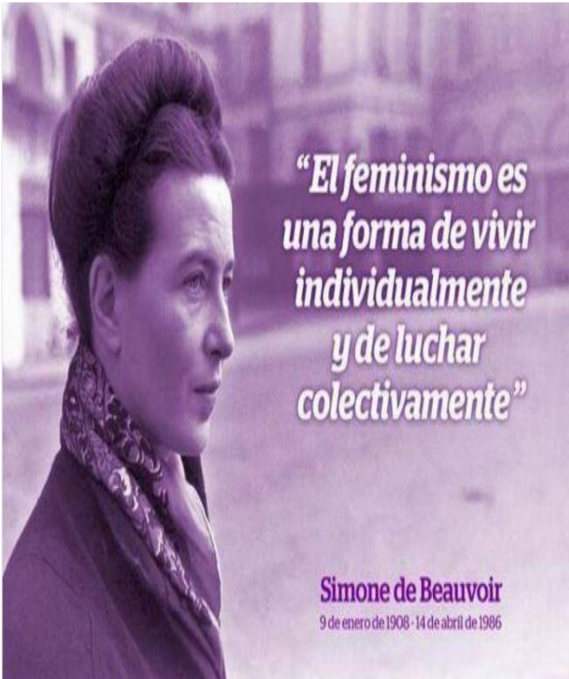
Ilustración 1 Fuente: el mundo.es - Siete citas de Simone de Beauvoir que leerás hoy en Twitter.