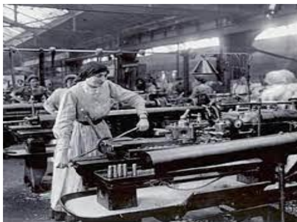
Ilustración 4

el auge del capitalismo las mujeres trabajaban más horas por menos salarios, que favorecía a los dueños de los medios de producción porque les aumentaba la plusvalía. Puesto que la jornada laboral de la mujer era de 48 horas a la semana. Las mujeres aceptaban el trabajo, con el fin de liberarse de la independencia del yugo en que el hombre las tenía sometidas; el quehacer de la mujer en el hogar no era reconocido, ni remunerado como un trabajo sino como responsabilidad por el hecho de ser mujer.