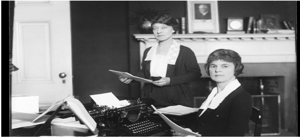
Ilustración 6 Las primeras mujeres trabajadoras del siglo XX en la Biblioteca del Congreso de EEUU.

Se debe resaltar el invento de la máquina de escribir y el teléfono permitió que las mujeres utilizaran estos elementos y desempeñaran el trabajo de secretarias, pero estaban expuestas a la subordinación frente a los hombres quienes eran sus jefes o dueños de la empresa en la que trabajaban. También lograron estudiar para poder manipular la máquina de escribir. En esta labor de secretarias obtenían menos salarios, desempeñaban así ocupaciones ya fuera de costurera, profesora entre otros oficios.