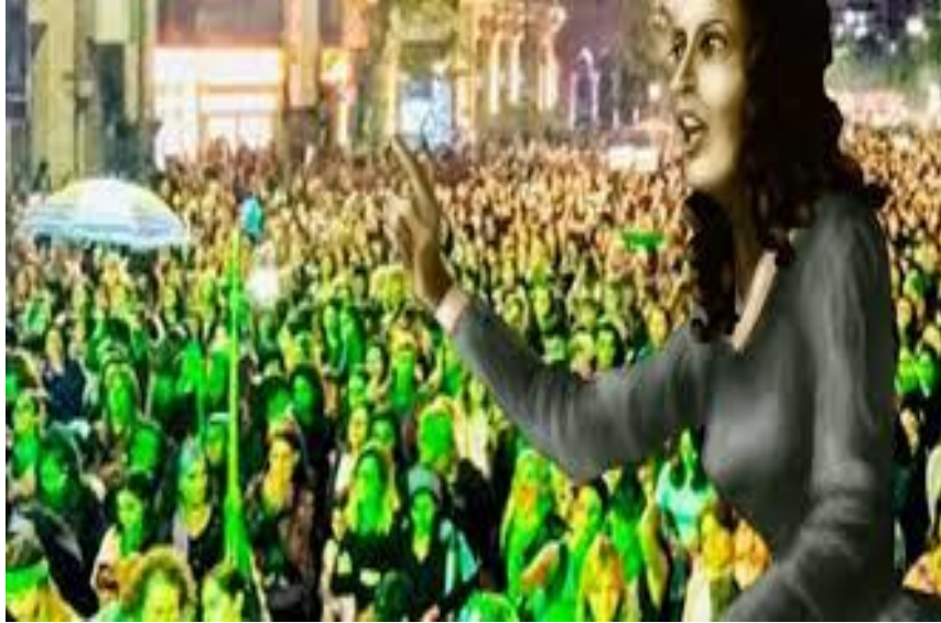
Ilustración 5 Se publica "Flora Tristán: el martillo y la rosa".

Podría decirse que Flora Tristán –la filósofa autoproclamada «paria» que tejió feminismo, socialismo, pacifismo y antiesclavismo– murió hace 175 años tal como vivió. La mujer que, desde los márgenes y la exclusión, había logrado levantar una vida y una obra de pensamiento y acción política acabó falleciendo con solo 41 años en Burdeos, adonde había acudido para expandir su unión internacionalista obrera en un intenso 'tour' por tierras francesas.