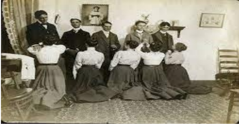
Ilustración 3 Fuente: Facebook Exa Aguascalientes 97.3 FM - costumbre porfiriana.

Otro de los análisis históricos del pensamiento de Simone de Beauvoir parte de la influencia filosófica de la dialéctica del amo y del esclavo desde Hegel, donde se evidencia la sumisión histórica de las mujeres, porque la mujer asume el papel de esclava, se encuentra subordinada por el hombre (amo – esclava) 3 ; la autora de Beauvoir considera que a las mujeres les falta autonomía para liberarse de ese yugo, profundiza en la historia para indicar que la mujer ha sido una construcción cultural, desde ahí la filósofa logra registrar los