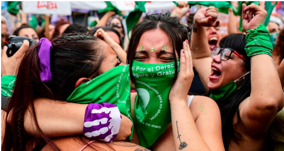
Ilustración 9 Fuente: Amnistía Internacional - Datos claves sobre el aborto.

“Sin embargo, el ideal democrático e individualista del siglo XVIII es favorable a las mujeres, que para la mayoría de los filósofos son seres humanos iguales a los del sexo fuerte. Voltaire denuncia la injusticia de su suerte. Diderot considera que su inferioridad ha sido en gran parte hecha por la sociedad. “¡Mujeres os compadezco!” (Beauvoir, 1949, pág. 98)