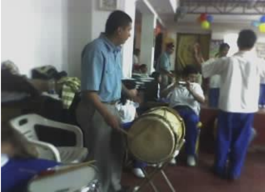
Foto No 13 FUNDACION CULTURAL AIRES DE PUBENZA, ENSAYO DE MUSICA