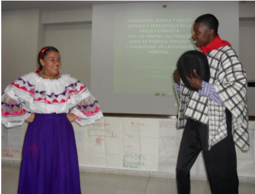
Foto No 19 COPLAS TIPICAS CAUCANAS