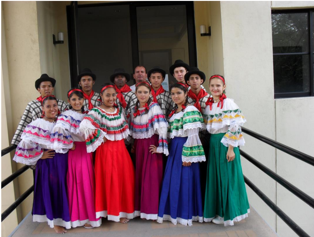
Foto No 16 PRESENTACION FUNDACION YANACONAS