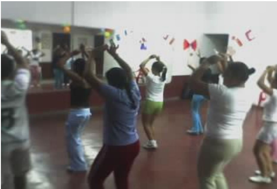
Foto No 14 FUNDACION CULTURAL AIRES DE PUBENZA, ENSAYO DE DANZAS