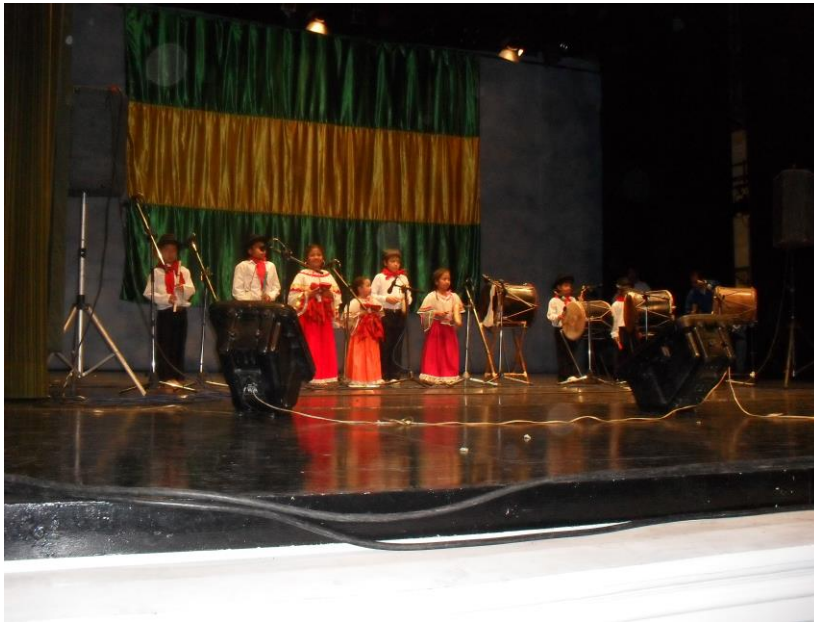
Foto No 20 PRESENTACION MUSICAL DEL GRUPO INFANTIL AIRES DE PUBENZA.