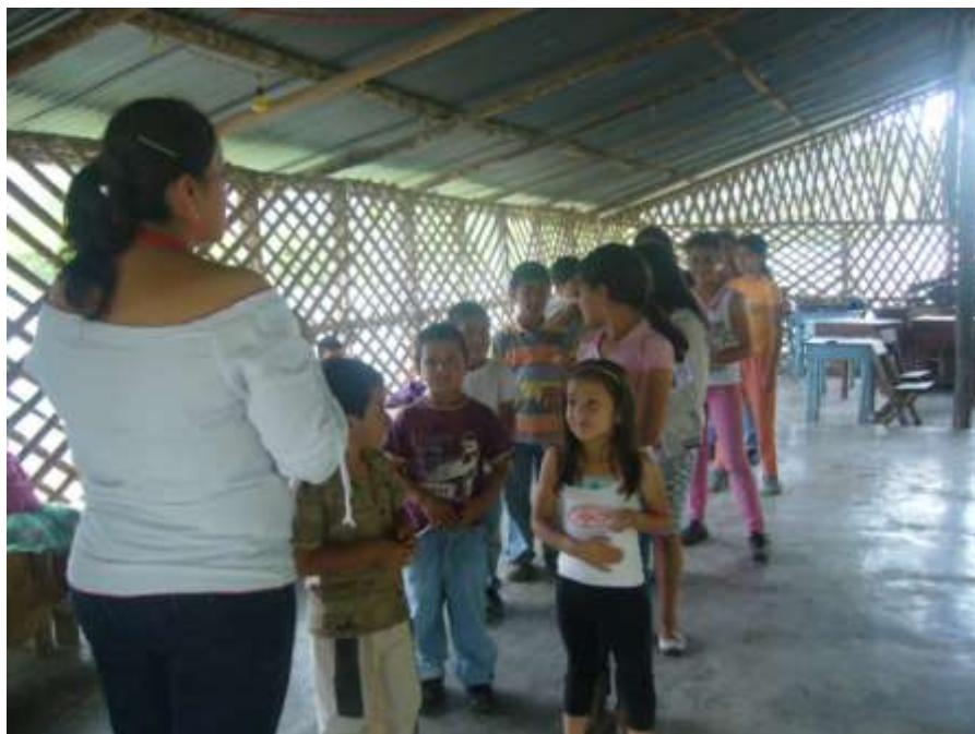
Taller de danza. Montaje danza la Ruana.