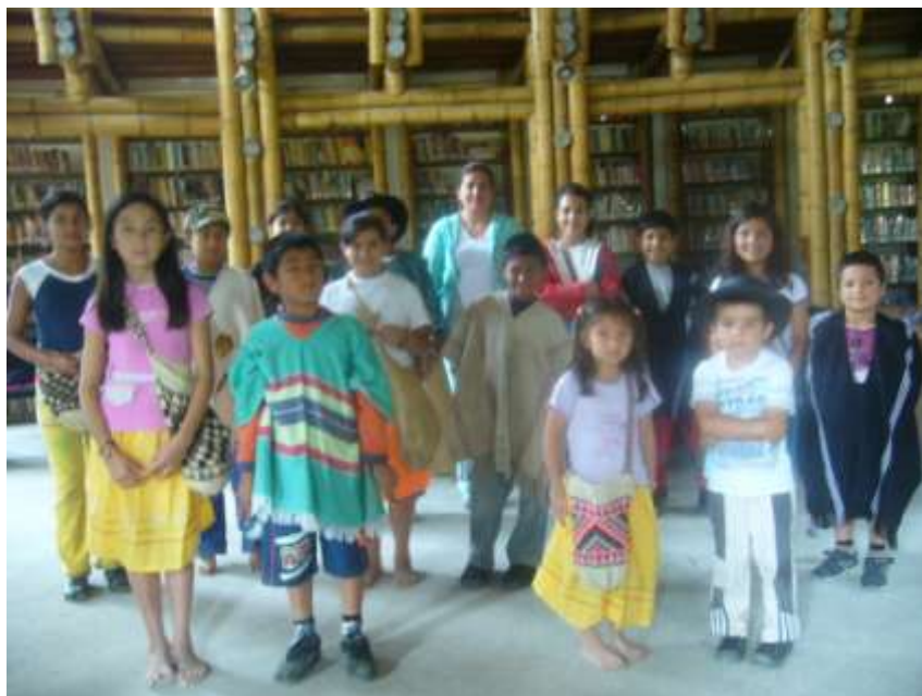
Grupo de niños que hicieron parte del proceso.