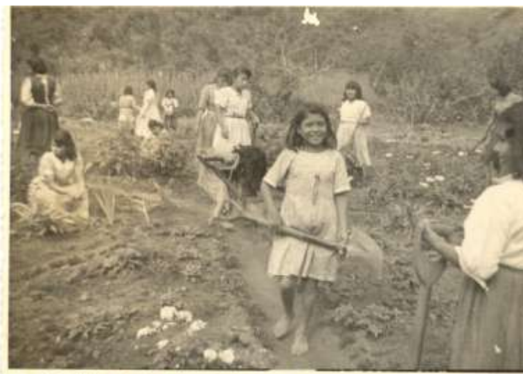
En la foto niñas de la escuela Hogar.