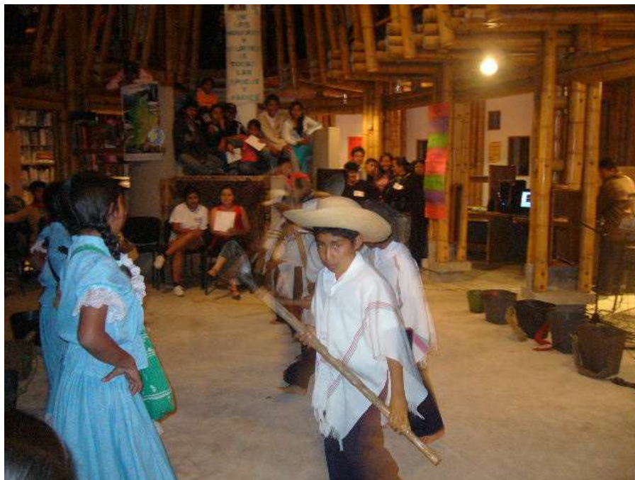
Evento cultural realizado en la comunidad de Guanacas. En foto grupo invitado de la comunidad de San José, municipio de Inzá.