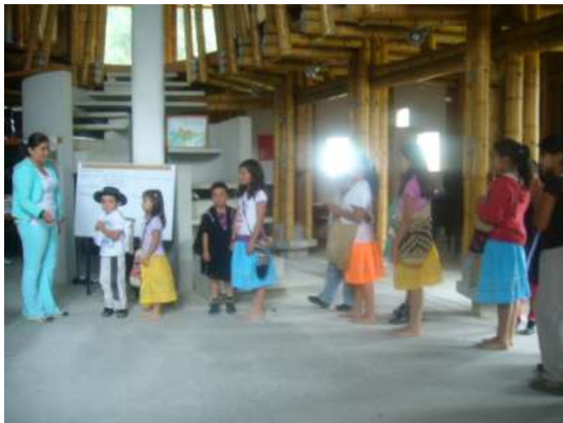
Ensayo danza del Amo.