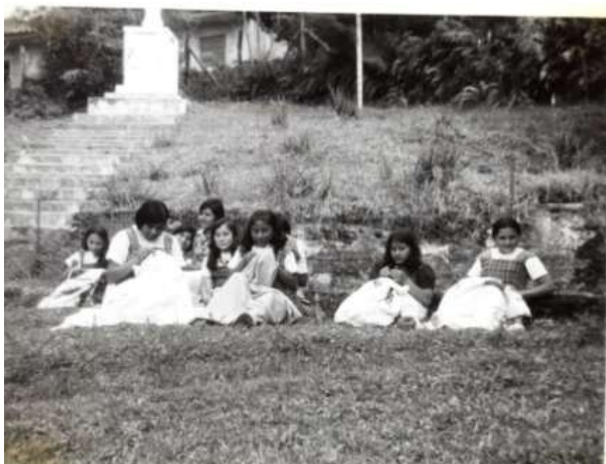
Fotografía de la escuela Hogar, hoy importante colegio de la zona.