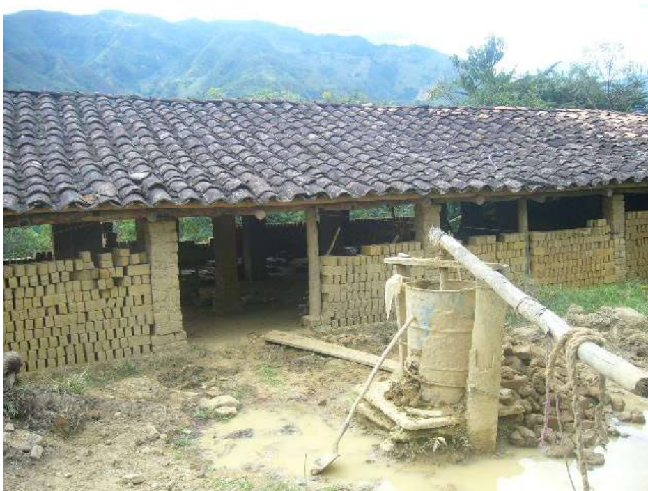
Foto galpón. La comunidad de Guanacas se ha destacado porque algunos de sus habitantes se dedican a la elaboración de ladrillos en arcilla.