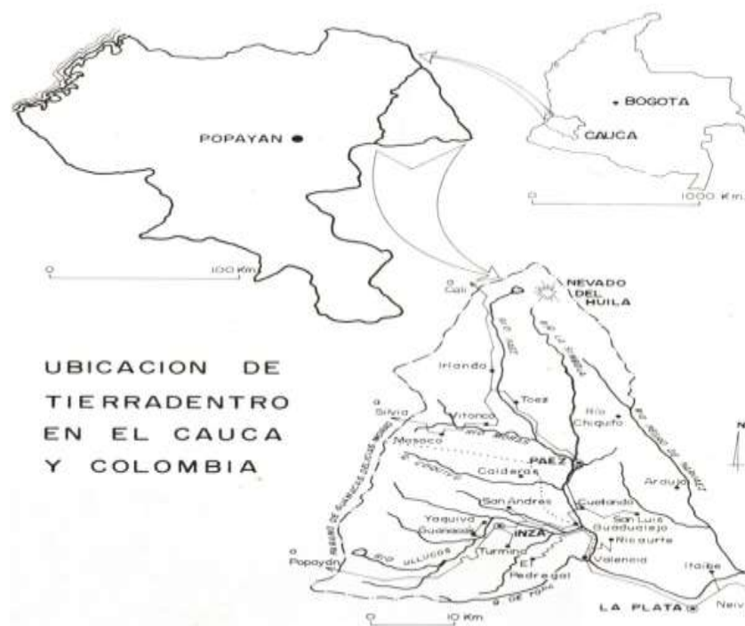
Mapa 1. Ubicación de Tierradentro en el Cauca y Colombia