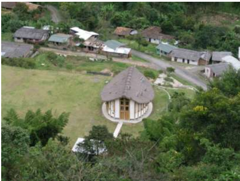
Comunidad de Guanacas.