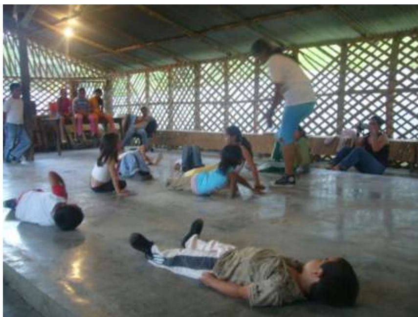
Ensayo taller de danza folclórica. En la foto líder de la comunidad, que brindo apoyo para la realización del proyecto.