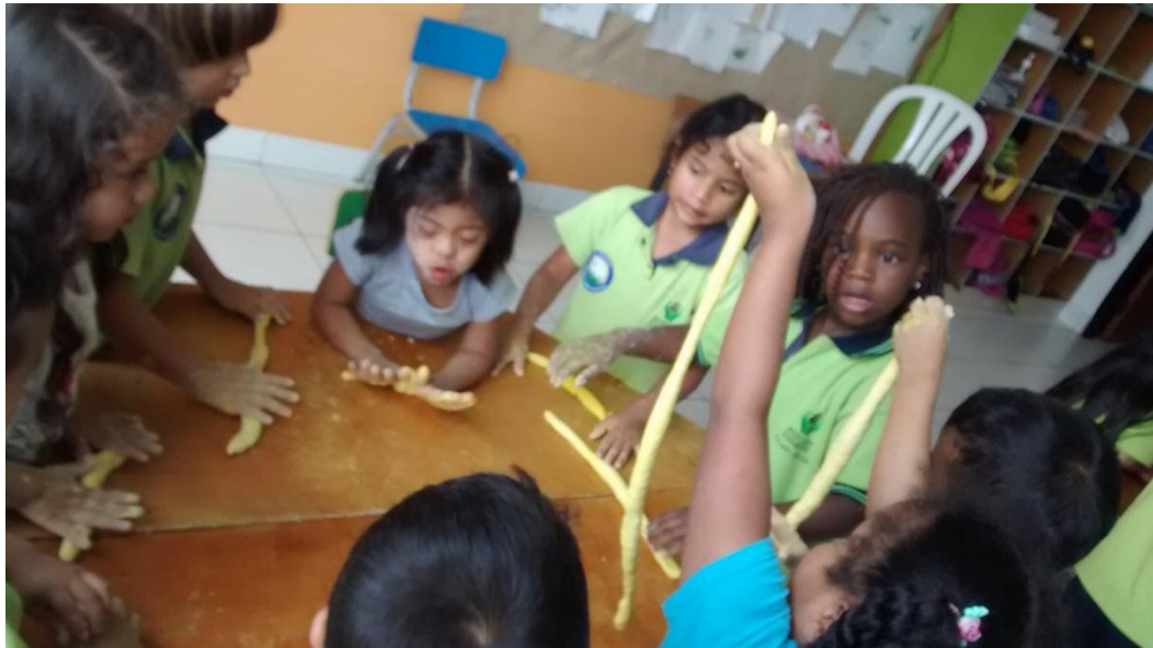
Fotografía 9. Creando