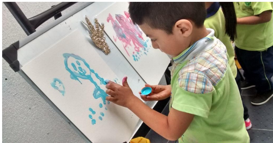
Fotografía 10. Un pequeño gran artista. Obando 2016