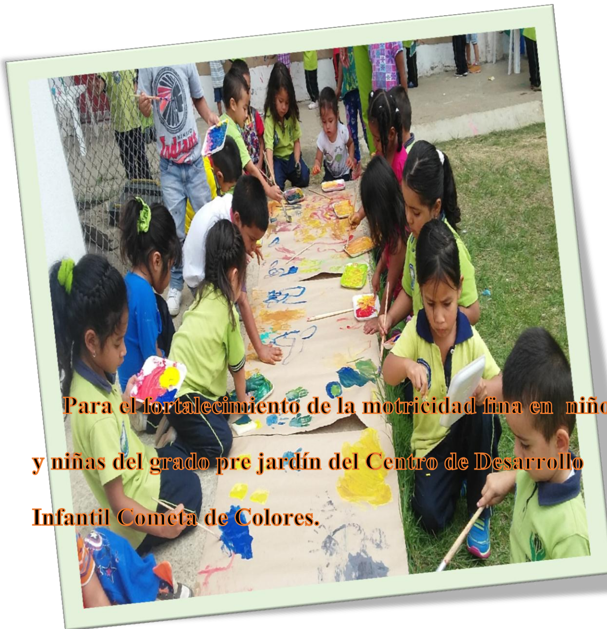
Figura 3. La magia del color