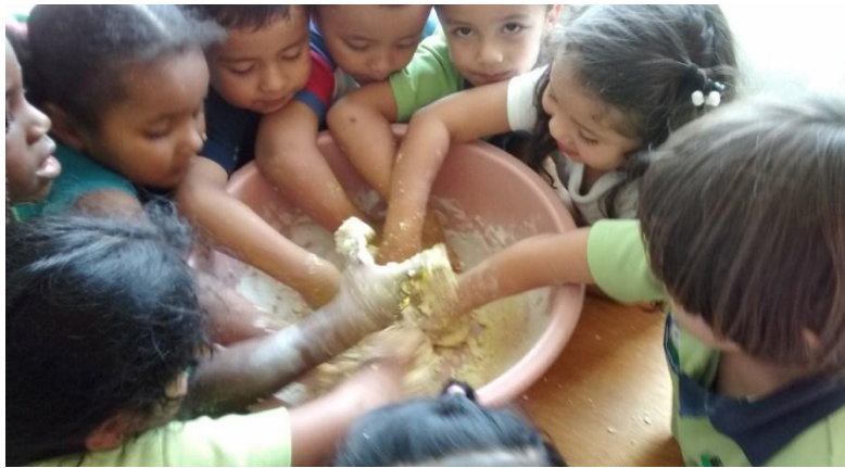
Fotografía 3. Explorando materiales, Obando A. 2015