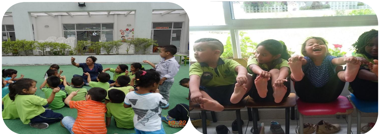
Fotografía 2. Conociendo Mi cuerpo, Obando A. 2015