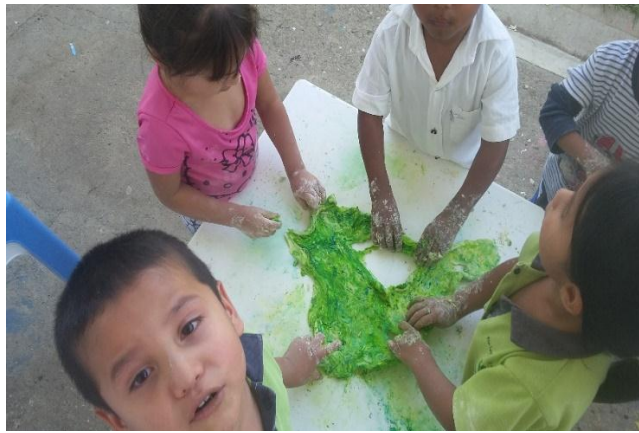
Fotografía 6. Amasando para crear, Hoyos 2016