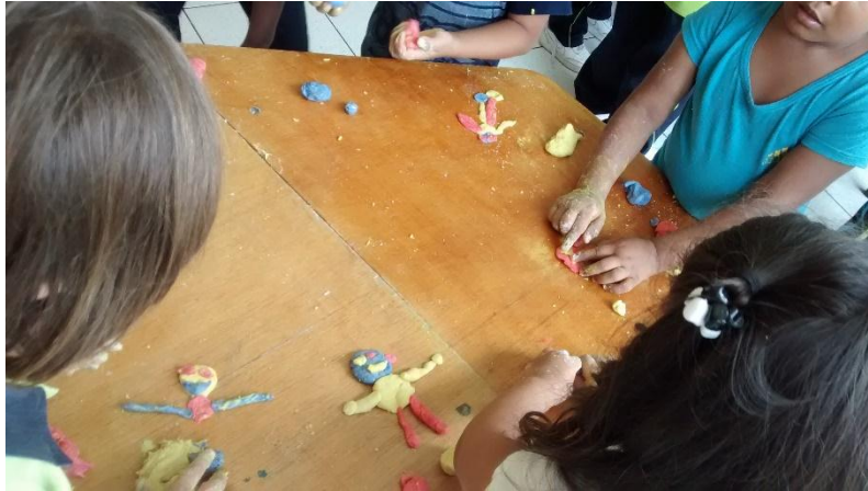
Fotografía 11. Grandes creaciones Hoyos 2016