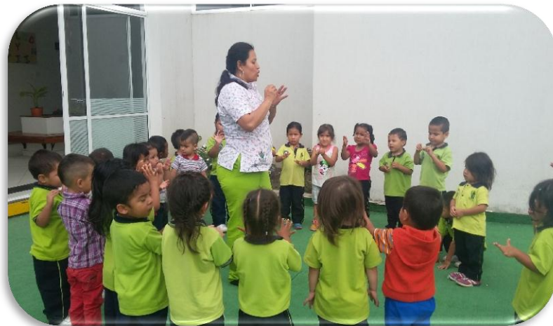
Fotografía 1. El juego trasforma; Hoyos S.2015