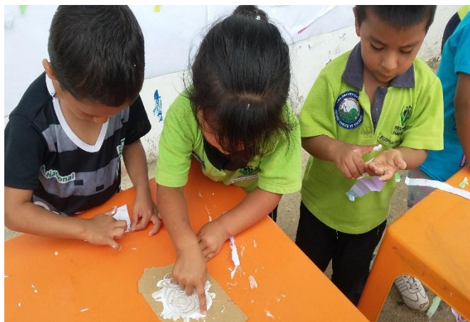
Fotografía 7. Recortar parara crear: Hoyos S. 2016