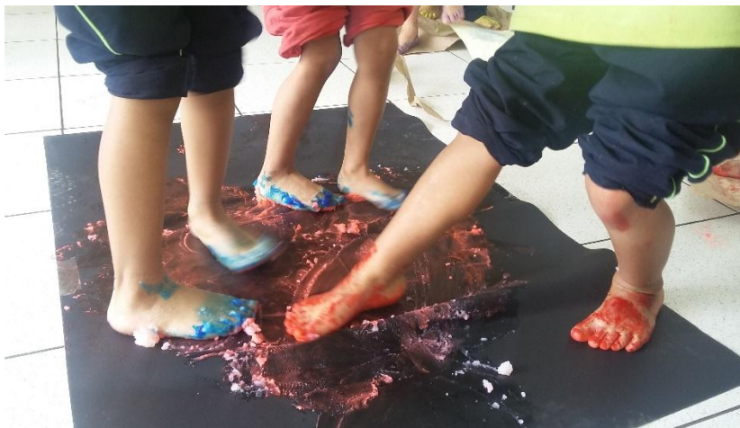
Fotografía 4. Creando con los pies, Hoyos S. 2015