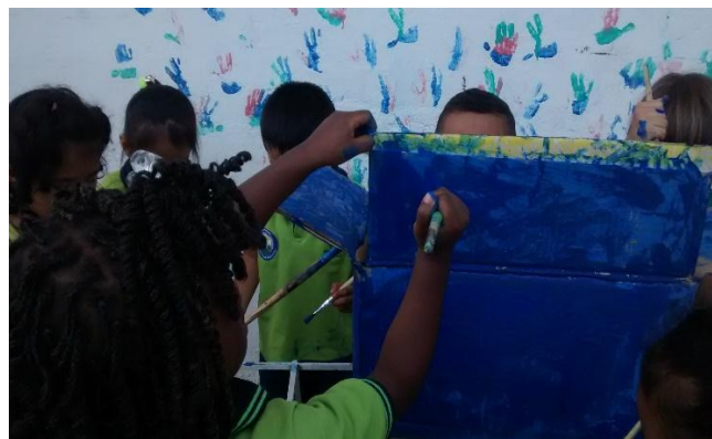
Fotografía 8. La magia del color, Obando 2015