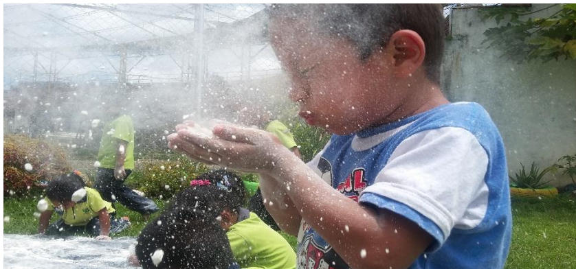
Fotografía 5. Una nueva Experiencia: Obando A. 2016