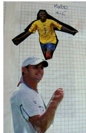
Fotografía #2 8 de junio de 2010 4:39pm