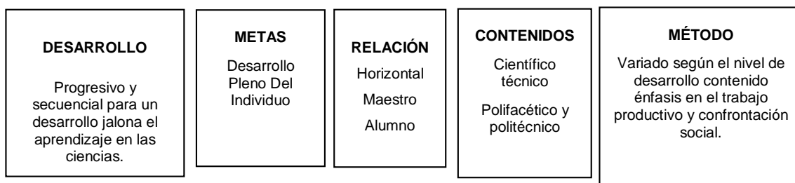
Esquema 2: Estructura del modelo pedagógico social

La propuesta pedagógica se desarrolló desde un modelo pedagógico socialista, el cual propone el desarrollo progresivo y secuencial máximo de las capacidades de aprendizaje e intereses individuales y colectivos dirigidos hacia una sociedad y basado en el conocimiento pedagógico para el desarrollo integral. En este modelo pedagógico se establece una relación maestro-alumno de tipo horizontal, que permite establecer los contenidos a abordarse en la propuesta, para desarrollarlos de una forma variada y no monótona, su evaluación se establece desde criterios, que tienen en cuenta la praxis, lo que pasa en el contexto siendo progresiva y continua, a continuación se presenta la estructura del modelo a desarrollarse desde la perspectiva Flórez, R. 38 :