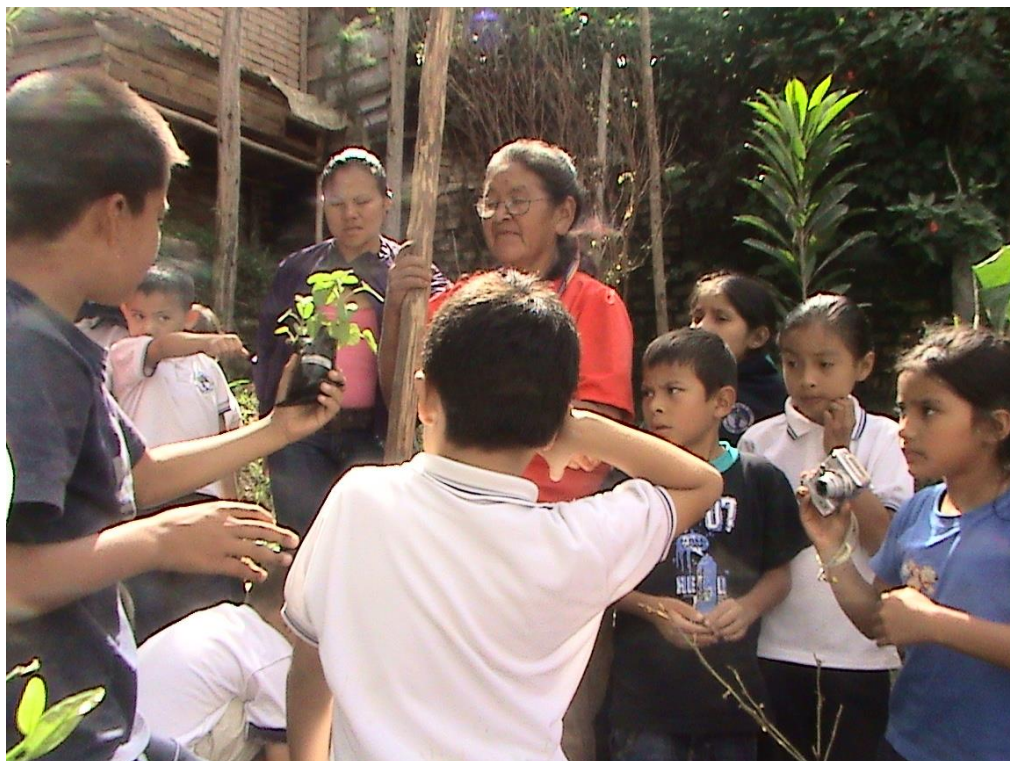
Figura 9. Mayor y estudiantes en la Huerta