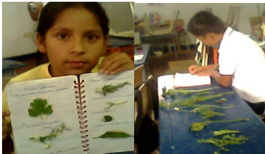
Figura 3, Escuela Wawa Khary pacha mama.

ACTIVIDAD 3 Recolecta de Plantas medicinales para conocer uso y aplicación de algunas plantas medicinales orientada por un mayor de la comunidad yanacona e investigadores.