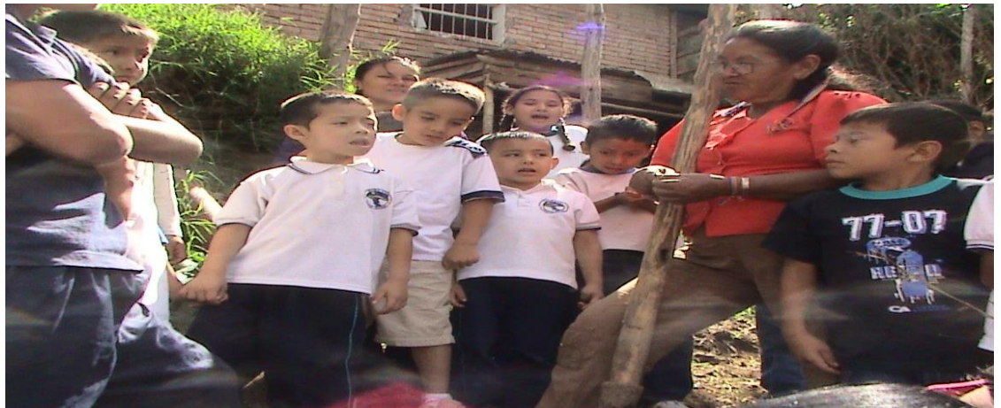
Figura 7. Practica en la huerta escolar

ACTIVIDAD 5. Practicas en la huerta escolar orientada por una mayor de la comunidad.