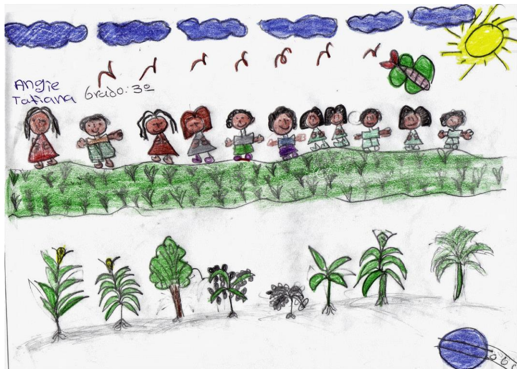
Figura 1. Los estudiantes en la Huerta de Plantas Medicinales

Es así como a partir de una visita al huerto medicinal, los niños expresan sus opiniones al respecto, por vía oral y mediante dibujos representativos de dicha actividad