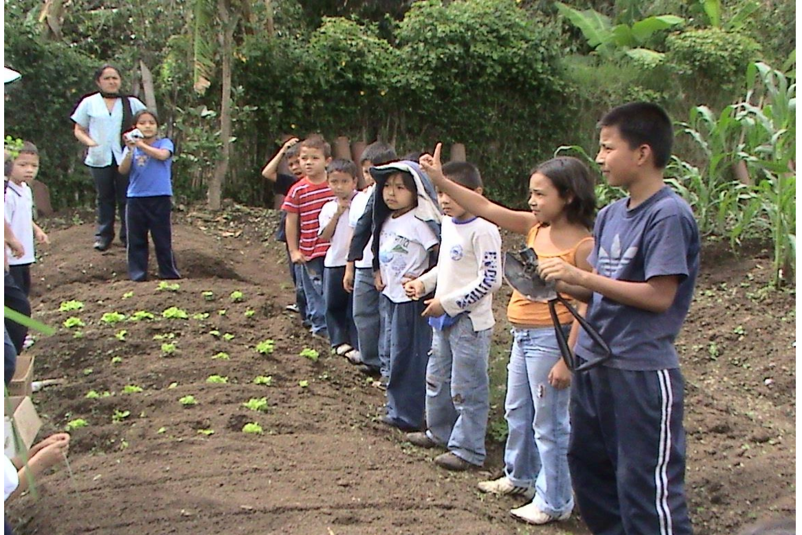
Figura 5. Construcción de la huerta escolar