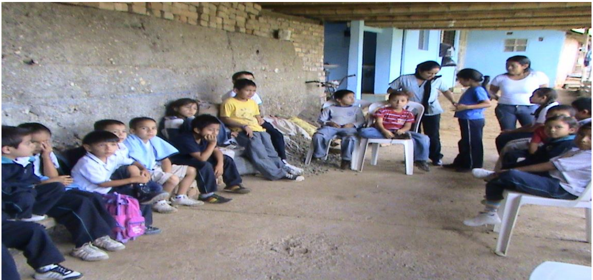
Figura 2. Sede el cabildo Indígena Yanacona, Conversatorio con los estudiantes.

ACTIVIDAD 2: Conversatorio sobre los conocimientos previos que tiene los estudiantes sobre plantas medicinales.