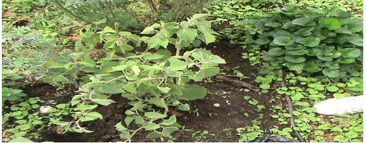
Figura 8. Algunas Plantas Medicinales