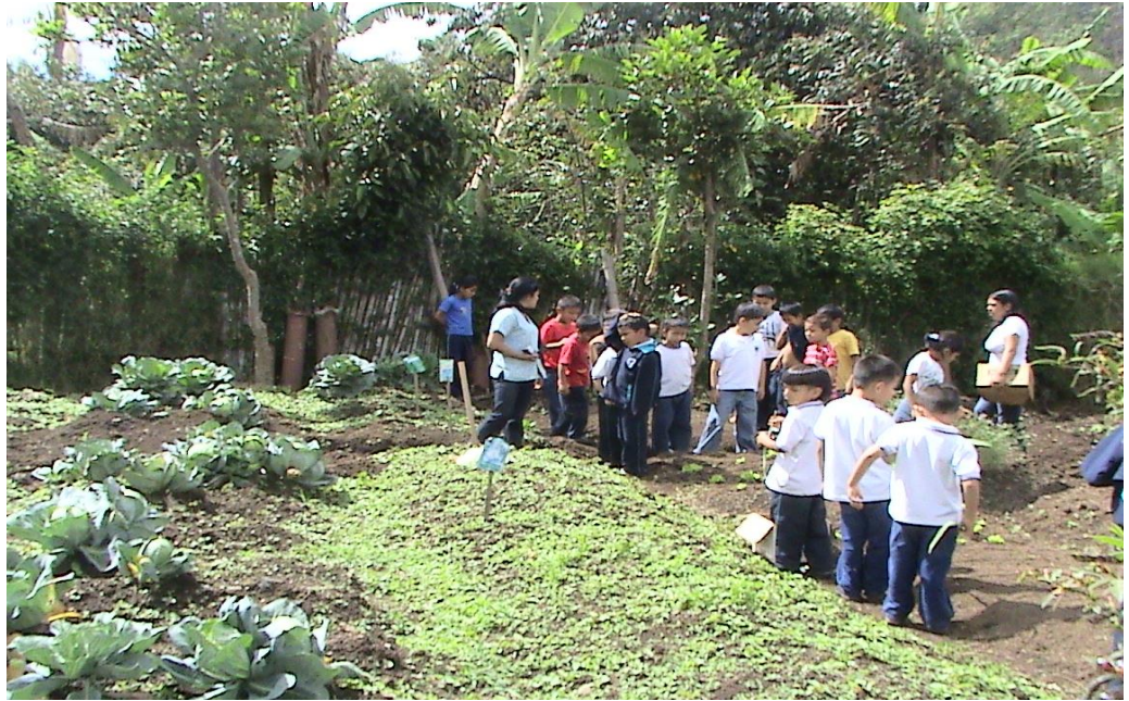
Figura 6. Realización del semillero