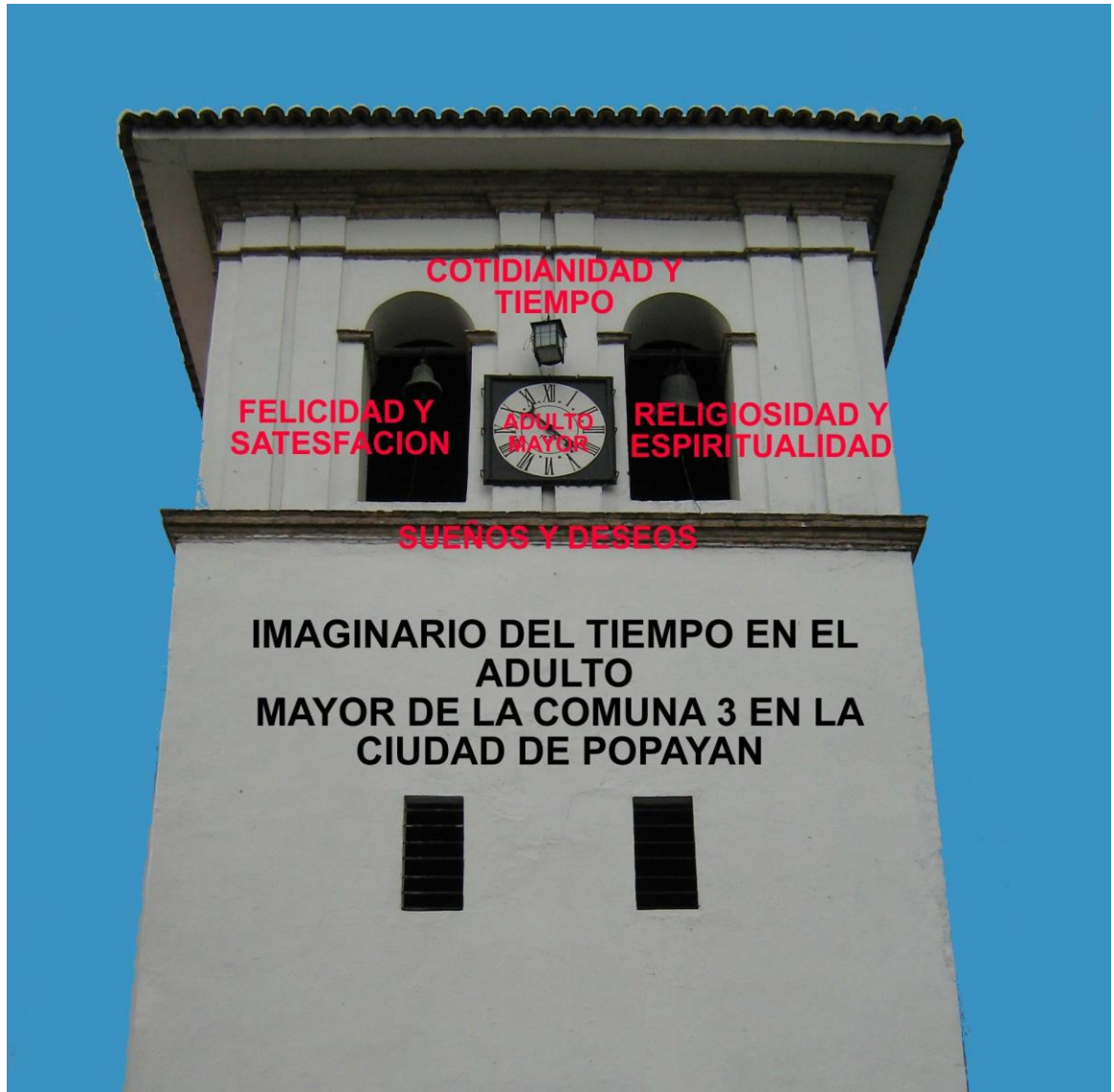
Grafica N° 3

Se escogió la imagen de la Torre del Reloj porque es un sitio muy representativo y lleno de identidad para la ciudad de Popayán, además el reloj es muy expresivo, gráfico y demasiado literal a la hora de representar las categorías emergentes encontradas, ya que nos ubica en Tiempo (investigación) y Espacio (Popayán).