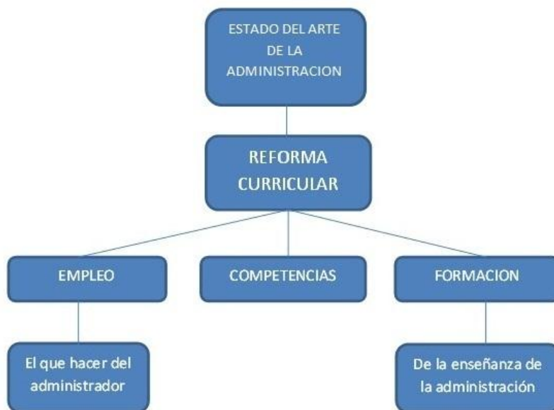
Figura 1. Elementos del problema