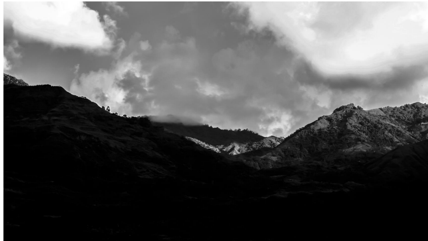
-Anochecer. Fotografía digital. 2018-