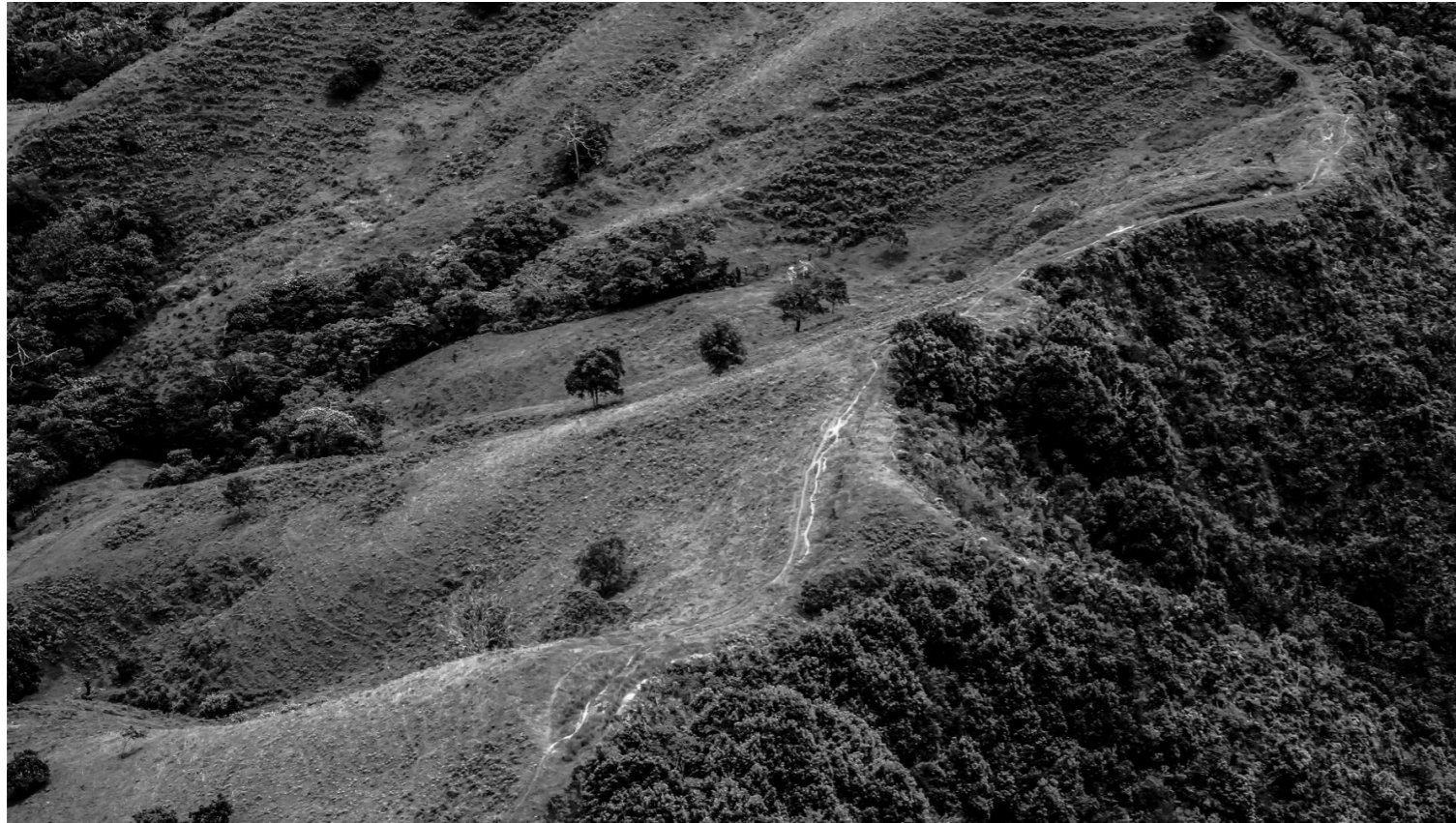
-Camino 1. Fotografía digital. 2018-