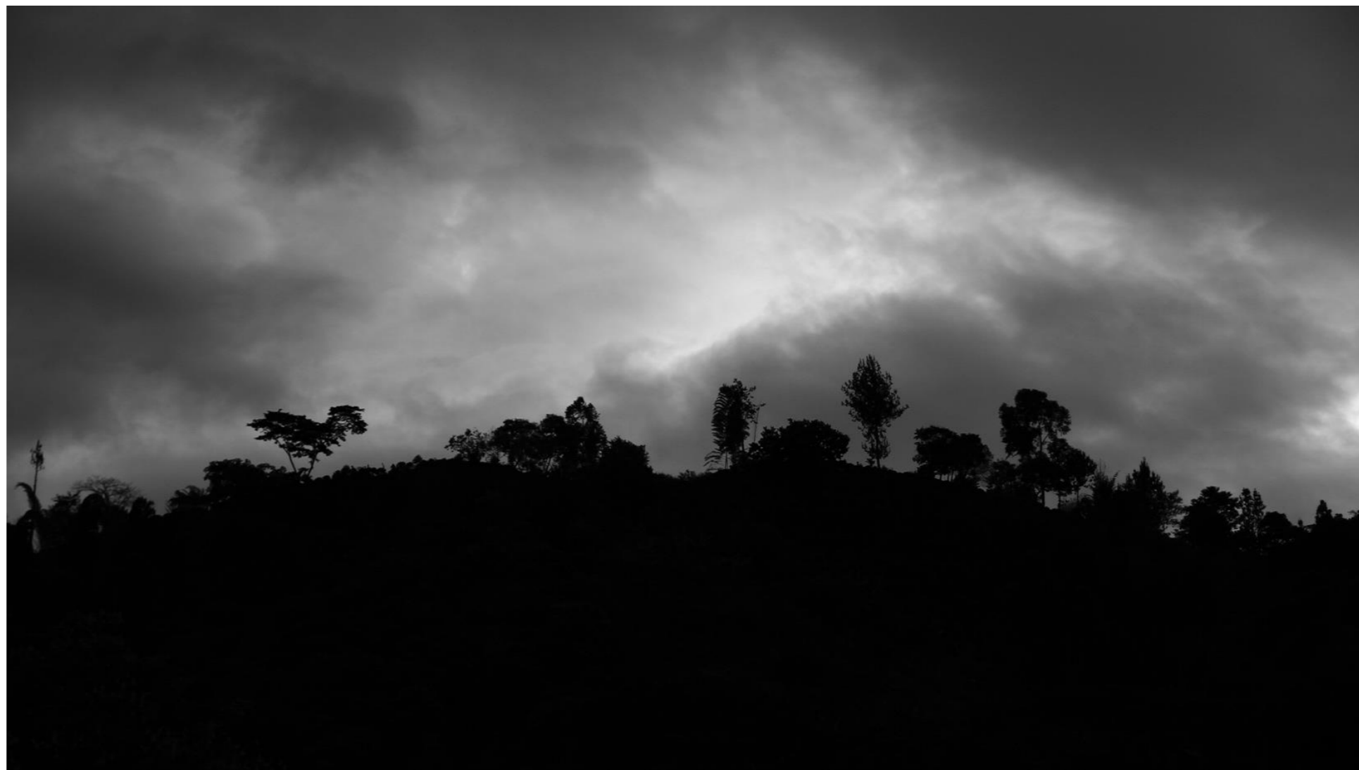
-Silueta. Fotografía digital. 2018-