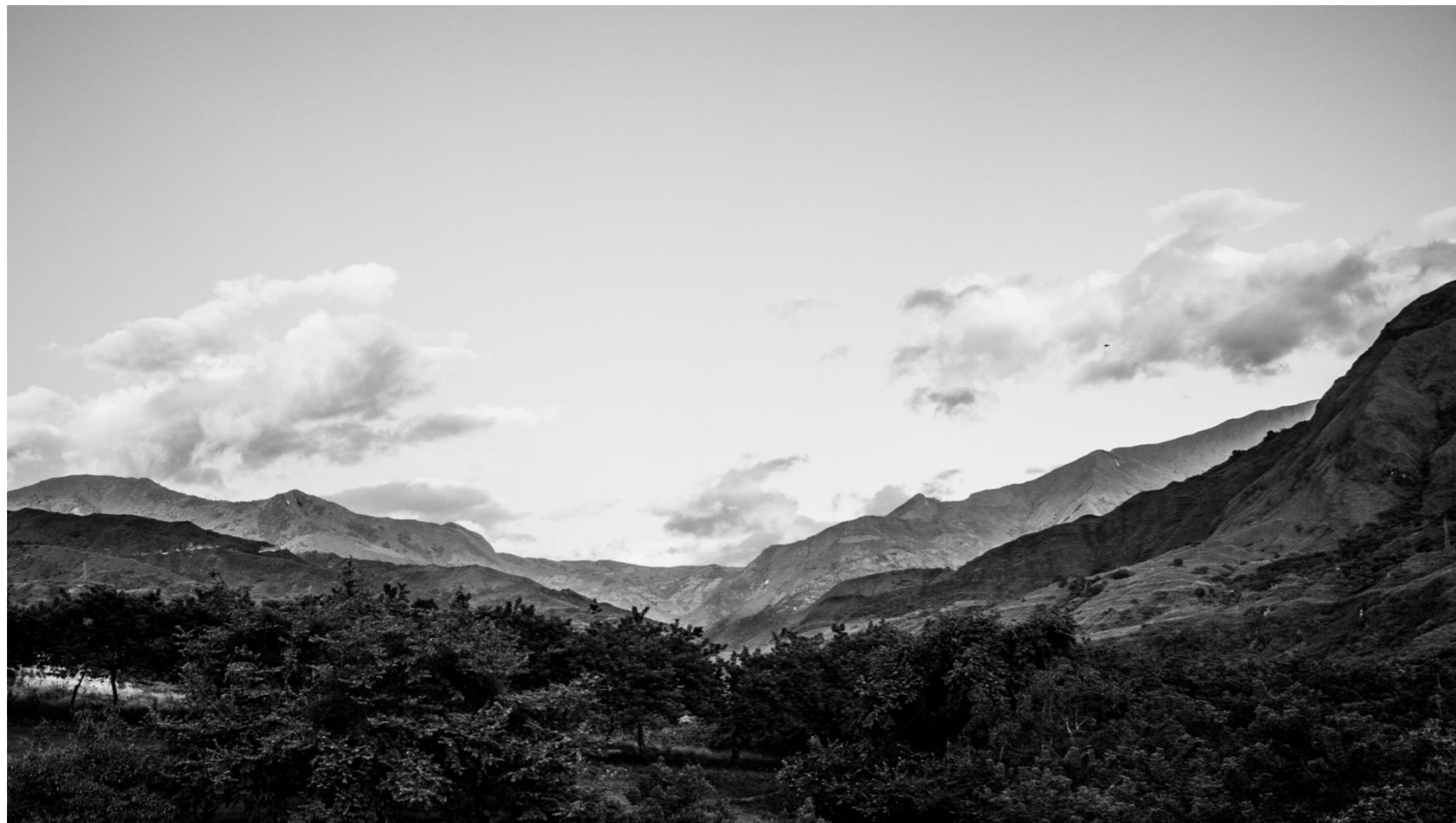
-Caño. Fotografía digital. 2019-