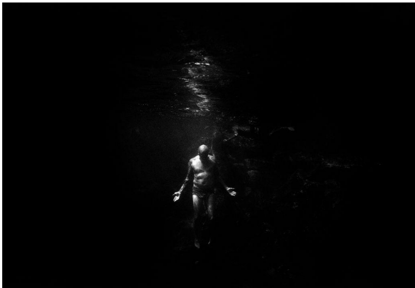
PARKE, TRENT, 2000. De la Serie New South Wales. Covelley ocean pool. Australia

Deambulando entre la luz y la sombra aparecen manifestaciones lumínicas precisadas y reconocibles solamente a la sensación del ver; si la oscuridad no es más que la misma ausencia de luz, la manera de sentir en un mundo inmerso en el vacío, la penumbra y la incertidumbre constituiría una mirada distinta del mundo, un mundo subjetivamente surrealista.