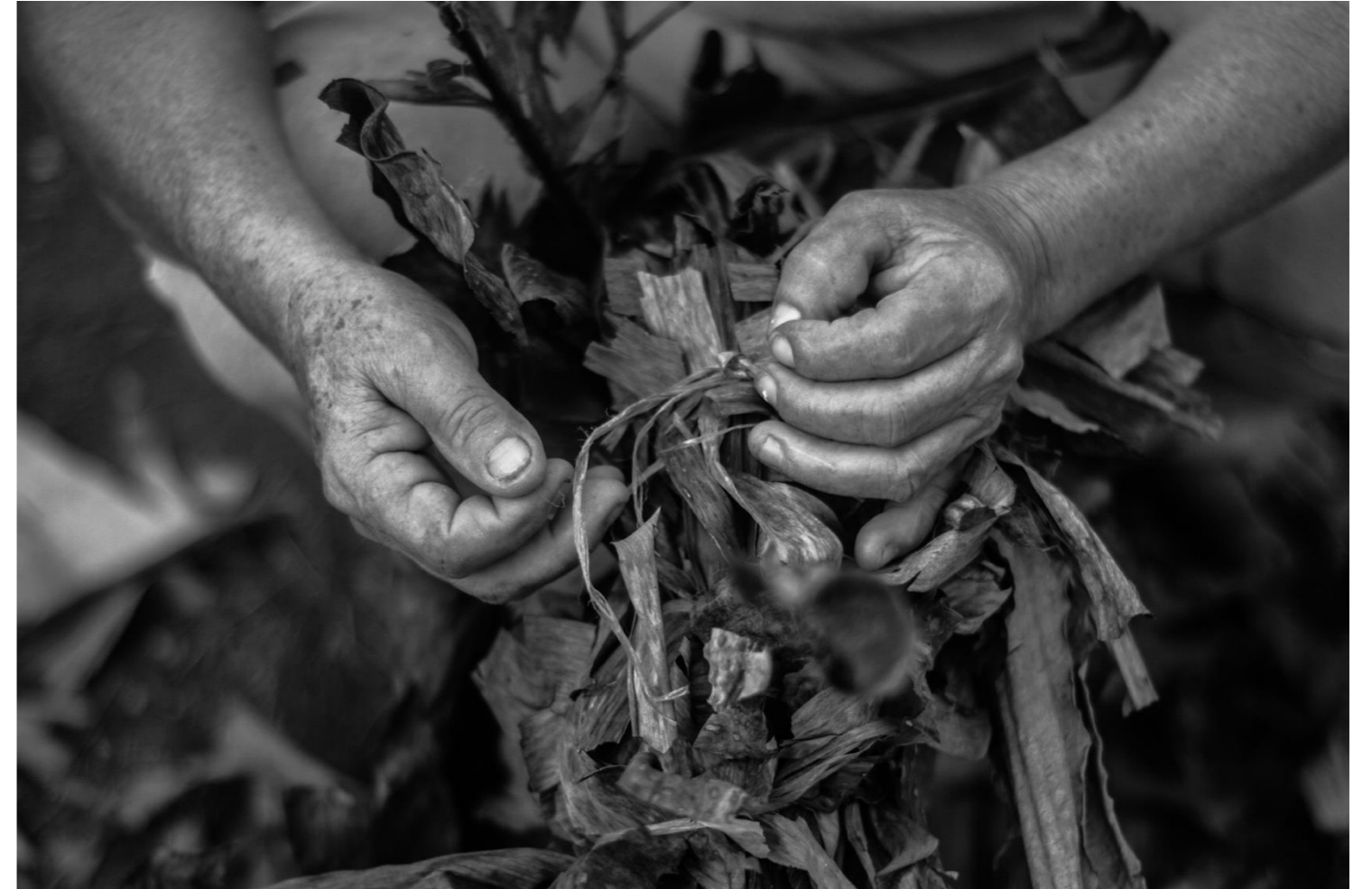
-El Nido. Fotografía digital. 2019-