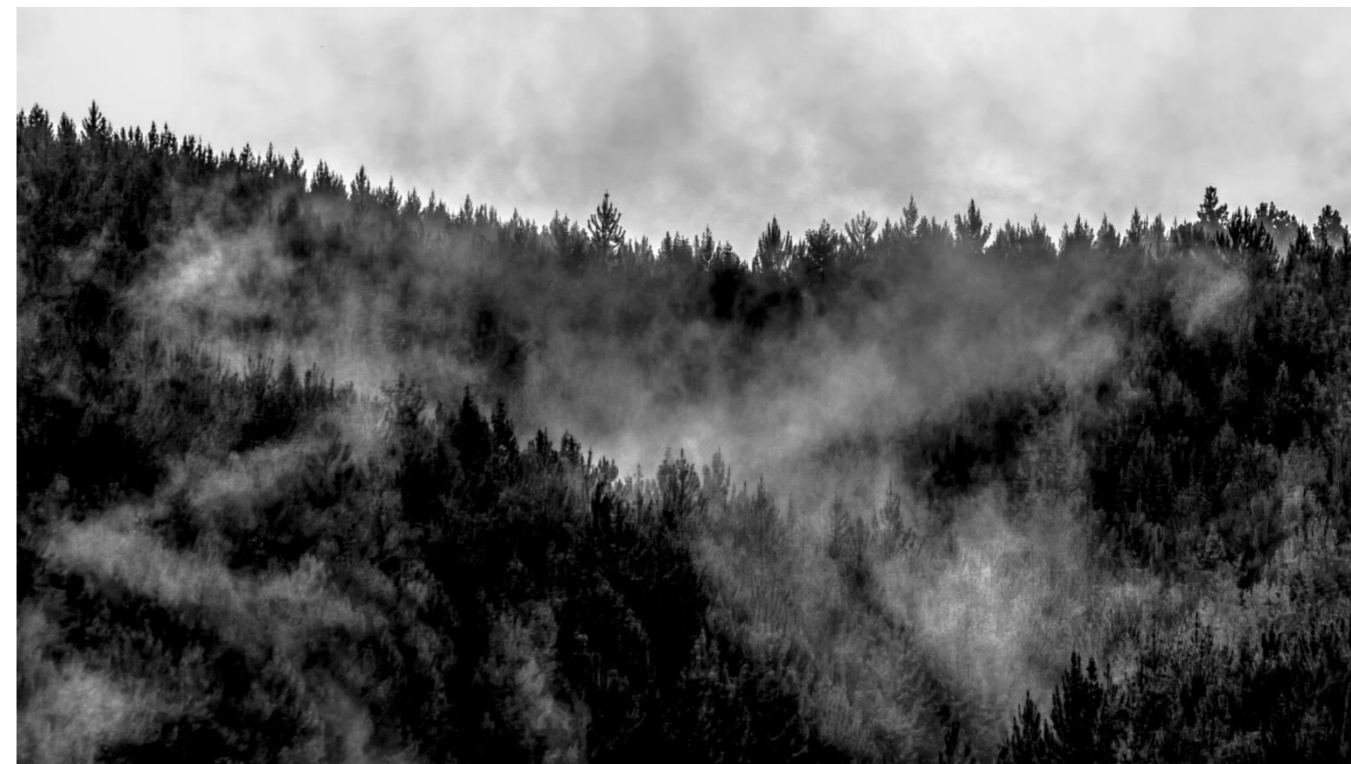
-Neblina. Fotografía digital. 2018-