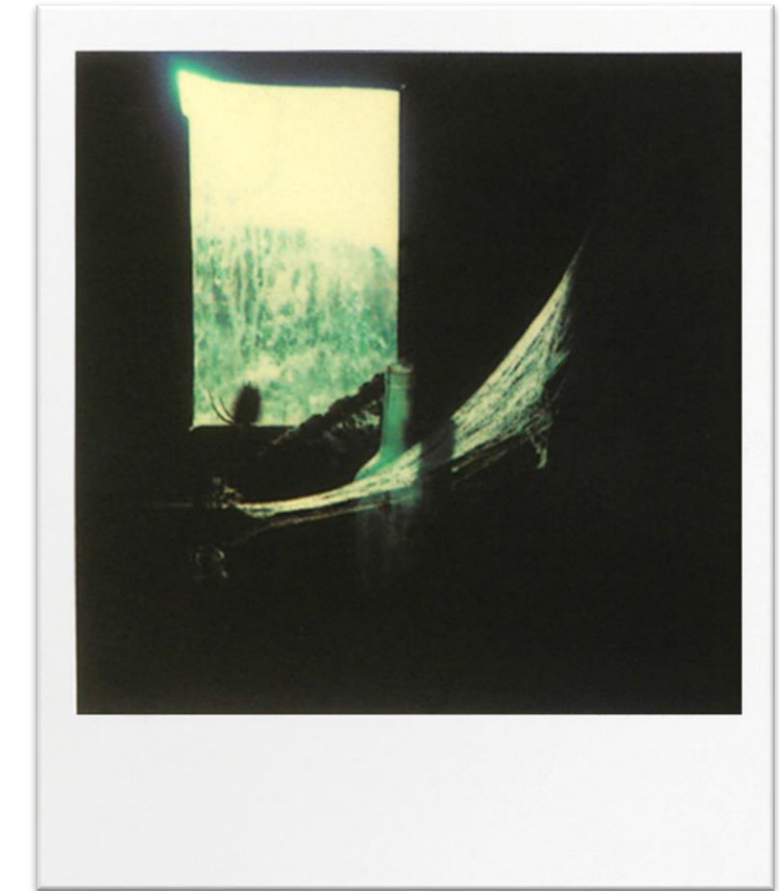
TARKOVSKI, ANDRÉI. 1981, POLAROID, RUSSIA. MYASNOYE.