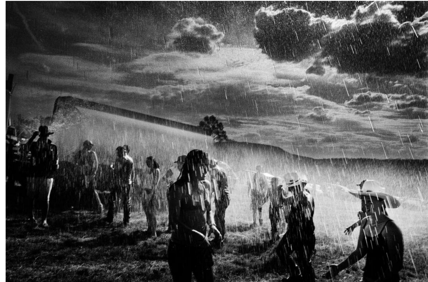
PARKE, TRENT. 2003. De la Serie New South Wales. Gunnedah. New years eve. Australia

Experiencias tan universales que bastan con mostrar un segundo de autenticidad para generar un sentimiento subjetivo con el cual aferrarse, como si fuese su más oscuro secreto y su más inevitable verdad, el cuerpo es además capaz de transmitir las nociones e ideas que tiene del paisaje por medio de la creación misma, gracias al hecho de habitarlo; el paisaje sucede en el cuerpo y es circunstancial el encuentro entre ellos, les imposibilita volver a ser lo que separados un día fueron.