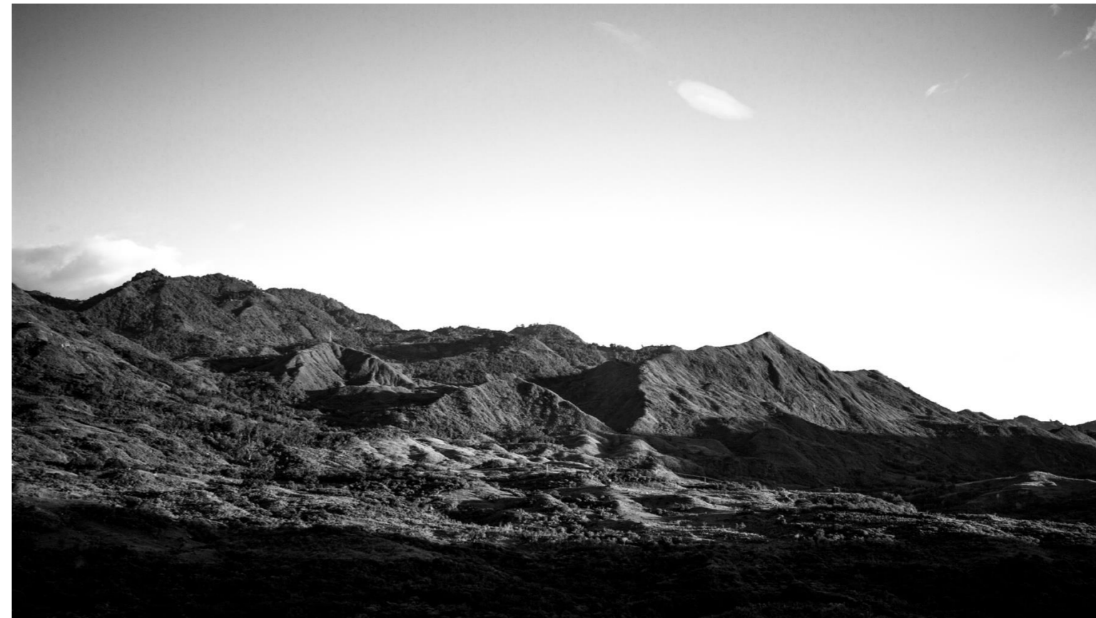
-Amanecer. Fotografía digital. 2019-