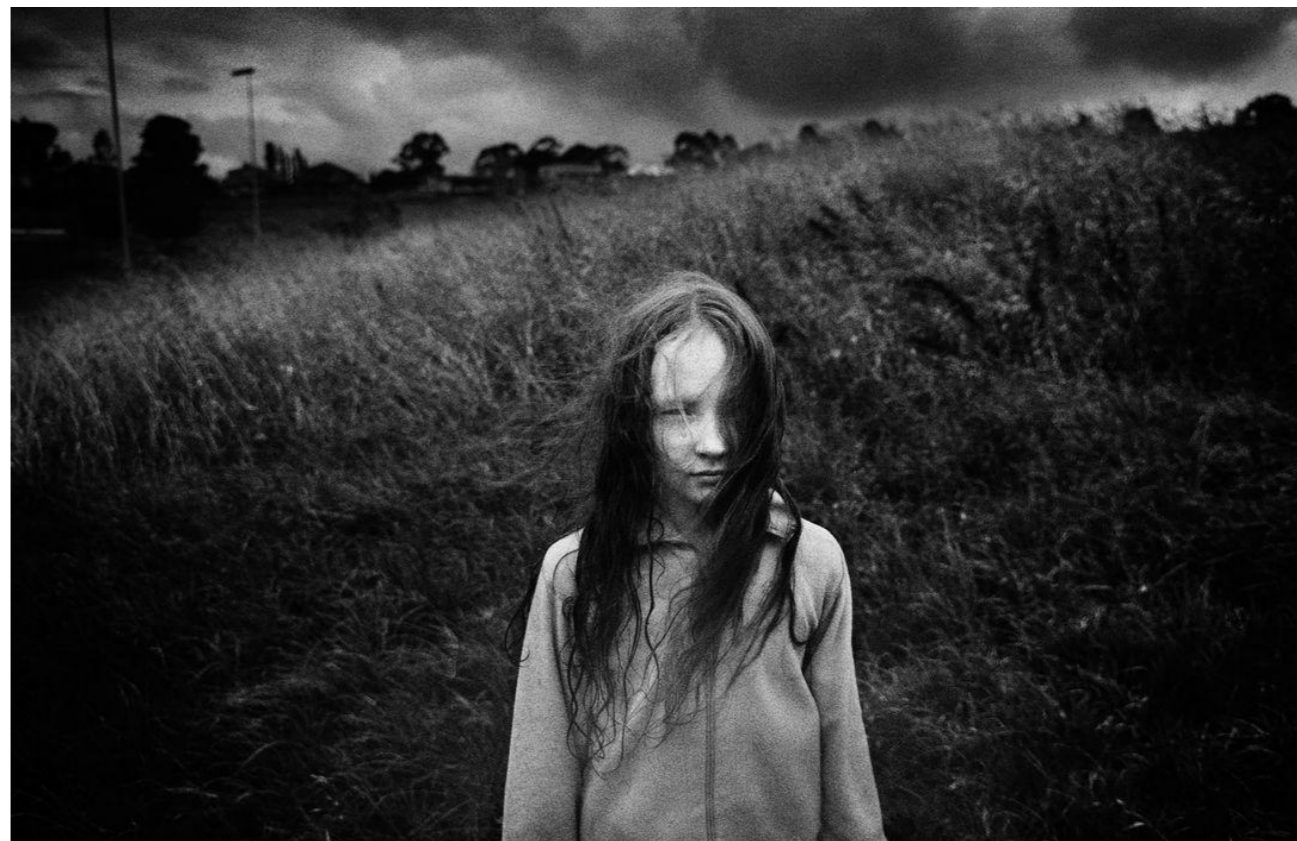
PARKE, TRENT. 2004. De la Serie Minutes to midnigh Victoria. Berwick Suburbs.Australia

Los cuerpos condicionan los espacios que habitan y por ende el paisaje estaría necesariamente ligado a la manera de transformación por la que pasa el cuerpo a través del tiempo; como paisajes olvidados quedan las marcas de los momentos, en lugares inexistentes en el tiempo, pero atrapados en espacios perceptibles por el recuerdo de la luz, la metamorfosis por la que pasan el cuerpo y el territorio a través de su camino a la ineludible muerte puede ser capazmente entendida por medio de experiencias que sobrepasan las sensaciones sentimentales, que sobresalen del corazón y que pertenecen a otro modo de ver el mundo.