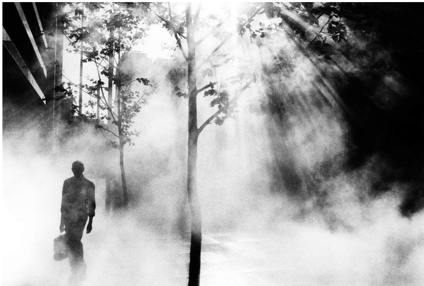
-PARKE, TRENT. 2001. De la serie Dream Life. AUSTRALIA. Sydney

Trent Parke, dirige su mirada a la presencia de un ente que habita un espacio con árboles a su alrededor, se observa como expresa Armando Silva “no el objeto ni la persona que se representa ante nuestros ojos, sino más bien su fantasma: su efecto de luz.” 9