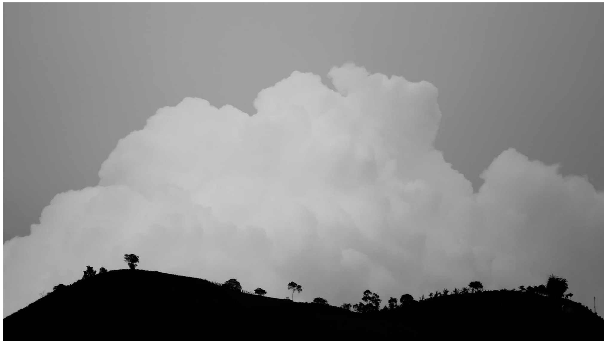
-Nubes. Fotografía digital. 2019-