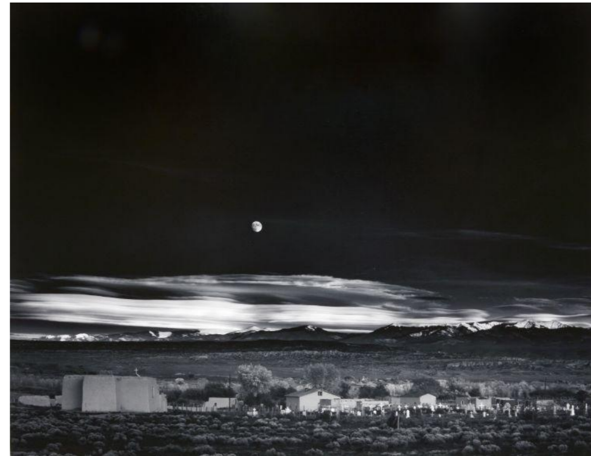
ADAMS, ANSEL. 1941. Gelatin Silver. Mural of Moonrise, Hernandez. New México.