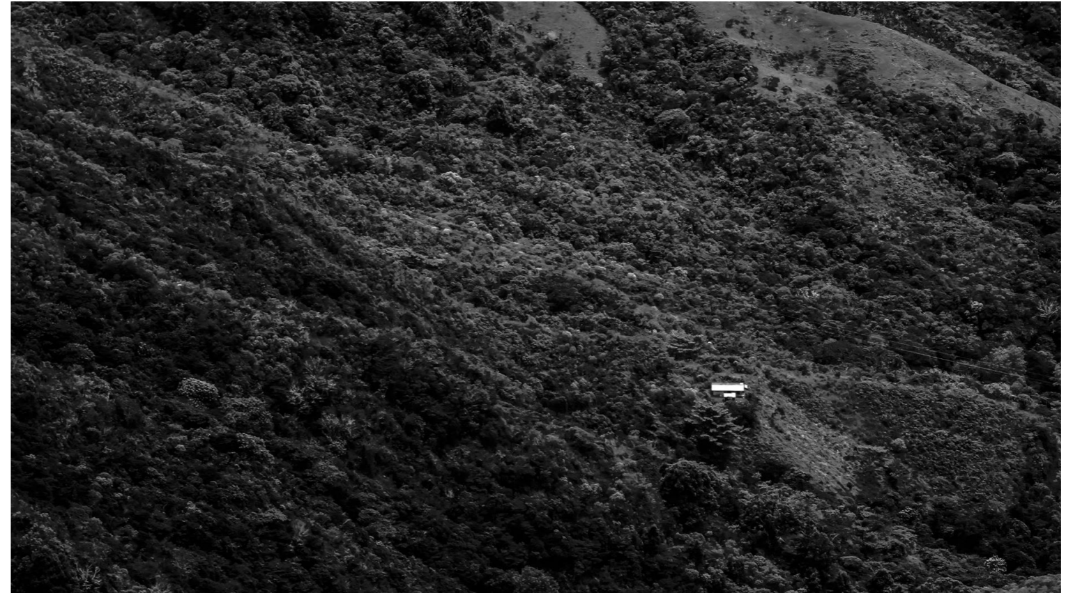
-Casa. Fotografía digital. 2018-