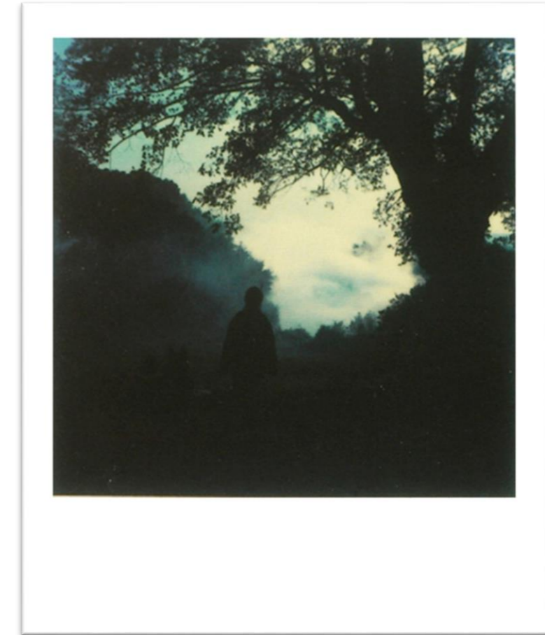
TARKOVSKI, ANDRÉI. 1981, POLAROID, RUSSIA. MYASNOYE.

Ahora bien, si de cierta manera en los momentos de silencio el observador no experto logra sentir pureza en las expresiones artísticas, puede llegar a dar por entendida la obra en su totalidad, si se siente vivo, eternamente estará conectado a ese pensar efímero que paso por su mente; las realidades corpóreas experimentadas por quienes configuran el quehacer y el ver artístico se ve ejemplificado en los estados naturales que conforman tanto el paisaje como el cuerpo, la relación entre el creador y la obra, la interacción entre el espectador y la luz que la emana, se convierte en la totalidad de los aspectos poéticos y físicos del arte, si la experiencia subjetiva acierta al entendimiento y al desarrollo de la obra de arte entonces habrá logrado su objetivo, penetrar en el subconsciente.