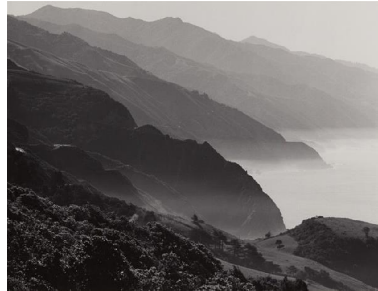
ADAMS, ANSEL. 1950. Gelatin Silver. California Coast South of Big Sur, ca.

Más allá de nuestros ojos está lo que no podemos ver físicamente, flujos de corrientes inexistentes pero que palpitan cada vez más cerca, estamos inmersos y atrapados entre las sensaciones corpóreas y la tierra, existe una belleza natural que nos conmueve o nos destruye pues es inducida totalmente por la fortuna que cada quien traiga consigo, los conceptos universales se expanden como la línea del horizonte en el vacío.