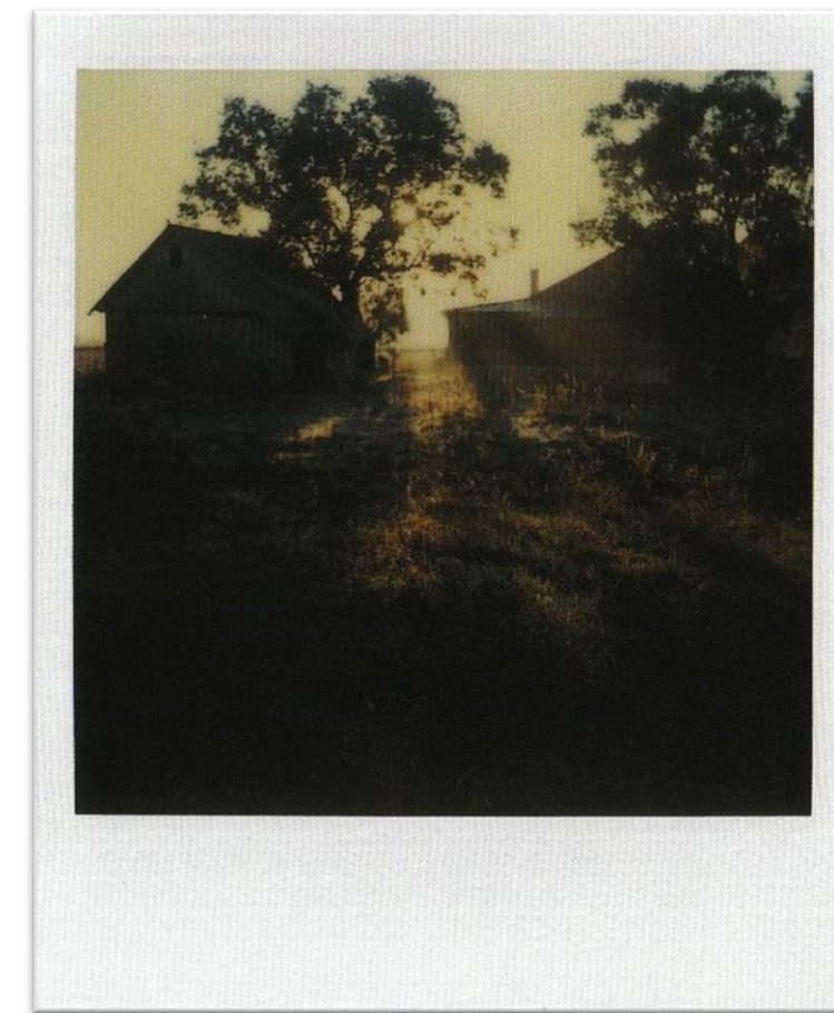
TARKOVSKI, ANDRÉI. 1981, POLAROID, RUSSIA. MYASNOYE.