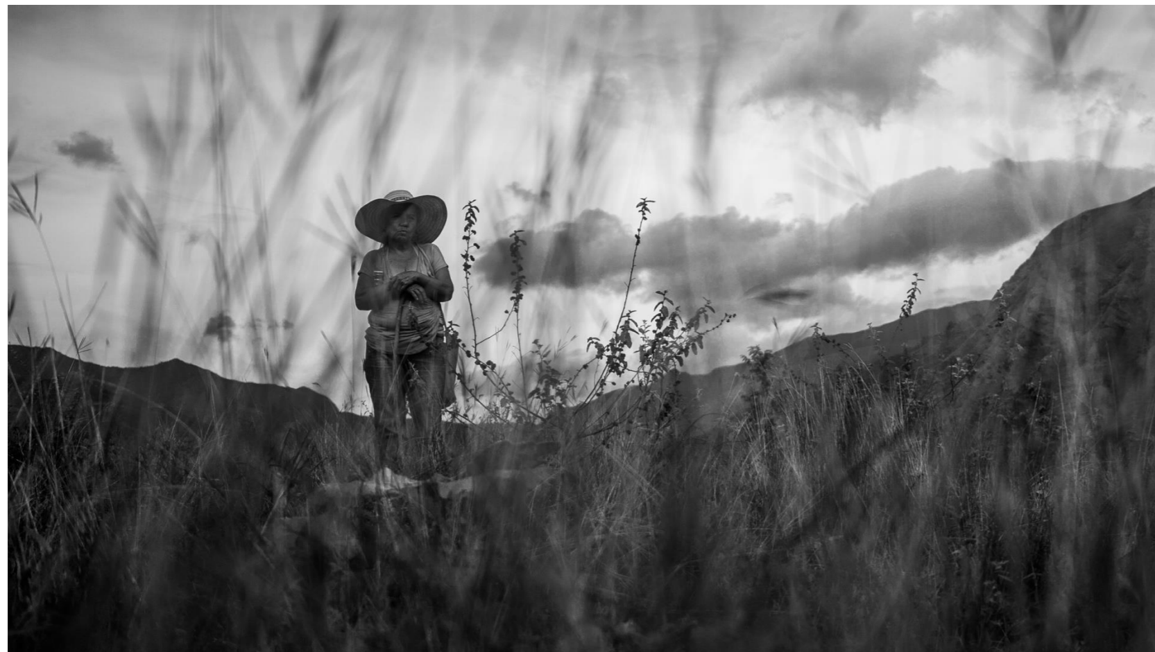
-Paciente. Fotografía digital. 2019-