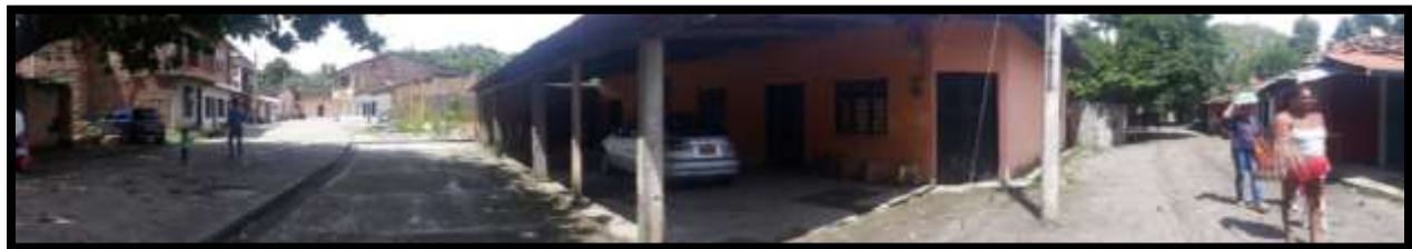
Imagen N°3: Patía, Cauca. Zona en donde vive Antonia

Fuente: Esta investigación. Fotografía tomada por: Valeria. Lugar: Patía, Cauca. Zona en donde vive Antonia y fue realizada la entrevista.