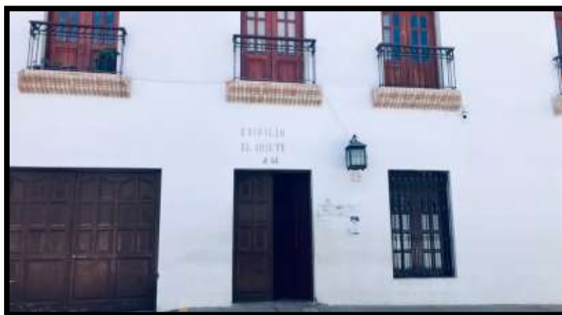
Imagen N°1: Edificio El Ariete de la Fiscalía, ubicado en Popayán, Cauca

Lugar: Edificio El Ariete de la Fiscalía, ubicado en Popayán, Cauca. Lugar en donde se realizaron las entrevistas de la fiscal y el investigador.