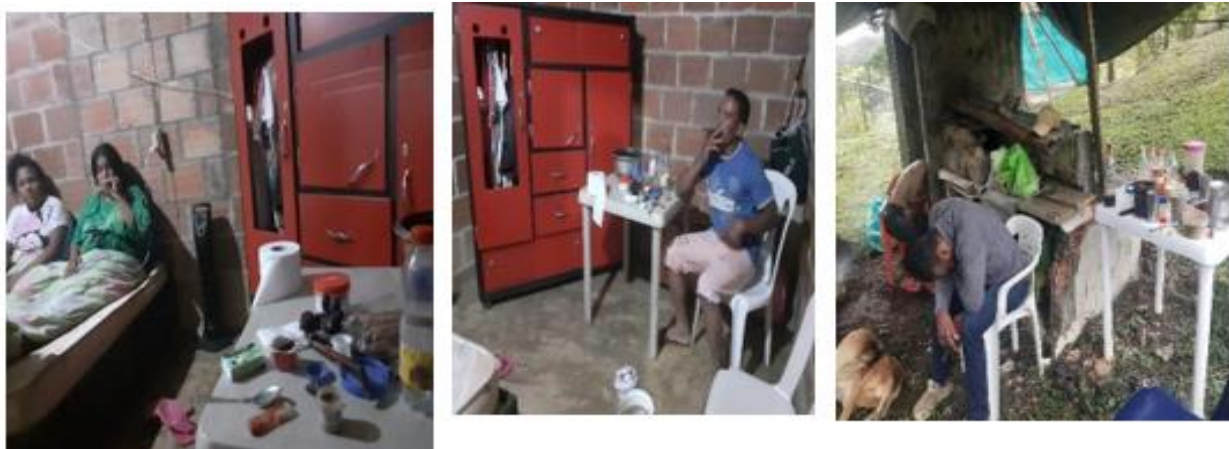
Fotografías recopiladas por el autor y autorizadas por la comunidad 2021