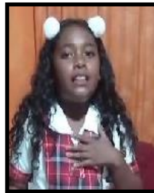
LAS TRENZAS Y AFROS, PEINADOS QUE PERMITEN LA IDENTIDAD AFRO EN NUESTROS ESTUDIANTES, MUJERES Y HOMBRES