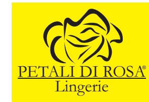
Fondo de color no corporativo claro