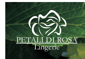
Fondo fotografico Oscuro