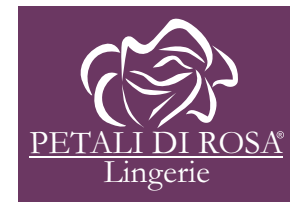
Fondo de color no corporativo oscuro