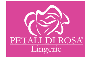
Versión Principal Negativo