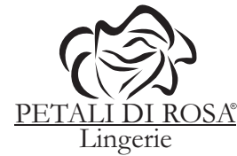
Versión Blanco y Negro