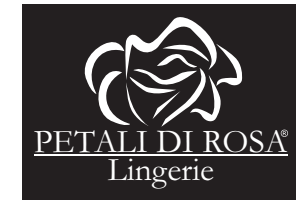
Versión Blanco y Negro Negativo