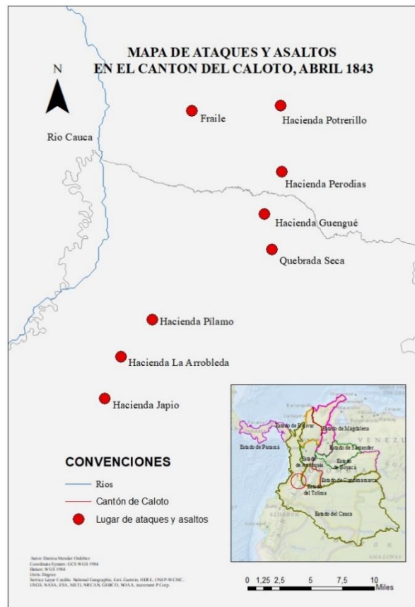
Mapa 1 Lugares de asaltos y ataques en la revuelta de abril de 1843