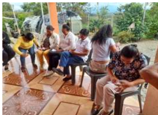
Escribiendo curiosidades sobre el mundo