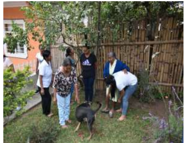
Mujeres caminando sobre el pasto.