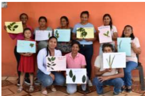
Finalización de la minga 6.