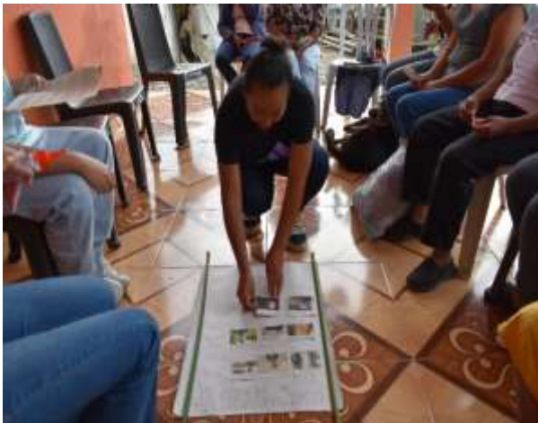
Identificando las pioneras del ecofeminismo.