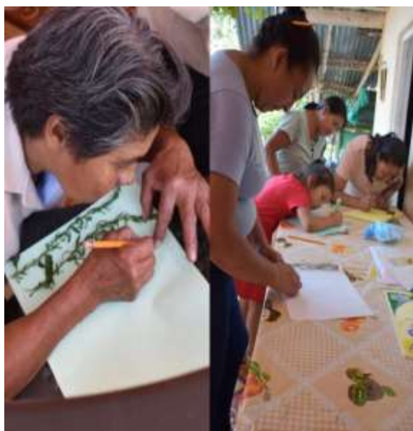
Realizando el herbario.