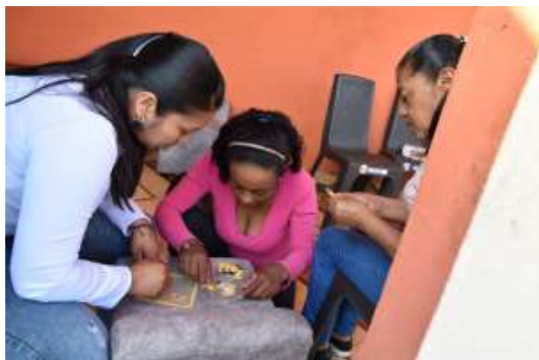
Actividad del rompecabezas.