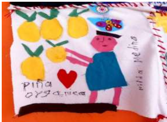
Colcha de relatos de la Sra. Hilda