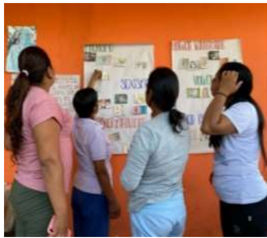
Actividad para Relacionar Conceptos