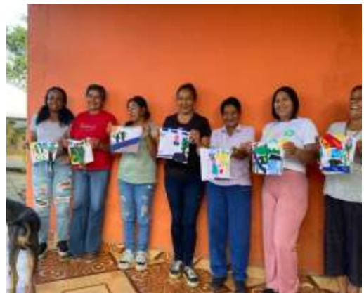
Avances de las colchas de relatos