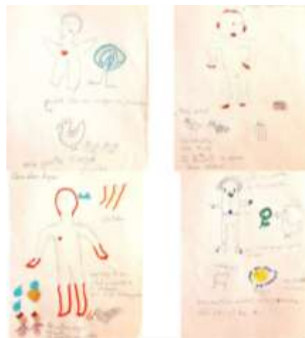
Cartografías del Cuerpo