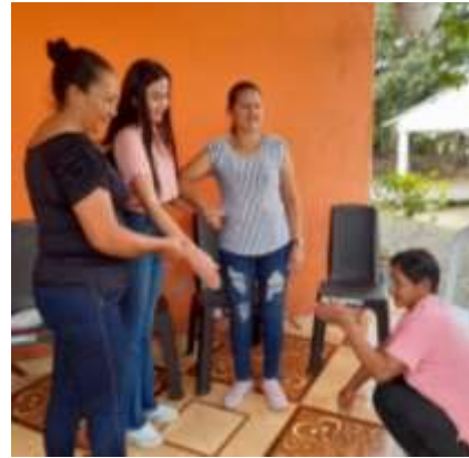
Dinámica el Escultor