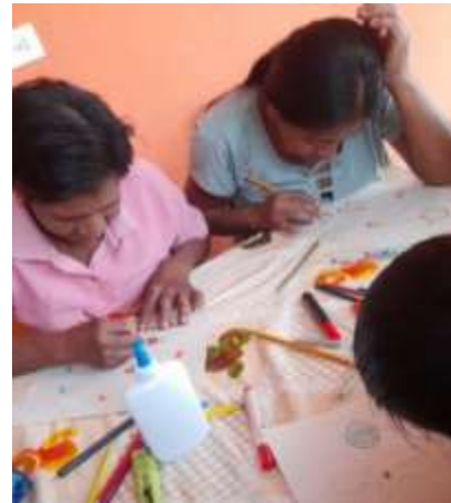
Realizando las cartografías