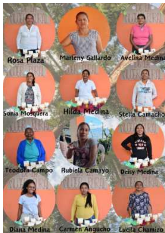
Mujeres de la Comunidad de Julumito