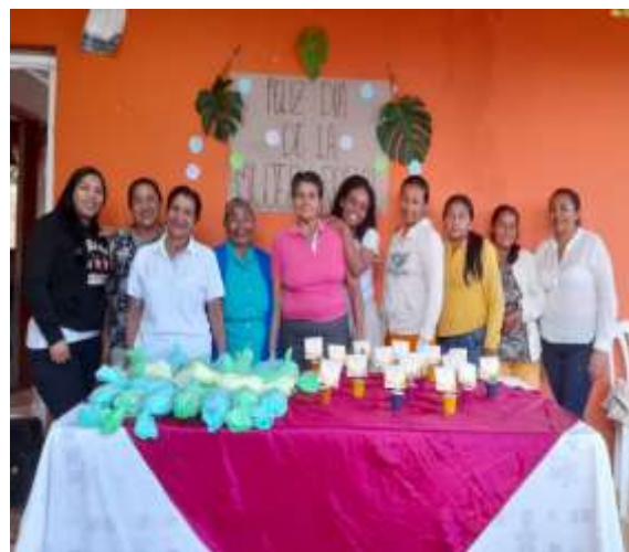
Conmemoración día de la mujer rural