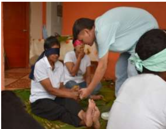
Actividad de relajación y estimulación de sentidos.