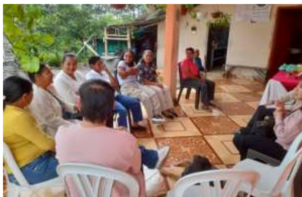
Escuchando la historia de vida