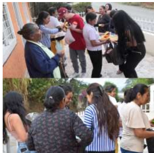
Actividad de Trueque