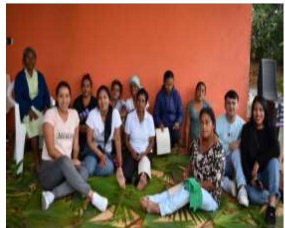
Final minga 5.