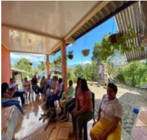
Inicio de la Minga de Pensamiento