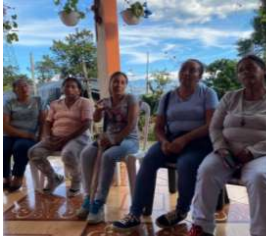
Exposición de las Posibles Soluciones