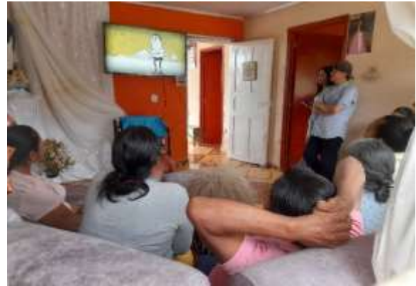
Actividad de concentración