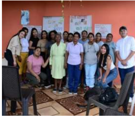
Finalización Minga de Pensamiento