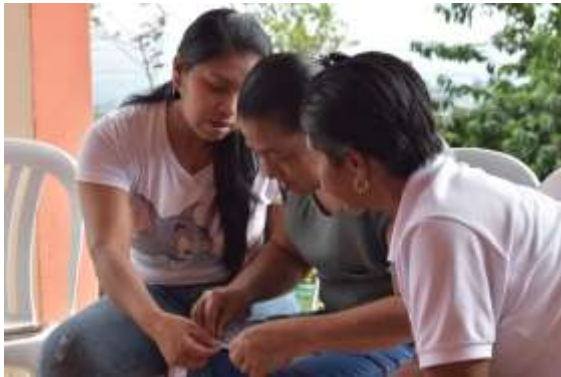
Tejiendo la colcha de relatos