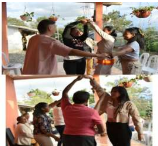
Creación de coreografías