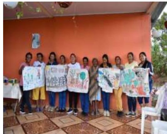
Fotografía de todas las pinturas