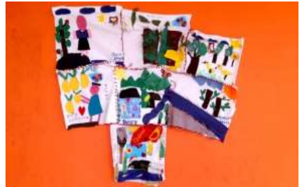
Colcha de relatos