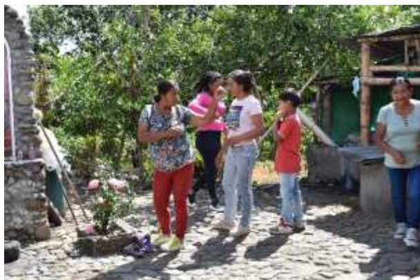
Buscando palabras claves.