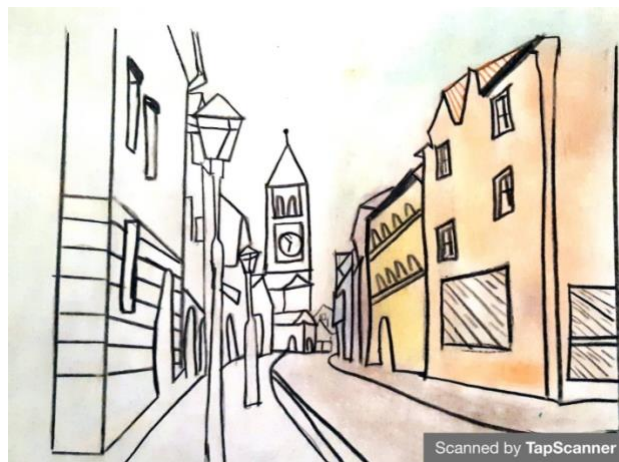
Dibujo actividad de dibujo