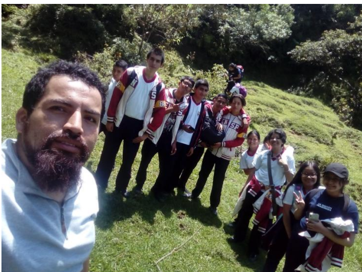
Imagen 5, visita vinera “vino loco” comuna 6 Popayán

Si tuviéramos claro que fue aprendiendo como percibimos que es posible enseñar, entenderíamos con facilidad la importancia de las experiencias informales en las calles, en las plazas, en el trabajo, en los salones de clase de las escuelas, en los patios de los recreos, donde diferentes gestos de los alumnos, del personal administrativo, del personal docente, se cruzan llenos de significación. Hay una naturaleza testimonial en los espacios tan lamentablemente relegados de las escuelas ( Freire, 2012 , p. 44).