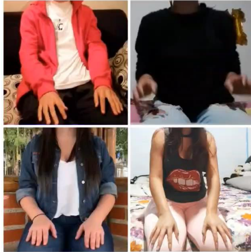
Actividad rítmica y sonoridad corporal