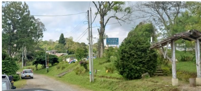
Interior camino de entrada Escuela Normal Superior De Popayán