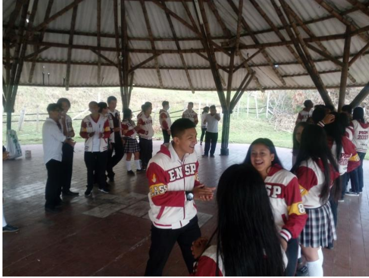
Actividad artística en el kiosco