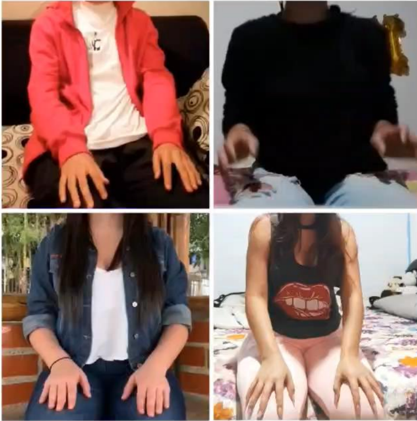
Imagen 4 sonoridad corporal y ensamble