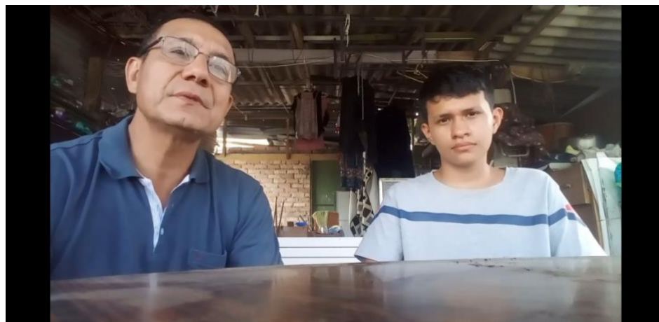
Actividad narración oral