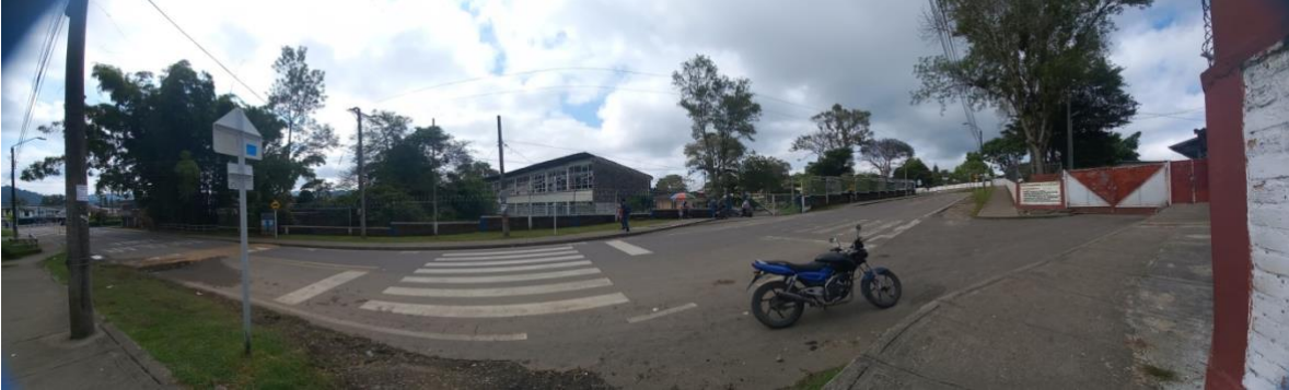
Exterior Escuela Normal Superior De Popayán