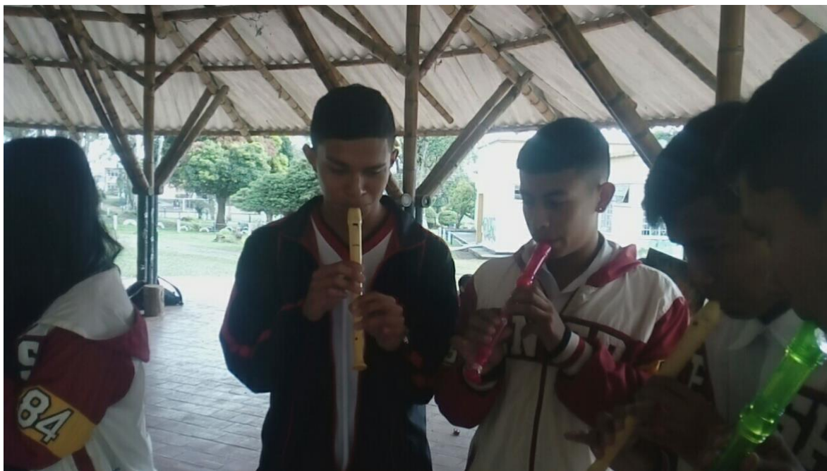
Imagen 3 ensamble musical improvisado

representado desde las sonoridades instrumentales como corporales.