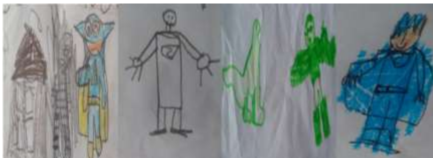
Dibujos de los superhéroes

Nota: Los dibujos de superhéroes también se analizaron como fuente de inspiración y motivación para los menores, al mismo tiempo que representaban como querían ser, con frases como: