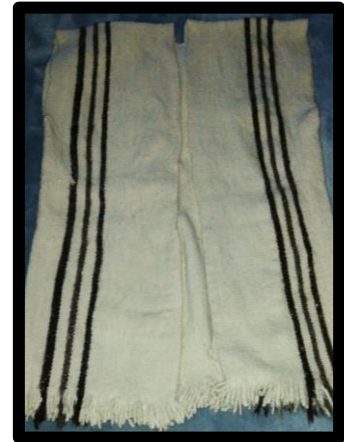
Ilustración 6. Capisayo o Turingo.

En el mismo evento hubo una exposición de artesanías como: ruanas, mochilas, chumbes, sombreros, con lo cual se pretende que los visitantes de otras comunidades aprecien y a la vez tengan en cuenta que aún se tiene viva la cultura y con mayor ánimo se dé continuidad a esta tarea emprendida”. (CRIC, Periodico Unidad Indígena. Unidad Alvaro Ulcue, 1990, pág. 3)