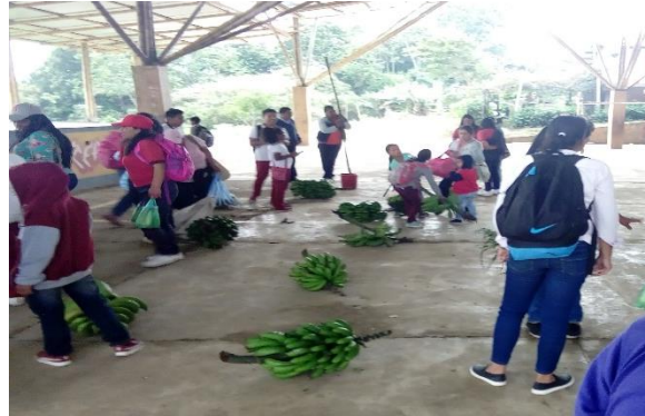
Ilustración 18. Trueque en las Delicias Buenos Aires.

Se realizó el trueque que también es una costumbre de todas las comunidades indígenas. Fue importante esta actividad porque la comunidad indígena de Totoró es de clima frío y por tanto sus productos también son de estas características; por otro lado, la comunidad de las Delicias se encuentra en un territorio de clima cálido y sus productos también varían.