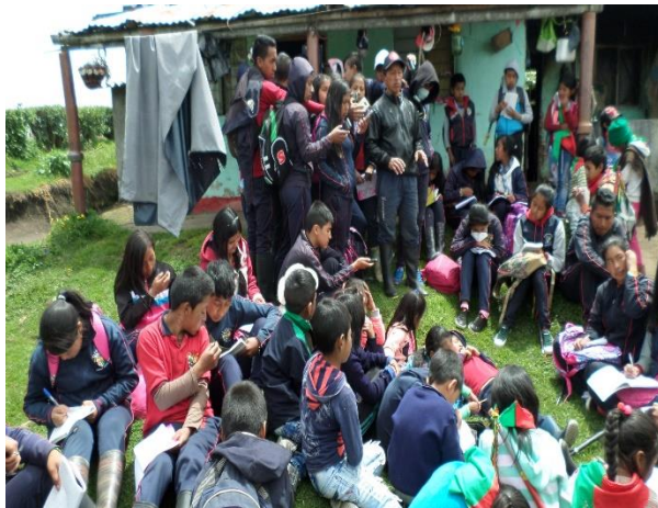
Ilustración 16. Conferencia con un Mayor Sabedor en su Vivienda.

Además de estas actividades que se van realizando en las veredas como Miraflores Bajo y Alto, Malvaza, Zabaletas. Se llevó a los estudiantes a participar de una ceremonia de refrescamiento en la Vereda las Delicias, Municipio de Buenos Aires y tiene una importancia histórica para el movimiento indígena, porque en este sitio también se inició la gesta de la creación del CRIC.