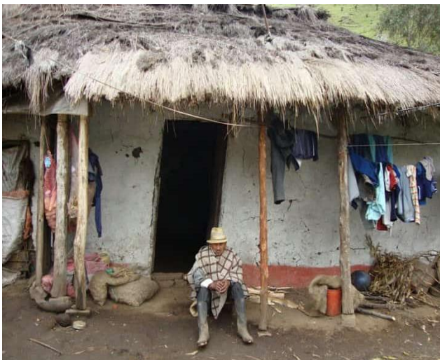
Ilustración 1. Casa Tradicional Pueblo Totoró

Namoi Kualmapik iskup amkun, Kilikmera pesenam+ntrap. (Revitalizando nuestra memoria, para no olvidar a nuestros mayores.)