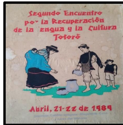
Ilustración 3. Segundo Encuentro por la Recuperación de la Lengua y la Cultura Totoró.

En el año de 1989 se realiza el segundo encuentro por la recuperación de la lengua y la cultura del resguardo, hecho este que significó el segundo momento en la realización de su proyecto de vida, que como lo manifiestan en los documentos se empezaron a direccionar mejor las acciones pertinentes para el trabajo comunitario y los inicios del proceso de educación propia. A continuación se encuentra lo que en el periódico de carácter regional del CRIC manifiesta sobre dicho evento.