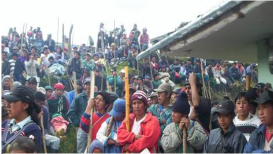
Ilustración 12 Asamblea Educativa Pueblo Totoró.

era lo que en verdad se quería. Debido a la división y diferencia entre los dos tipos de docentes (Comunitarios y Mestizos), fue muy difícil estar de acuerdo, unos querían el PEC y los otros el PEI.