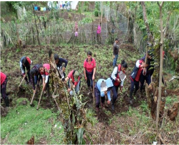
Ilustración 21. Minga en Huerta de un Líder.