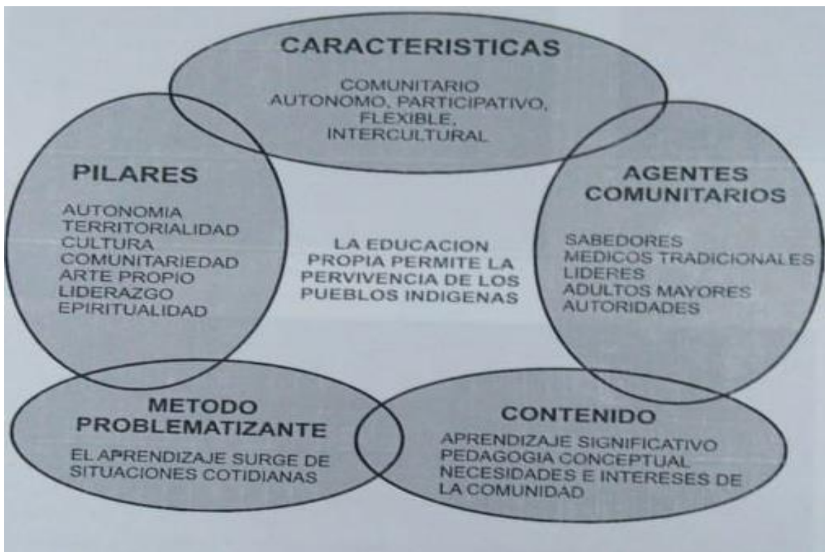
Ilustración 11. Estructura PEC.

A partir de aquí se puede hablar de una estructura del PEC, porque se determina en la propuesta lo que se debe hacer y cómo se debe hacer dentro de la institución educativa.