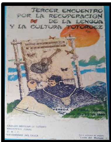
Ilustración 5. Tercer Encuentro por la Recuperación de la Lengua y la Cultura Totoró.

Este encuentro, al igual que el anterior, se llevó a cabo en la vereda La Peña, durante los días 21 y 22 de abril de 1990, con la participación nuevamente de los centros educativos del Resguardo y de otros invitados de diferentes corregimientos y otras comunidades que quisieron conocer el proceso que se lleva dentro de esta actividad.