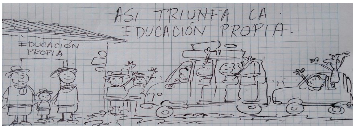
Ilustración 20. Caricatura Sobre Educación Propia.

“Llegara el día en que la educación propia se convierta en el transporte de las ideas de los pueblos indígenas”