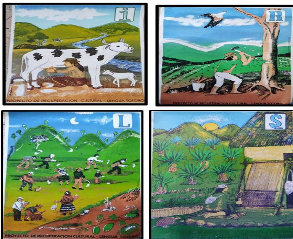
Ilustración 7. Láminas Educativas para la enseñanza de lengua Totoró.