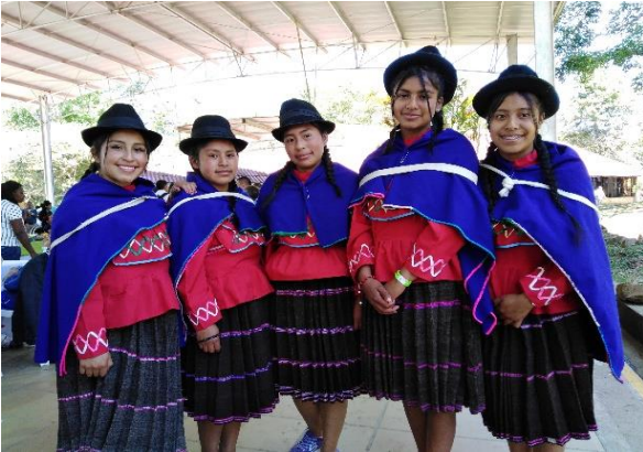
Ilustración 19 Grupo de Danza institución.

“Se ha de educar a todo el mundo sin distinción de razas ni colores. No nos alucinemos: sin educación popular, no habrá verdadera sociedad”