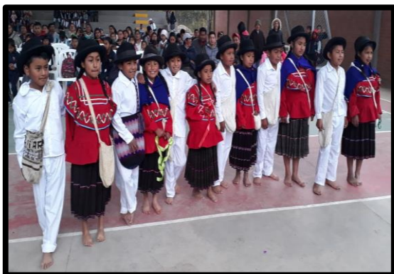
Ilustración 4. Vestido Tradicional Pueblo Totoró.

Igualmente hay que destacar la recuperación del vestido tradicional de la cultura Totoró (anaco hecho en lana de ovejo con varias listas y pañolón negro o azul para las mujeres y calzón blanco y turingo (ruana) para los hombres)”. (CRIC, Segundo Encuentro por la Recuperación de la Lengua y la Cultura Totoró, 1989, pág. 4).