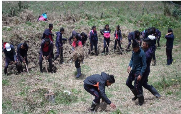
Ilustración 35. Minga de los Estudiantes en una sede escolar.