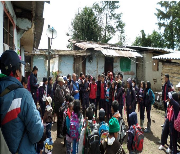
Ilustración 14. Conferencia de un Mayor Sabedor.

La autoridad tradicional está adelantando durante los últimos años eventos que tienen que ver con la retroalimentación del Plan de Vida, y de todos sus componentes. Está claro y se nota a partir de estas actividades que muchos docentes no están de acuerdo con este tipo de actividades, esto se refleja en la asistencia de algunos a encuentros, pero eso no ha frenado el deseo de otros de mejorar la propuesta del Cabildo por medio de la Coordinación de Educación. Se han adelantado visitas a las veredas con