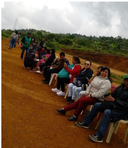
Ilustración 17. Ritual de Refrescamiento. Las Delicias. Buenos Aires.