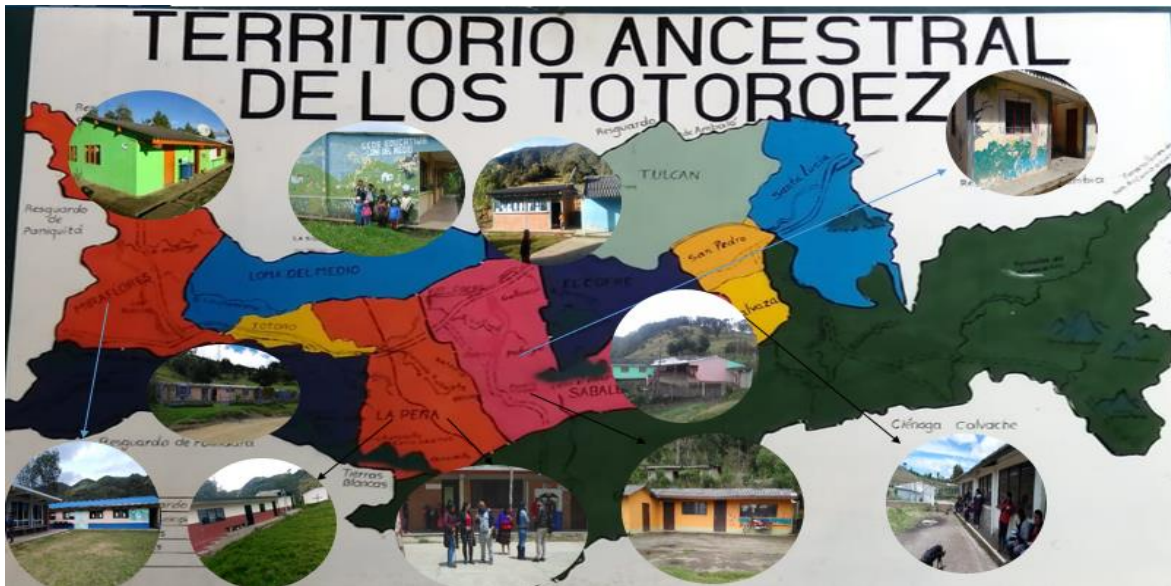
Ilustración 9. Territorio Ancestral Pueblo Totoroez y Sedes Escolares.

Luego de años de lucha por conformar una Institución de Carácter Indígena como había sido el sueño y el objetivo de líderes mayores de la comunidad, con la anterior resolución hacían aun comentarios: “los sindicatos grandes del país y del departamento, no estaban de acuerdo con la imposición de esta política educativa, ya que traería consecuencias negativas en contra de los trabajadores de la educación”, sin embargo y a pesar de todas las protestas que se presentaron en la época fue poco lo que se pudo hacer para frenar la propuesta y se empieza a aplicar la norma. Esta decisión trae como consecuencia la unificación de todas las mencionadas escuelas y pasa a convertirse en una de las instituciones más grandes del Municipio e inicia un nuevo reto que es la implementación del Sistema Educativo Propio en el territorio con el objetivo de mantener la lengua como principal característica del centro educativo.