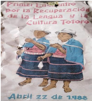
Ilustración 2. Primer Encuentro por la Recuperación de la Lengua y la Cultura Totoró.

Pasados 3 años después del inicio de la CECIB de San Rafael en la vereda la peña, y que su principal objetivo fuera el de recuperar y fortalecer la lengua Nam Trik, desde luego porque ya estaba en extinción, la autoridad propone darle un impulso a la enseñanza de la lengua tradicional, implementándose su enseñanza en todos los centros educativos existentes en el Resguardo. Además de esta propuesta el Magisterio de la zona y la Autoridad tradicional convocan al “1er encuentro por la recuperación de la cultura y la lengua Totoró”, quedaba escrito en el periódico “Unidad Indígena”, se realizaron eventos durante el día 22 de abril de 1988 en la vereda de Betania. También participaron de forma activa: