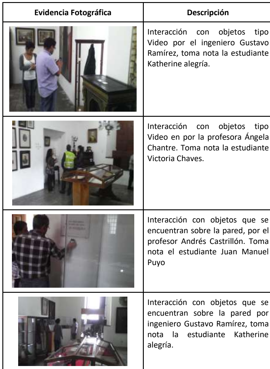
Evidencia Fotográfica Experiencia N° 1