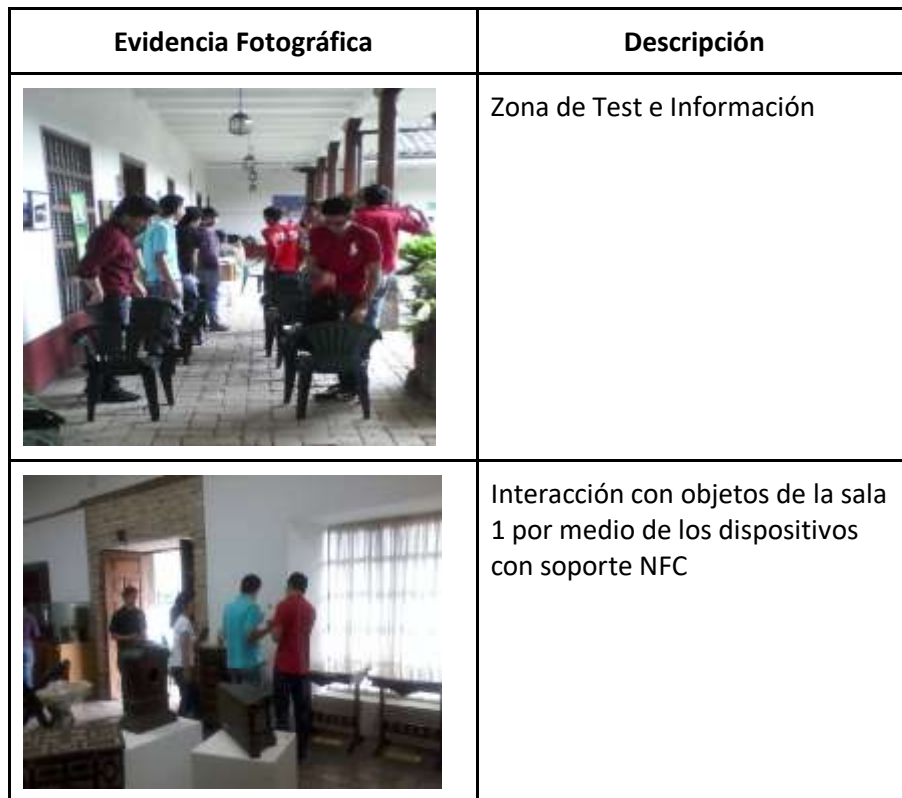
Evidencia Fotográfica Experiencia N° 4