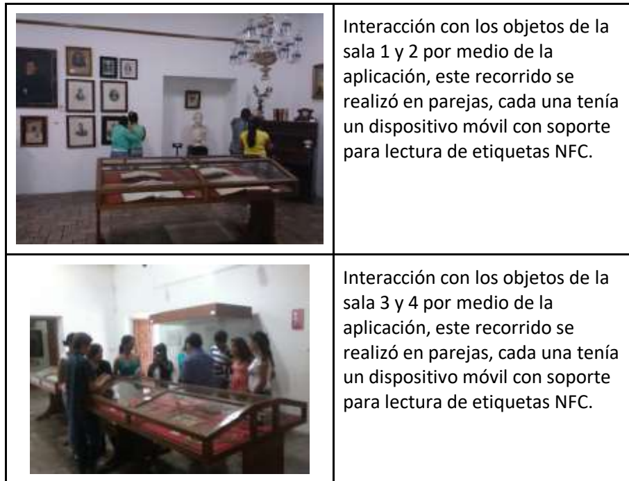
Evidencia Fotográfica Experiencia N° 3