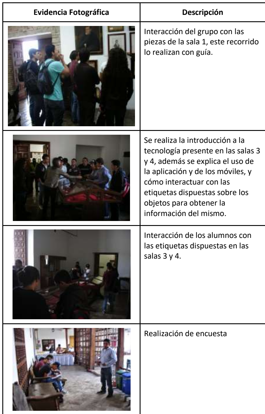
Evidencia Fotográfica Experiencia N° 2