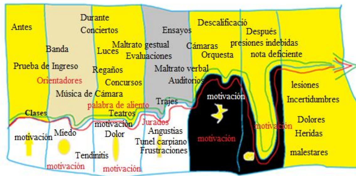
Figura 1 Pre-estructura sociocultural.

Sentimientos de inseguridad y baja autoestima, al enfrentar Audiciones en Público, cuando se ha estudiado poco, la observación personajes y escenarios no cotidianos.