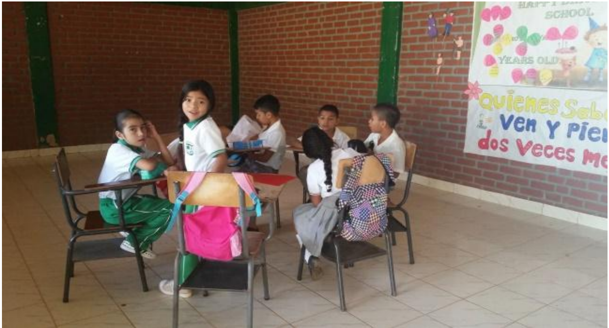
Foto 3. Taller de participación: estudiantes e investigadoras. Rivera, (2016)