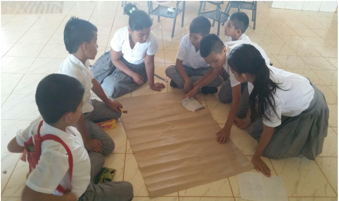
Foto 7. Talleres de Participación: estudiantes e investigadoras. Chilito, (2016)