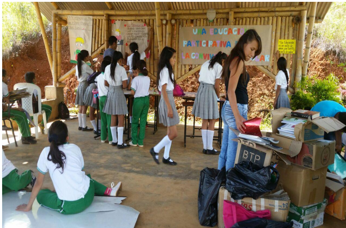
Foto 5. Educación Participativa, comunidad en general. Chilito, (2016)