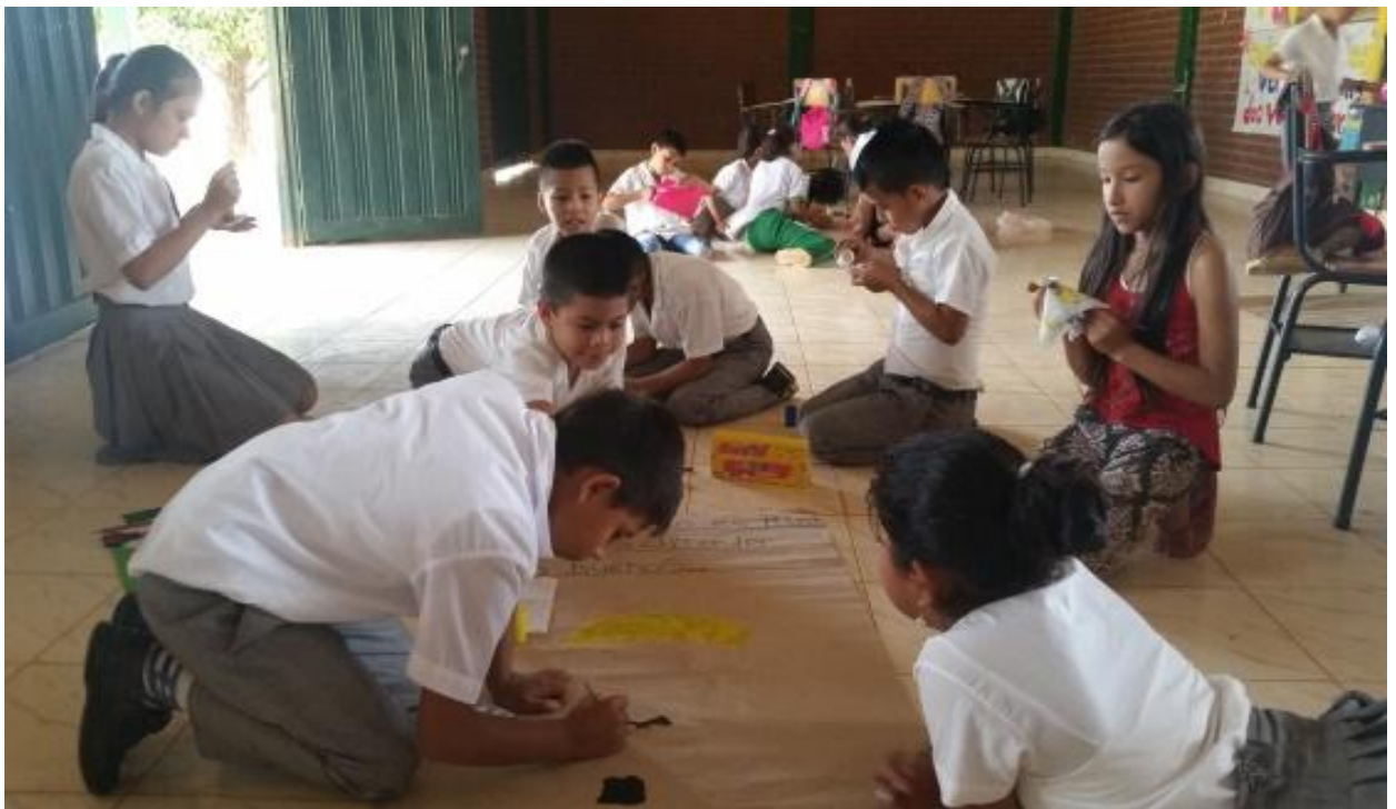
Foto 4. Taller de participación: padres de familia, estudiantes e investigadoras. Rivera, (2016)