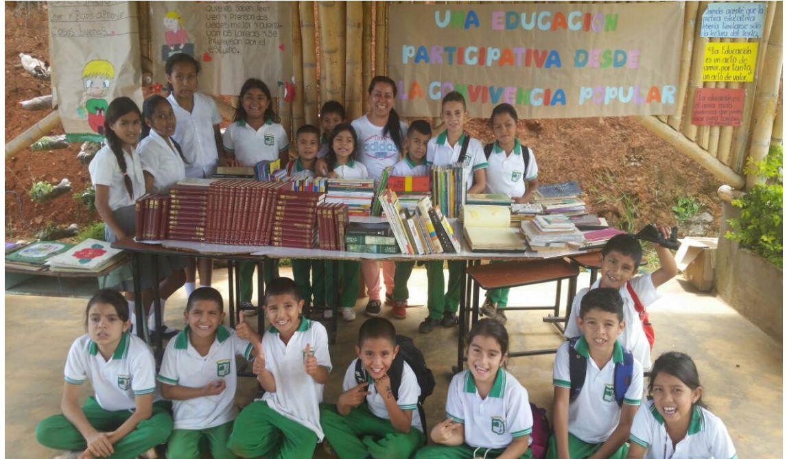
Foto 15. Educación Participativa, comunidad en general. Chilito, (2016)

Este objetivo: “Evaluar constantemente la organización, el pensar colectivo, interés, inclusión, sentido de pertenencia y producciones textuales de la comunidad educativa durante el proceso de participación en los espacios posibles de encuentro para la Convivencia Popular”, da cumplimiento al siguiente resultado: