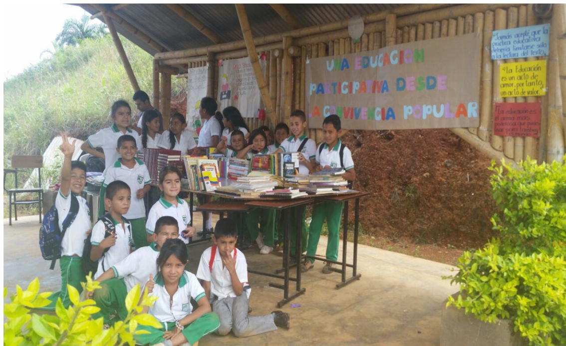
Foto 6. Educación Participativa, comunidad en general. Chilito, (2016)