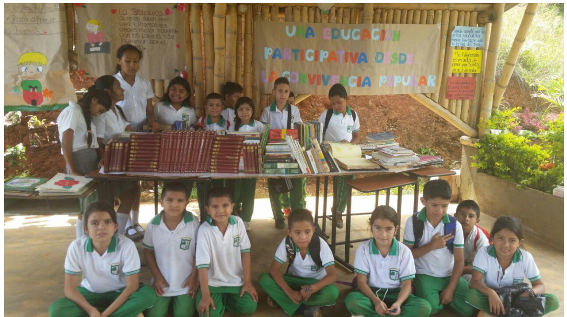
Foto 16. Educación Participativa, comunidad en general. Chilito. (2016)

para construirlo: “Es un encuentro que solidariza la reflexión y la acción de sus sujetos encauzados hacia el mundo que debe ser transformado y humanizado”. No hay diálogo si no existe una intensa fe en los hombres, en su poder de hacer y rehacer, de crear y recrear, fe en su vocación de ser más, que no es privilegio de algunos elegidos sino derecho de todos los hombres. Esta concepción implica una relación democrática, en la cual la educación está al servicio de los seres humanos para que se construyan a sí mismos, se transformen y fortalezcan sus capacidades para actuar en el mundo. Una posibilidad que se da en la medida que los actores amplíen su comprensión de la realidad, sólo posible por medio de una posición crítica, enmarcada dentro de procesos de reflexión.