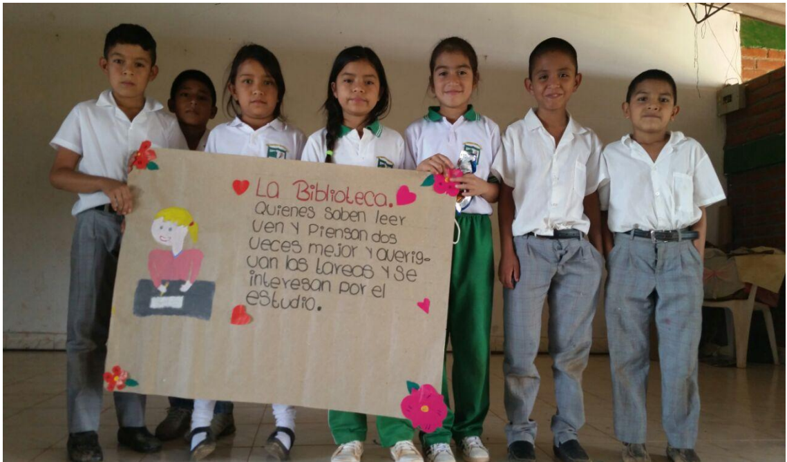
Foto 8. Talleres de Participación: estudiantes e investigadoras. Rivera, (2016)