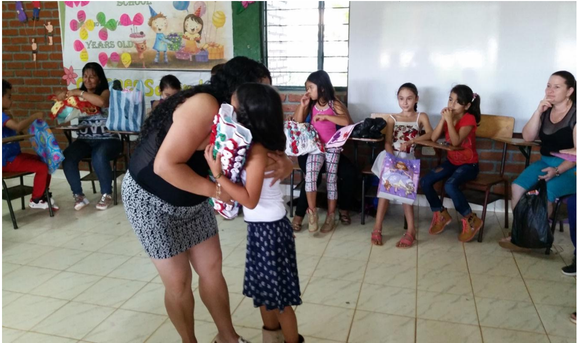
Foto 12. Talleres de participación: padres de familia, estudiantes e investigadoras. Rivera, (2016)

Esta convivencia popular como factor social, fortalece los procesos sociales ya que las personas son partícipes del proceso de una manera activa, crítica y reflexiva, pues ayudan a generar voz y acciones que han surgido de esa integración de la escuela como un espacio de transformación social, en donde todos y todas hacen parte del proceso como tal y de una u otra forma lo definen. Ya que el hecho de pertenecer a una sociedad, de vivir en comunidad, de interactuar con los demás, de establecer comunicación o algún vínculo de orden afectivo, laboral o académico da paso para que haya una Convivencia Popular.