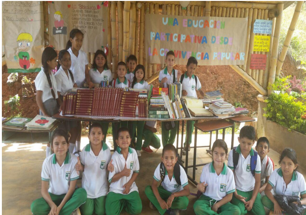
Foto 13. Educación Participativa, comunidad en general. Chilito, (2016)