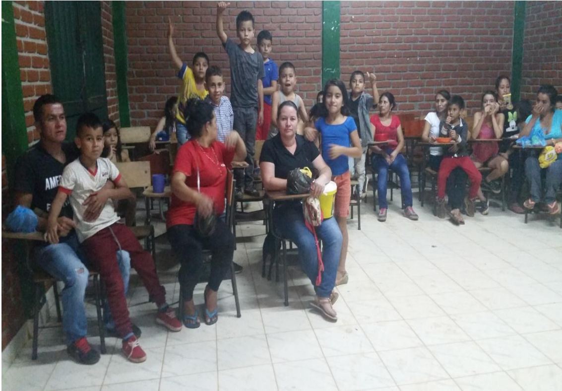
Foto 2. Taller de participación: padres de familia, estudiantes e investigadoras Chilito, (2016)

La Convivencia Popular en este caso fortalece los procesos culturales, donde se reconoce y se valora a los otros y a las otras, donde se dialoga para llegar a acuerdos y se escucha las inquietudes e intereses de los demás y se aprende a convivir con ellos y ellas. Es un proceso que se llevó a cabo a través de actividades como: Propiciar espacios de integración con la comunidad educativa, de tal manera que se den interacciones ante la problemática presentada. Llevar a cabo conversatorios con la comunidad educativa, opiniones, exposiciones e intercambio de palabras ante la situación. Realizar talleres prácticos, en donde se incluya la participación ciudadana para la Convivencia Popular. De esta manera se ha estado trabajando en grupo y los niños y niñas desde muy temprana edad comienzan a fortalecer y valorar el convivir en armonía y en paz.