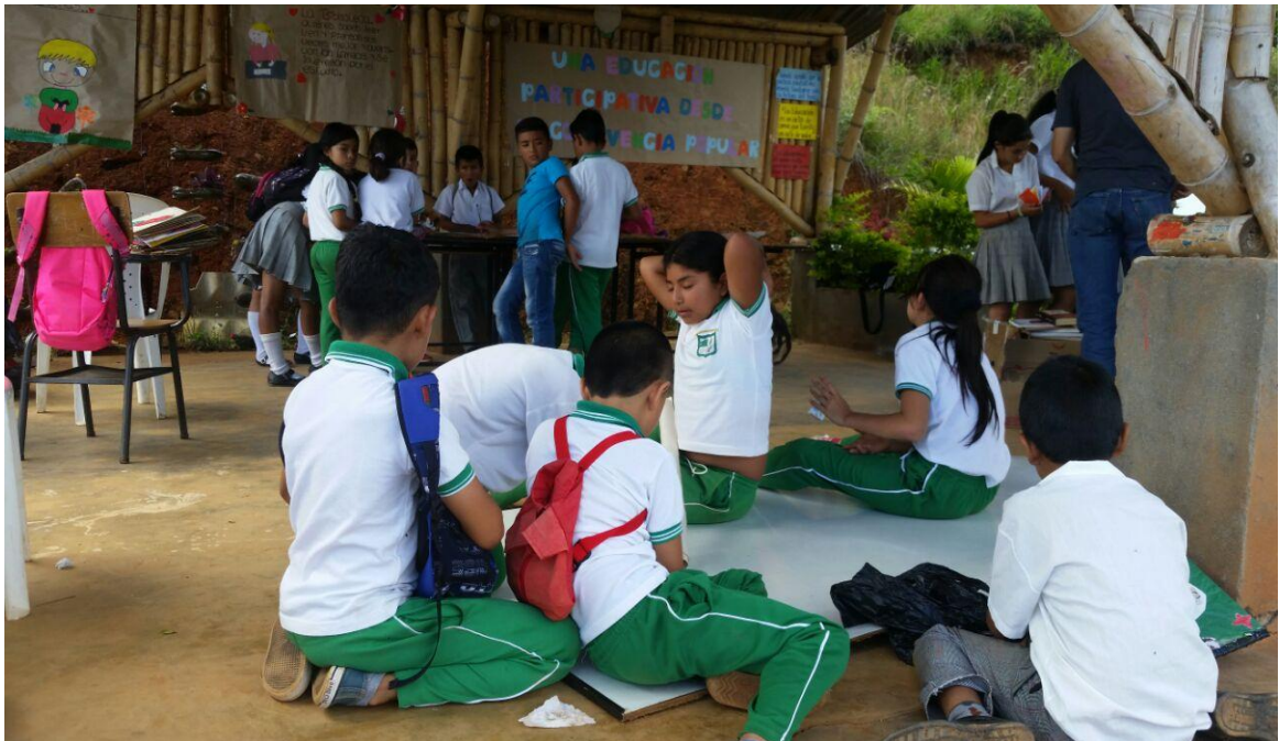
Foto 11. Educación Participativa, comunidad en general. Chilito, (2016)

Ese vivir con los demás se ha evidenciado como factor social, ya que ha permitido que no solo se dé una convivencia popular entre la comunidad educativa, sino que esta ha trascendido, ya que se han involucrado, padres de familia y líderes comunitarios, quienes estuvieron presentes, llevando la convivencia popular a una acción social, en donde se forma un círculo comunitario, ya que no es solo de la escuela que se den buenas relaciones, por el contrario, se trasciende a todo el contexto. Como un factor social en la convivencia popular ha permitido que se dé la participación de toda la comunidad, para construir cambios importantes entre la concertación y el diálogo de saberes, favoreciendo de esta manera el saber colectivo. Teniendo en cuenta lo que plantea Nájera (1986), la Educación Popular es un proceso que se vive, que se da a partir de la retroalimentación por medio del intercambio de ideas y experiencias de personas u organizaciones. En el cual se promueve al ser humano integral, desde una educación liberadora y transformadora de la realidad.