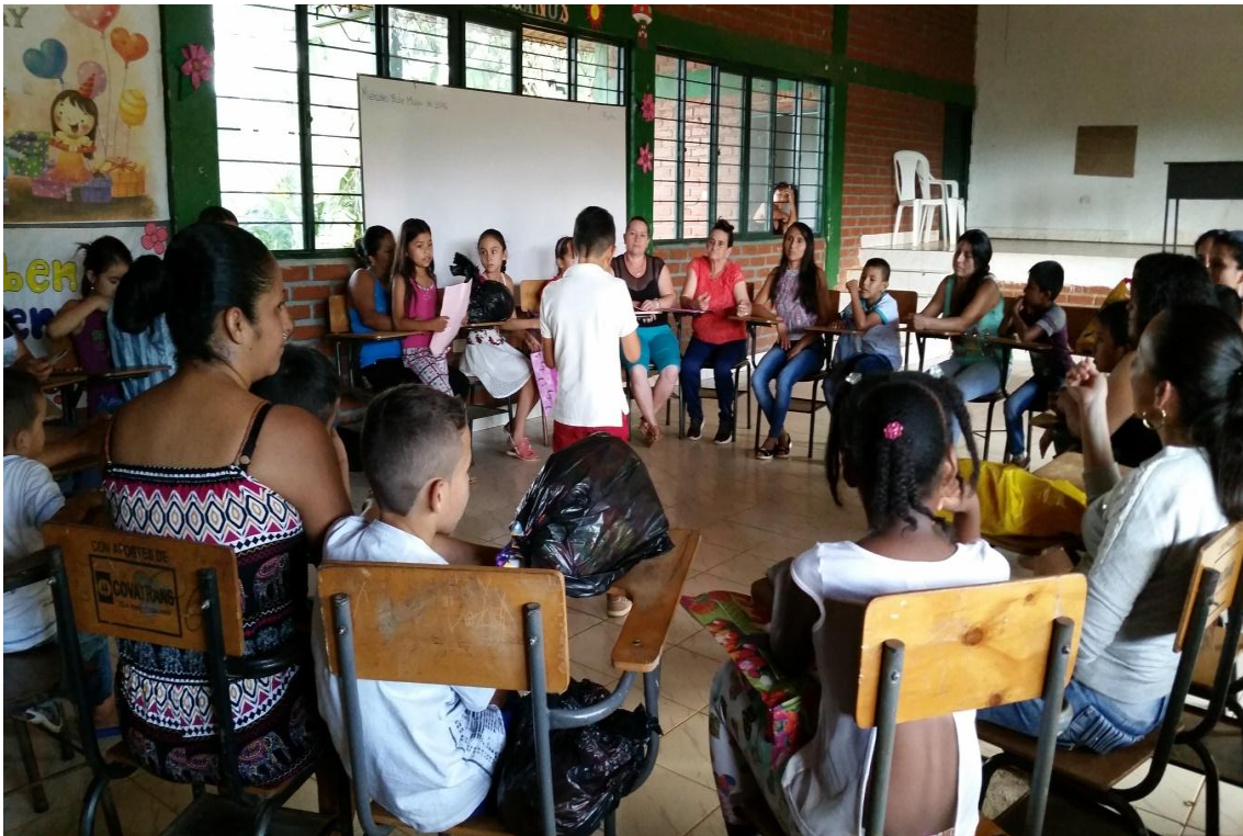
Foto 1. Taller de participación: padres de familia, estudiantes e investigadoras. Chilito, (2016)

región, teniendo en cuenta que la Convivencia “además de ser uno de los fines del proceso educativo, es el medio pedagógico por excelencia: el trabajo con la convivencia representa el camino ideal para alcanzar la humanización del proceso educativo” (Sarria, 2002, pag 89)