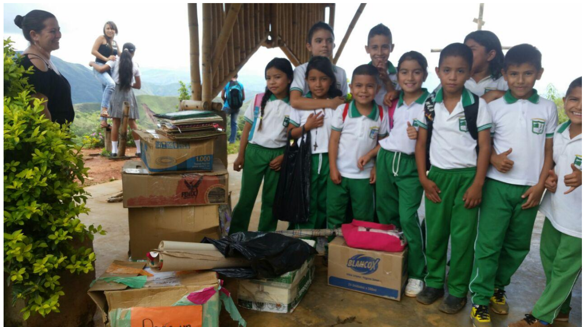
Foto 10. Talleres de Participación: estudiantes e investigadoras. Rivera, (2016)