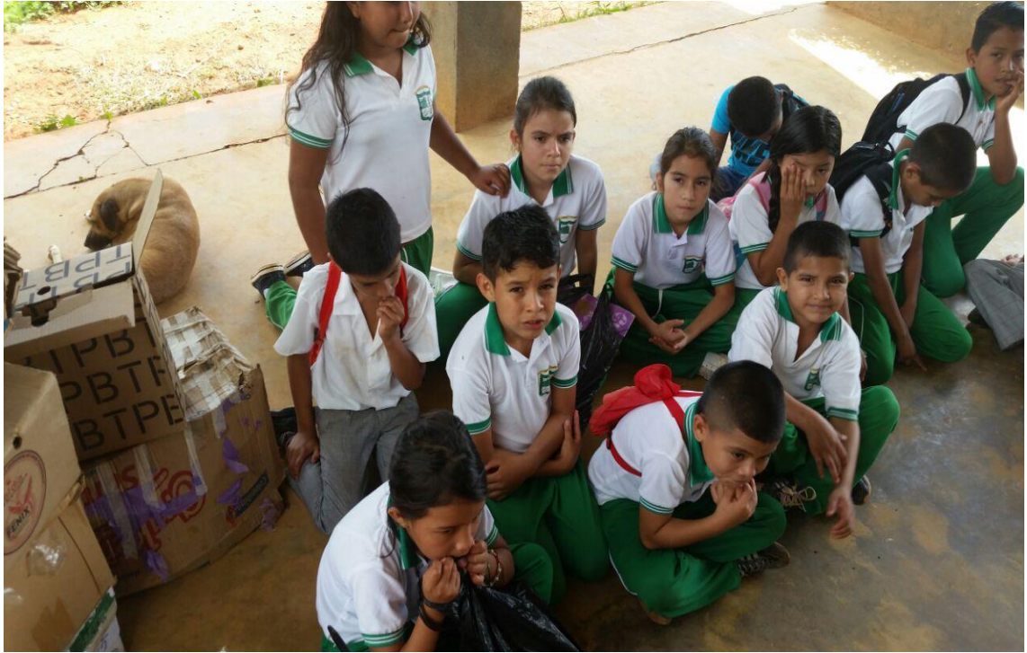
Foto 9. Talleres de Participación: estudiantes e investigadoras. Rivera, (2016)