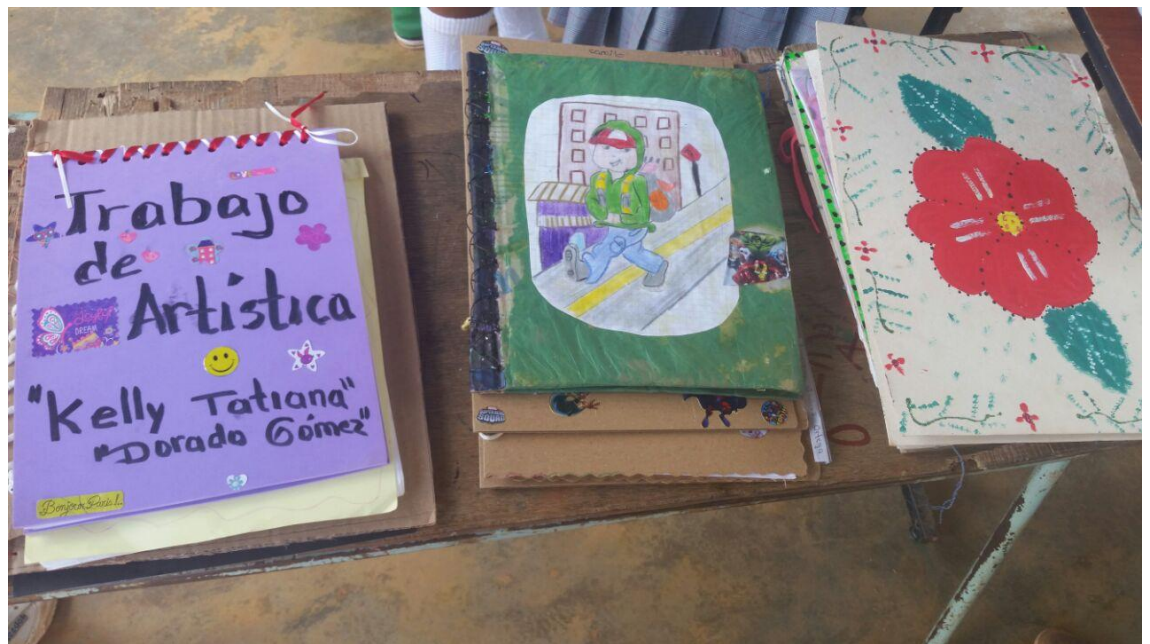
Foto 14. Educación Participativa, comunidad en general. Rivera, (2016)