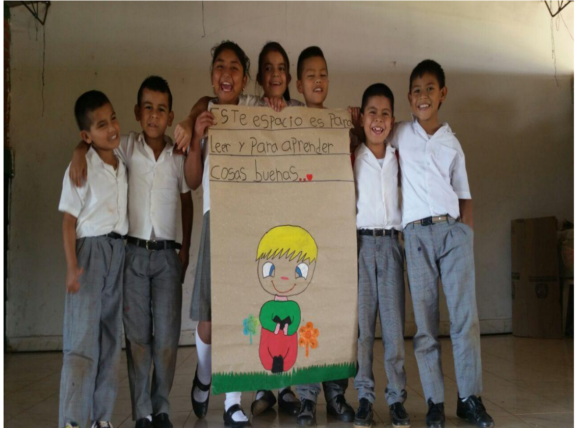
Foto 17. Educación Participativa, comunidad en general. Chilito (2016)