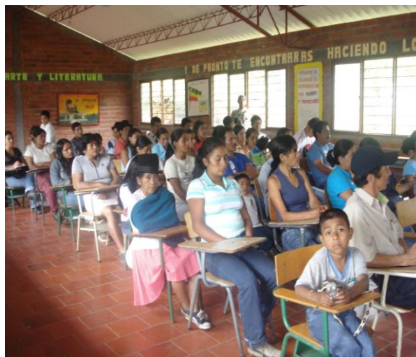
Foto 4. Reunión padres y madres de familia de la IE de Avirama