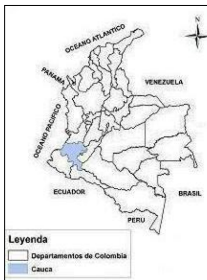
Mapa 1: Ubicación del departamento del Cauca en Colombia

El Resguardo Indígena de Avirama pertenece al Departamento del Cauca, localizado en el suroeste del país, el cual limita al norte con los departamentos del Valle del Cauca y Tolima, al oriente con los departamentos del Huila y Caquetá, al sur con los departamentos de Putumayo y Nariño, y al occidente con el Océano Pacífico. Fue creada por la constitución de 1986 (Ver Mapa 1).