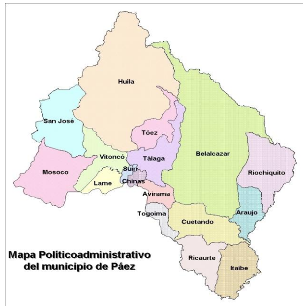
Mapa 3: División político administrativa del municipio de Páez