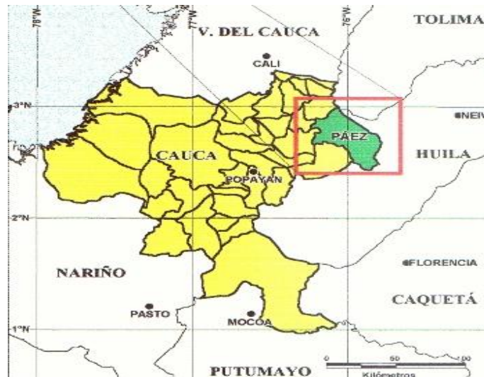
Mapa 2: Ubicación del municipio de Páez en el departamento del Cauca

El Resguardo posee una extensión territorial de 2.542 hectáreas, las cuales después de los años ochenta sufrieron un proceso de reconfiguración de nuevos poblamientos humanos, quedando conformado el Resguardo de Avirama por ocho veredas, que son: La Muralla, Chicaquiú Guaquiyó, Agua Bendita, La Mesa de Avirama, Centro de Avirama, San Miguel y Las Delicias. Esta última se constituyó por 23 familias damnificadas del desastre de 6 de junio de 1994, ubicadas en la comunidad de Río Chiquito al nor-orienté de Páez. 1