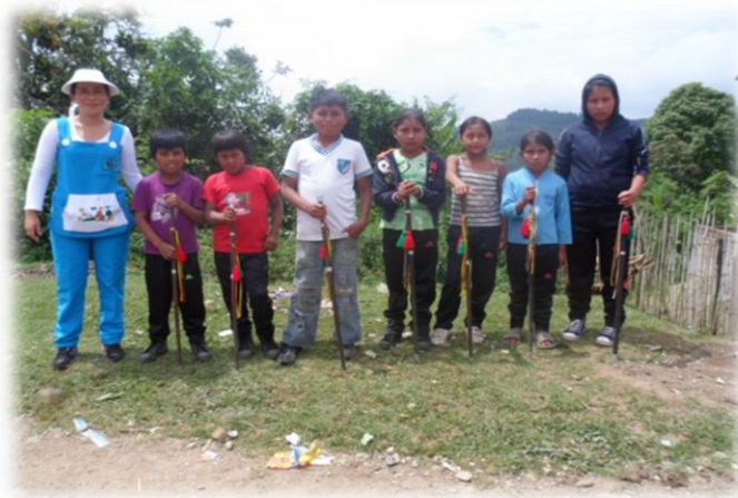
CABILDO ESCOLAR 2013

transcurrió en el tiempo previsto cada niño y niña pasa y señala, vota en blanco o nulo; después se contaron los votos de los candidatos y se leyeron los nombres de los cargos de cada uno de los representantes del cabildo elegido y el nombre de su gobernador, que en esta caso fue una gobernadora nombre que el año pasado nos acompañó como capitán del cabildo escolar 2012 y quien fue que saco una buena votación permitiéndonos mirar que en esta sede las niñas manejan ese poder de organizar y proponer actividades sencillas de soluciones a situaciones escolares; pero que en la realidad política- organizativa del resguardo de Caldonó, en la parte de la elección de los mayores no ha tenido ninguna gobernadora este resguardo.