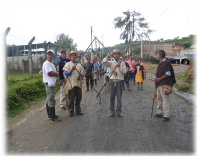
POSESION DE CABILDOS 2013

Todos muy pendientes de ubicarse para el desfile inicio a las 9:15 a.m. el llamado por sedes para salir por las principales calles de la población de Caldono, los guardias y las autoridades se colocaron en la parte de adelante del desfile, realizando un rombo con sus chontas, la cual simbolizaba el equilibrio y pensamiento del Nasnasa.