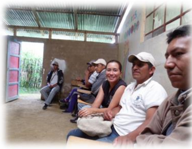
FOTOGRAFIA SAMARA GUZMAN ARMONIZACION DE DOCENTES 2013.

Al llegar al planeamiento de la institución se nos permitió a los Docentes, presentar propuesta de trabajo pedagógico para desarrollar en el cabildo para todo el resguardo; pues todos los docentes nos quejábamos de la funcionalidad y el espacio político de los Cabildos escolares de cada sede, entonces propuse diciendo que por qué no trabajábamos la propuesta de los cabildos escolares desde el grupo de educación del cabildo de Caldono, para que así se pudiera organizar partiendo de las inquietudes de cada sede. Y así fui socializando mi propuesta en un inicio a las autoridades y la comunidad educativa que nos acompañó, dejándonos como tarea reunirnos al grupo de educación cada martes en horas de la tarde. A partir de esa reunión, me quedaba faltando la socialización en mi sede la cual debería de permitirme la sistematización de la propuesta.