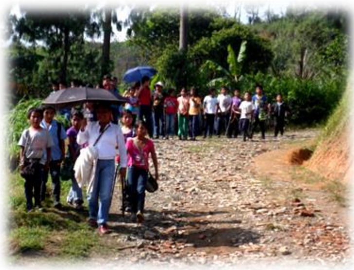
FOTOGRAFIA SAMARA GUZMAN TRABAJO POLITICO ZONA PLAN DE ZUÑIGA 2013

su sede, dando así el espacio para que los niños y niñas almorzaran y salieran temprano para sus sedes, ya que en esta actividad nos reunimos 350; dejando a los docentes con el compromiso de realizar una reunión para la socialización del orden del día de la posesión de los cabildos escolares, dejando hasta allí este trabajo de la socialización política y esperando que elijan a su cabildo escolar con del espacio del cateo.