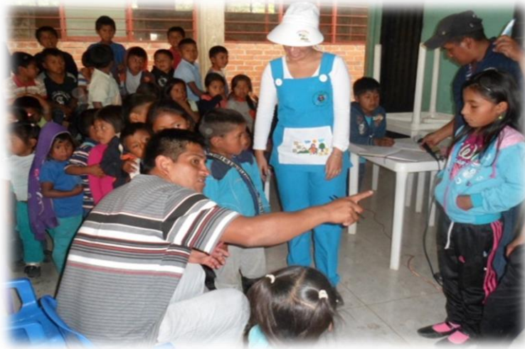
ELECCION DEL CABILDO ESCOLAR 2013