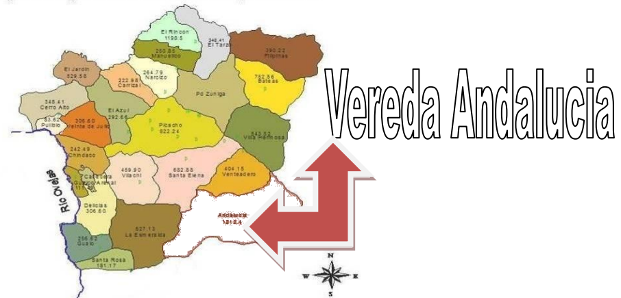
Resguardo Indígena San Lorenzo de Caldono y sus Veredas