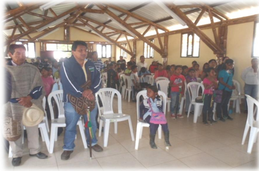
TRABAJO POLITICO ZONA PLAN DE ZUÑIGA 2013

A los ocho días se trabajó con el sector del clima caliente, se manejó el mismo orden del día; pero allá los niños eran más bullosos y difíciles de mantener la atención, por que salían y estaban del salón a todo momento.