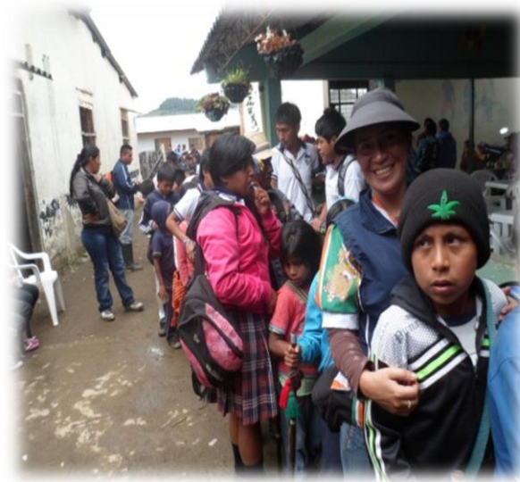
TRABAJO POLITICO SECTOR ANDALUCIA 2013

Al terminar el video, se realizaron preguntas sobre el porqué de la recuperación de tierras y la importancia de la unidad indígena; dejándonos a los docentes y estudiantes que los diferentes interrogantes para desarrollar en clases como el porqué de la simbología de los colores y formas del chumbe; ya que para el día de la posesión de los cabildos escolares cada gobernador se le entregara un chumbe, entonces me toco explicar el siguiente paso que íbamos a realizar en cada sede para la elección del cabildo escolar.