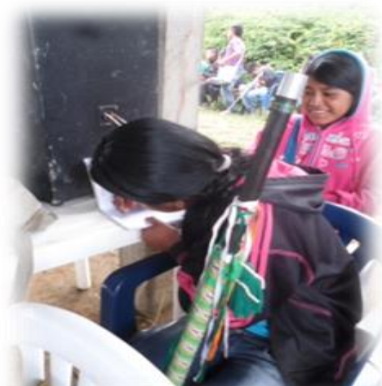
ENCUENTRO POLITICO-ORGANIZATIVO

En los siguientes años se empezó trabajando las armonizaciones de varas de autoridad, la posesión de los cabildos escolares con el acompañamiento del cabildo mayor, la simbología de las varas, la entrega y los encuentros de cabildos escolares del resguardo en un lugar adecuado y armonizado trabajando con los The walas de la comunidad.