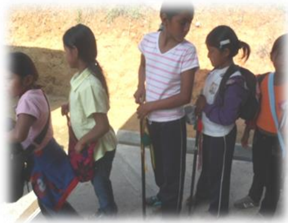
FOTOGRAFIA SAMARA GUZMAN TRABAJO POLITICO ZONA PLAN DE ZUÑIGA 2013