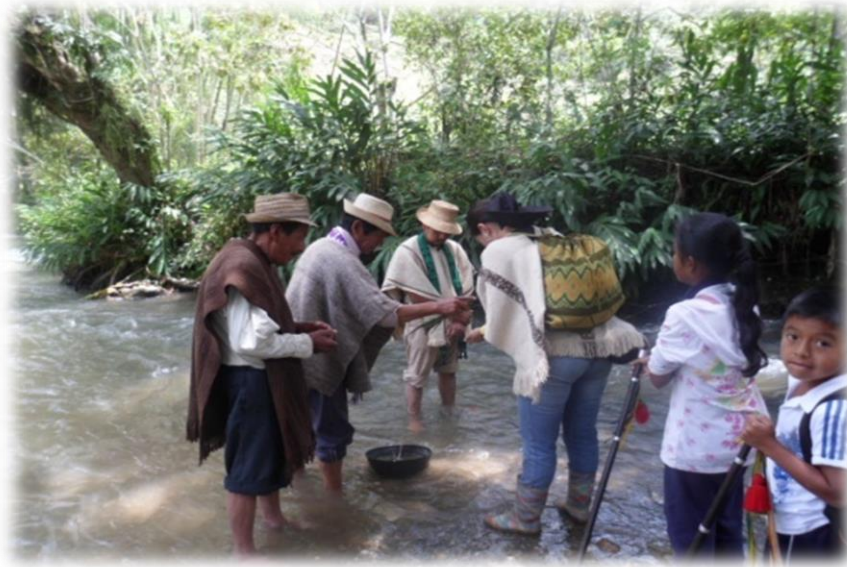
FOTOGRAFIA SAMARA GUZMAN

ARMONIZACION DE LOS CABILDOS ESCOLARES ZONA DE PLANDE ZUÑIGA