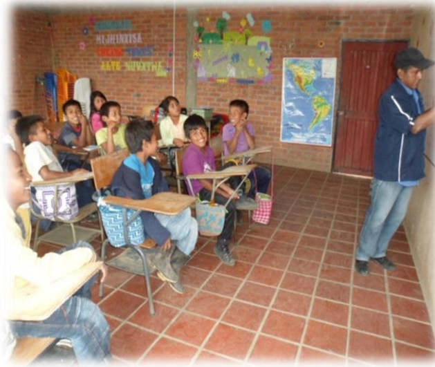
FOTOGRAFIA SAMARA GUZMAN SACANDO LOS NOMBRES DE LOS NIÑOS DEL CATEO 2013

o requisitos que debía llenar cada niño o niña era ser una persona juiciosa y que le gustara hablar en público; y los niños querían que sus representantes hablaran y no les diera pena.