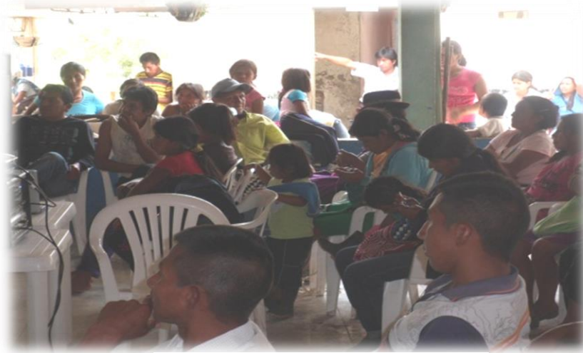
REUNION PADRES DE FAMILIA

En la sede del Centro Docente Andalucía, se realizó un trabajo comunitario para el colegio y después de ello se me permitió en unos minutos contarles a los padres de familia que estábamos haciendo con los niños y niñas referente a los cabildos escolares para el manejo político, permitiéndome que la comunidad conociera propuesta que se estaba trabajando, algunos entre su cansancio les gustó la idea y las personas mayores eran como las más interesadas y preguntaban que si el cabildo nos estaba acompañando en el proceso para el fortalecimiento, dándome a entender de que si era de su agrado lo que estábamos realizando, dejando así a los a la comunidad la información de lo que se estaba trabajando con sus niños y niñas en lo político-organizativo.