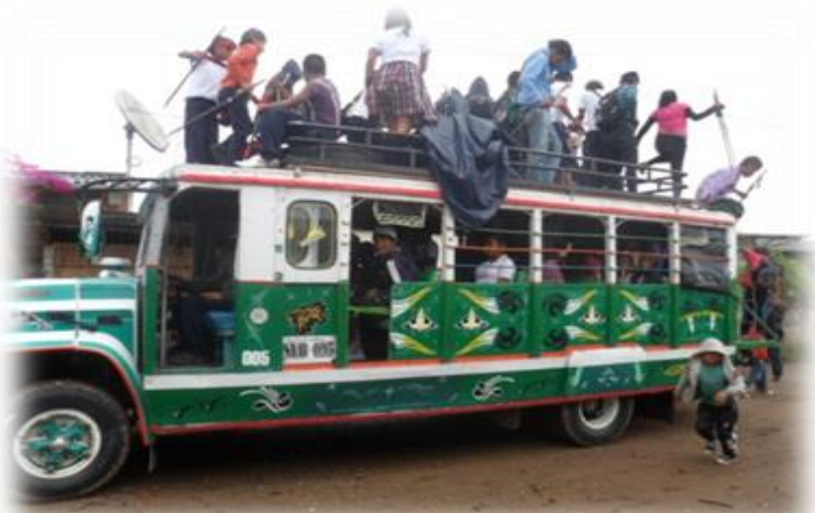
RECIBIMINETO PARA EL TRABAJO POLITICO SECTOR ANDALUCIA 2013

El día 14 de enero de 2013 los niños y docentes fueron informados para cuando se debía llevar a cabo la socialización política, ese día el The Wala dio el cronograma de fechas para poder iniciar con el trabajo; recibiéndonos esa mañana la vereda Andalucía con una lluvia a la cual nos permitía mirar todas las montañas que la acompañan de un verde tan natural y hermosa que los niños muy sonrientes y juiciosos recibieron su café con masas y se ubicaron para iniciar la actividad propuesta para el día.