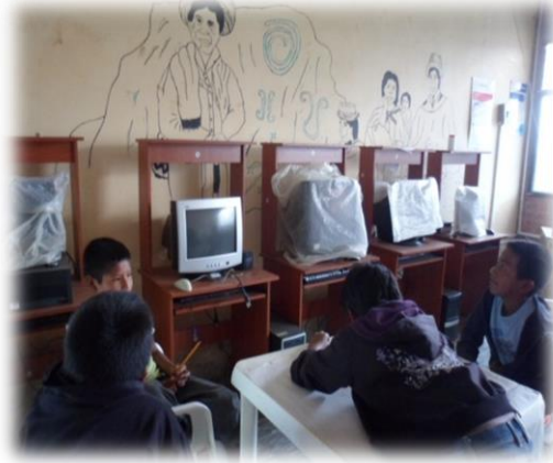
FOTOGRAFIA SAMARA GUZMAN