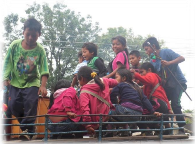
FOTOGRAFIA SAMARA GUZMAN

Mis ojitos se cerraban pero al fin termine y llego el amanecer con una llovizna que nos permitió darle gracias a la naturaleza por refrescarnos y recordarnos que somos parte de esta mundo natural; las chivas pitaban y los niños iban llegando a la casa del cabildo, los compañeros de la comisión listos para recibirlos, darles el refrigerio y recoger las firmas para dar la boletas del almuerzo por sedes.