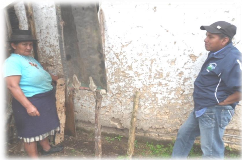
FOTOGRAFIA SAMARA GUZMAN BUSCANDO AL THE WALA