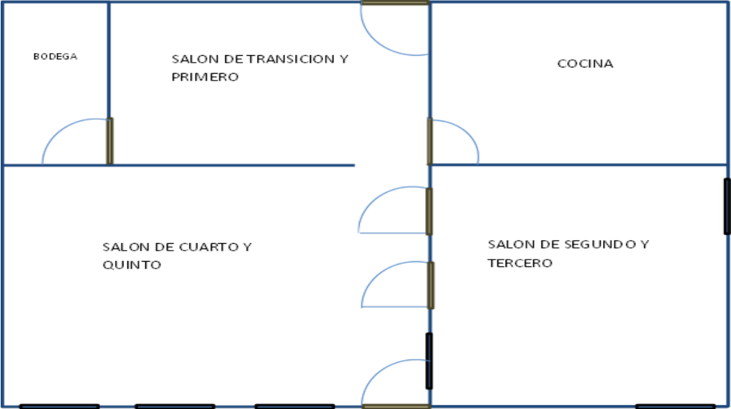
Figura N° 3 Escuela Las Huacas