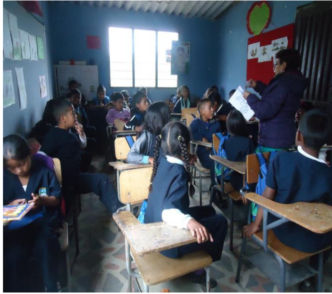
Foto No. 4 niños de segundo y tercero recibiendo clases, archivo personal 2013

Sus paredes, sus puertas y ventanas un poco deterioradas por el tiempo, reflejan los años de abandono y desinterés del gobierno, pareciera que la pintura de sus paredes se hubiera asomado un día para nunca más volver, tal vez lo que aún se encuentra en buen estado es el piso reflejo de la calidad del material con el que se hizo (baldosa), y aunque percutido y mugriento por el contexto, o quizás porque aun en sus 8 o 9 años de vida los niños y niñas aún no saben barrer o trapear, o quizás tal vez por lo turbio del trapeador cuya blancura solo se pudo ver el primer día de su estreno.