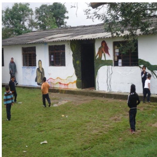
Foto No. 2, baterías sanitarias, archivo personal 2013 Foto No. 3, salón comunal escuela primaria archivo personal 2013

Se encuentra ubicada en el salón comunal a escasos 5 minutos del colegio en un pequeño plan, a unos 100 metros de la carretera, desde donde no es visible, ya que se encuentra en una parte no muy alta junto a la cancha de fútbol.