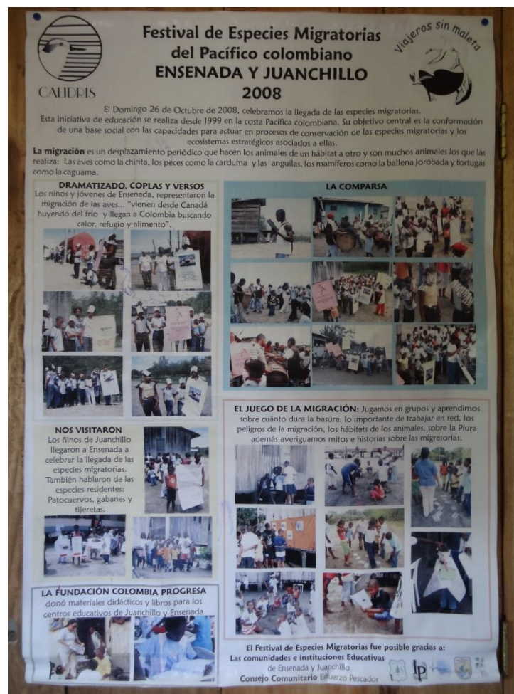
Foto No 24: Memorias del festival de la migración 2008 Por: Ernesto Hernández, 2014

jornadas de investigación y capacitación; la Asociación CALIDRIS, que comparte con el Grupo Ecológico la misma línea de interés (la conservación ambiental) y más directamente, la protección de aves playeras, especies residentes y migratorias. En coordinación entre la asociación Calidris y las instituciones educativas del Consejo Comunitario Esfuerzo Pescador, se celebra cada año en el mes de Octubre el festival de las aves migratorias; con el cual se busca sensibilizar a las comunidades del consejo sobre la importancia y la manera de proteger las diferentes especies y los ecosistemas de nuestra región.