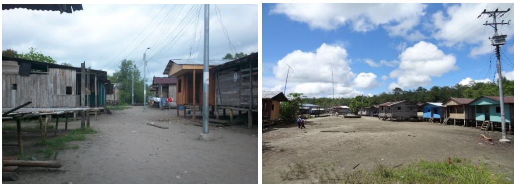
Foto No 4 y 5: Comunidad La Ensenada

El corregimiento hace parte del Consejo Comunitario Esfuerzo del Pescador. Está ubicado en la bocana del río Iscuandé, a orillas del Océano Pacífico. Limita al oriente, con las veredas Juanchillo y Cuerval, al occidente con el municipio de El Charco (las veredas: Villa, Caravajal y el corregimiento de Bazán); al norte con el océano Pacífico y con el Parque Natural Nacional isla Gorgona; al sur con las veredas Las Varas y Soledad. Cuenta con una extensión aproximada de 7.5Km 2 , de los cuales se estima que el 40% es bosque (manglar), el 40% zona marítima y solo el 20% ocupa el asentamiento poblacional. La Ensenada está ubicada a 12 m.s.n.m. y su temperatura oscila entre los 28°C (temporadas de lluvia) y los 32°C (temporada de sequía).