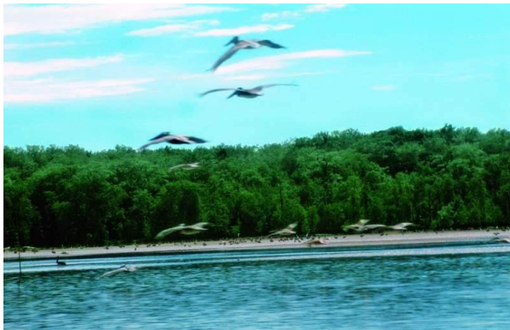
Foto No 25: Aves en los manglares de la Ensenada

El Bajo de la Cunita, que es uno de los 70 puntos RANZA de la Red Hemisférica de Reservas para Aves Playeras (RHRAP), siendo este el único en Colombia y el segundo en Sur América, es visitado por más de 150 especies migratorias en el año que sumados a las especies residentes asciende a unas 10.000 aves que se concentran en este lugar.