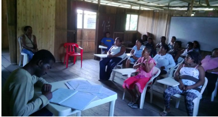
Foto No 10: Reunión con padres de familia de los participantes del grupo ecológico