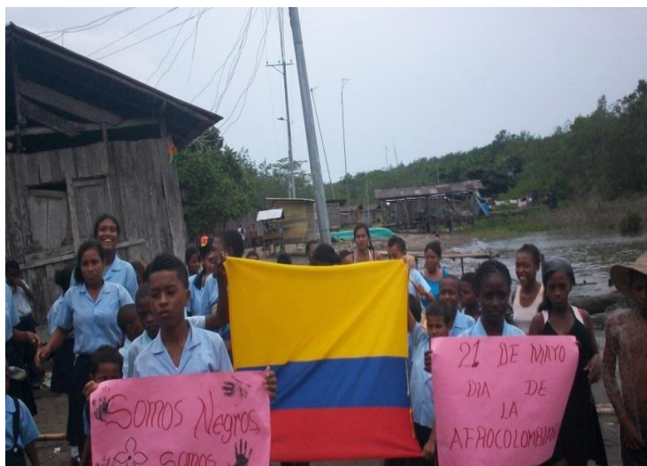
Foto No 24: Desfile de la afrocolombianidad con estudiantes y docentes de La enseñada Por: Jarinso torres, 2014

A manera de desfile, docentes y estudiantes hicimos una caminata por toda la comunidad, animada con tambores, bombo, cununo y guasá y entonando cánticos alusivos a la afrocolombianidad, demostrando orgullo por nuestra cultura.