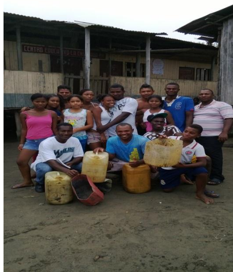
Fotos No 15 y 16: Estudiante reciclando galonetas para hacer papeleras. Jornada de reciclaje con apoyo de la comunidad