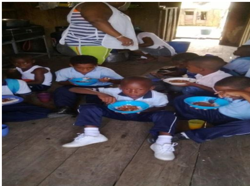
Foto No 23: Tomando el desayuno escolar Por: Jarinso Torres, 2014

El desayuno en el restaurante escolar fue coordinado por el profesor Jarinso, a quien le correspondía el turno de disciplina esa semana.