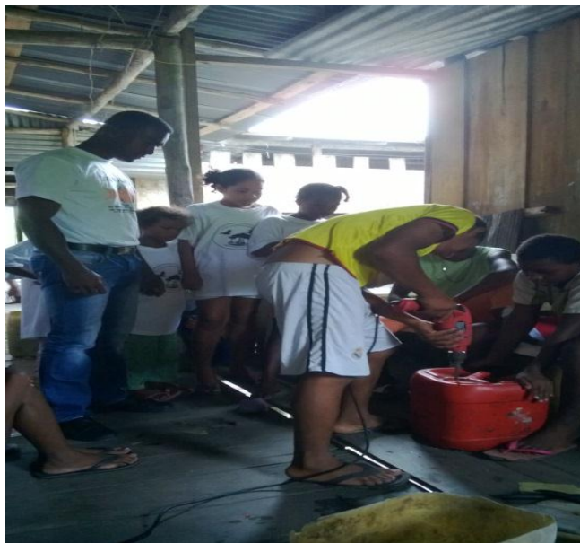
Foto No 19: Adecuación de recipientes para papeleras