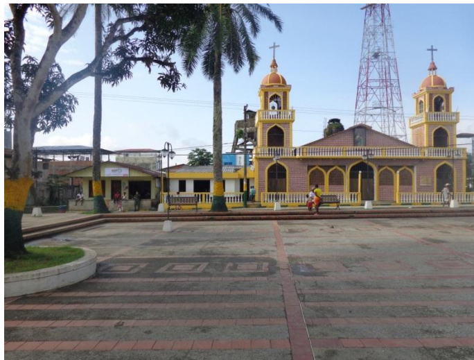
Foto No 1: Toma frontal de la plazuela y la parroquia de santa Bárbara de Iscuandé 2014

El municipio de Santa Bárbara de Iscuandé fue fundado hacia el año 1.600 por el señor Francisco de la Parada. Su primer asentamiento poblacional fue en Punta de Carrizo, lugar que hoy se conoce como el corregimiento de los Domingos. Por los constantes ataques y saqueos de los piratas, sus habitantes se trasladaron al lugar que hoy es la comunidad de Rodea; pero los ataques continuaron, por lo que finalmente se trasladaron a donde está hoy la cabecera municipal de Santa Bárbara.