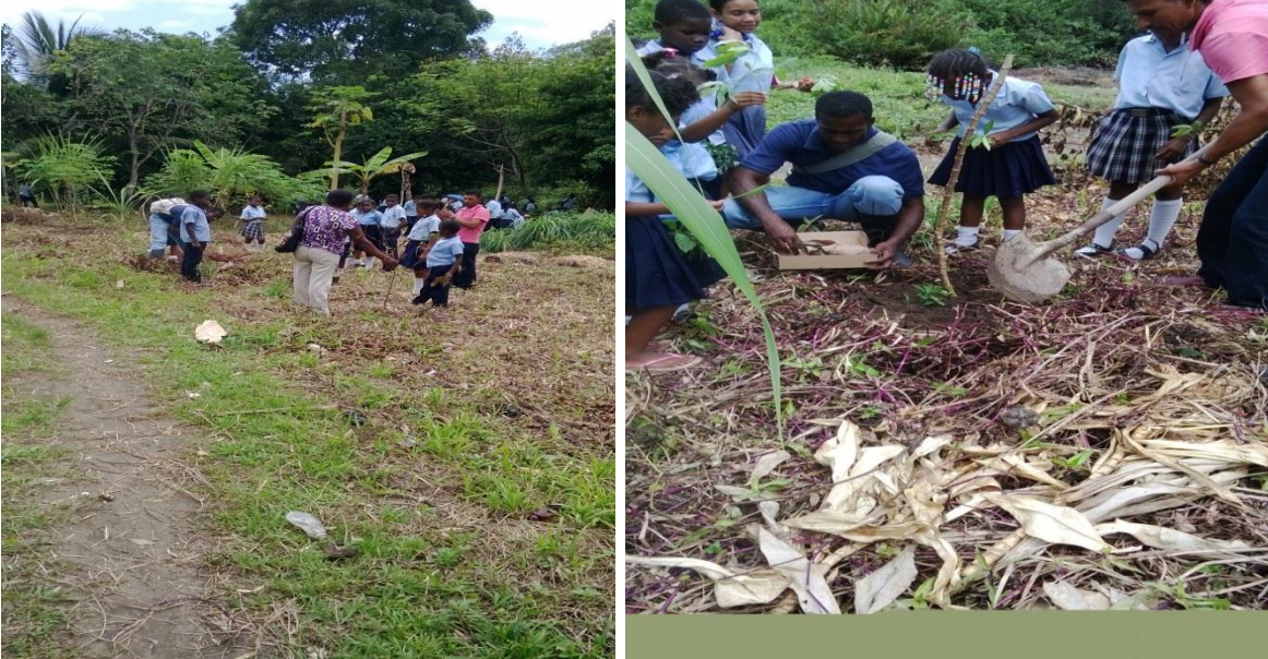
Fotos 21 y 22: Ensenada celebrando el día de la tierra Por: José Luís Bonilla, 2014