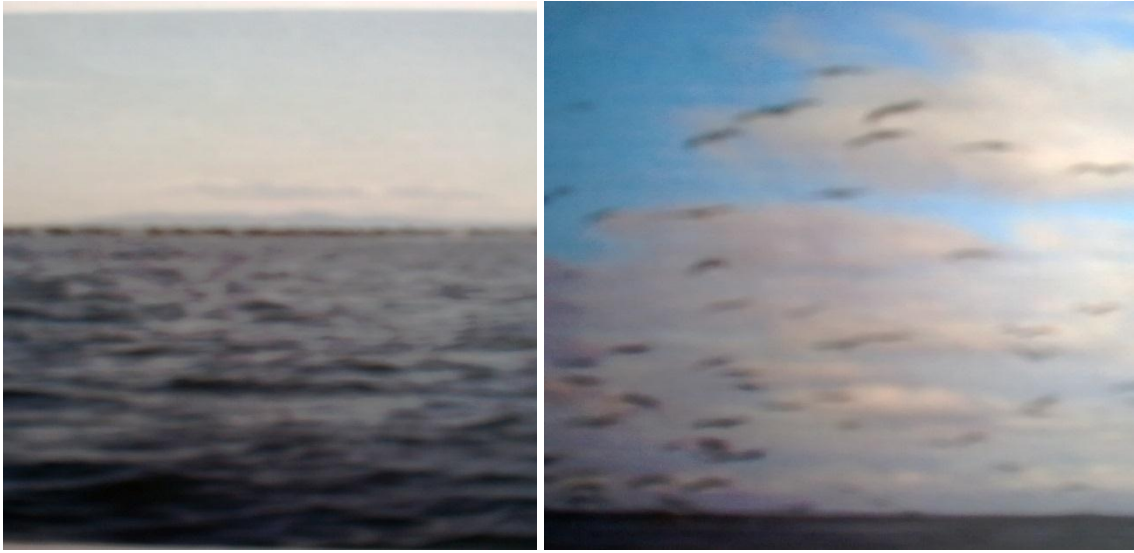
Foto No 1: Bajo la Cunita, al fondo PNN Isla Gorgona.