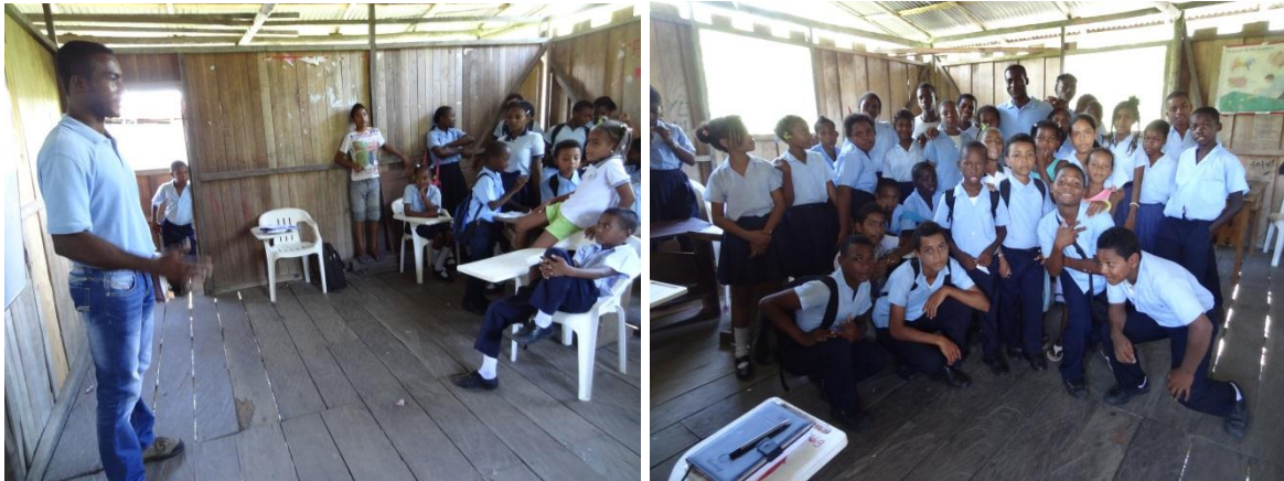
Foto No 11 y 12: Jornada de trabajo con el Grupo Ecológico Por: Ernesto Hernández Bernal, 2014

La mayoría de las actividades se desarrollaron en tiempo extra curricular, tal como se estableció en la planeación institucional, pero se articulaban a las unidades temáticas que se estaban desarrollando en el momento en los diferentes grados; en consecuencia, cada maestro en el desarrollo de sus clases enfatizaba en la importancia del proyecto que se estaba ejecutando y promovía la participación de los estudiantes en las diferentes actividades.