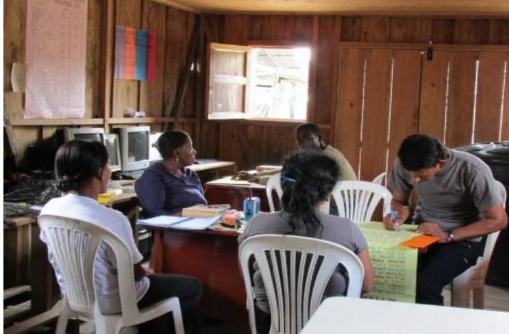
Foto No 9: Docentes de Ensenada en planeación institucional 2014

Les expuse que para este año dichas actividades formarían parte de mi proceso de PPE en el marco de mis estudios en la Licenciatura en Etnoeducación de la Universidad del Cauca, sede Guapi.