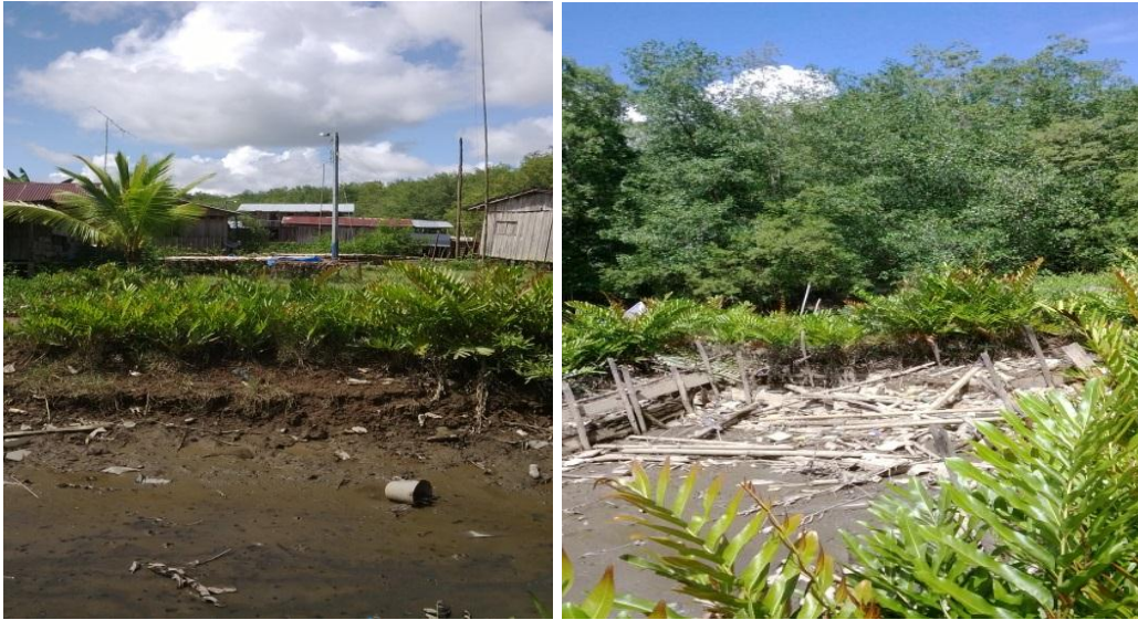
Fotos No 17 y 18: Lugar destinado para rellenar con basuras