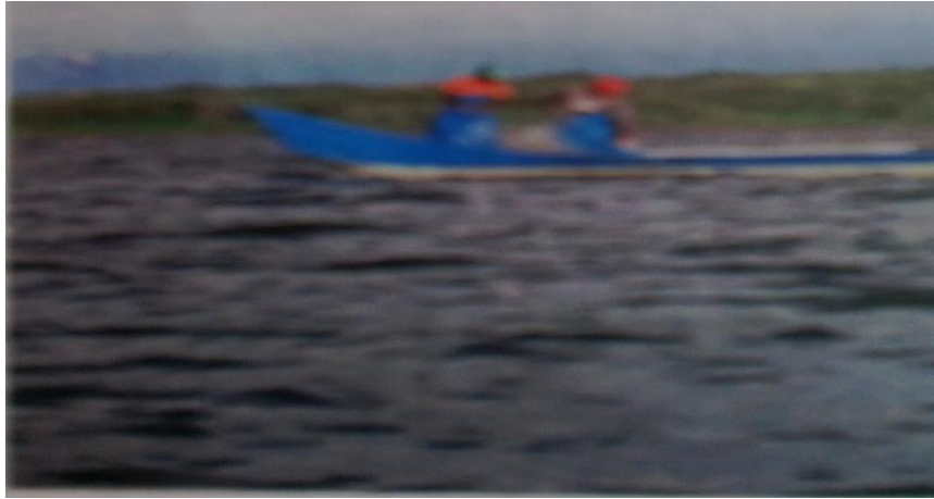
Foto No 2: Habitantes de La ensenada en faena de pesca Por: Ernesto Hernández Bernal, 20014.

Este municipio cuenta con una Institución Educativa en la cabecera municipal y con Centros Educativos en la zona rural.