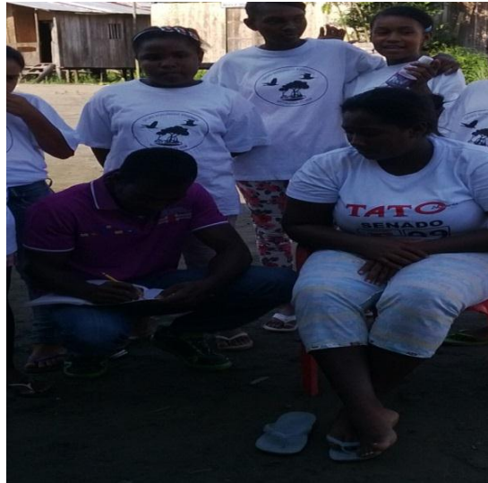
Foto No 20: Grupo ecológico en entrevistas informales Por: Jenny Presiado, 2014

Realizamos visitas domiciliarias aplicando una encuesta que nos permitiera conocer qué está haciendo la gente con las basuras; es decir, qué manejo realmente le están dando. Para esta actividad se planteó el siguiente interrogante: ¿Qué hace usted con las basuras de su casa?