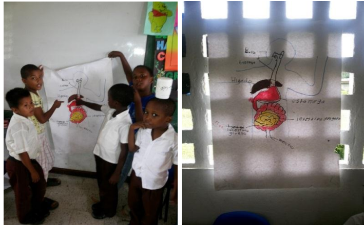
Exposición de los dibujos del tema del aparato digestivo

Luego les pedí que sacaran el cuaderno de Ciencias Naturales para escribir sobre el tema y al terminar esto, hice una rifa y el grupo que ganó salió a exponer su trabajo, es decir el dibujo del aparato digestivo.