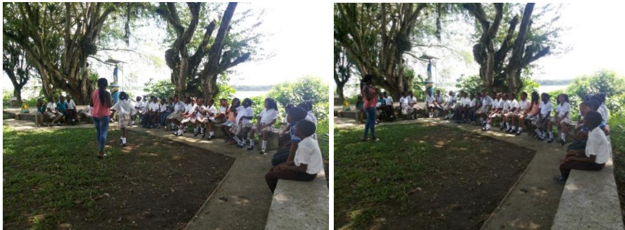
Exploración de conocimientos previos sobre la Chillangua

¿Dónde la cultivan? Jailer respondió que en ollas.