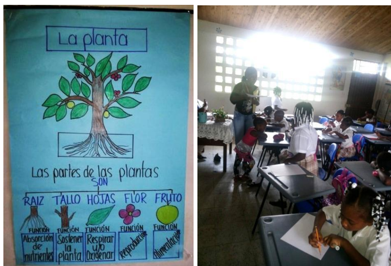
Mapa conceptual utilizado para orientar la clase. Estudiantes dibujando en clase

Para integrar el área de Artística, siempre entregaba a los estudiantes una hoja de block en la cual tenían que dibujar dependiendo del tema visto.