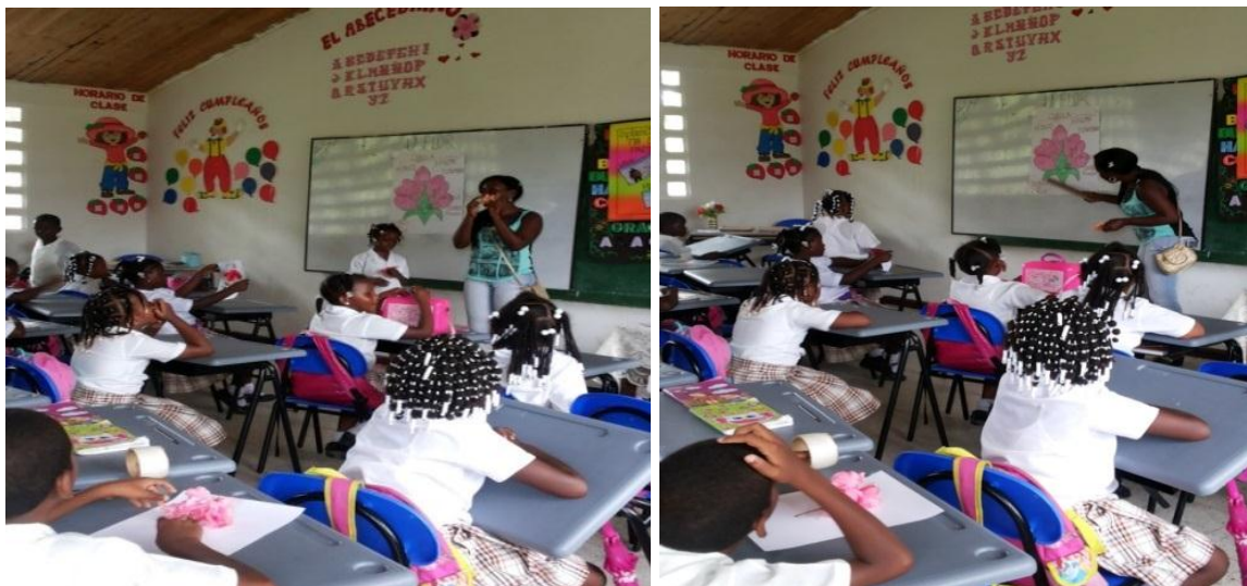
Niñas y niños atendiendo a las explicaciones

Luego pasamos al salón de clases donde presenté una lámina con una flor y sus partes, y para lograr que este aprendizaje fuese significativo me permití escoger una de las flores observadas por los estudiantes para ir haciendo la contrastación entre el dibujo y la flor real.