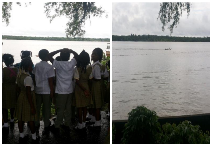
Observando el río Guapi

El 9 de mayo de 2014 inicié las clases con las actividades de rutina. En este día trabajamos el tema: El Agua. Para desarrollarlo nos desplazamos cerca al río para observarlo; una vez observado regresamos al aula de clases.