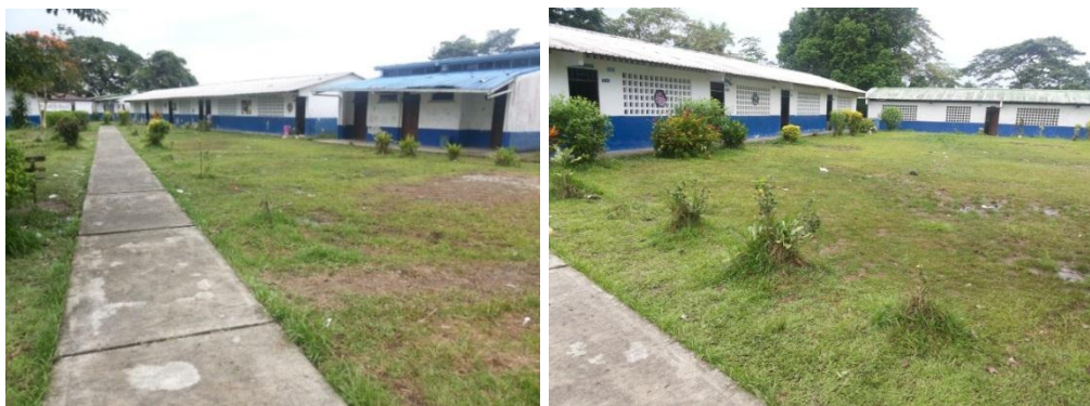
Escuela Normal Superior "La Inmaculada" Guapi