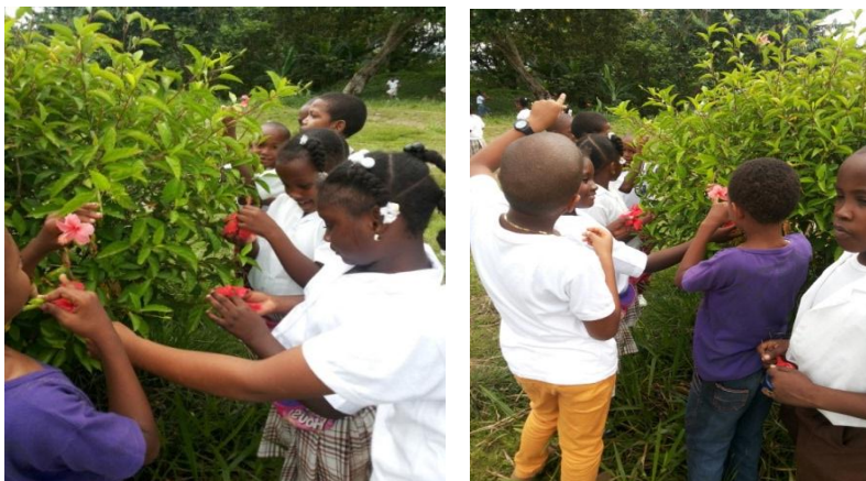
Niños y niñas del grado tercero observando las flores del entorno

niños y niñas hicimos una salida a los alrededores del salón para observar las plantas y desde ahí explicar el tema del día: Partes de la flor.