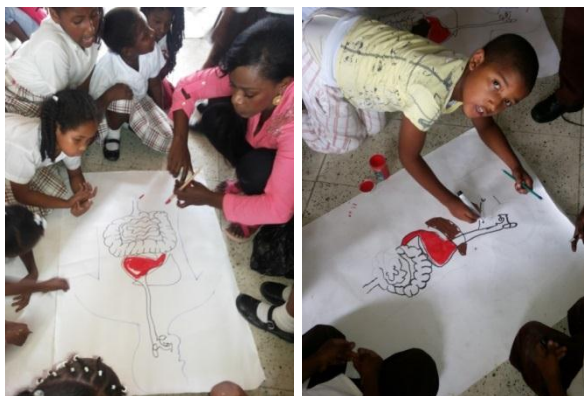
Dibujando el aparato digestivo