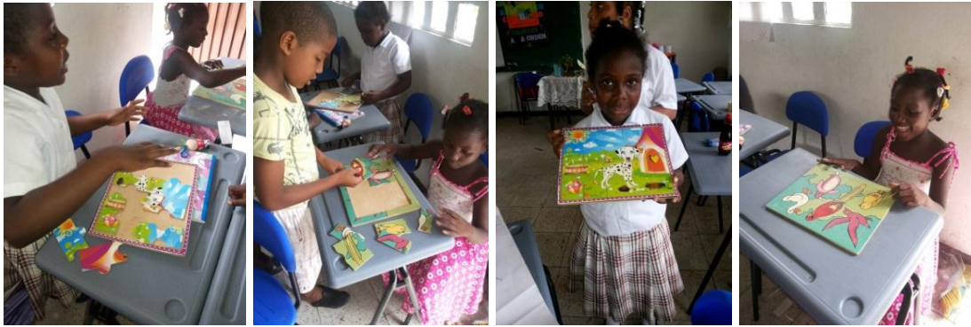
Niños armando rompecabezas