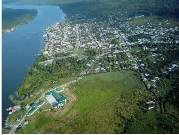
Municipio de Guapi