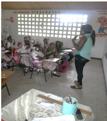
Iniciando la clase

El día 7 de mayo del 2014 se desarrolló una actividad muy significativa con los estudiantes, donde a través del tema: nutrición en los seres humanos, se abordó la historia del cimarronaje en Colombia. Inicialmente realicé las actividades de rutina: saludar, rezar y una dinámica llamada: “tingo tango”. Seguidamente pregunté acerca de lo trabajado en la clase anterior (nutrición en los seres humanos), buscando continuidad en los temas trabajados y seguir profundizando sobre en este tema en particular. Jugamos “ritmo” para que los estudiantes mencionaran diferentes alimentos.