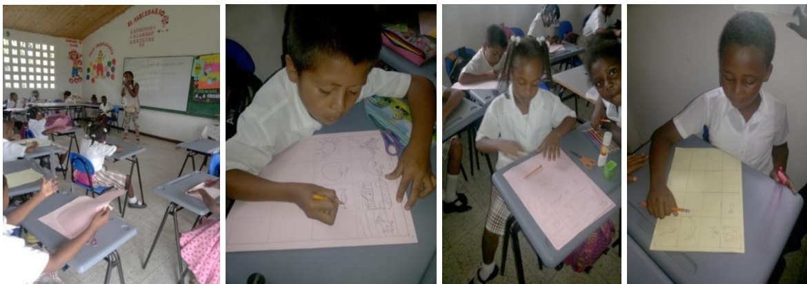
Construyendo la lotería Etnoeducativa

los que dibujaron. Esto buscaba el desarrollo de la dimensión artística y cognoscitiva. Los niños y niñas reflejaron que conocían algunas plantas del medio, diferenciando las medicinales de las alimenticias, así mismo elementos que identifican la región, dibujando: sombreros, bombos, canaletes, marimbas, tambores, entre otros.