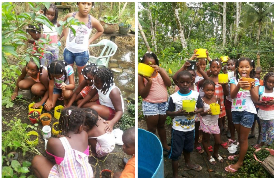
Siembra de plantas de Chillangua en la azotea

siembra de las plantas condimentarias de Chillangua. Por ello pedí a los niños y niñas a asistir en horas de la tarde para culminar con dicha actividad. Cabe decir que como no todos los padres de familias permiten que sus hijos se desplacen a otros lugares en horarios no habituales, fue imposible que todos los estudiantes participaran activamente del proceso.