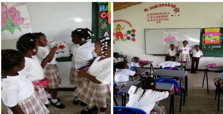
Estudiantes exponiendo sus trabajos

Una vez terminaron, conformaron grupos de 5 integrantes, a cada uno entregué una hoja de block, una flor y cinta adhesiva, para que pegaran la flor en la hoja y escribieran el nombre de cada una de sus partes. Con el fin de que los estudiantes ejercitara su competencia de comunicación oral, les pedí que salieran al frente a exponer sus trabajos, además porque las exposiciones orales les permite dejar inseguridades o miedos para hablar en público. Los estudiantes en las exposiciones contaron a sus compañeros las partes de la flor y sus funciones. Por último comentaron que les había parecido muy bueno haber trabajado así no se hace aburridora la clase.