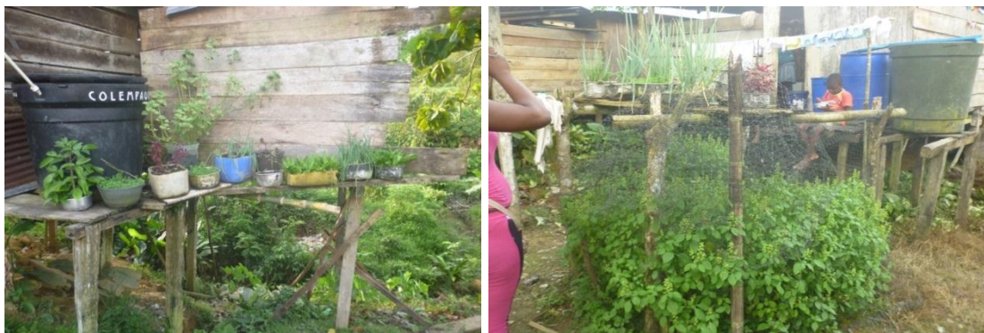
Fotos de azoteas compartidas con los estudiantes

la misma pregunta, pero en vista que ninguno de los estudiantes participaba, me permití enseñarles algunas fotos de azoteas para que se hicieran una idea de lo que se estaba hablando.