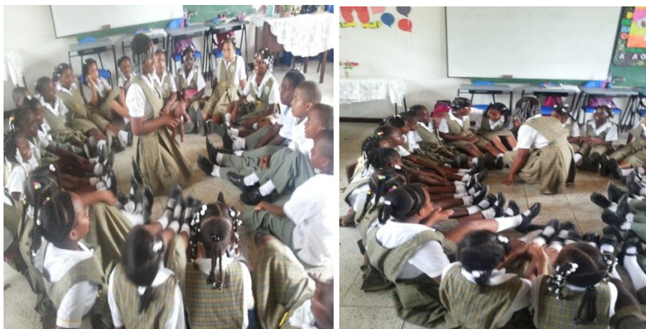
Jugando a la Buluca

Después realizamos el juego: La Buluca, que se lleva a cabo en los Chigualos. Éste consiste en hacer un círculo sentados en el suelo, donde todos los participantes quedan bien unidos unos de otros.