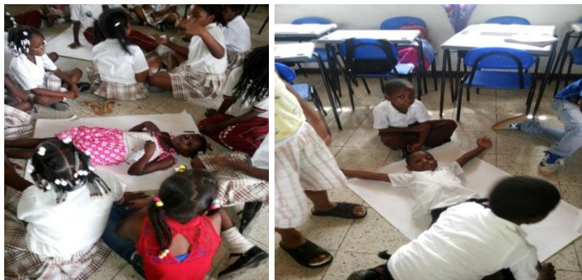
Dibujando las siluetas del cuerpo

respondió: no sé. En vista que los estudiantes tenían poco conocimiento del tema, y sin más preámbulo, me dispuse a enseñarles el dibujo del aparato digestivo. Les expliqué cada parte del mismo y las funciones que cumplen. Después les pedí que conformaran grupos para que dibujaran el aparato digestivo, explicándoles que para ello, un integrante tenía que acostarse sobre un pliego de cartulina que entregué a cada uno, mientras otro compañero trazaba la silueta de su cuerpo. Atendiendo las orientaciones los estudiantes empezaron a trabajar muy juiciosos.