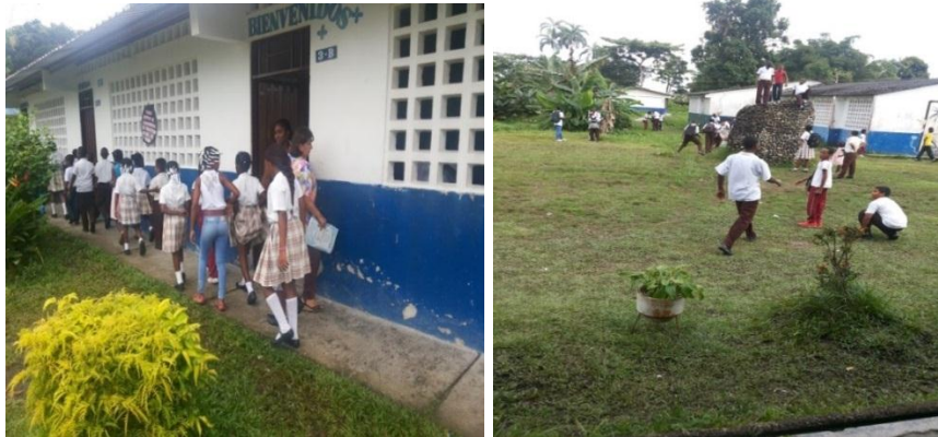
Recorrido del salón de clases al Parque de los valores

orden, razón por la cual les llamé la atención a los niños implicados con el fin que se comportaran mejor y no dañaran la armonía con los otros niños y niñas.