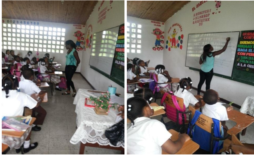
Abordando el tema afro con los estudiantes