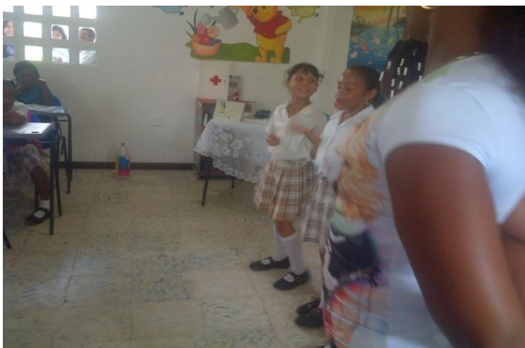
Charla de 4B a 1B, 4° y 5° sobre el medio ambiente y el día de la tierra

En el marco de esta celebración también organizamos 4 grupos y dimos charlas a los grados 5°, 4° y 1°B sobre temas como: el cuidado del medio ambiente y el reconocimiento mundial del día de la tierra.