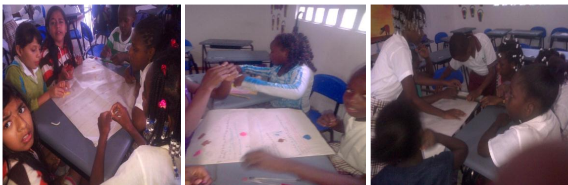
Estudiantes desarrollando el taller

Luego conformaron 7 grupos para realizar un taller acerca del video observado, en el que los niños compartieran sus ideas y puntos de vista a partir de las preguntas: ¿Por qué es importante el reciclaje en nuestro pueblo? ¿Qué debemos hacer para que estos residuos no contaminen el medio ambiente? ¿Mencionen algunos residuos inorgánicos y orgánicos que se generan en nuestro pueblo? ¿Mencionen los lugares de donde salen los residuos inorgánicos y orgánicos? Realiza una actividad libre: dibujo, coplas, canciones, chistes, en relación con el tema.