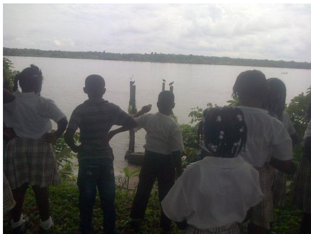
Estudiantes observando el río Guapi

saludo al grupo y seguidamente les pedí que sacaran lápiz, bolígrafo, sacapuntas, regla y les invité para que fuéramos a la parte que queda por donde los Aguiños a observar el río; en ese instante, la profe Isabel les hizo recomendaciones a los estudiantes para que se comportaran bien.