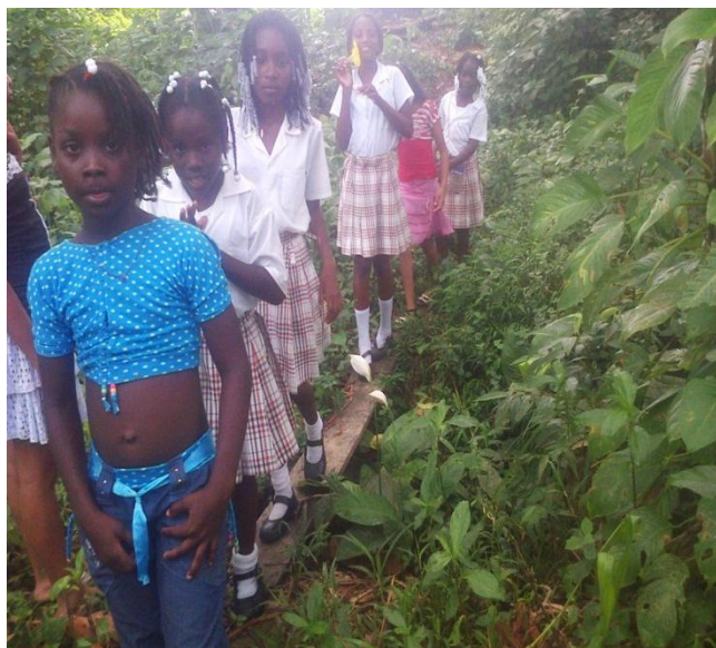
Recorrido por la institución

El día 4 de marzo de 2014, mi primer día de práctica, llegué y saludé muy cariñosa a los estudiantes y ellos respondieron colocándose de pie. Luego les dije que íbamos hacer un recorrido por toda la institución observando lo que está a su alrededor.