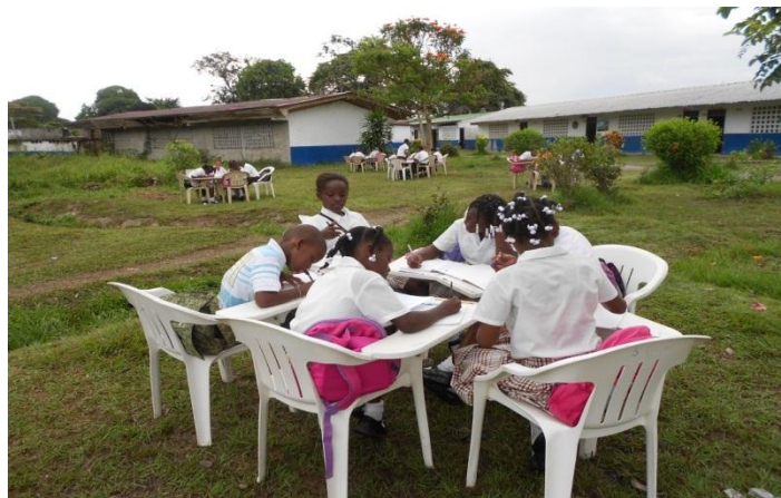
Trabajo en grupos sobre el concepto de medio ambiente y su importancia

Día 30 de abril de 2014. Iniciamos con el juego: tingo, tingo, tango. Luego miramos el concepto de medio ambiente, para lo cual conformamos grupos de 5 integrantes, en los que los estudiantes: primero leyeron un texto con la definición de medio ambiente, luego los escribieron en el cuaderno y discutieron lo comprendido sobre éste. A partir de ello respondieron tres preguntas: ¿Por qué es importante el medio ambiente? ¿Por qué debemos cuidar y proteger el medio ambiente? ¿Es importante el medio ambiente en la vida del hombre? Por último hicieron un dibujo que representaba los elementos del medio ambiente de nuestro municipio.