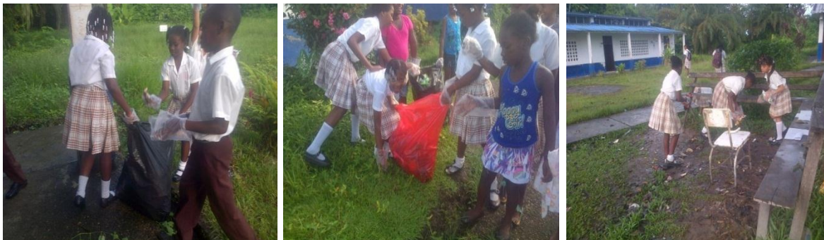
Jornada de limpieza en el día de la tierra

Así mismo el día 22 de abril de 2014 celebramos el día de la tierra con una jornada de limpieza por toda la institución. Para ello conformamos 6 grupos y repartimos a cada uno 3 bolsas: 1 roja y 2 negras. En la bolsa negra se recolectó el papel y el plástico, y en la bolsa roja el vidrio y hierro. Cada grupo contaba con 2 escobas y 2 recogedores.