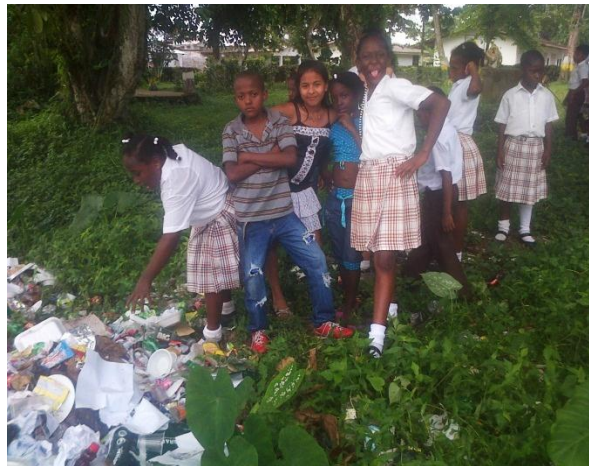
Observación en el entorno de la institución

Fuimos a la parte del río que está ubicada en el primer bloque; los estudiantes estaban encantados mirando los potrillos y barcos, alzando las manos a las personas que iban en estas embarcaciones. Observaron la cantidad de basura que había allí, y algunos dijeron: “Profe, esa basura está contaminando los árboles y la tierra, y también trae mucho mosco”. Respondí preguntando ¿Qué debemos hacer para no arrojar la basura al suelo?, a lo que me contestaron que echarla en las canecas. Muy bien respondí.