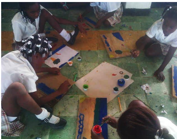
Elaboración de mensajes sobre lo observado

Después de esto, regresamos al salón de actos para dibujar, pintar y escribir mensajes sobre lo que observaron y en qué condiciones lo encontraron, así mismo cómo lo desearían para el futuro. Para esta actividad les di tablas, pedazos de cartón, pintura y plastilina.