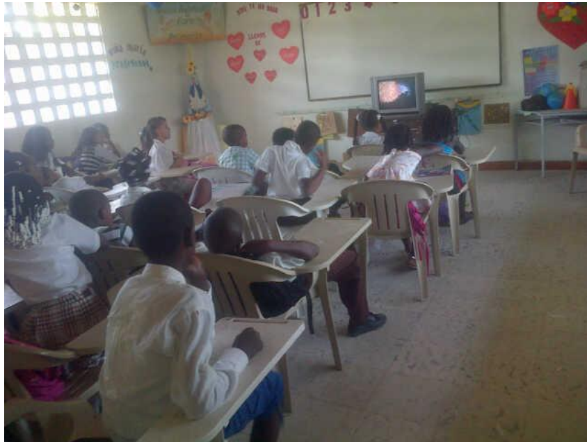
Estudiantes mirando la película kirikou y la hechicera