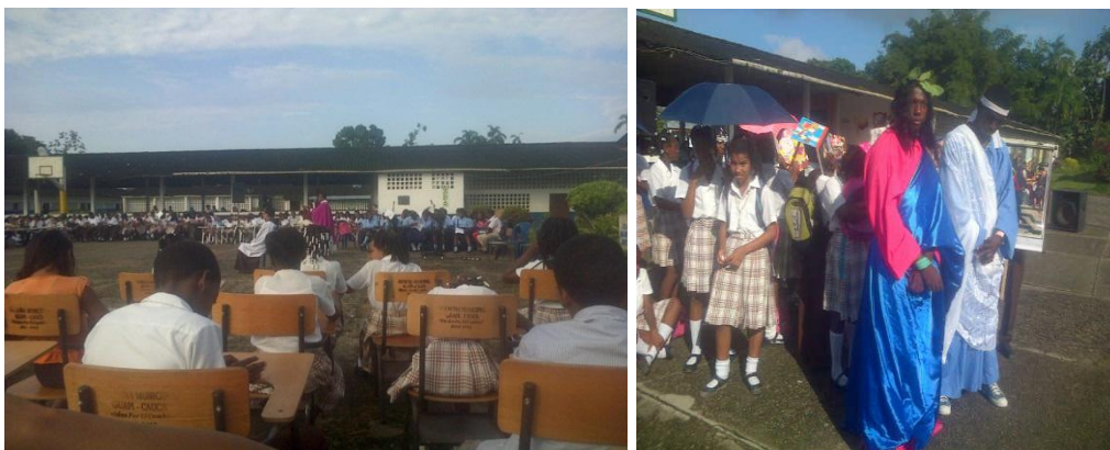
Celebración eucaristía del miércoles de ceniza y viacrucis

El día 5 de marzo del 2014 participé en la eucaristía por el miércoles de ceniza y el 9 de abril en la celebración del viacrucis.