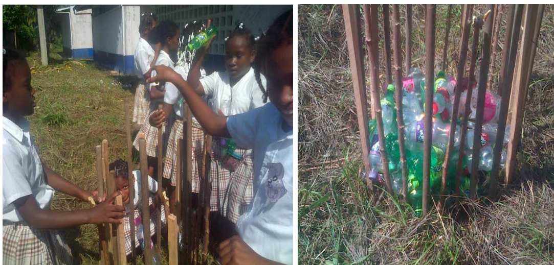
Construcción y almacenamiento de botellas recicladas

Otra de las actividades que realizamos en este sentido fue la construcción de una estructura para almacenar botellas plásticas, las cuales luego utilizaríamos en la elaboración de materas y canecas.