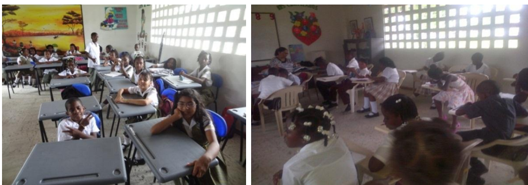
Estudiantes del grado 4B

Por: Ernesto Hernández y Leisy Amú, 2014