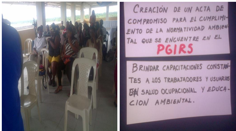
Taller municipal de gestión integral de residuos sólidos

internacional del reciclaje. Iniciamos con una limpieza de las gradas de la muralla (a orillas del río Guapi). En esta actividad participó el SENA, la CRC, y grupos ecológicos.