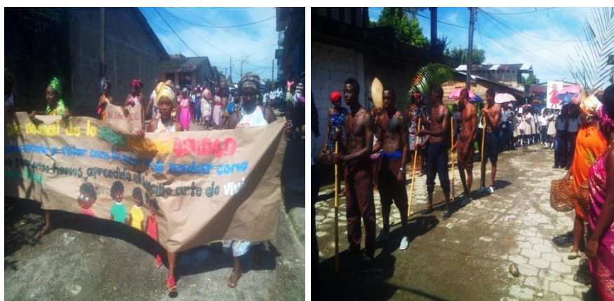
Caminata día de la afrocolombianidad