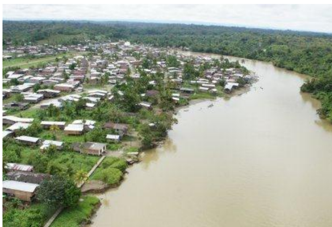
Cabecera municipal de Guapi

Colombia se encuentra dividida políticamente en departamentos, entre los cuales se encuentra el departamento del Cauca, que tiene por capital el municipio de Popayán. Cuenta con municipios de población mayoritariamente afro hacia el Pacífico sur, como es el caso de Guapi, el cual está ubicado en el suroccidente de este departamento, a 5 metros de altura sobre el nivel del mar. Limita al norte con el municipio de Timbiquí; al sur con Iscuandé (Nariño); al occidente con el océano Pacífico y al oriente con los municipios de Argelia y El Tambo.