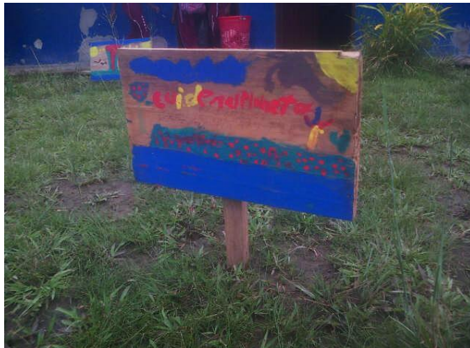
Exposición de dibujo sobre el medio ambiente

Finalmente los niños terminaron la actividad, se le colocó un soporte a cada dibujo y los expusimos al frente del salón, clavados en la tierra para que lo viera toda la comunidad educativa.