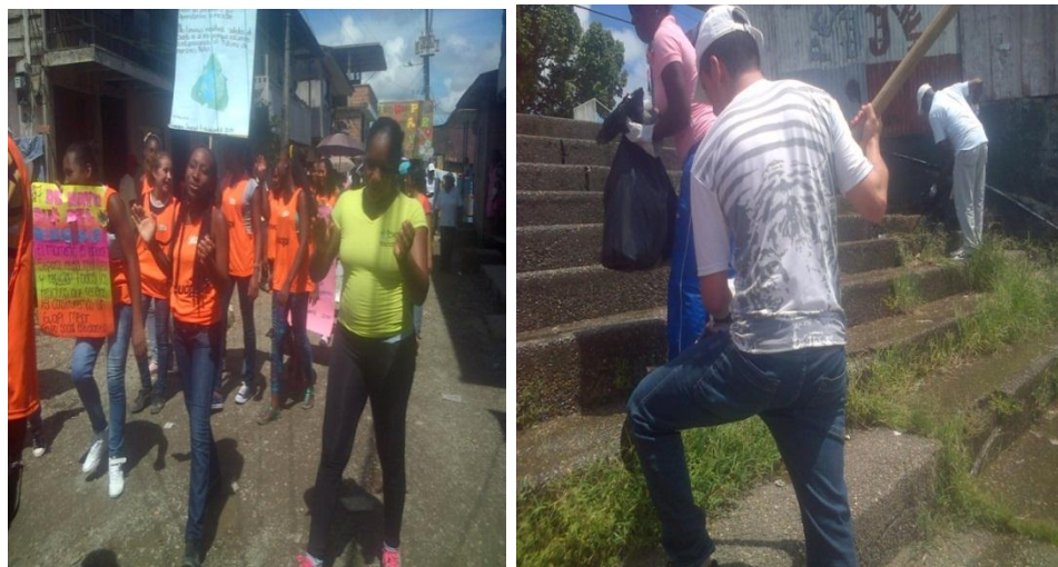
Caminata y limpieza por el día del reciclaje