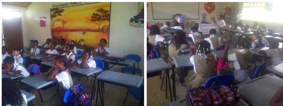
Estudiantes observando la película

En el marco de esta celebración participamos muy activamente en la actividad organizada por la Universidad del Cauca y la administración municipal. Llegaron diferentes instituciones como la Normal Superior, San José, Pueblito, el SENA, Grupo Chillangua, entre otras. Cada una participó con sus vestuarios afro, danzas, bailes africanos y carteleras con muchos mensajes, haciendo un recorrido por las principales calles del pueblo. Luego estuvimos en el parque con presentaciones de cantos, coplas, danzas, historia de los negros y juegos tradicionales.