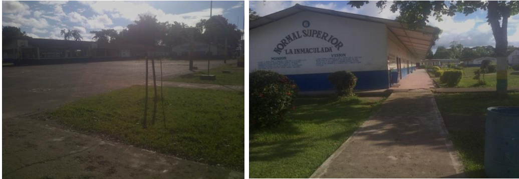
Planta física de la institución Educativa Normal Superior La Inmaculada Por: Leisy Amú, 2014

En este mismo documento PEI encontramos como misión: “Formar maestros y ciudadanos íntegros con calidad ética, pedagógica, académica, científica y con un profundo conocimiento de su entorno étnico cultural y ambiental, que les permita desempeñarse con eficiencia en el nivel preescolar, y en el nivel de básica primaria, con competencias para entender a diferentes poblaciones”. En cuanto a la visión: “Se proyecta hacia el futuro como una institución líder en la formación de maestros y ciudadanos íntegros, con gran apertura hacia la investigación y la innovación pedagógica, buscando recobrar su papel protagónico en el desarrollo social y étnico de su región y de su país”.