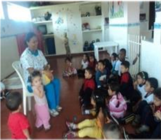
Fotografía 13. Interpretación y dibujos sobre el cuento Caperucita Roja.

Realice la actividad de invitar a una profesora afrodescendiente para que por medio de sus prácticas culturales nos narrara sus cuentos, sus historias, sus poesías sus arrullos, sus danzas su música, leyendas construidas ancestralmente por sus comunidades para fortalecer una buena imagen de esta etnia en el grupo.