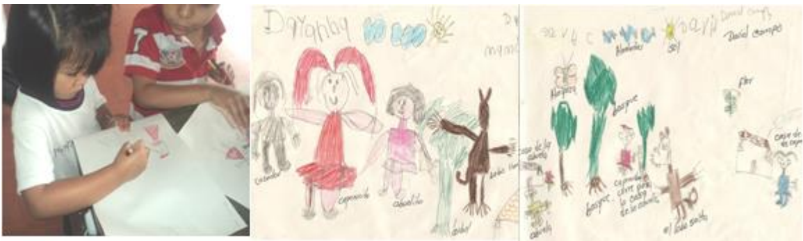
Fotografía 13. Interpretación y dibujos sobre el cuento Caperucita Roja.

Luego los niños y niñas graficaron lo que entendieron del cuento: