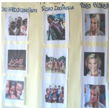
Fotografía 26. Cartelera elaborada por los padres de familia.

Los niños participaron y los maestros también observando una excelente integración en todos los grupos primero se ensayaron con todos los niños y luego se fueron escogiendo los que más les gustaba para hacer la presentación el día de la familia realizaron una coreografía muy bonita.