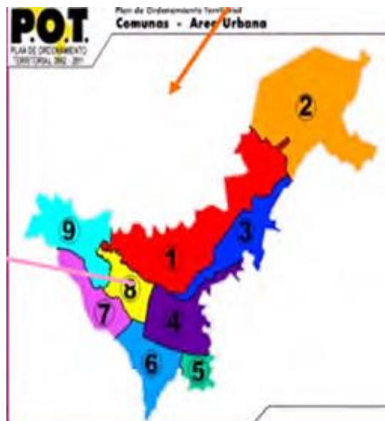
Figura 2. Mapa de las comunas del municipio de Popayán.

El 2.9% de la población de Popayán es afrodescendiente (DANE 2005) 5