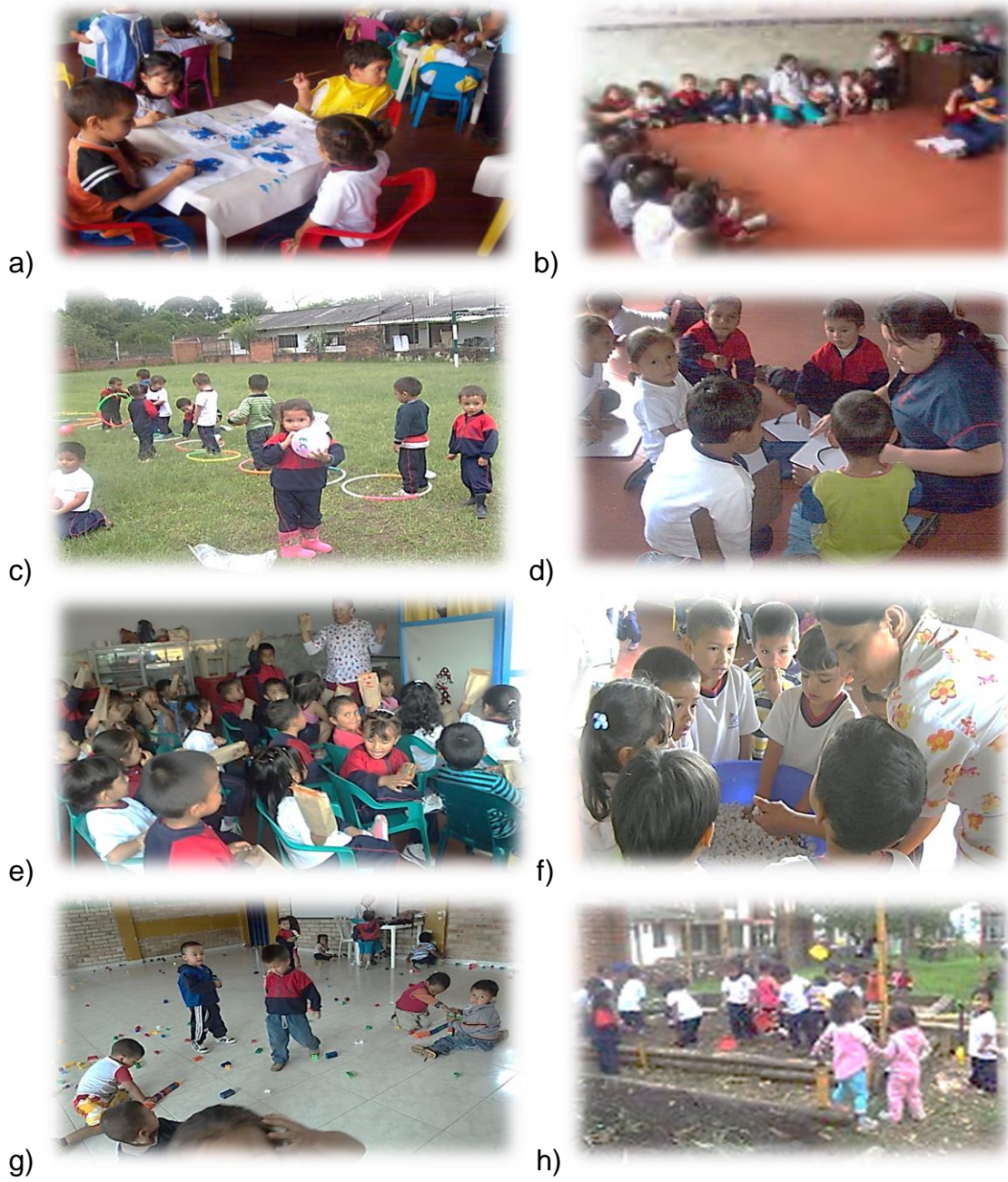
Fotografía 2. Niños (as) desarrollando actividades en los distintos talleres.