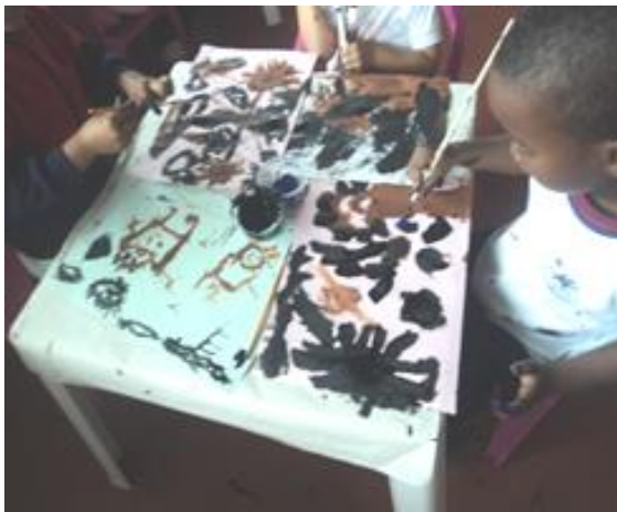
Fotografía 29: Grupo de niños pintando con vinilos.

Con esta identidad sale de los matorrales cercanos y llama al niño o niña pretendiendo que este se desvíe del camino y así poderlo enfundar. Esta mujer tiene un poder irresistible de seducción, su característica especial es que tiene un pie de molinillo, se le aparece a los niños y niñas mal criados y desobedientes alimentándolos con camarón peído.