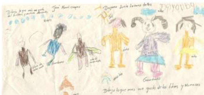
Fotografía 16: Dibujos de los niños (as) sobre los títeres

Después en el taller de gráfico plástico con los implementos necesarios los niños y niñas dibujaron lo que más les gusto de los títeres donde estos fueron los dibujos: