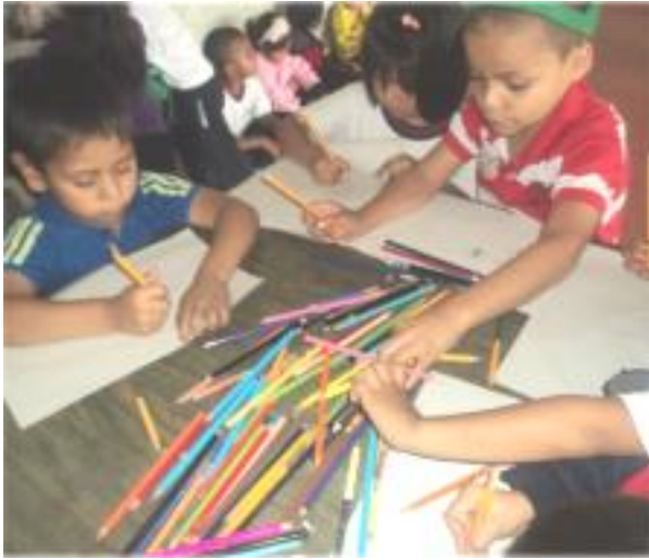
Fotografía 9. Niños (as) dibujando la historia del Patito Feo.