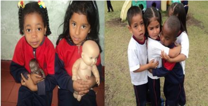
Fotografía 6. Niños (as) del nivel Pre - Jardín.