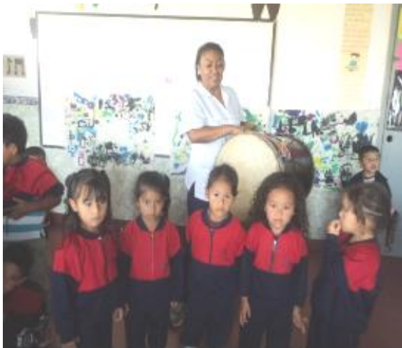
Fotografía 18. Taller de música.

En el taller de música con los niños y niñas aprenderemos canciones y danzas de la cultura del Pacífico donde se fortaleció en ellos la riqueza cultural. Después los niños con plastilina, arcilla moldearon lo que más les llamo la atención.