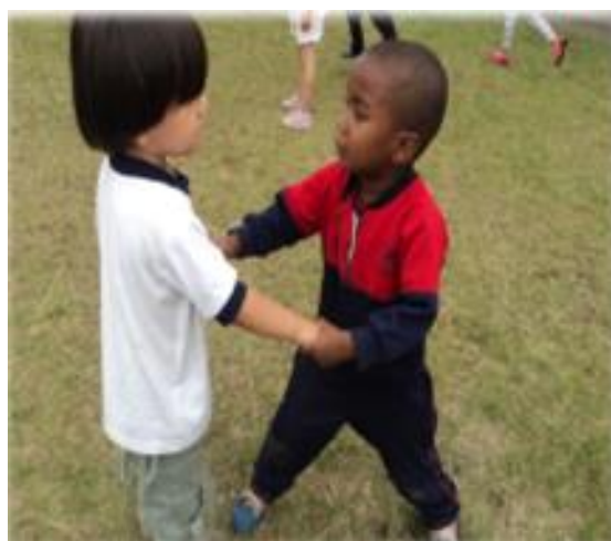
Fotografía 6. Niños del nivel Parvulario 3.