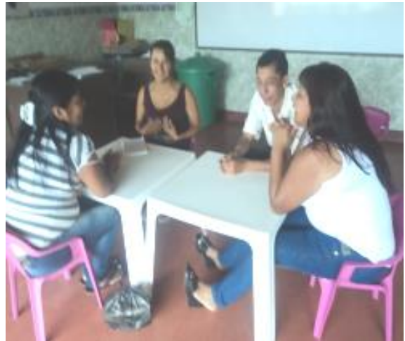
Fotografía 19. Grupo de padres de familia.