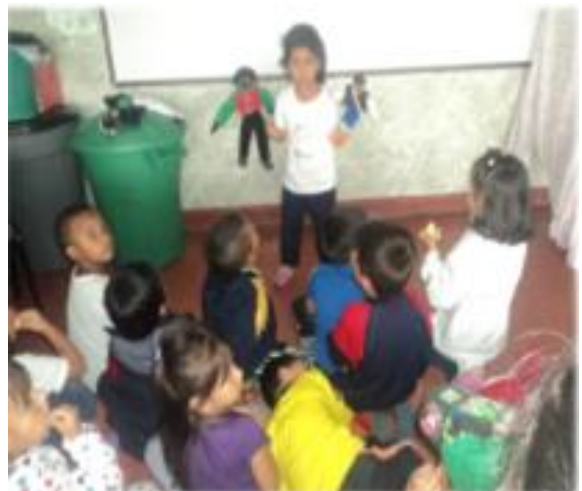
Fotografía 15. Obra de títeres.

Algunos padres de familia trajeron títeres de las diferentes etnias como:Afrodescendientes, guámbianos yanaconas y muñecos blancos y cafés, donde se les realizo una obra de títeres y se les explico la importancia de cada etnia y el respeto por las mismas.Luego los niños realizaron su propia obra de títeres y se observó que les llamo mucho la atención las etnias y como ellos de forma indirecta discriminan racial mente porque cuando les pregunte: