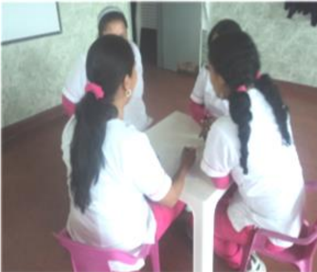
Fotografía 20. Grupo de maestras.

e) ¿Qué programas debe crear el estado, a nivel nacional, departamental, municipal y distrital, en pro de la eliminación del racismo y de la construcción de procesos reales de inclusión social?: Debe crear programas sociales culturales deportivos y económicos que haya una integración de todas las comunidades tanto indígenas como afros ruun, raizales y gitanos.