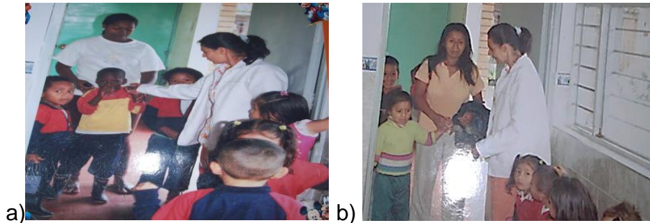
a) b)

La institución está regida por los lineamientos del Instituto Colombiano de Bienestar Familiar, para una atención de protección, educación y nutrición. Se trabaja con el proyecto pedagógico educativo comunitario (P.P.E.C), que es un proyecto en permanente construcción con sus protagonistas que son los niños, los padres de familia, los maestros, y la comunidad. lo más importante es la humanización del niño el cualayuda a este proceso es la pedagogía de Celestín Freinet con sus técnicas de vida, también la concepción del desarrollo infantil que es desde cuando nace el niño y atreves de la relación con la madre, con los demás miembros de la familia y con otras personas, el niño se apropia, hace suyas las formas de sentir, de actuar y de pensar que tienen los seres humanos, convirtiéndose en una persona que actúa y se reconoce como perteneciente a un determinado grupo social conservando su propia identidad. Esa interacción es la que determina el desarrollo psicológico del niño y es un mecanismo de comunicación de intercambio afectivo y de conocimientos, de las formas de ver la realidad y de comportarse.