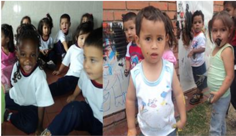
Fotografía 5. Niños y niñas de los niveles de parvulario.