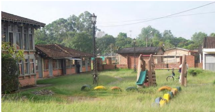
Fotografía 1. Contexto del Hogar Infantil “Pequeñines” (HIP).

El hogar Infantil Pequeñines está ubicado en la comuna 8, que limita con las comunas 1, 4, 6,7 y 9; consta de 19 barrios de estratos 1, 2 y 3 dentro de los cuales se encuentra el barrio Santa Elena donde se localiza la sede del Instituto Colombiano de Bienestar Familiar (ICBF) regional Cauca y sus instalaciones se encuentran en el Hogar Infantil “Pequeñines” en el cual ésta investigación se centra. Véase fotografía 1.