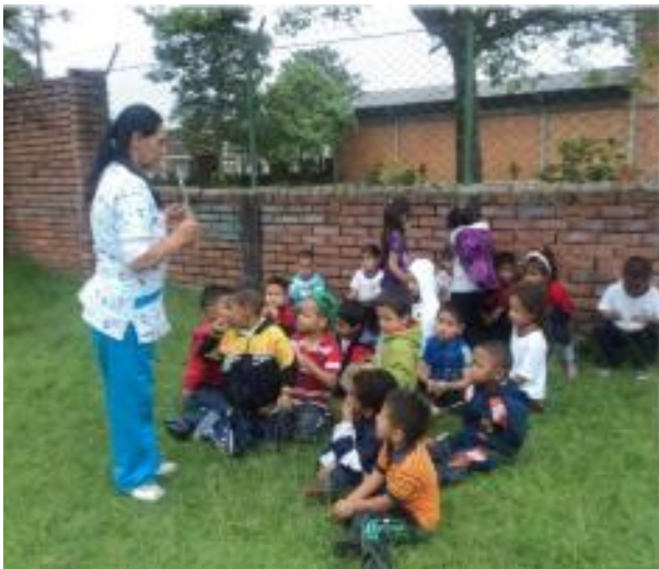
Fotografía 11. Niños (as) escuchando el cuento de Caperucita Roja.

Cuando llegó la niña la invite a entrar al dormitorio donde yo estaba acostado vestido con la ropa de la abuelita. La niña llegó sonrojada, y me dijo algo desagradable acerca de mis grandes orejas. He sido insultado antes, así que traté de ser amable y le dije que mis grandes orejas eran par oírla mejor. Ahora bien me agradaba la niña y traté de prestarle atención, pero ella hizo otra observación insultante acerca de mis ojos saltones. Ustedes comprenderán que empecé a sentirme enojado.