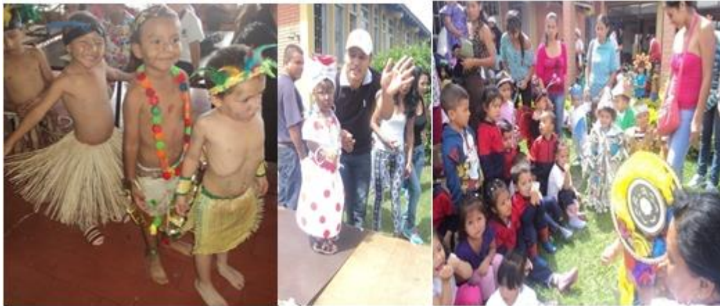
Fotografía 24: Desfile de trajes típicos.