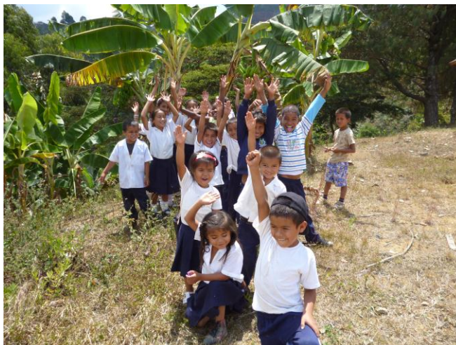
Foto 3. Estudiantes del grado 4° y 5° de la escuela Nuevo Paraíso-La Alita

“Quizá pueda asombrar que recomiende razonar con los niños y sin embargo no puedo dejar de pensar que es la verdadera manera en que hay que comportarse con ellos”