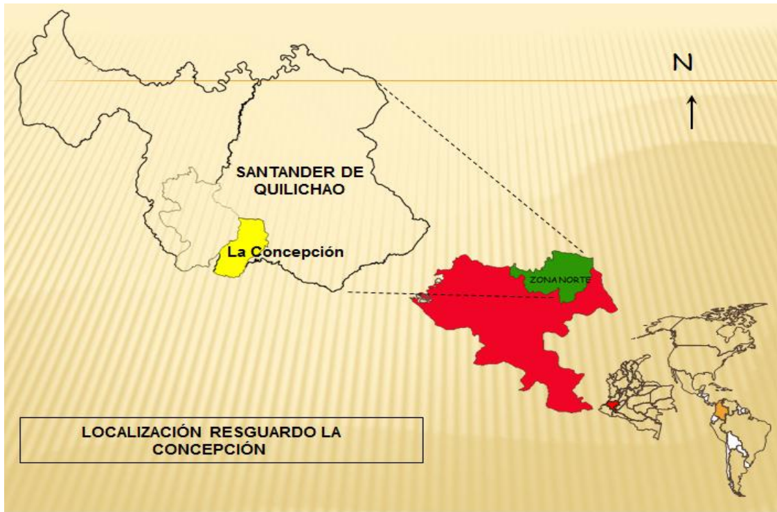
Mapa 1. Localización Resguardo La Concepción