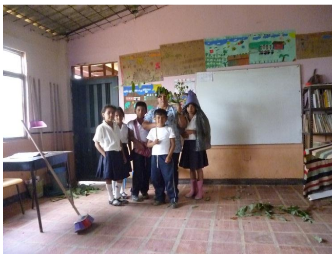
Foto 4. Representación de la obra de teatro El Duende Protector de la Naturaleza

Seguidamente de esto decidimos hacer una pequeña obra de teatro cuyo nombre fue El Duende Protector de la Naturaleza donde se reflejó uno de los hechos preocupantes para la comunidad que es la tala de árboles, se expuso a través del personaje creado Don Juan quien es un hombre que no tienen conciencia de sus actos con la naturaleza, corta cuanto árbol ve para llevárselo como leña y muchas veces solamente por gusto, entonces El Duende Protector se encarga de darle una gran lección convirtiendo en un árbol también expuesto a todo lo que este tiene que pasar desde que un leñador lo corta hasta que lo utilizan como leña.