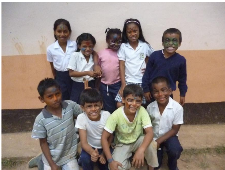
Foto 2. Estudiantes de la escuela Nuevo Paraíso la Alita. Trabajo interétnico como fundamento de una educación por y para todos(as) (mayo 30 de 2013)

“Un movimiento que oscila entre sufrimiento, dolor, alegría y esperanza. En el fondo, estamos todos envueltos en la lucha por cambiar, como me agrada decir, la “cara” de la escuela. Además de hacerla pública, popular y democrática”