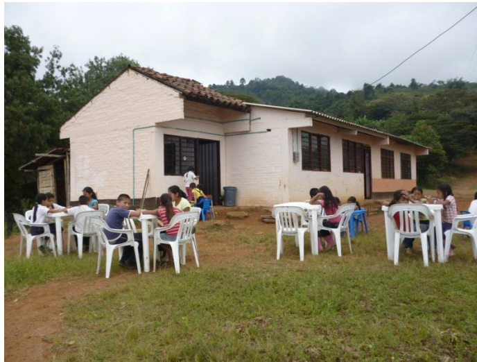
Foto1. Escuela Nuevo Paraíso, vereda La Alita, resguardo La Concepción. Foto tomada por Elsy Beatriz Daza (abril 10 de 2013)

Tomado del libro La Metamorfosis de la Vida (p. 157)