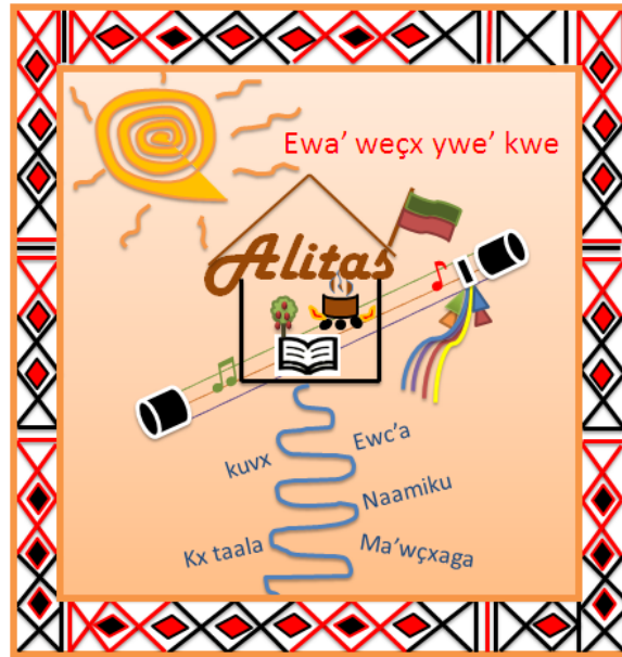
Portada de "Alitas" revista etnoeducativa de la escuela Nuevo Paraíso

Mi labor como docente comenzó hace aproximadamente seis años donde tuve que trabajar con todos los grados porque la escuela contaba tan solo con mi labor. Había la necesidad de otra docente pero, como siempre, por políticas educativas estatales, la escuela no contaba con el máximo de estudiantes para contratar a otro profesor(a). Creo que es mucho más complicado trabajar con todos los grados así hayan 20 o 25 estudiantes en total que trabajar con 30 o 35 estudiantes de un solo grado, en el primer caso se trata de ser lo más ágil y recursivo para pasar de grado primero a cuarto, o de segundo a transición porque los temas varían; en el segundo caso cuenta con un debido tiempo para trabajar las matemáticas o español y no se tiene que correr para abarcar a todos los grados, claro que esto no es la solución definitiva y expongo esto porque cuando empecé a trabajar no tenía mucha idea de lo que era una educación contextualizada y significativa. Fue entonces cuando ingresé a