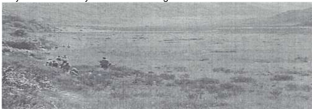
FOTO 2. Miguel Tróchez (2010). Salida a la laguna de Ñimbe, niños y padres de familia, escuela Michambe.

Las lagunas, los bosques, los páramos y los ríos son lugares sagrados. Los mayores cuidaban y nos hacen las siguientes recomendaciones.