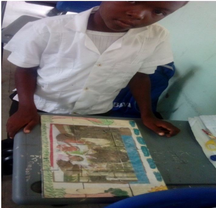
Foto # 9. Estudiante mostrando su rompecabezas, elaborado por él mismo como cierre del tema.