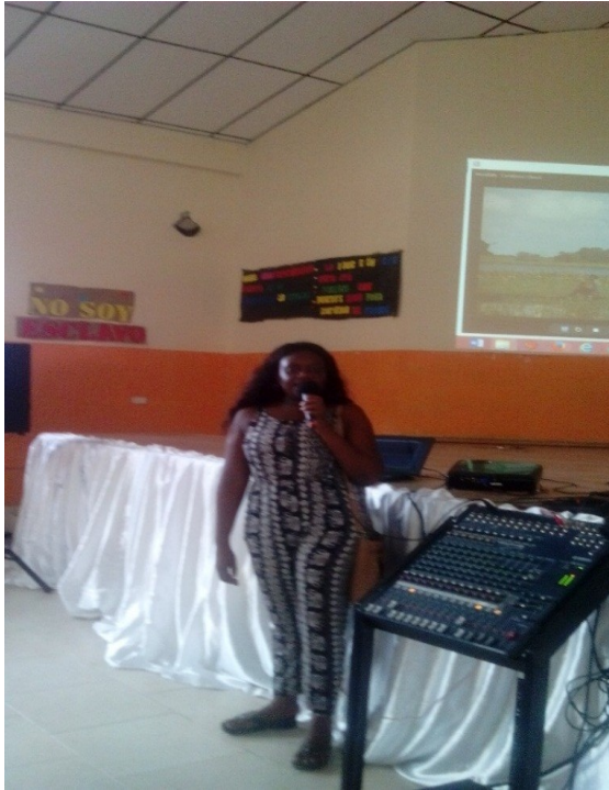
Foto # 8. Compañera explicándoles a los estudiantes sobre el documental “Invisibles”.