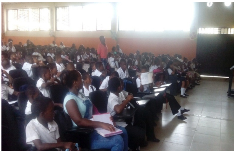
Foto # 7. Celebración de la afrocolombianidad en la I. E. San José.

Terminada la película, se les aclaró dudas, se les agradeció la participación y se les despidió. Las carteleras que elaboramos, las pegamos en las paredes del colegio, en el sector de la primaria.