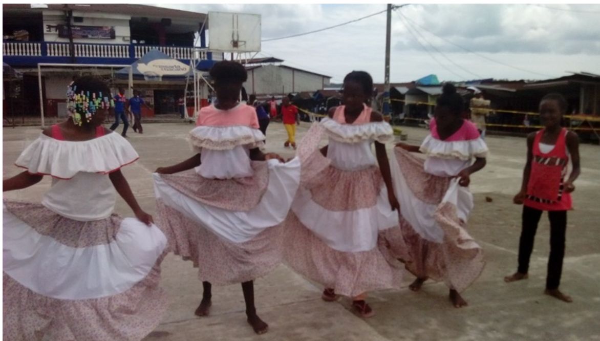
Foto # 6. Presentación acto cultural en el día de la afrocolombianidad. Por: Enny M. Ibarra L. Fecha: 21/ 05/ 2016

Foto # 5. Celebración de la afrocolombianidad en el municipio de parte de Unicauca (grupo A). Por: Coronel Zapata. Mayo 21 de 2016.