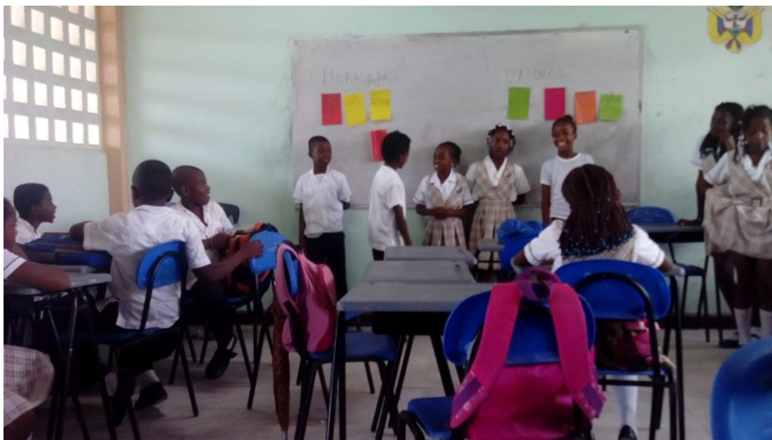
Foto # 3: Estudiantes exponiendo la enseñanza que les dejaron los cuentos y sus valores a resaltar. Por: Enny M. Ibarra L.

Para la siguiente actividad, conformaron nuevos grupos y a cada uno se le entregó un cuento de los que ellos mismos inventaron, para que escribieran en recortes de block de colores la enseñanza que les dejaba, los valores a resaltar, qué aprendieron con el tema y por qué les pareció importante.