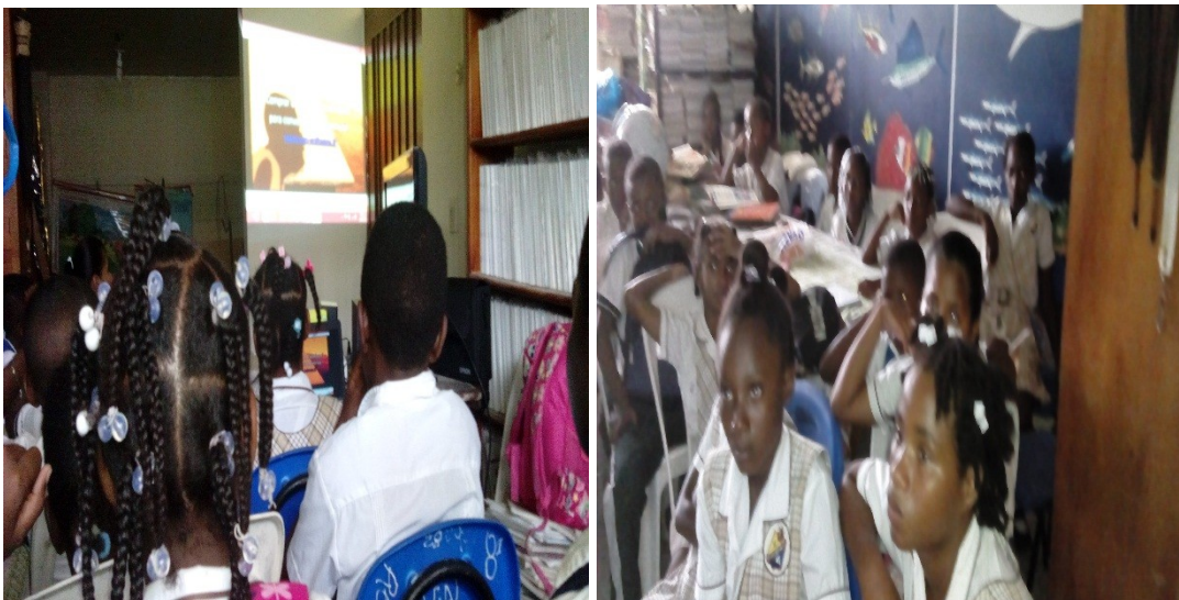
Fotos # 1 y 2. Niños concentrados viendo la película de Kirikú y la Hechicera. Marzo de 2016.

Junto a este tema trabajamos los signos de puntuación para lo cual utilicé un cuento de mi propiedad para explicarles el uso de cada signo (ver anexo #1). La lectura se trabajó de