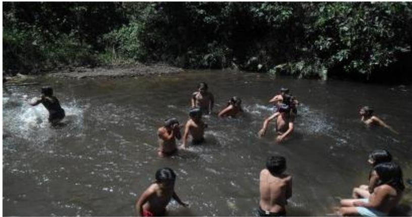
Ilustración 10 Salida pedagógica: río machete Resguardo de Piscitau 2014

Después de la caminata aprovechamos el tiempo soleado para echar un baño. Antes de esta actividad nos dedicamos 30 minutos para observar en qué estado estaba el río Machete; la mayoría quiere hablar, creo que por el afán de echarse el primer chapuzón todos aportaron sus ideas.