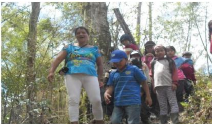
Ilustración 5 Salida pedagógica al Resguardo de piscitau

Otra hipótesis puede ser que el maestro titular aplica la metodología tradicional de enseñanza y los chicos estaban acostumbrados a ese proceso de aprendizaje, o sea el método de que docente habla y los estudiantes solamente escuchan. Pero lo que dudé porque el profesor asignado al grupo es estudiante de Etnoeducación y no creería que esté utilizando el método tradicional de la educación.