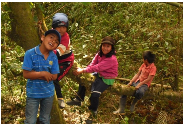
Ilustración 8 Visita al ojo de agua Resguardo de Piscitau 2014

En la jornada siguiente iniciamos describiendo con sus propias palabras, la observación de los niños desde la salida del salón hasta el lugar de la visita. Descubrieron animales como la hormiga trabajando en comunidad muy bien coordinados, dispuestas a defender la carga que llevan en la espalda hasta con su vida. A través del dibujo reflexionaron, debatieron y propusieron estrategias para el cuidado del este espacio. En cada dibujo me di cuenta que sí hay interés de los estudiantes en observar detalladamente los objetos que encontraron en el camino.