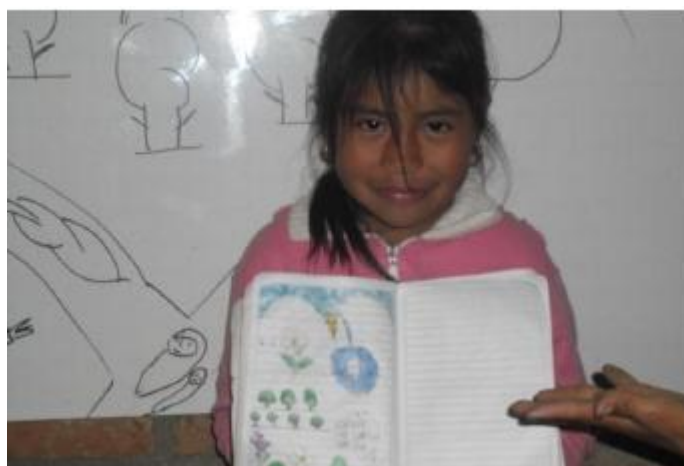
Ilustración 11 Ilustración 10 Representación de los sitios Sagrados a través del dibujo