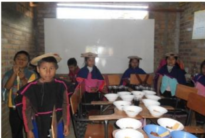
Ilustración 7 La ofrenda Fotografía. Andrea Secue Mestizo 2014

Urek wey wam – la voz de los niños: dijeron que las ofrendas se celebran desde el primero de noviembre con la preparación de alimentos propios como la chicha de maíz, el kendo o sopa de maíz tostado, sirven en una mesa para los espíritus que vienen a visitar y guiar nuestros caminos por- medio de sueños. Se dice que es el mes más alegre del año, se mingan para trabajos y por la noche bailan entre parejas, más antes se bailaban entre hombres disfrazados mujeres, lastimosamente esa costumbre se ha venido perdiendo.