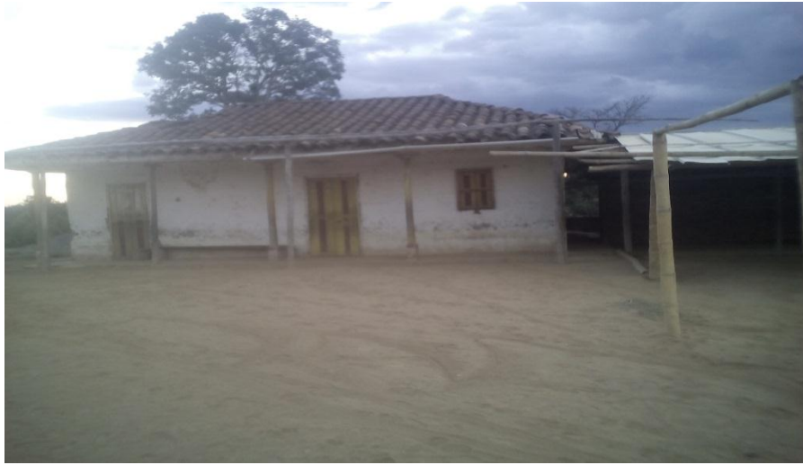
Ilustración 1 colegio intercultural Fotografía: André Felipe Ussa Muelas 2014

El Colegio Minga Intercultural (Ala kusrei Ya) está ubicado en la vereda Corrales, Resguardo Indígena Misak de Piscitau, a diez minutos de la cabecera del Municipio de Piendamó, Cauca.