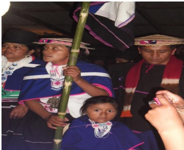
Ilustración 2 Cabildo Misak Piscitau

Las mingas fueron un factor importante para reunir a la comunidad Misak con el objetivo de socializar la idea y organizarse como Cabildo desde mediados de 1996, estructurándose poco a poco como una organización socio política que representaría a las familias y a toda la comunidad que se integraba mediante la adopción de un censo poblacional. Al principio tuvieron que vencer muchos obstáculos por malos entendidos que se generaban en el sector campesino vecinos de las veredas en donde se ubicaban los Misak.