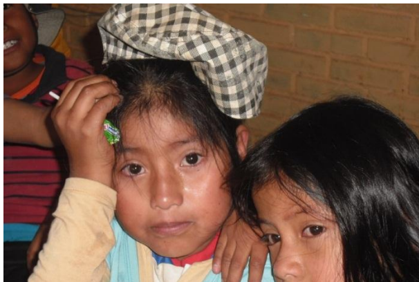
Ilustración 13 Expresión de emociones

Los niños y niñas se dieron cuenta de la importancia: primero, que el agua nos refresca y nos quita la sed, sirve para bañar, para los cultivos, etc. Reconocen que sin el agua el territorio se convertiría en un desierto vacío y desolado. Desde su mirada definen como las venas de nuestra madre tierra.