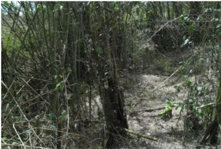
Ilustración 12 Destrucción del espacio sagrado Fotografía: Andrés Felipe Ussa Muelas 2014

Entonces en la siguiente clase llegamos todos común y corriente a la Escuela. Cada uno empieza con la actividad de dibujar el ojo de agua y el lago, luego de entregar el trabajo el estudiante Eduardo pide la palabra y comenta que el día de ayer estaban cortando las guaduas que quedaban alrededor del ojo de agua. Entonces ellos pensaron que los animalitos que viven en ese lugar y sin más palabras salieron del salón apresurados para ver en qué estado se encontraban el pozo. La sorpresa es devastadora, se han cortado la mayoría de los árboles. No hay nada que hacer, el espacio se ha quedado sin un arbusto. Al ver tal destrucción, con tristeza y sin decir palabras nos devolvimos.