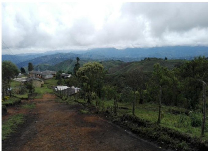
Figura 3. Panorámica antigua finca la Asunción

En lo que respecta a su organización política, hay que señalar que cuenta con un cabildo constituido desde el año 1994 y que empieza a operar gracias a los recursos de transferencia para la ejecución de proyectos colectivos de manera autónoma e independiente, ya que en años anteriores perteneció al resguardo de Pueblo Nuevo.