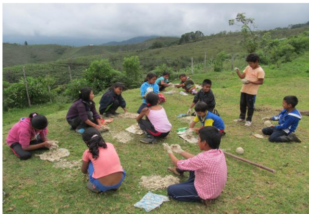
Figura 8. Niños(as) preparando la arcilla