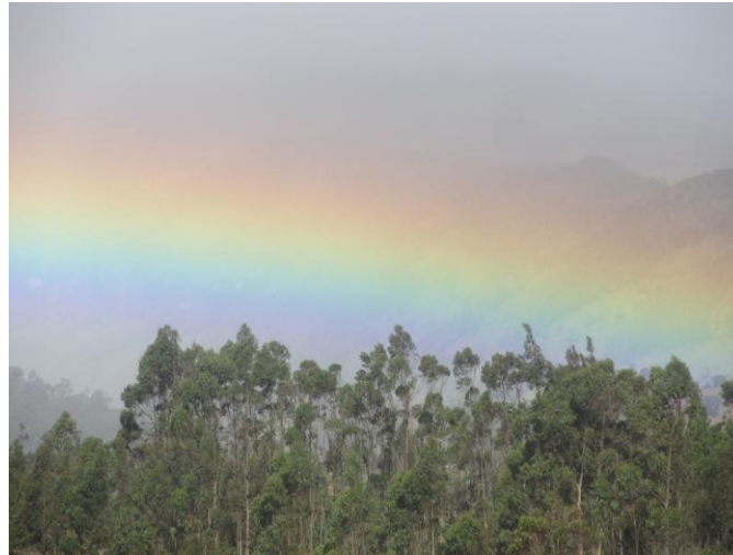
Figura 10. La visión como lineamiento conductor.

sueños y que ellos de vez en cuando tienen algún sueño. Entonces, les doy a entender el significado espiritual del arco iris como símbolo y relación con los tejidos Nasa.