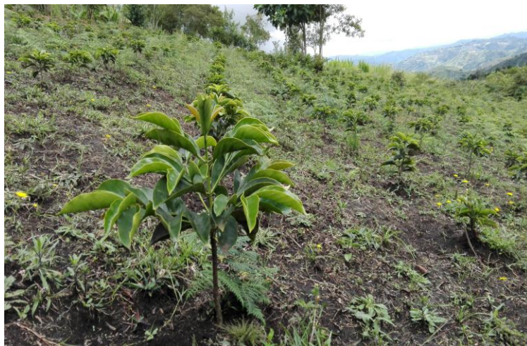
Figura 4. Panorámica de cultivo de café