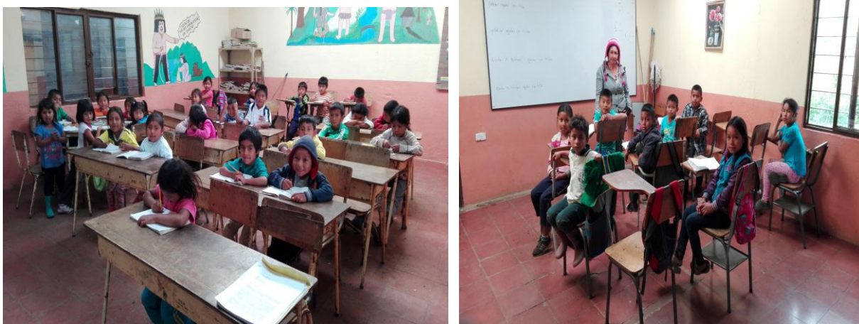
Figura 6. Distribución del espacio en los salones.

En este recorrido, encontramos que en la medida del tiempo la organización de los espacios escolares se ha ido modificando; ahora, el grado transición y el grado quinto están distribuidos de la siguiente manera: dos estudiantes en cada mesa, con su asiento individual. Es de mencionar que aún se conserva la distribución tradicional, puesto que las mesas están organizadas en fila.