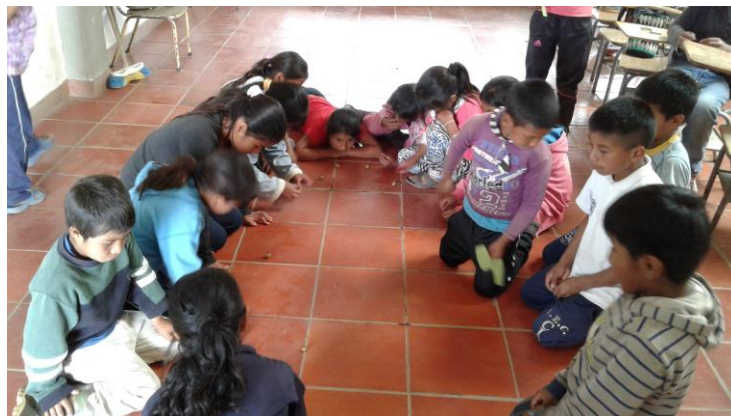
Figura 11. Niños (as) jugando con el trompo tradicional.

Los juegos son parte fundamental de las costumbres y los usos culturales del tiempo. A través de ellos, los niños y niñas aprenden sobre los valores culturales y además, se aprende a construirlos y conservarlos. Este tema fue valioso para abordar los elementos que constituyen los usos y costumbres de nuestro Pueblo Nasa.