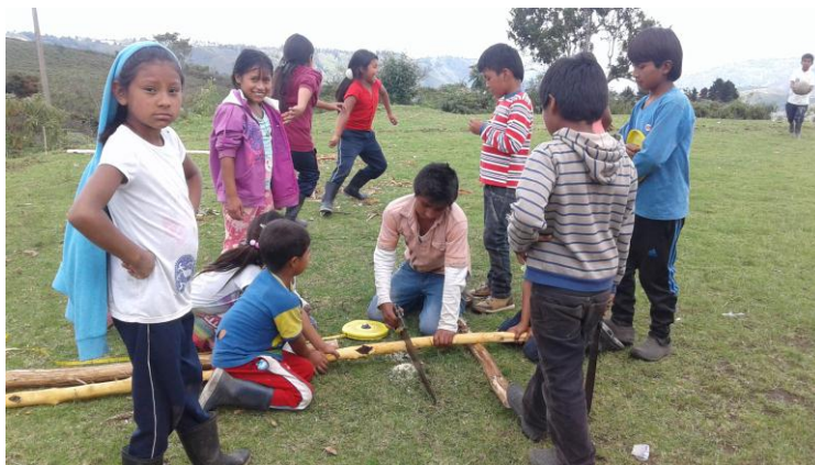
Figura 9. Niños en minga, construcción de escenario deportivo.