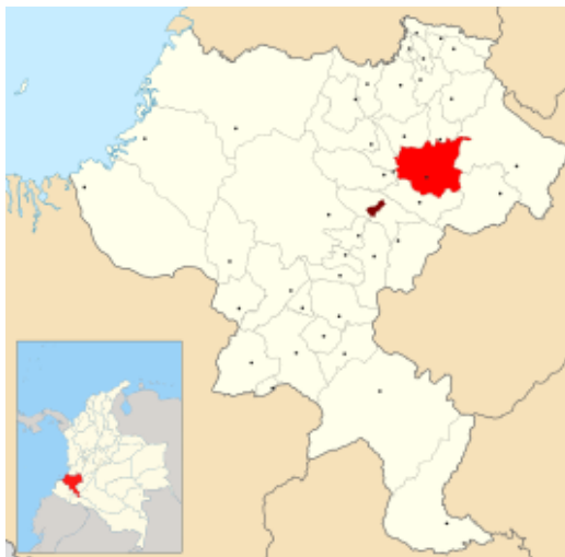
Figura 1. Municipio de Silvia-Cauca

El municipio de Silvia se encuentra ubicado en la región centro oriental del departamento del Cauca, sobre el flanco occidental de la cordillera central, a una altura de 2.527 m.s.n.m. su temperatura asciende los 10°C, por lo que se considera un clima frío y seco. Limita por el norte con los municipios de: Caldono y Jámalo, por el oriente con los municipios de: Páez e Inzá, por el sur con el municipio de: Totoró y por el occidente con los municipios de: Totoró, Piendamó y Caldono”. (Plan de Desarrollo Municipal Silvia, 2012-2015, p.12, 13.)