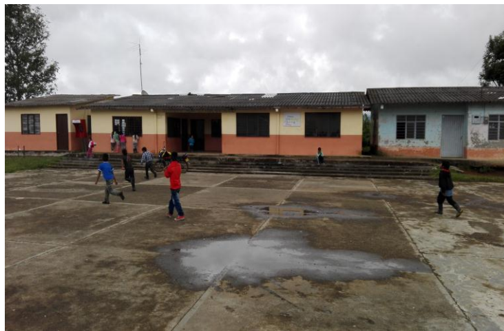
Figura 5. Panorámica Escuela

El Centro Educativo Rural Mixto Cristo Rey está ubicado en el resguardo de Tumburao, sector Centro. Fundada en el año 1936, obedeció al proyecto de colonización del Estado de esa época, basado en la ideología de educar y civilizar, como cuentan los relatos de los mayores. Aunque los datos no reflejan nombres de los fundadores, se menciona que algunos residentes tenían la necesidad de educar a sus hijos, procurando mantener su asistencia escolar, sin embargo, siempre se presentaban estadísticas altas en deserción e inasistencia, en la medida que los programas educativos de esta época no obedecían a los verdaderos intereses educativos como Pueblo Nasa.