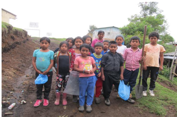
Figura 7. Estudiantes en actividad de recolección de arcilla.