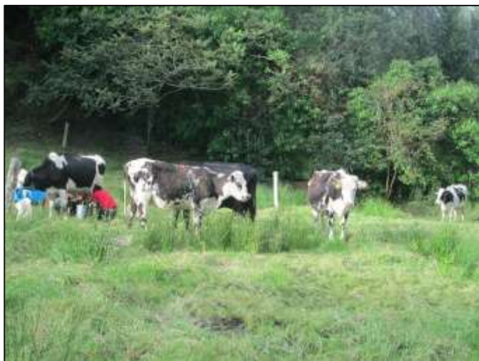
Foto 2. Ordeño de ganado vacuno 2012

La economía del territorio es básicamente de subsistencia, su actividad depende en gran parte de la agricultura, especialmente la ganadería, la cual se realiza cerca de las viviendas y en las parcelas ubicadas en las periferias de las montañas.