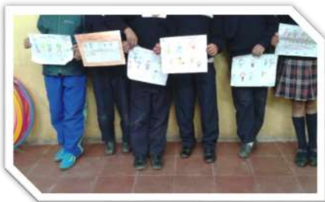
Foto 6: Dibujo representativo de la familia de los niños del grado 4º

Día tras día fue pasando el tiempo, y con él, las maravillosas experiencias que vivía con ellos, siempre a la expectativa de lo que hiciera, les agradara y no se sintieran obligados a hacer las cosas. Era conveniente hacer una dinámica de motivación para tenerlos contentos y no se distrajeran.