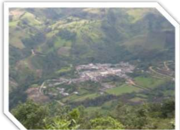
Foto 1. Panorámica de Pitayó, tomada desde la vereda de Gargantillas

“El origen de los paeces se remonta al origen de la gran familia Chibcha en Colombia, de la cual se postula que son descendientes directos; estos al igual que todo grupo indígena sufrieron la implacable influencia de los españoles en todos los aspectos.