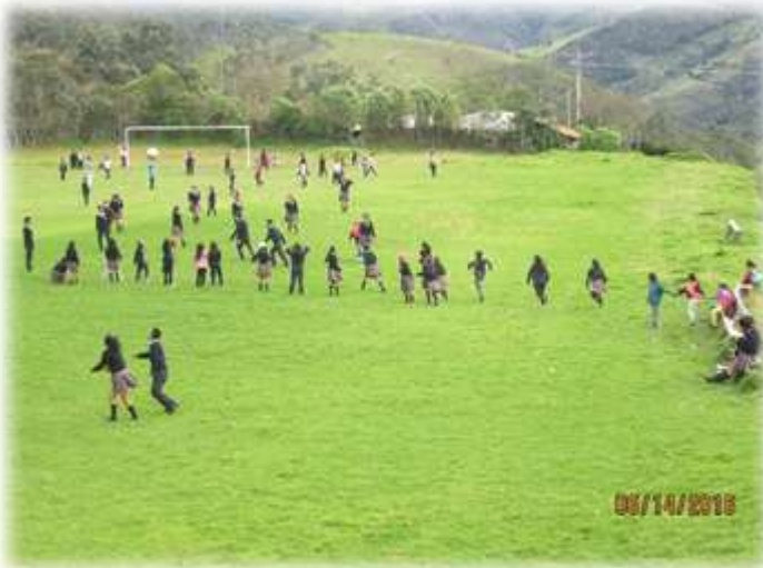
Foto 6: Integración niños de 4º de Nazareth, y estudiantes de 4º y 11º de la I.E Renacer Páez

En el mes de junio se hizo una integración entre los niños del grado 4º, 5º de la institución