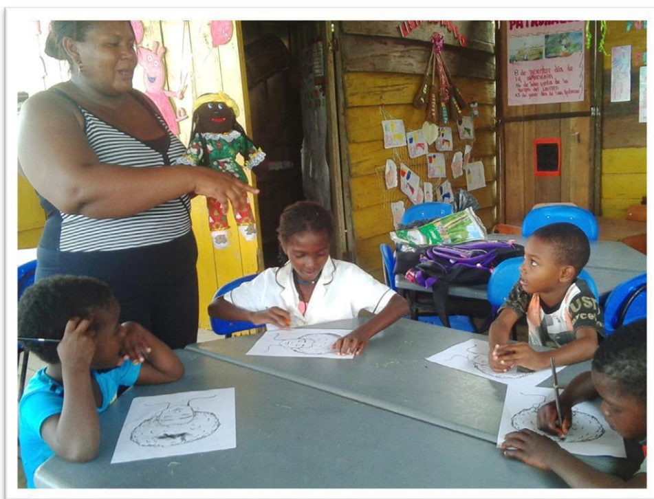
Foto No 5 “Trabajando en el aula”