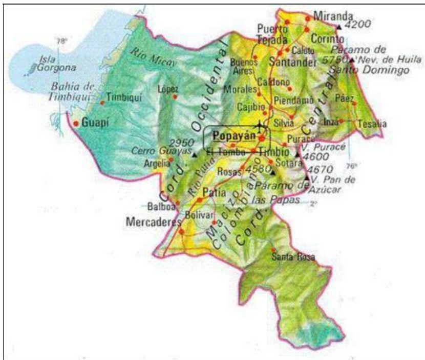
Mapa 1. Departamento del Cauca

Pero a medida que pasaron los años esta se fue debilitando porque fueron apareciendo nuevos cargos y empleos públicos, pero esto no alcanza a bastecer la crisis económica por la cual está atravesando Guapi en la actualidad porque no hay empleo para todos; de esta manera el campo o Zona Rural ha sido abandonado porque ya la gente no quiere sembrar más y como el gobierno les paga por desplazado sean han olvidado del campo. Ya no se siembra y el producto como el plátano y las frutas es traído del municipio del Nariño y las verduras, frutas arroz y todo lo demás de base de alimentación son traídas del interior del país por los paisas cuando todas esas cosas se daban aquí dentro del municipio y se surtía al puerto de Buenaventura.