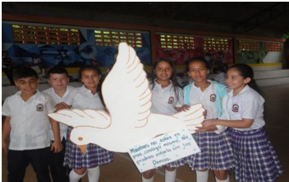
Figura 2. Mensaje alusivo al acoso