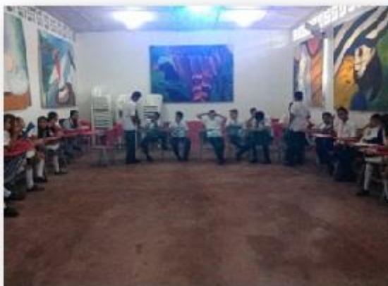
Figura 1. Adecuación del salón y observación de los cuadros