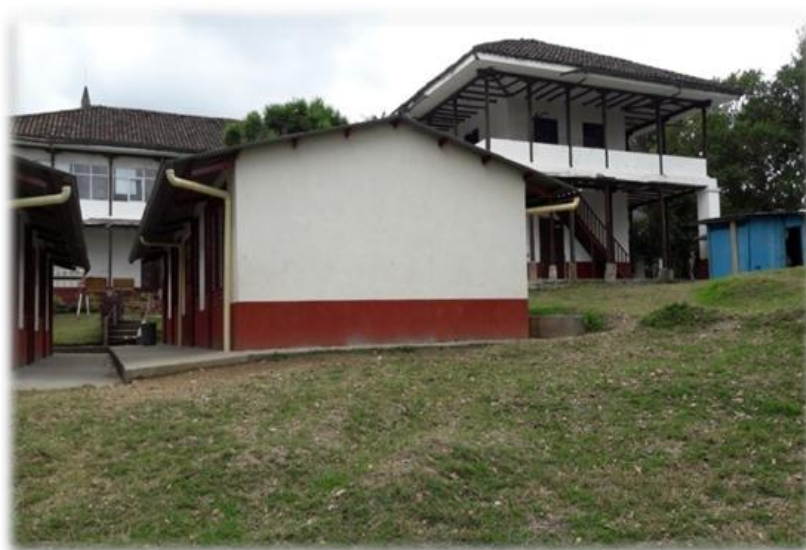
Figura 6. Sede Antonio García Paredes.

Esta unidad educativa se encuentra ubicada en la CI 17 12-40, piedra sur vía la ladera al frente de la Normal Superior, es una casona donde antes funcionaba la CRC, conserva la estructura de las casas coloniales, las paredes son de barro y su piso es de ladrillo hecho de barro, tiene una vegetación armoniosa la cual adorna el recinto escolar.