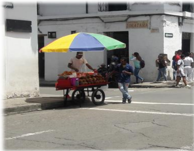
Figura 3. Centro parque de caldas Popayán Cauca.

distintas partes del territorio colombiano específicamente de la costa pacífica, norte y sur del cauca, que se desplazan hacia esta ciudad en procura de terminar y avanzar en sus estudios universitarios para una buena formación y estabilidad social . Otras personas, especialmente de la Costa Pacífica, llegan a Popayán buscando alternativas económicas sin encontrar oportunidades de trabajo dignas. En consecuencia, esta población se dedica a trabajos informales como ventas callejeras y en otros casos, logran constituir un negocio como es el caso de las peluquerías y los restaurantes de comida del Pacífico. En los casos anteriores, en la ciudad se ha visto la discriminación y la mala imagen prejuiciosa, que desde hace tiempo se ha creado de los afros.