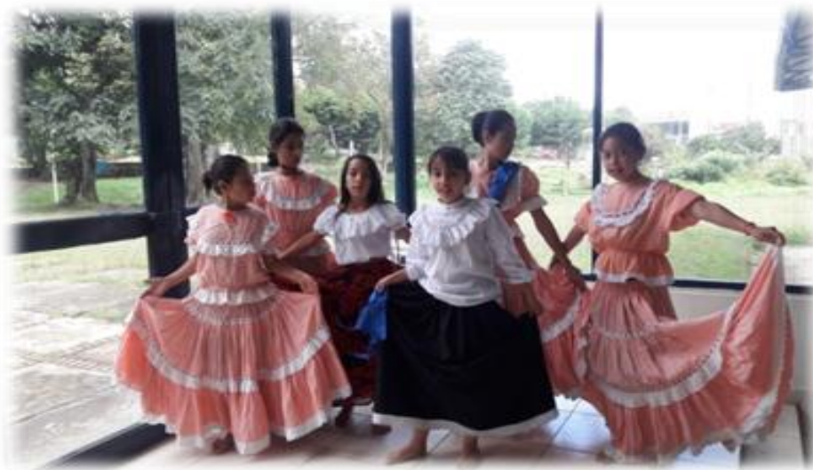
Figura 12. Montaje de danzas I.E.GP.