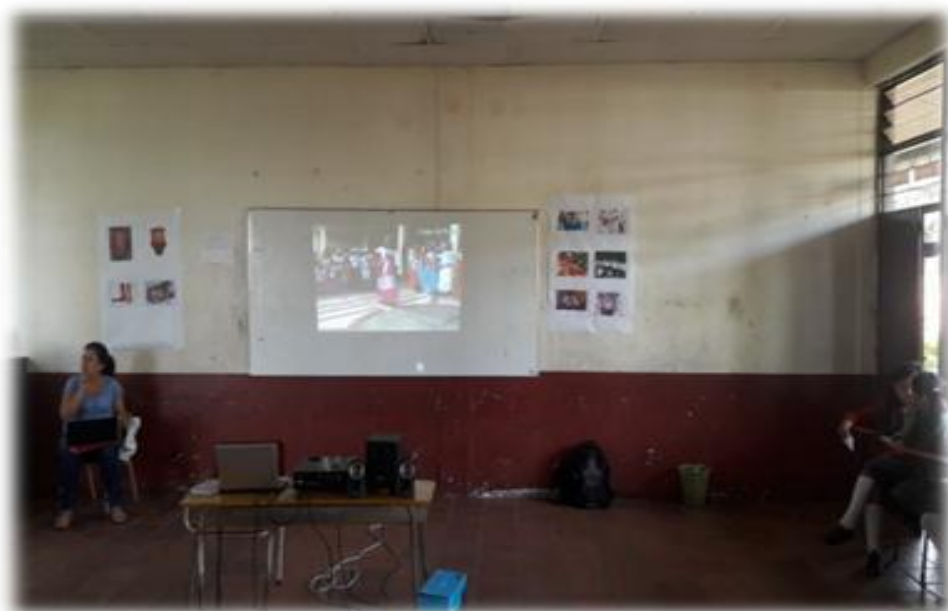
Figura 19. Acercamiento a lo que son las fiestas patronales.

En el transcurrir del día se pone en práctica una dramatización con los niños creando una fiesta patronal, donde ellos construyeron máscaras, y juegos alusivos a las mismas.