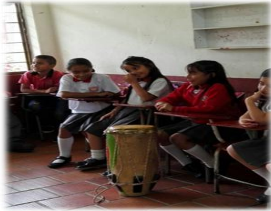
Figura 11. Niños y niñas del grado cuarto, I.E García Paredes Popayán.