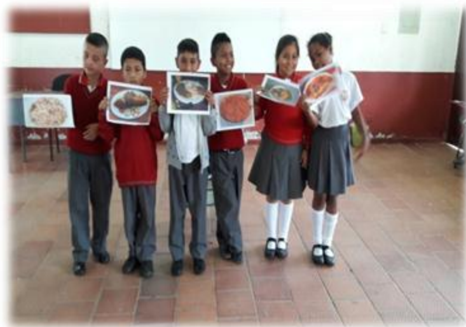
Figura 17. Acercamiento al reconocimiento de los platos típicos afros.

Incluir la gastronomía como un estrategia pedagógico para visibilizar las expresiones culturales e históricas de las poblaciones negras, afrocolombianas y raizales.