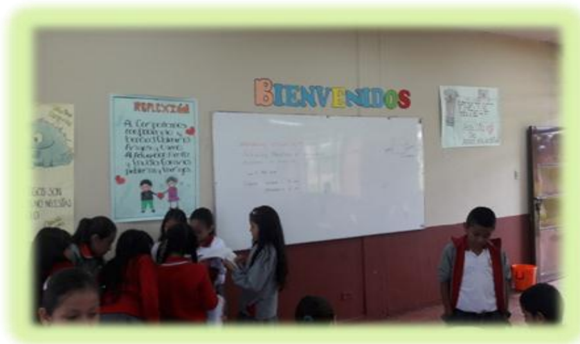
Figura 9. Niños y niñas en el aula de clases del grado cuarto de primaria.

El aula de clase del grado cuarto de primaria es un espacio amplio con dos ventanales grandes el cual permite buena ventilación, también tiene tres lámparas de neón grandes que mantiene el aula bien iluminada; el salón está decorado con un horario que indica las