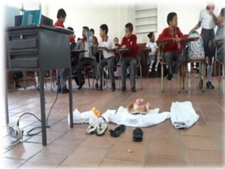
Figura 15. Niños y niñas del grado cuarto. I.E.G.P. participando de la actividad pedagógica.sf.

para las labores u oficios de su quehacer cotidiano y que fueron retomados por el folklor para su difusión y uso dancístico. Colores, formas, instrumentos de trabajo, elementos rituales, hacen parte de esta diversidad cultural manifiesta a través de la danza.