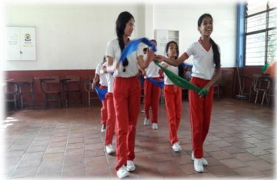
Figura 13. Montaje de danza, niñas y niños del grado cuarto. I.E.G.P .

Este subcapítulo da cuenta de cuáles son las principales danzas afro descendientes del departamento del Cauca, y como a partir de ellas, podemos integrarnos como comunidad que comparte raíces culturales comunes permitiendo así, el respeto y el reconocimiento de las mismas.