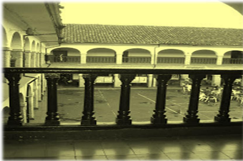
Figura 4. Real Colegio San Francisco de Asís Popayán-2008.