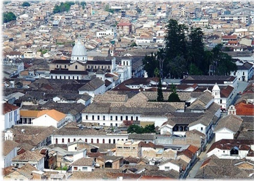
Figura 2. Ciudad de Popayán Cauca.

Es una de las ciudades más antiguas y mejor conservadas de América, lo que se ve reflejado en su arquitectura y tradiciones religiosas, reconocida por su arquitectura colonial y el cuidado de las fachadas que hacen parte de uno de los pocos sectores históricos del país. Arquitectura que fue construida por mano de obra afro e indígena, aportes que no han sido reconocidos y valorados, bien sea por la estructura social que en época colonial estaban escalonados los afrodescendientes. “Las representaciones de lo negro y lo indígena construidas durante este periodo muestran el lugar que ocuparon estas poblaciones en el discurso de los sectores dominantes, que de diversas maneras se hace presente en los regímenes de representación en épocas posteriores”. (Rojas, A; y Castillo, E., 2005)