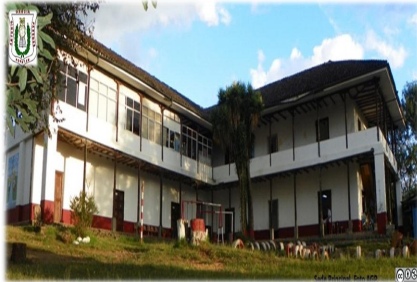
Figura 5. Institución Educativa Antonio García Paredes. Popayán..

La Institución Educativa ANTONIO GARCÍA PAREDES, tiene sus orígenes en el Real Colegio San Francisco de Asís. Desde 1976 hasta julio de 1980, funcionó como la primaria del Real Colegio San Francisco de Asís, siendo esta de propiedad del Departamento del Cauca.