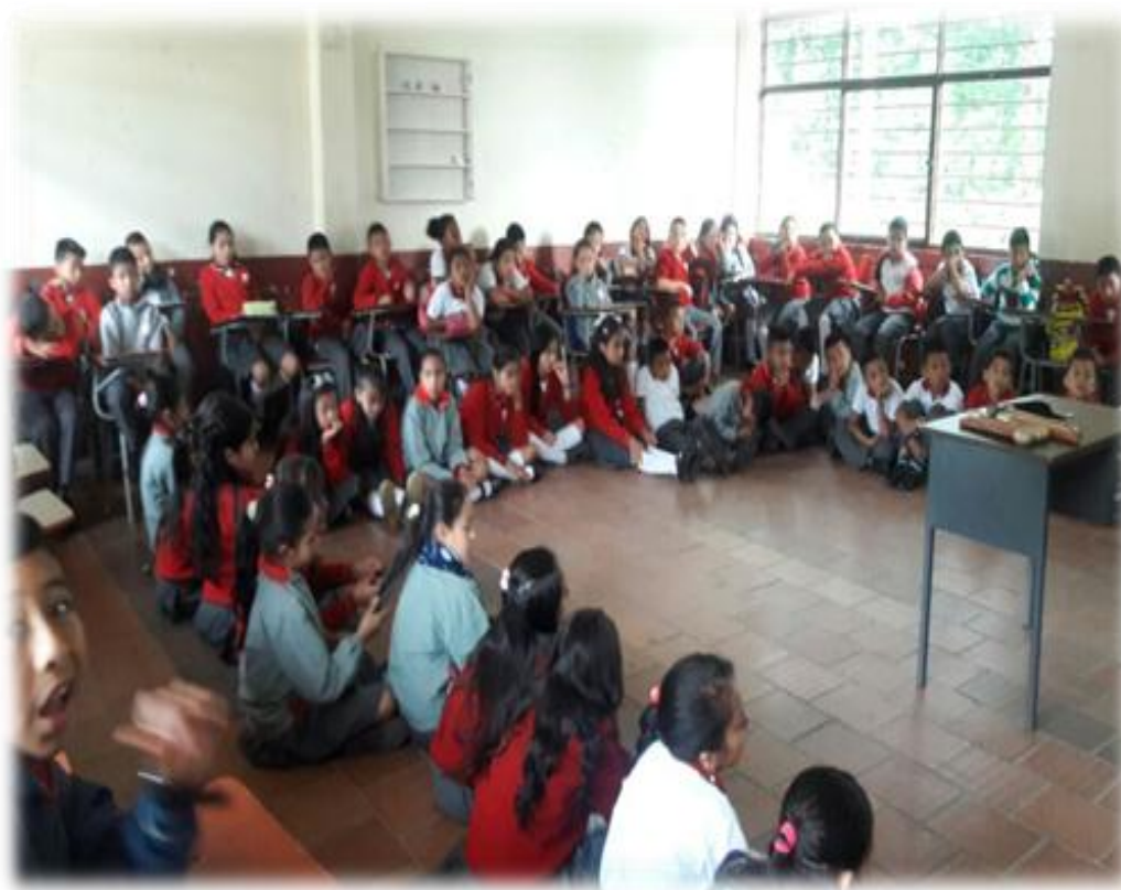
Figura 7. Niños y niñas de la Institución Educativa García paredes.

La institución cuenta con 40 profesores y una rectora; los docentes pertenecen a la comunidad de Popayán, muchos son docentes licenciados especializados en su carrera, y algunos de los profesores internos no están graduados, pero se encuentran cursando su licenciatura. Las actividades y prácticas pedagógicas dentro de las aulas se mantienen dentro de las programaciones tradicionales escolares y regidas por el programa oficial que establece el Ministerio de Educación; se desarrollan trabajos por objetivos y dentro de la rutina que caracteriza a las escuelas del área urbana, con poco acercamiento a las dinámicas sociales y culturales de la comunidad.