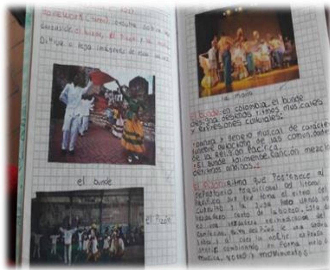
Figura 14. Trabajos de escritura de los niños y niñas del grado cuarto. I.E.G.P.

Se obtuvo un buen acercamiento en cuanto al reconocimiento de la música del afro descendiente; al indagar sobre los conocimientos previos, observé que los niños y niñas tenían nociones de algunas melodías tradicionales afros que habían escuchado, como el bunde San Antonio . Llegaron a identificar y analizar el ritmo de la música a la danza, y a qué lugar pertenece cada una de ellas; lograron aprender los pasos básicos, cuál es el ritmo de cada danza y también, entender que todos y todas tenemos influencia de este tipo de música en nuestras vidas.