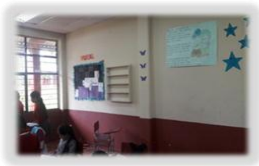
Figura 8. Aula de clases del grado cuarto de primaria.