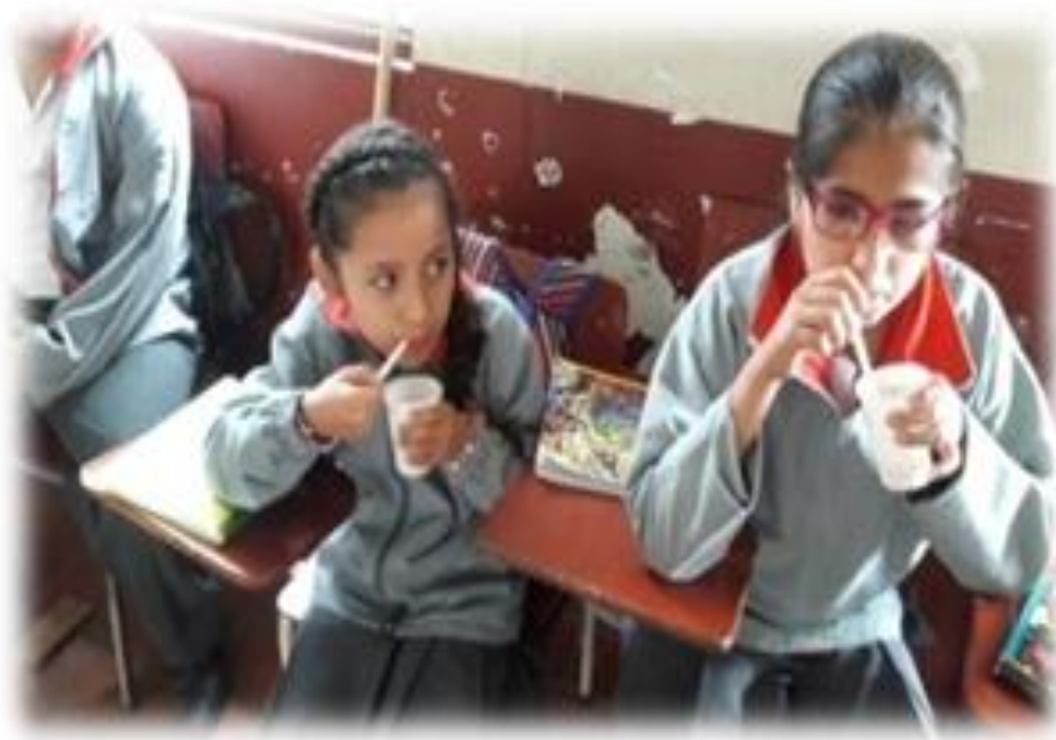
Figura 18. Niños y niñas degustando un delicioso champú, tradición de Villarrica Cauca.