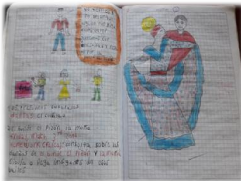
Figura 16. Dibujos de los niños y niñas del grado cuarto. I.E.G.P.