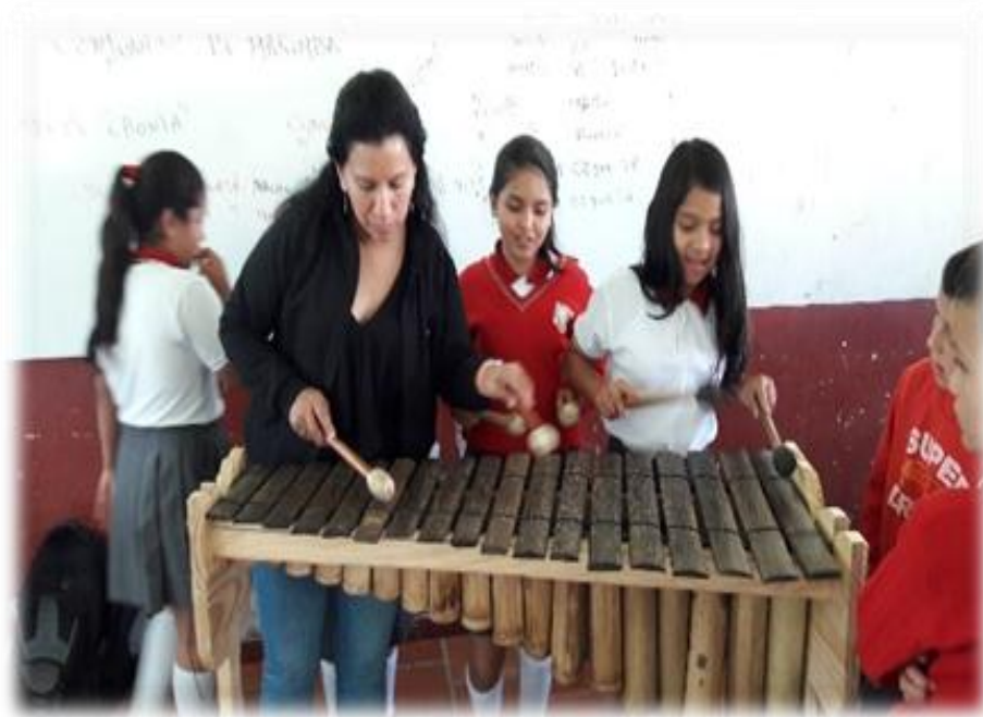
Figura 10. Docente, niños y niñas del grado cuarto, I.E García Paredes Popayán.

Después de esta labor se escucharon algunos ritmos musicales analizando la letra de las canciones afro descendientes y de grupos conocidos en el medio como: Herencia de Timbiquí, grupo Bahía, grupo Canalón, grupo Socavón, grupo Son Balanta del Patía, Chocquibtown, Baterimba de Santander de Quilichao, entre otros. También dialogamos y compartimos otros ritmos que a ellos les gustan como el reggaetón, la bachata, la salsa y el rap.