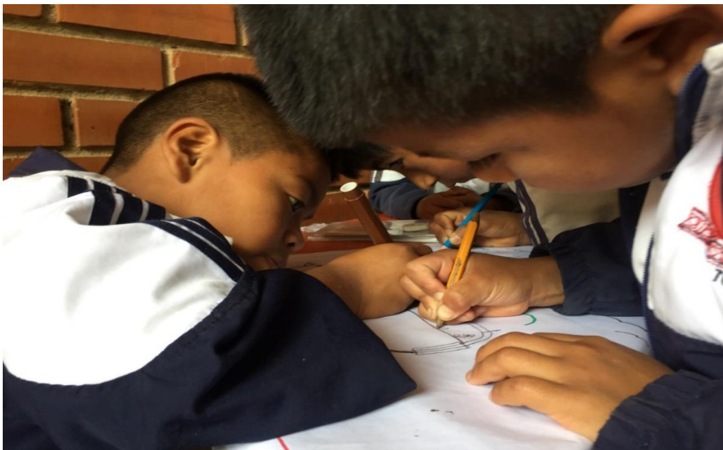
Fotografía 15. Recetas tradicionales. 18/04/18, Institución Educativa Palacé Elaboración de carteleros con recetas tradicionales, trabajo en equipo.

Ensalada de frutas: Ensalada de frutas realizada el 24 de abril, los niños llevaron frutas, colaboraron en actividades que no fueran peligrosas para ellos, como lavar las frutas y seleccionarlas, el manejo de cuchillos lo realizaron las profesoras encargadas (titular y en formación), esta actividad se aprovechó para trabajar diferentes temas como la higiene, los sentidos, el origen de los alimentos, entre otros, los niños estaban muy emocionados y ansiosos querían consumir lo más pronto la ensalada. Sin dejar a un lado el fortalecimiento de la Soberanía Alimentaria, como principal objetivo, se invitaba a los pequeños a cambiar la comida chatarra o los dulces por un alimento como el preparado en esa jornada.