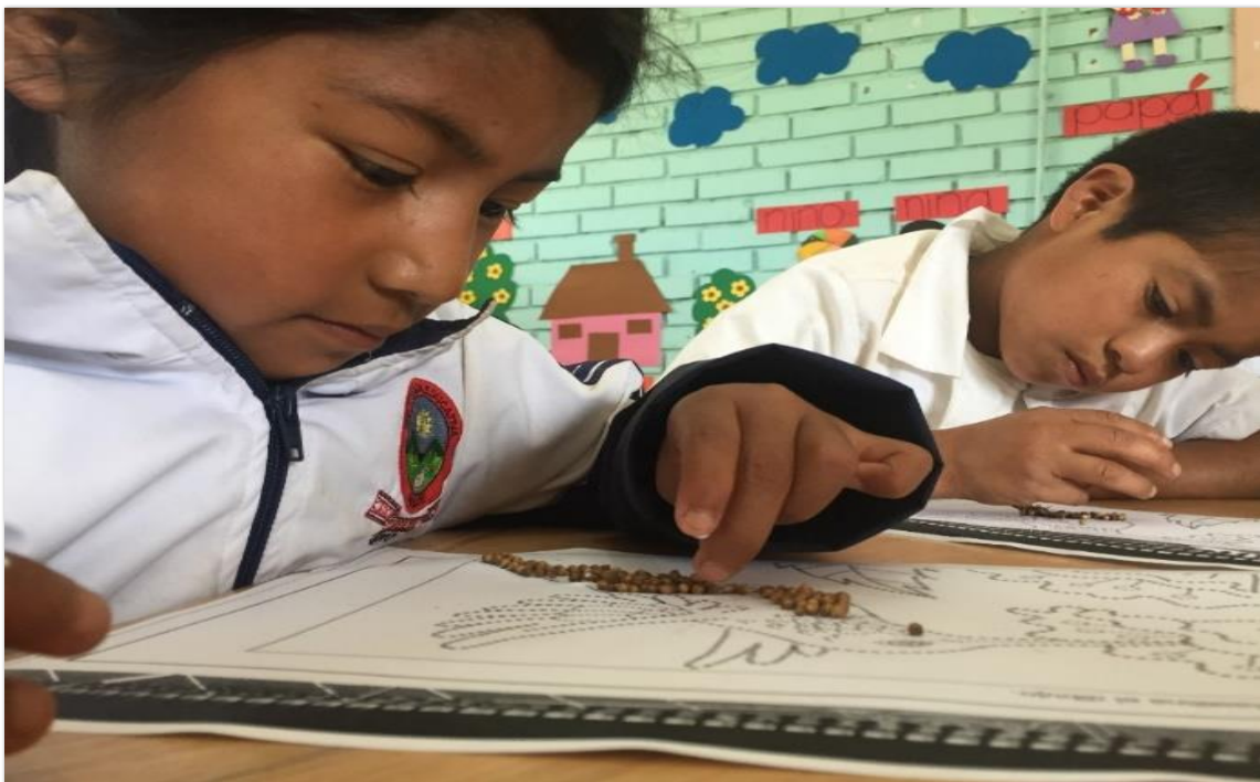
Fotografía 12. Manualidad con semillas

pegante de manera individual, se decoró con temperas y se expuso en el tablero a toda la institución. Fue una actividad que entretuvo y motivó a los estudiantes. Además, se mostraron muy felices con sus resultados, era muy interesante probar que las semillas no sólo se podían emplear para consumir o sembrar, sino que también para hacer otro tipo de actividades como las manualidades y las cuales se compartieron con toda la institución.