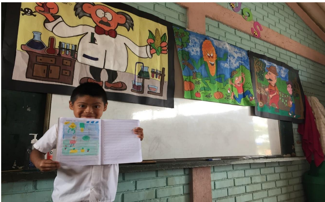
Fotografía 9. Creación de cuentos 26/02/18, Institución Educativa Palacé Creación y socialización de cuentos, con el tema de semillas y soberanía alimentaria.

Observar y analizar fueron dos importantes procesos en la práctica, les agradaba si esto lo hacían por fuera del aula principalmente, les interesaban los videos y las imágenes que estuvieran relacionadas con el tema de trabajo. Sin dejar a un lado lo que se encuentran fuera de la institución es decir en el contexto en el que viven. Algunos observaban y analizaban con más detalle.