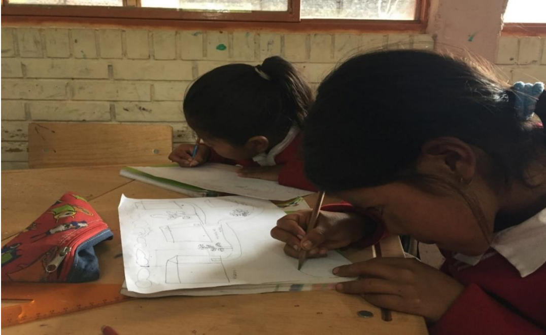
Fotografía 17. Cartografía social 07/05/18, Institución Educativa Palacé Actividad que mostro los amplios conocimientos de los niños sobre el contexto

Muestra gastronómica y trueque: 11 de mayo, cierre de práctica, muestra gastronómica y trueque, donde participaron estudiantes de la Universidad del Cauca de la licenciatura en Etnoeducación, comunidad educativa de Palacé y padres de familia, los encargados estudiantes de 2º, 3º, 4º y 5º, se dio una muestra de algunas recetas con productos tradicionales que se pretendían recuperar, en el caso del grado segundo se preparó torta de zapallo, colada de arracacha, turrónes de cidra papa, los alimentos fueron de total agrado para los asistentes, se recibieron muy buenos comentarios. También se realizó el trueque con la participación de una madre de familia quien compartió sus conocimientos. Este encuentro pedagógico fue muy enriquecedor, se sintió un ambiente de entusiasmo, se espera que este tipo de actividades no se pierda. En esta ocasión se dio un espacio para la exposición de las cartillas y juegos realizados por los estudiantes de noveno semestre de la licenciatura.