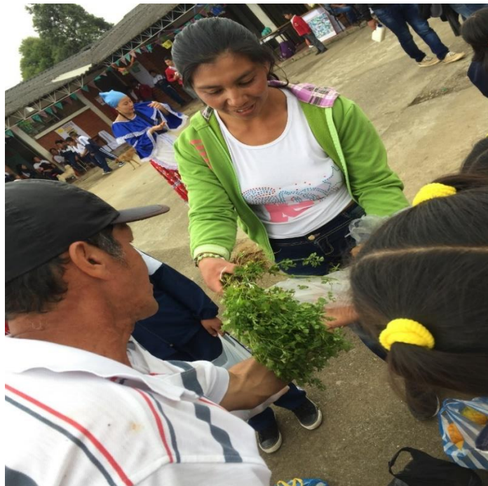
Fotografía 19. Trueque

Participación en la muestra gastronómica con alimentos como torta de zapallo, turrone de cidra papa y colada de arracacha.