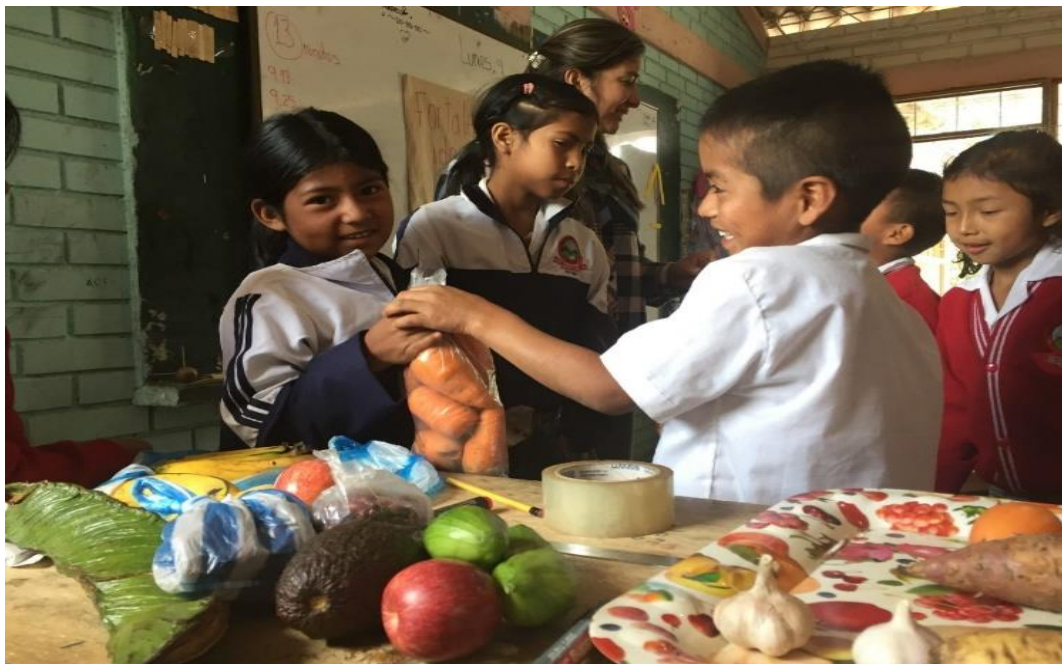
Fotografía 14. Trueque en el aula