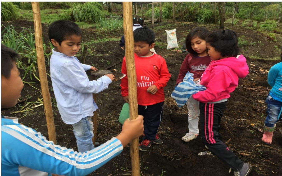
Fotografía 13. Organización de la siembra 04/04/18, Institución Educativa Palacé Trabajo en equipo, distribución de actividades para el inicio del sembrado.

que ya tienen experiencia con lo relacionado a la siembra. Esta actividad se realizó en grupo, los estudiantes del grado segundo y las profesoras.