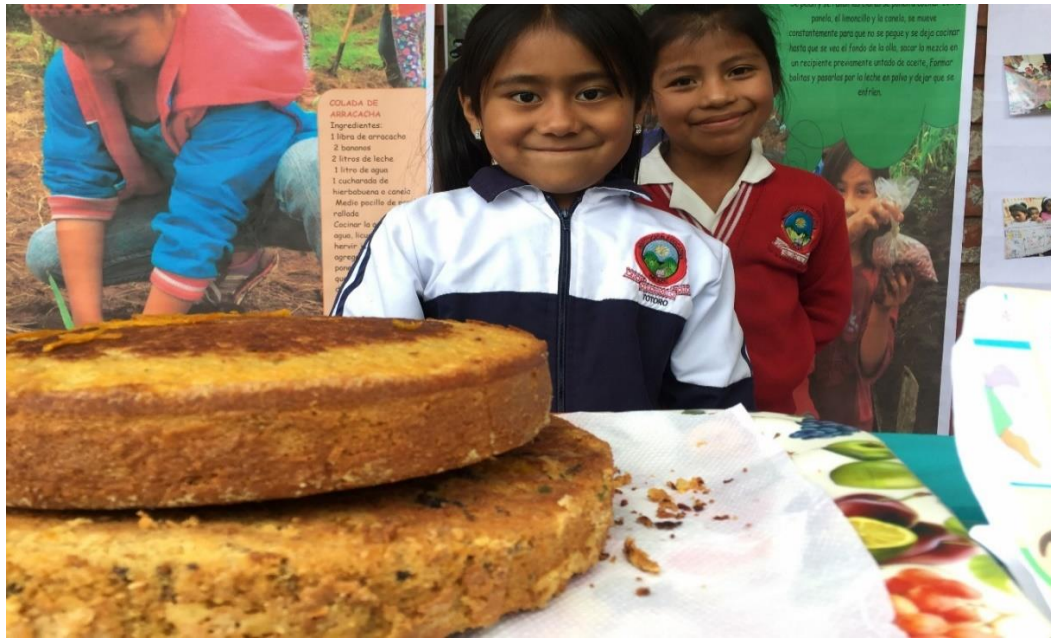
Fotografía 18. Muestra gastronómica 11/05/18, Institución Educativa Palacé

Participación en la muestra gastronómica con alimentos como torta de zapallo, turrone de cidra papa y colada de arracacha.