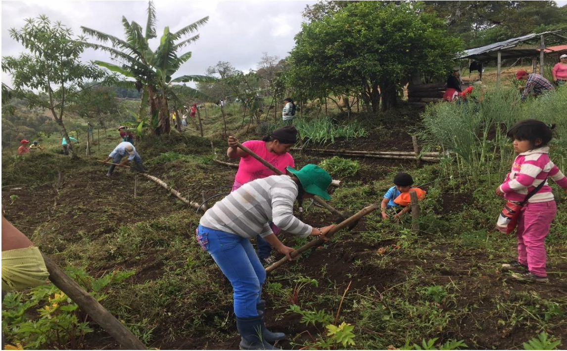
Fotografía 2. Adecuación del tul 28/02/18, Institución Educativa Palacé

Proceso llevado a cabo con padres de familia y estudiantes, con la intención de adecuar el terreno para la siembra.