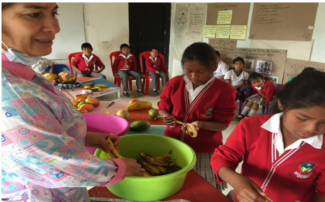
Fotografía 16. Ensalada de frutas 24/04/18, Institución Educativa Palacé

Preparación de una ensalada de frutas, con la participación de los estudiantes, se integraron diferentes temas con esta actividad, tratando de fortalecer la soberanía alimentaria.