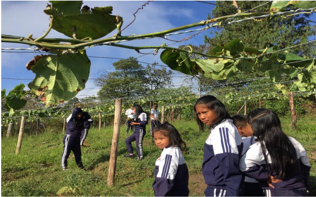
Fotografía 20. Visitas al tul 14/03/18, Institución Educativa Palacé

Visitas al tul: Realizadas en diferentes fechas, donde los niños observaban los cambios y los escribían o dibujaban, como objetivos principales, dialogaban con los responsables de otras siembras sobre lo que ahí ocurría y transmitían los conocimientos.