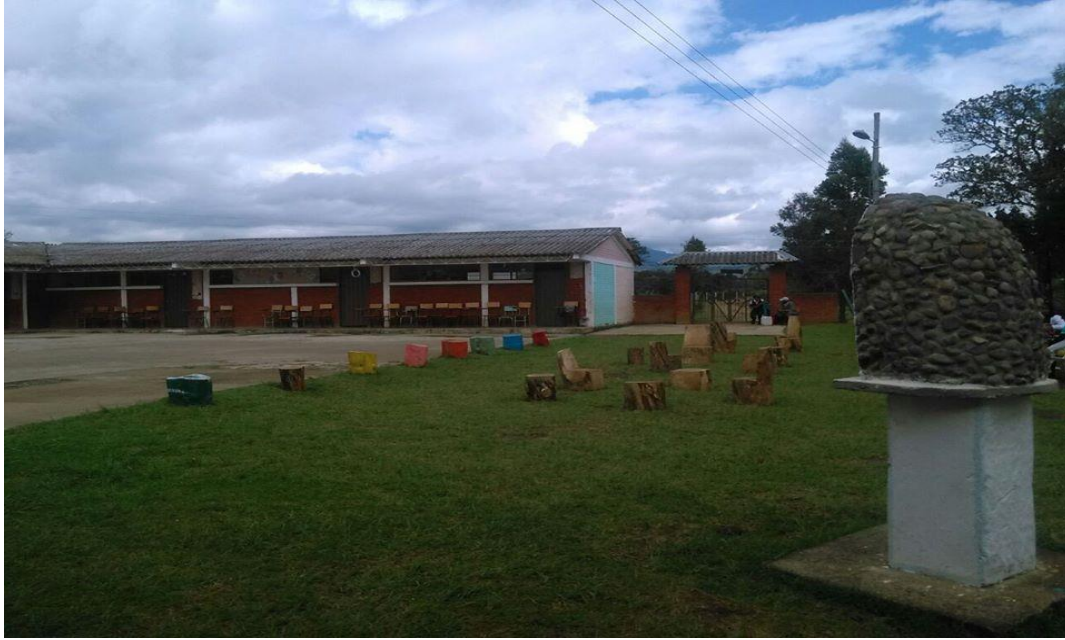
Fotografía 1. Patio principal IEP 12/02/18, Institución Educativa Palacé Espacios con zonas verdes y aulas.

En la parte principal de la institución hay un patio donde se realizan diferentes actividades, frente a este patio se puede encontrar la rectoría y el baño el cual es para todos los estudiantes. Hacen uso de servicios como transporte y taller de escuela de padres, este último se realiza una vez por periodo académico.