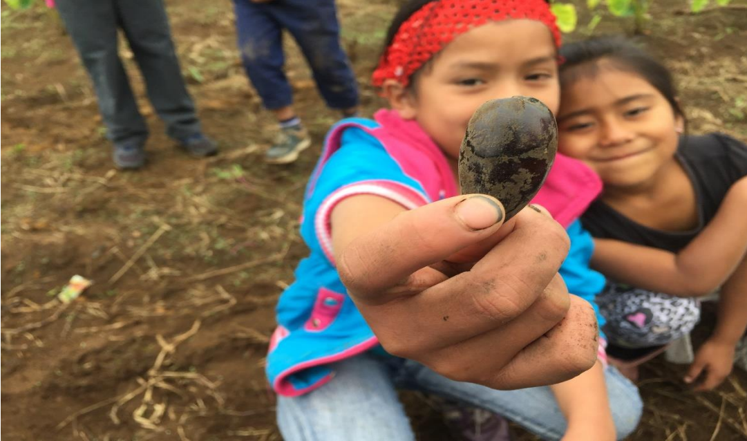
Fotografía 3. Reconociendo semillas 04/04/18, Institución Educativa Palacé Aprendizaje en el proceso de la siembra, donde los niños reconocen las semillas que se plantaran en el tul.