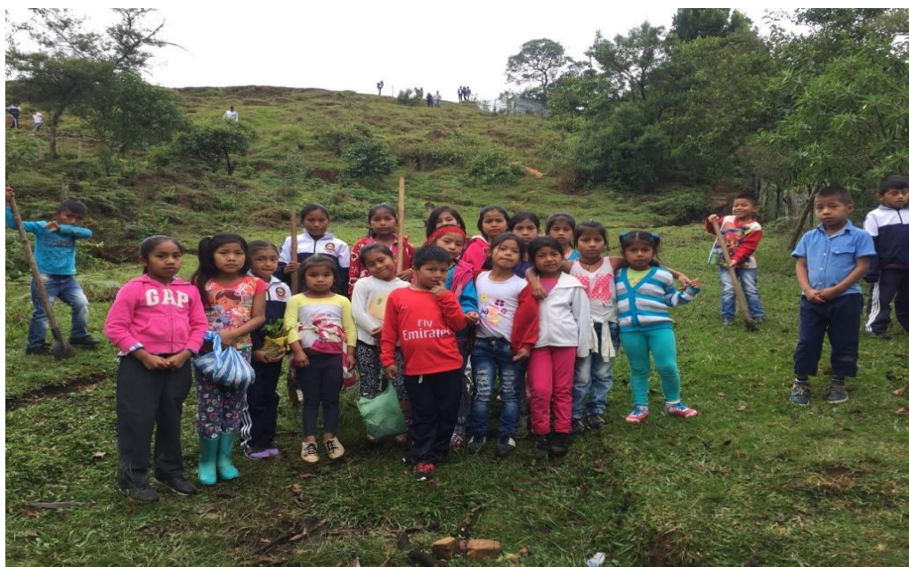
Fotografía 7. Algunos estudiantes del grado segundo, listos para la siembra 21/02/18, Institución Educativa Palacé Los pequeños aportan semillas de la región para la siembra, además trabajo y conocimientos, para la labor en el tul.