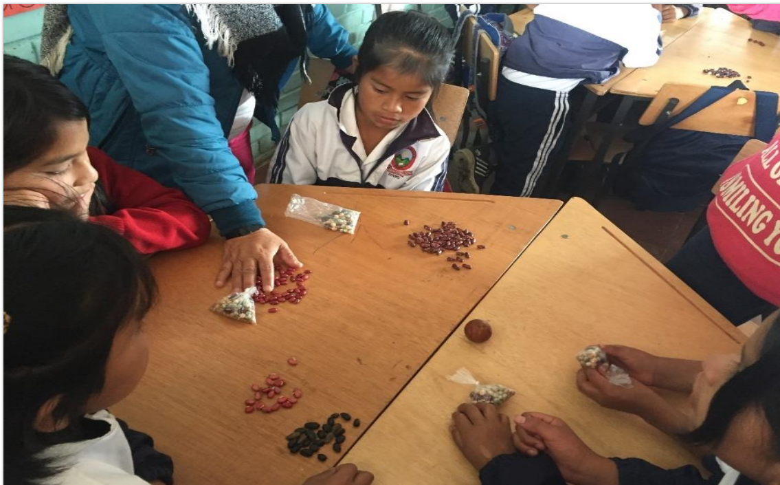
Fotografía 10. Compartir semillas 21/02/18, Institución Educativa Palacé

medio de dictado, este fue un trabajo en grupo, el principal objetivo fue compartir las semillas, clasificarlas y dialogar sobre la importancia de estas para la región y para la adecuada alimentación.