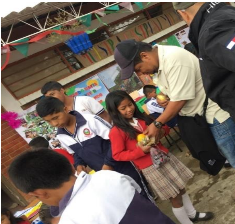
Fotografía 22. Trueque tradicional 11/05/18, Institución Educativa Palacé

especialmente para aquellos que no habían participado en este encuentro de sabiduría y sana alimentación.