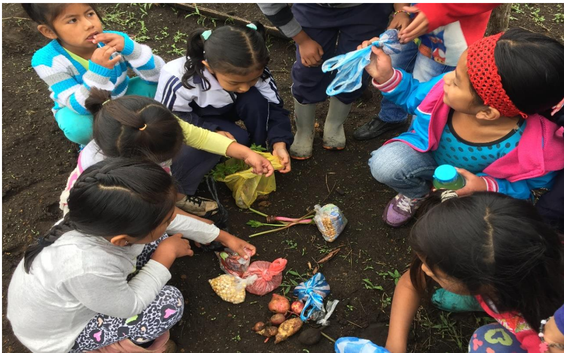
Fotografía 23. Organización de semillas 04/04/18, Institución Educativa Palacé

Quien reaccionó contra la escuela separada de la vida, aislada de los hechos sociales y políticos, que la condicionan y determinan, parte de su pedagogía unitaria y dinámica, que relaciona al niño con la vida; con su medio social y con los problemas que enfrenta, tanto personales como de su entorno. Entiende así mismo, que la escuela debe ser la continuación de la vida familiar y de la comunidad en la que interactúa la escuela, por lo que la tarea del maestro debe controvertirla en una escuela viva y solidaria con la realidad del niño, de su familia y de su entorno. (Zapata, 2012)