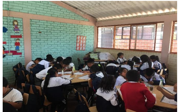
Fotografía 4, Plano del aula, grado segundo Institución Educativa Palacé Fotografía 5 y 6 aula grado segundo

Hay disponibles seis mesas con sus asientos correspondientes para este número de alumnos. Además hay un escritorio que corresponde a la docente, un tablero y tres ventanas grandes que hacen que el aula esté bien iluminada. La decoración es sencilla tienen varios afiches, entre ellos dos con el abecedario, uno de los valores y un calendario lunar, también tiene unas ilustraciones realizadas en fomi con sus correspondientes nombres.