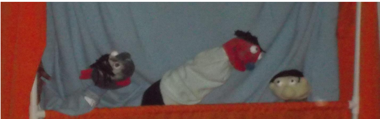
Foto 3: Socialización con títeres (tomada por Edinson Camayo, marzo de 2018)

Cuando se hicieron los títeres, la mayoría decidió pintarlos, por lo cual muchos de ellos y ellas buscaron entre sus pinturas lo que consideraban el color piel : un tono rosa oscuro o claro como se ve en la Foto 2. A raíz de esto, hicimos una reflexión de si realmente existía un color piel o, por el contrario, la gente tiene muchas variedades de tonalidad de piel; de esta manera, los títeres terminaron siendo de muchos colores.(foto 3)