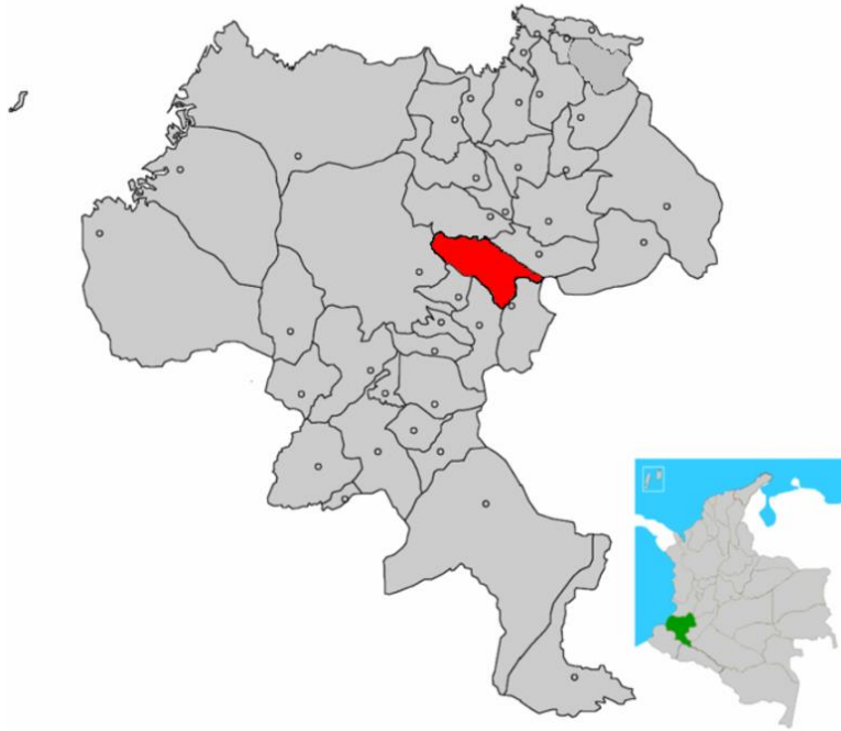
Mapa 1: Localización municipio de Popayán. ( Consejo municipal de Popayán. , pág. 22)

Ciudeblo es un concepto acuñado por una banda payanesa de género fusión llamada Los Pangurbes y el Ciudeblo 1 , en el que se combinan las palabras pueblo y ciudad. Frente a esto los urbanos solemos pensar que son dos realidades totalmente diferentes, pero esta palabra refleja esa integración, para muchos imperceptible, de los entornos rurales en la ciudad, resultado de