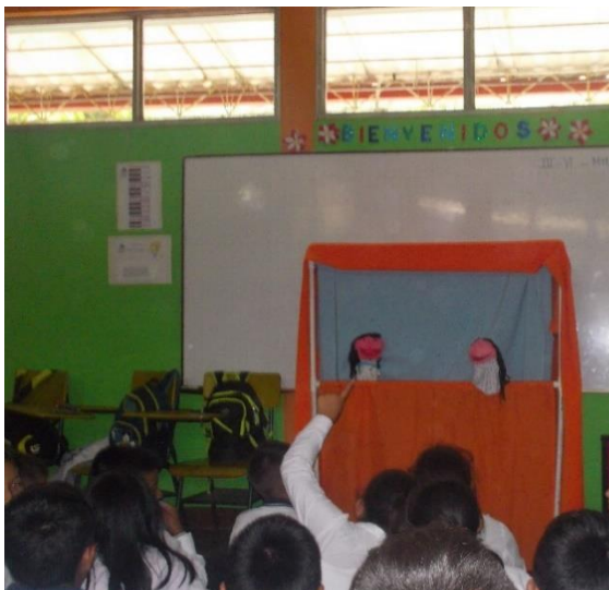
Foto 2: Socialización con títeres (tomada por Edinson Camayo, marzo de 2018)

Hasta ahora esta es mi historia, aunque mi papá tenga otra mujer yo lo sigo queriendo y aunque el haiga pasado dificultades por mi y mi hermana con mis abuelos todo se soluciono y ahora yo estoy feliz.