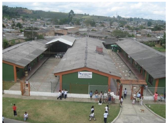
Foto 1: Institución Educativa Alférez Real.

En consecuencia, a la realidad anteriormente descrita hice mi PPE en una de las escuelas de este contexto la Institución Educativa Alférez Real que está ubicada en la carrera 7AE N.13-03, al oriente del ciudeblo, en el barrio El Lago. Según una encuesta realizada por la misma institución, a la comunidad educativa en el año 2016, el barrio se caracteriza porque sus habitantes se desempeñan, en su gran