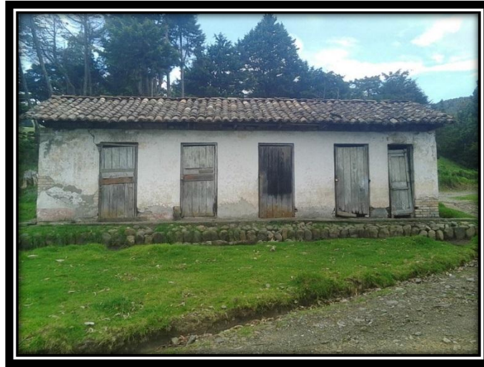
Figura 8. Frente del Puesto de Monta creado en 1975 Paispamba.

Fuente. Propia de la investigación, 06/05/2015.