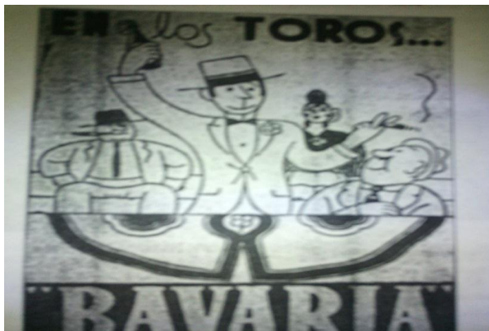
Figura 4. Publicidad de Bavaria patrocinando la fiesta Taurina