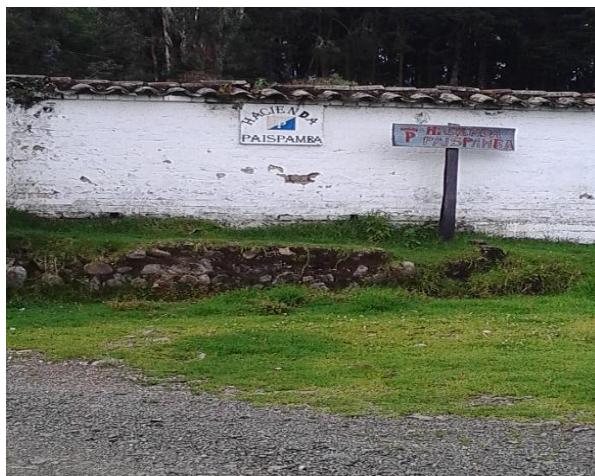
Figura 5. Hacienda Toros de Lidia Paispamba