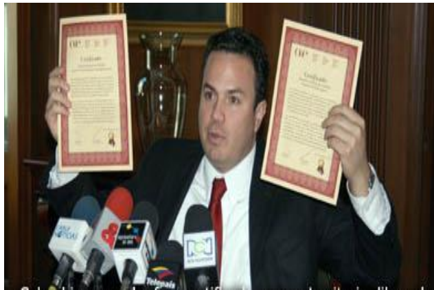
Figura 3. Certificado de control contra la fiebre aftosa