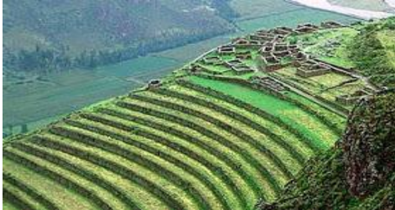
Figura 1. Nepohualtztzin el secreto de los Andes