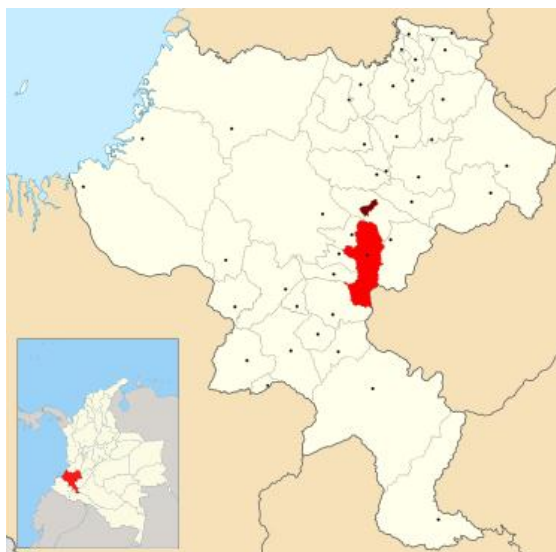
Figura 6. Mapa del municipio de Sotar, Cauca (Colombia)