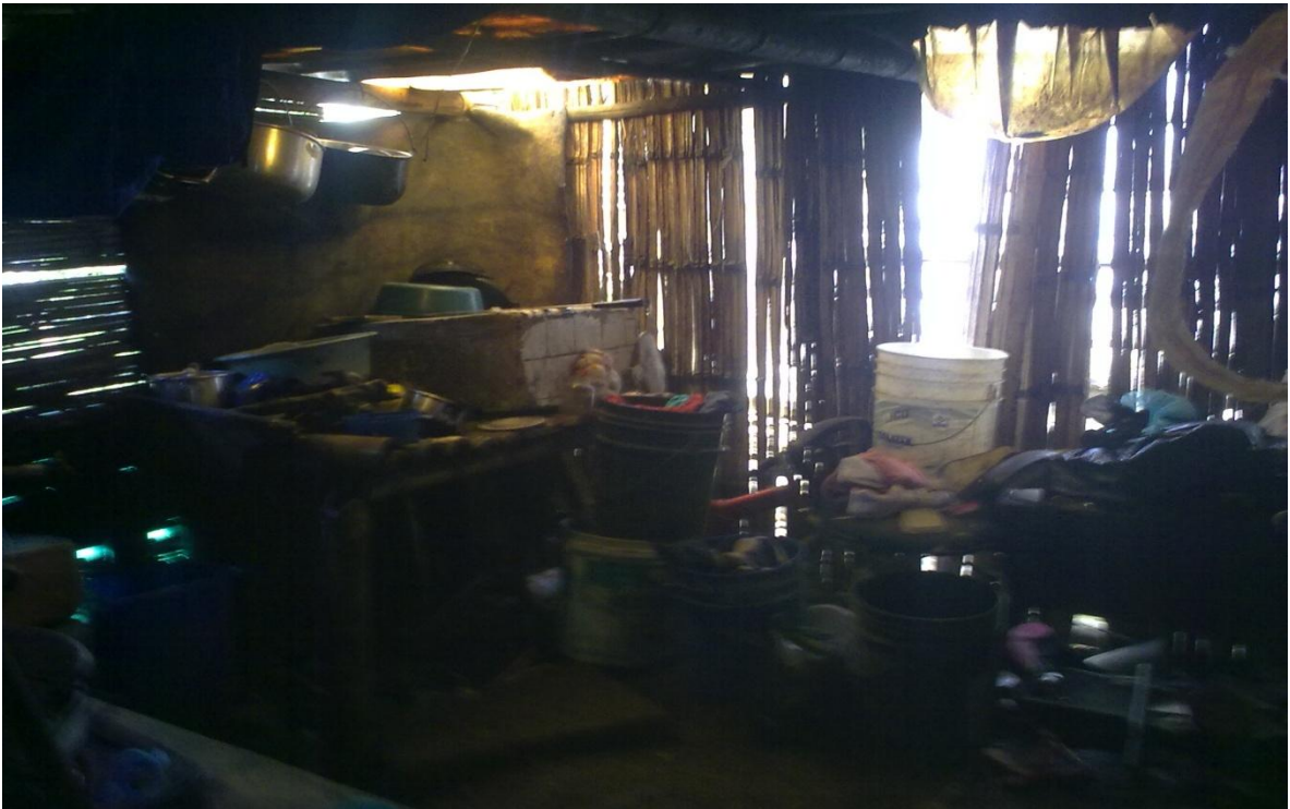
FIGURA N. 5 condiciones de los servicios de lavadero y baño