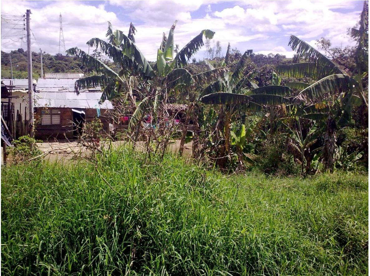
FIGURA N 7. Vivienda de la población desplazada en zona rivereña de la Quebrada Pubús.

La población desplazada en la ciudad de Popayán se caracteriza en su mayoría por ubicarse en zonas rivereñas, como es el caso de la Quebrada Pubús, que cada vez que crece inunda los ranchos y los pocos enseres que tiene la población afectada y además pone en riesgo la salud de la población ya que se proliferan los moscos y las epidemias.