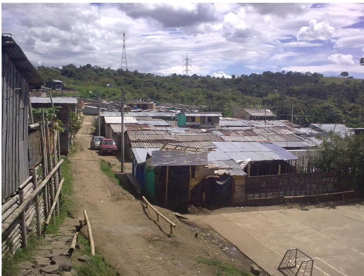
FIGURA N3 Asentamiento Tequendama

La vivienda de la población desplazada que se encuentra en la ciudad de Popayán, se caracteriza por tener viviendas construidas en tabla-guadua y materiales que no son adecuados para una vivienda, las viviendas se caracterizan por tener piso en tierra y con diseños totalmente improvisados. La vivienda que utiliza la población desplazada, se identifica por no contar con los espacios mínimos de una vivienda digna, ya que en la mayoría de los casos las viviendas no cuentan con espacio para la sala, piezas y el servicio de baño, porque hay algunas que cuentan con baños fuera de ellas.