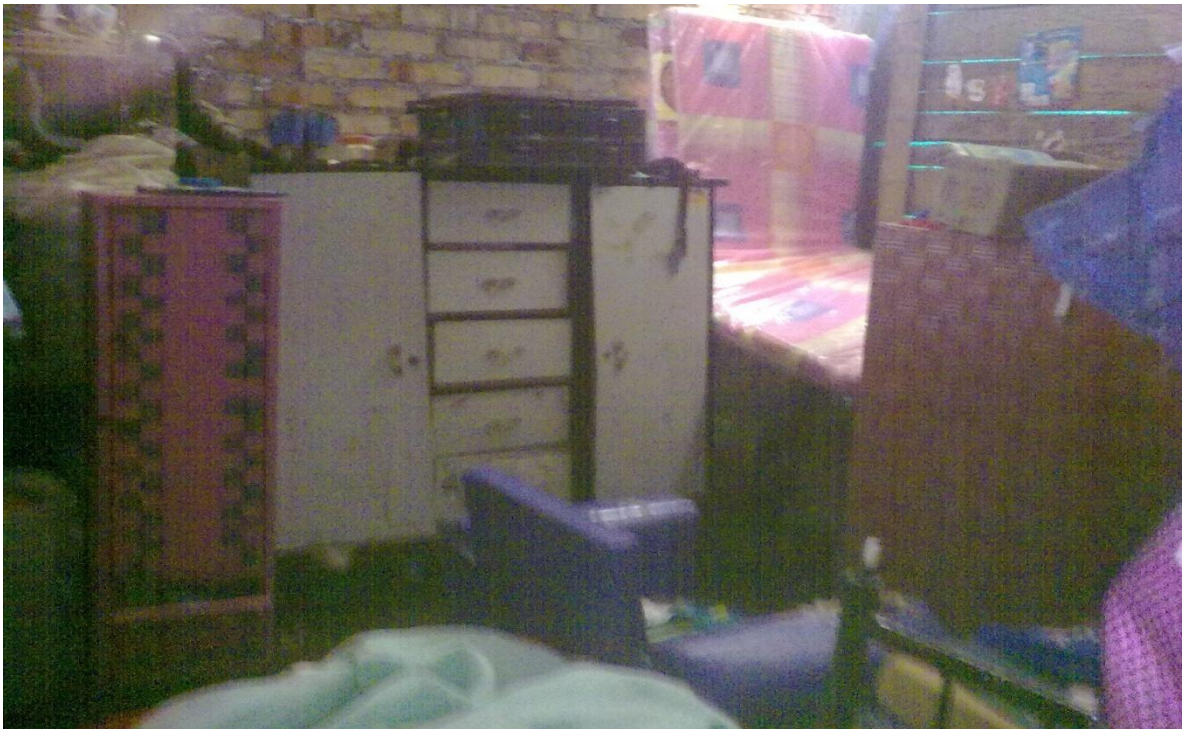
FIGURA N 6. En esta pieza vive un núcleo familiar de cuatro personas y en la vivienda vive más de un grupo familiar.

La vivienda de la población desplazada se caracteriza, por que viven en la mayoría de los casos más de un núcleo familiar, en algunas casos llegan a vivir hasta 5 familias en una vivienda, que en muchos casos no cuentan con los servicios básico, como agua, energía, y alcantarillado, debido a que la población desplazada, no logra cancelar las obligaciones adquiridas con las entidades prestadoras de servicio, lo que contrae el riesgo de epidemias en los desplazados y la población en general, debido al tratamiento inadecuado que reciben los desechos sólido y líquidos y además por el agua sin tratamiento que consumen en muchos casos.