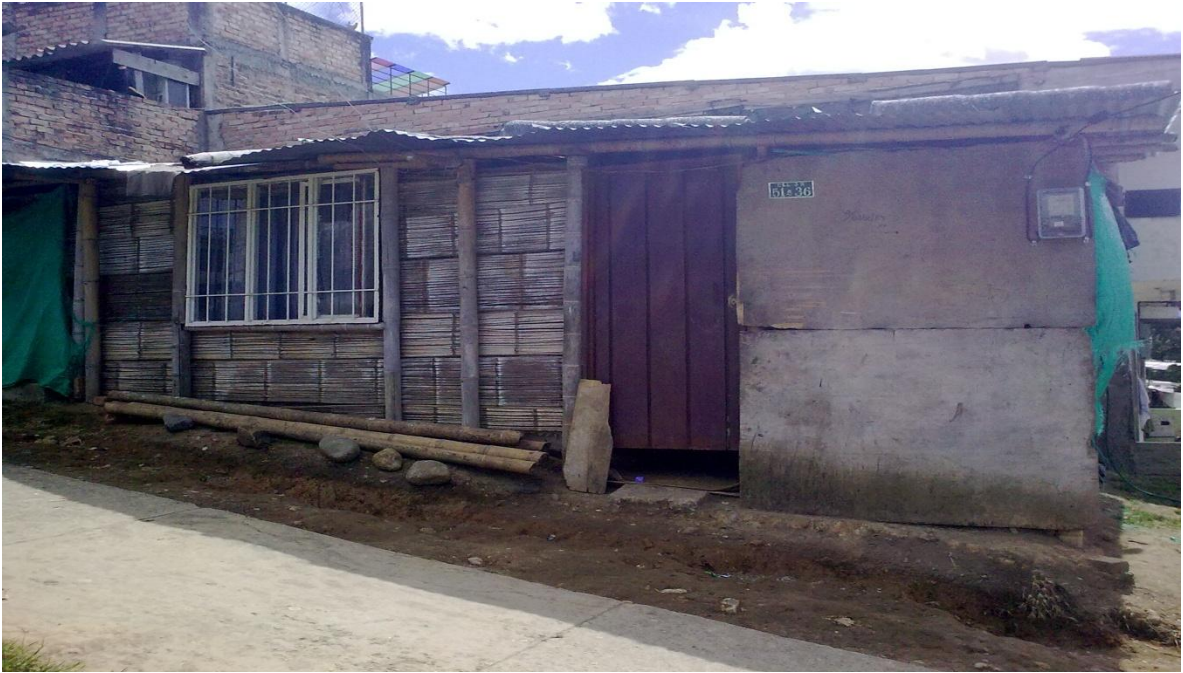
FIGURA N.4 vivienda construida en guadua