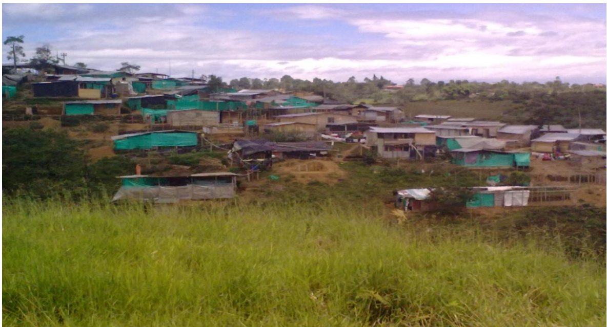
FIGURA N1 Asociación que se ubica en la vereda Cajeté

En la ciudad de Popayán, se encuentran 13 asociaciones de población desplazada, dispersas en toda la ciudad y el departamento, la asociación más antigua se encuentra legalmente constituida desde el año 2000, se llama Nueva Vida en el Cauca, con un total 130 familias registradas y la ultima que se constituyo fue en el año 2010, que fue Afrovides, con 50 familias registradas, pero es importante destacar que en la vereda Cajete y la vereda la Rejoyá del municipio de Popayán, también se encuentran dos asociaciones de población desplazada, la de la vereda Cajeté, está en proceso de legalización y la de la vereda la Rejoyá, ya se encuentra legalmente constituida.