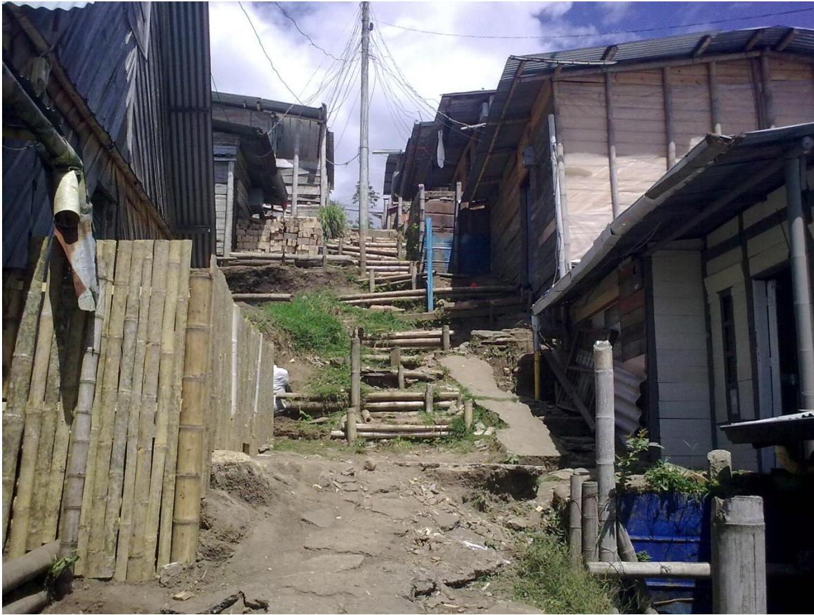
FIGURA N.2 Asentamiento Shama

actualmente se encuentra en zona de ladera y a uno 30 metros se encuentra la quebrada Pubús, y que no cuenta con predios legalmente constituidos.