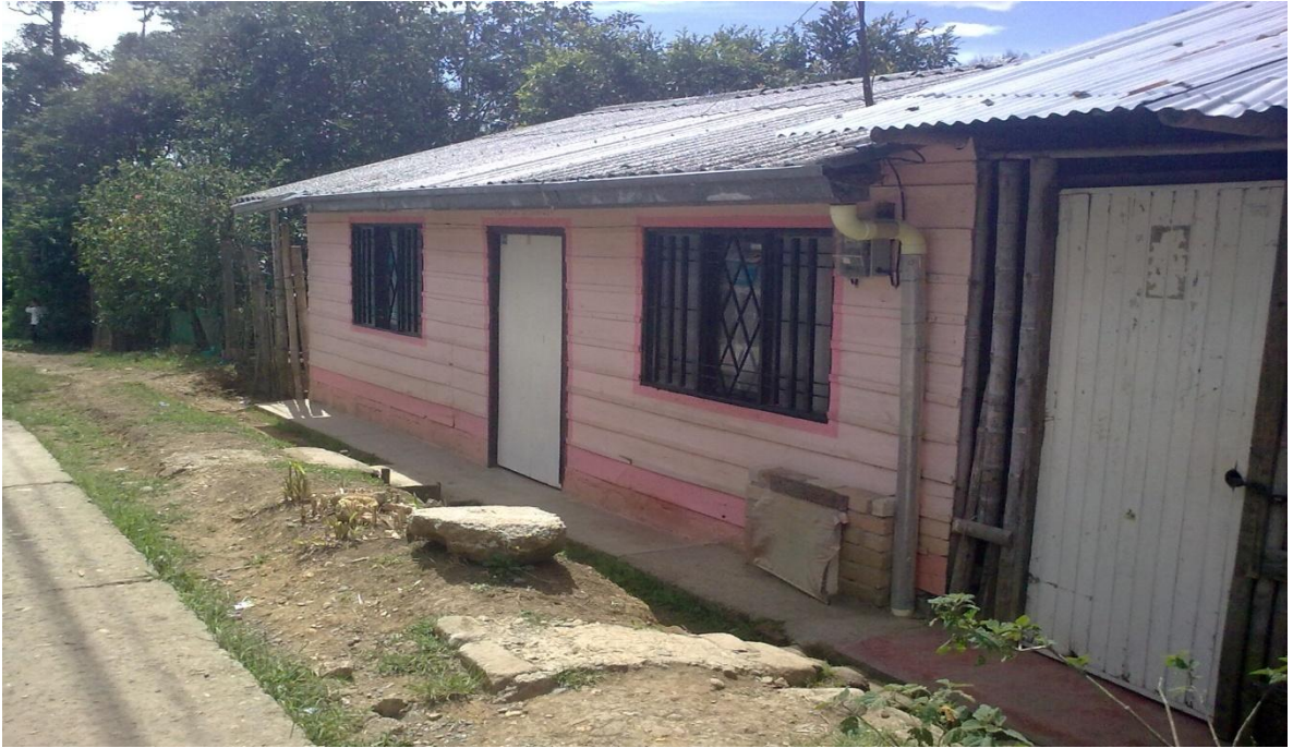
FIGURA 8. Vivienda de la población desplazada.