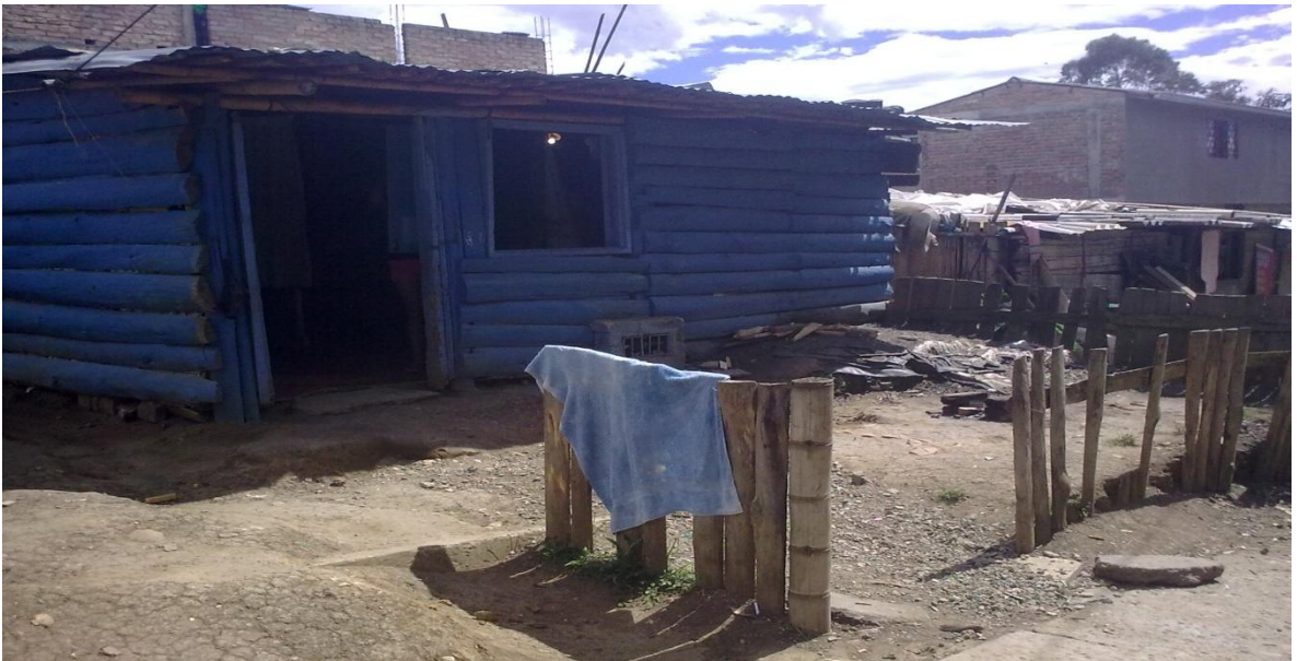
FIGURA 9. Vivienda de población desplazada.