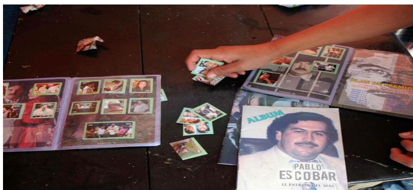
Imagen #10. Una muestra estampas coleccionables sobre la vida del difunto narcotraficante Colombiano Pablo Escobar “El Patrón Del Mal”, comprada en una tienda en el barrio Comuna Nororiental 1 en Medellín, Colombia, miércoles 8 de agosto de 2012. 53

personajes del mundo de Escobar donde se puede comprar por $200 pesos; mientras que cada sobre de cuatro láminas se adquiere a $100 pesos.