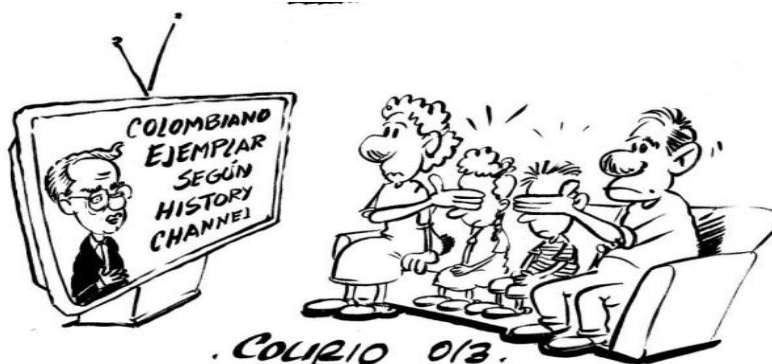
Imagen # 6. Julián Andrés Rivera

“De acuerdo con la teoría de la hegemonía ideológica de Gramsci los medios son instrumentos utilizados por las elites dirigentes para “perpetuar su poder, su riqueza y su estatus (popularizando) su propia filosofía, su propia cultura y su propia moral”. 27