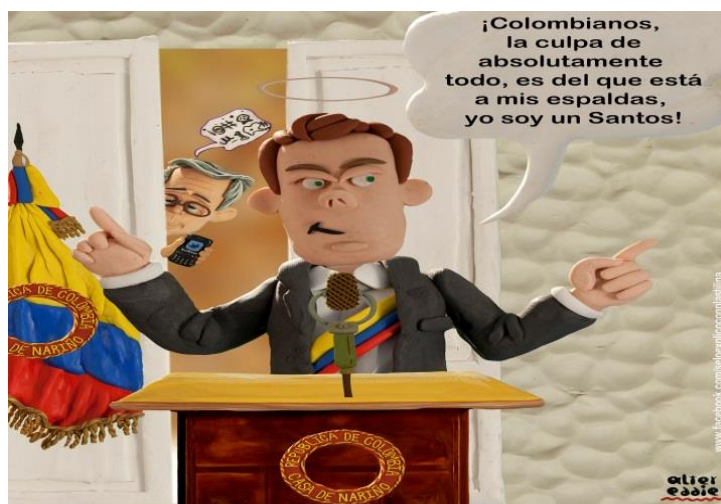
Imagen #20. ¿Se lo explicó con plastilina? “El Santos” Por: alter eddie

El anterior presidente confundía el ( desplazamiento forzado ) el cual se busca para favorecer a las multinacionales y narco-terratenientes con ( turismo interno ); “ mientras en Japón el Ministro de Agricultura se suicida para no enfrentar un lío de corrupción, en Colombia las tierras para los desplazados se entregan a paramilitares o narcotraficantes con la complicidad de funcionarios oficiales, sin que semejante aberración tenga las graves consecuencias que debería ”. 87 Los medios de comunicación no socializan adrede las secuelas del conflicto armado con sus consecuencias sociales; aparte de mantener una relativa discreción frente a lo que acontece en el país en donde generalmente son obligados a balbucear lo que dictaminen sus amos.