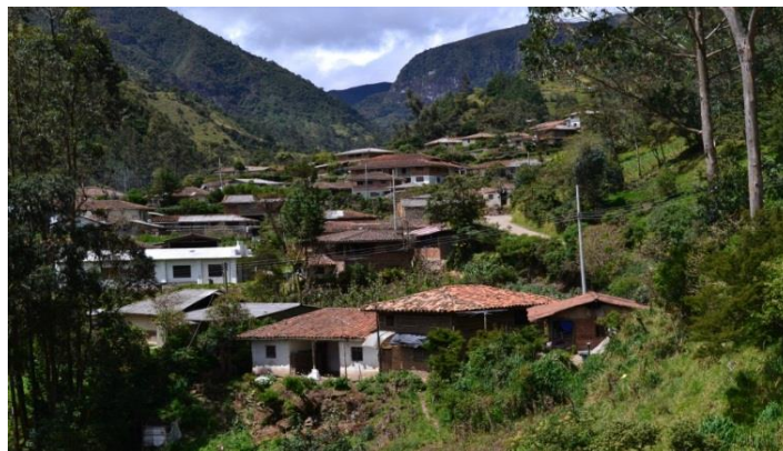
Imagen 3. Resguardo de “Wuampia”. Proyecto cinorden.

No existe un patrón específico y característico de asentamiento de los guámbianos, los propietarios de un pedazo de terreno construyen sus casas relativamente cercanas las unas de otras, pero a medida que se alejan del municipio de Silvia y se internan páramo arriba; éstas se van dispersando a lo largo de los caminos y las brechas que recorren el territorio del Resguardo. Las antiguas chozas rectangulares de bahareque con techo de paja con la pequeña habitación circular para las mujeres menstruantes que caracterizaron a la vivienda guambiana; han ido desapareciendo con el transcurrir del tiempo a tal punto de que la estructura de las viviendas ahora es muy homogénea en donde el estilo colonial en forma de L o U se han impuesto; el bloque de adobe con sus respectivas tejas son los materiales más comunes; ocasionalmente se pueden encontrar pisos de ladrillo, baldosín, cemento y de madera aunque generalmente los pisos son de tierra pisada.