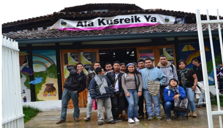
Imagen #1. Proyecto “cinorden” N° 036 en la universidad Misak del resguardo de Guambia. Municipio de Silvia - Agosto 24 del 2013.

Está investigación ha sido parte de la experiencia académica compartida con la universidad Misak y la comunidad Misak del resguardo de guambia; 4 mediante los talleres de formación en público audiovisual y televidencia crítica los cuales se incluyen dentro del proyecto “ Cinorden ”; talleres que han sido realizados por la división de medios y recursos bibliográficos de la Universidad del Cauca donde se midió el impacto de la televisión colombiana en los televidentes de varios escenarios del departamento del Cauca (ver anexo #1 y el anexo #2). “ En la iniciativa se trabaja con estudiantes de colegios de Popayán e integrantes del resguardo indígena de Guambía ”; 5 los talleres realizados con los integrantes del resguardo de guambia aportaron fundamentalmente en la formación de público audiovisual y televidencia crítica.