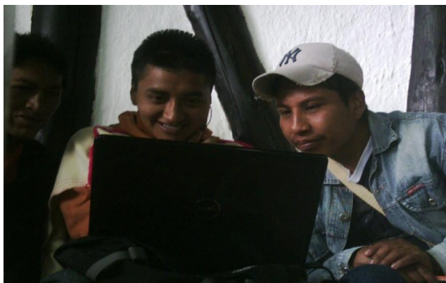
Imagen 5. Resguardo de wuampia. Tomada el 3 de octubre del 2013 en la universidad Misak. Proyecto Cinorden