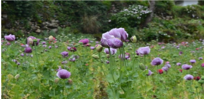
Imagen #17. Resguardo de Wuampia Julio 13 del 2013

Destacar que la comunidad Misak se libró de la política antidrogas; es pertinente a la hora de entender por qué las narcotelenovelas fueron vistas más como programas que contenían hechos históricos de este país que modelos a seguir o apología al crimen. La narco-cultura impuesta por el narcotráfico se gesta gracias a las exorbitantes ganancias que este deja; típicas formas de vestir o alcoholizarse se dictaminan por la herencia cultural que existe en donde el entorno termina siendo determinante a la hora de generar representaciones sociales en los individuos que vivan o convivan con el fenómeno del narcotráfico; es de vital importancia para la comunidad Misak comprender los impactos que ha causado el narcotráfico al interior de nuestra sociedad y la propia.