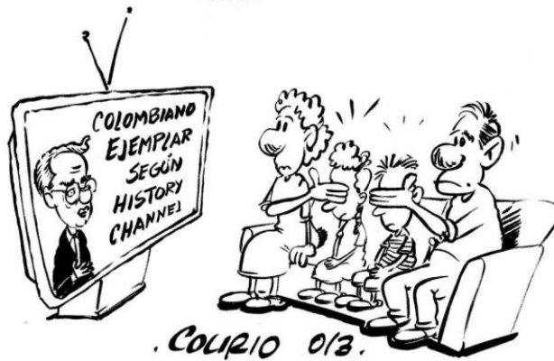
Julián Andrés Rivera

“De acuerdo con la teoría de la hegemonía ideológica de Gramsci los medios son instrumentos utilizados por las elites dirigentes para “perpetuar su poder, su riqueza y su estatus (popularizando) su propia filosofía, su propia cultura y su propia moral”. 1