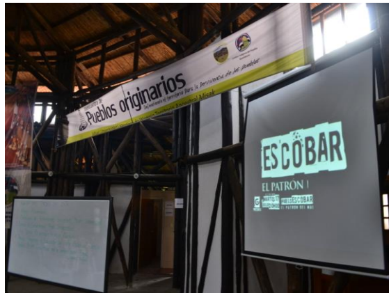
Imagen #16. Proyecto “cinorden”. Universidad Misak resguardo de guambia en el Municipio de Silvia. Agosto 15 del 2013

Llama la atención como en una de las narcotelenovelas realizadas desde la perspectiva de las víctimas como lo fue “ Escobar el patrón del mal ”, 75 se logra generar en los televidentes una sensibilidad frente a estos temas considerados tabú; dejando como reflexión un sombrío pasado de nuestra nación que contrasta con el presente por ser este más impactante que lo que se presenta a los televidentes.