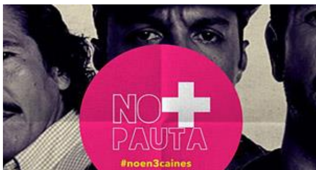
Imagen #19. "Los Tres Caínes"