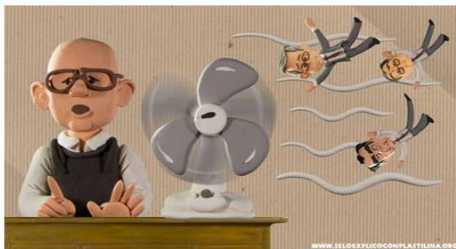
Imagen #9 ¿se lo explicó con plastilina? “EL VENTILADOR” Por: alter eddie

país en el cual el narcotráfico ha permeado las esferas sociales, políticas, culturales y económicas. “Hablar de la baretocracia y pericocracia significa tratar de dilucidar las dimensiones del cambio social, con especial referencia a la múltiple aceptación de la política asociada al fenómeno de la droga. Significa, en otras palabras, tratar de comprender tanto la forma de hacer política por parte de los involucrados en la producción y distribución de marihuana y cocaína, como de entender las respuestas que amplios sectores de la sociedad han dado, en particular las fuerzas encargadas de mantener el orden.” 52