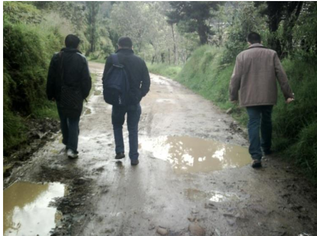
Imagen 4. wuampia. Tomada el 19 de noviembre del 2012 por Edgar David Nieto.

oral, se ha requerido de la etnografía organizada en torno a la observación participante , el uso de informantes y las entrevistas en profundidad teniendo en cuenta la técnica investigativa de los “ recorridos vitales ”, 11