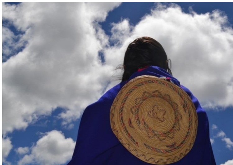
Imagen # 2 Resguardo de Wuampia 28 de agosto del 2011. Proyecto Cinorden

[...] con los corazones paralizados por la incomprensión, nos devolvimos con nuestros muertos [...] porque no se puede hablar con gentes que hacen cosas así [...]. 6