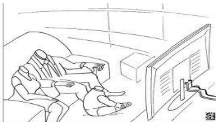
Imagen #7. Los cartones de Garzón. El Espectador

al desconocer esa premisa por incomoda que parezca; se estaría desconociendo social y política las personas que gobiernan y legislan en este país.